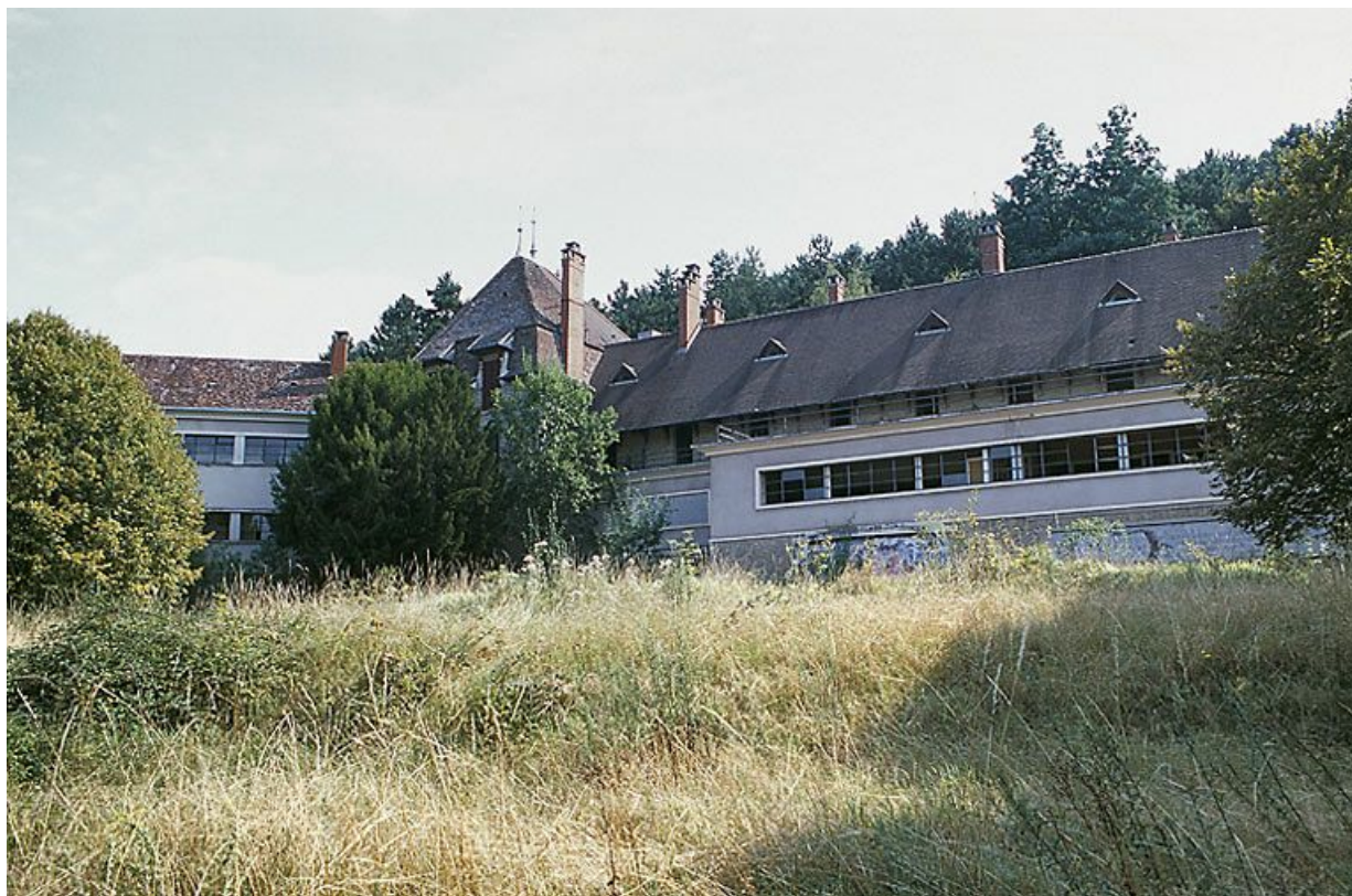
Bâtiment central, corps annexe adossé à la façade nord.

21, Velars-sur-Ouche chemin rural n° 8, lieudit : rente des Bons Pasteurs