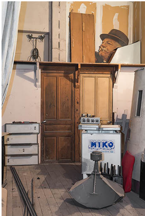
Salle 1 : anciennes loges d'acteur, à l'arrière de l'écran. 21, Dijon, 8 place Darcy