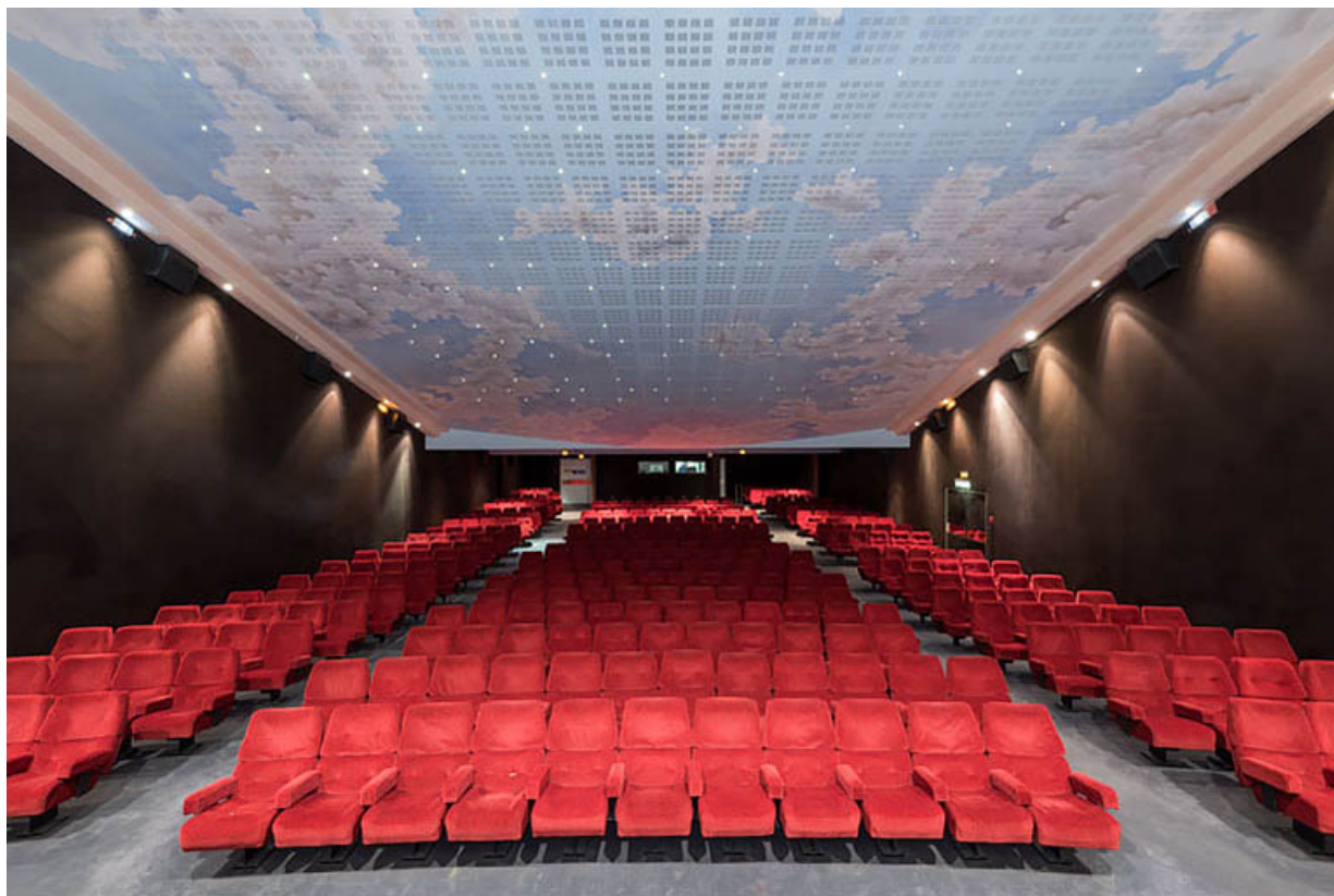
Salle 1 : vue depuis l'écran.