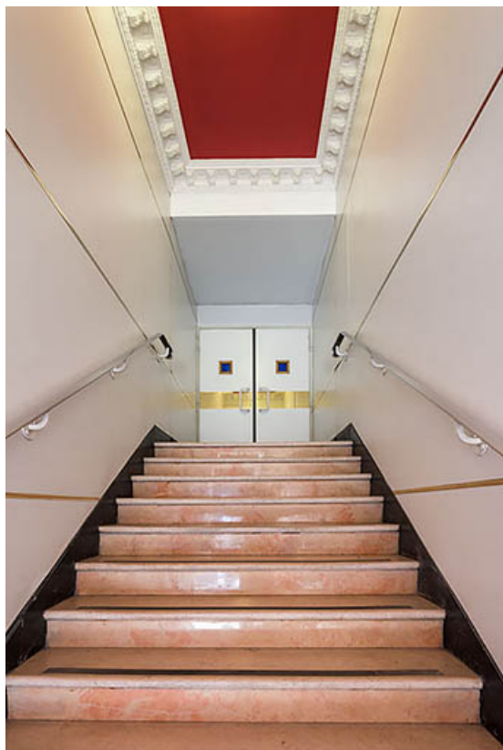
Escalier desservant la salle 2. Le plafond conserve un vestige du décor d'origine.