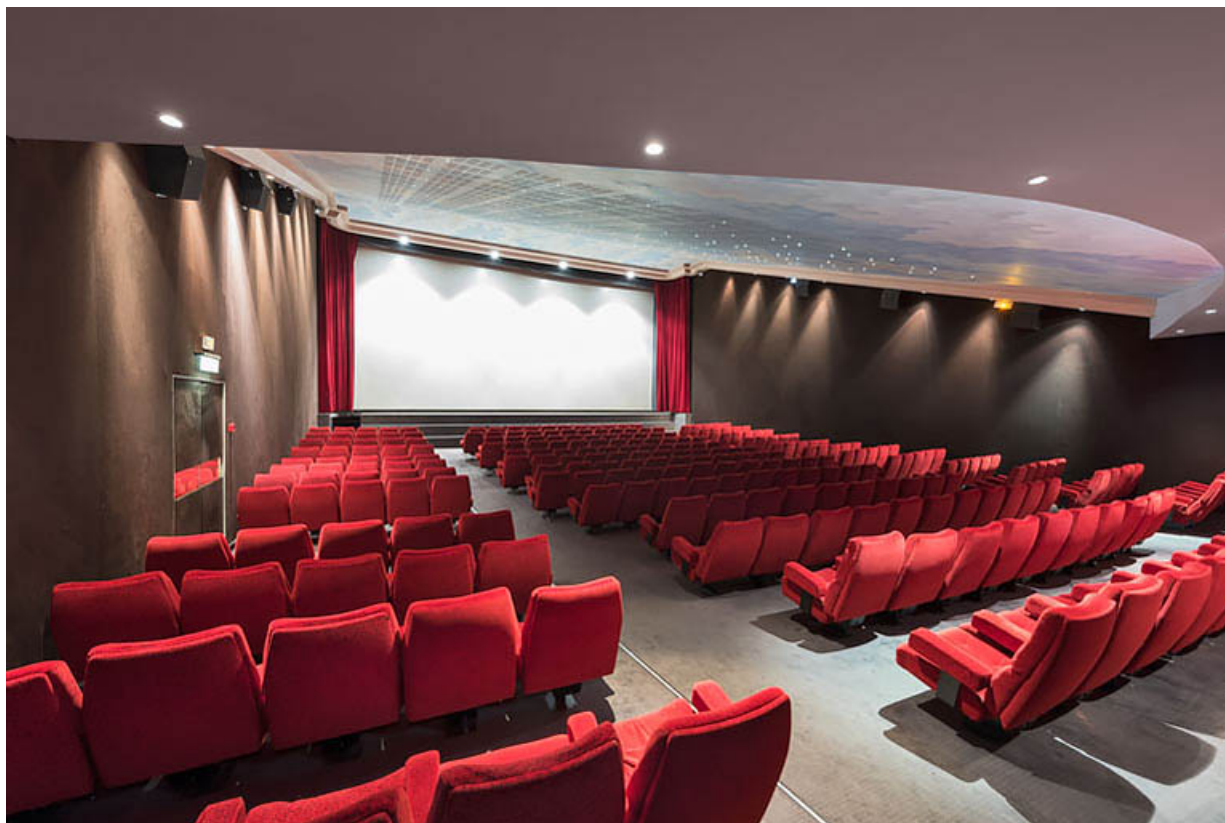
Salle 1 : vue vers l'écran.