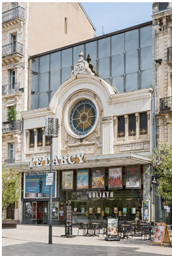
Façade antérieure, de trois quarts droite. 21, Dijon