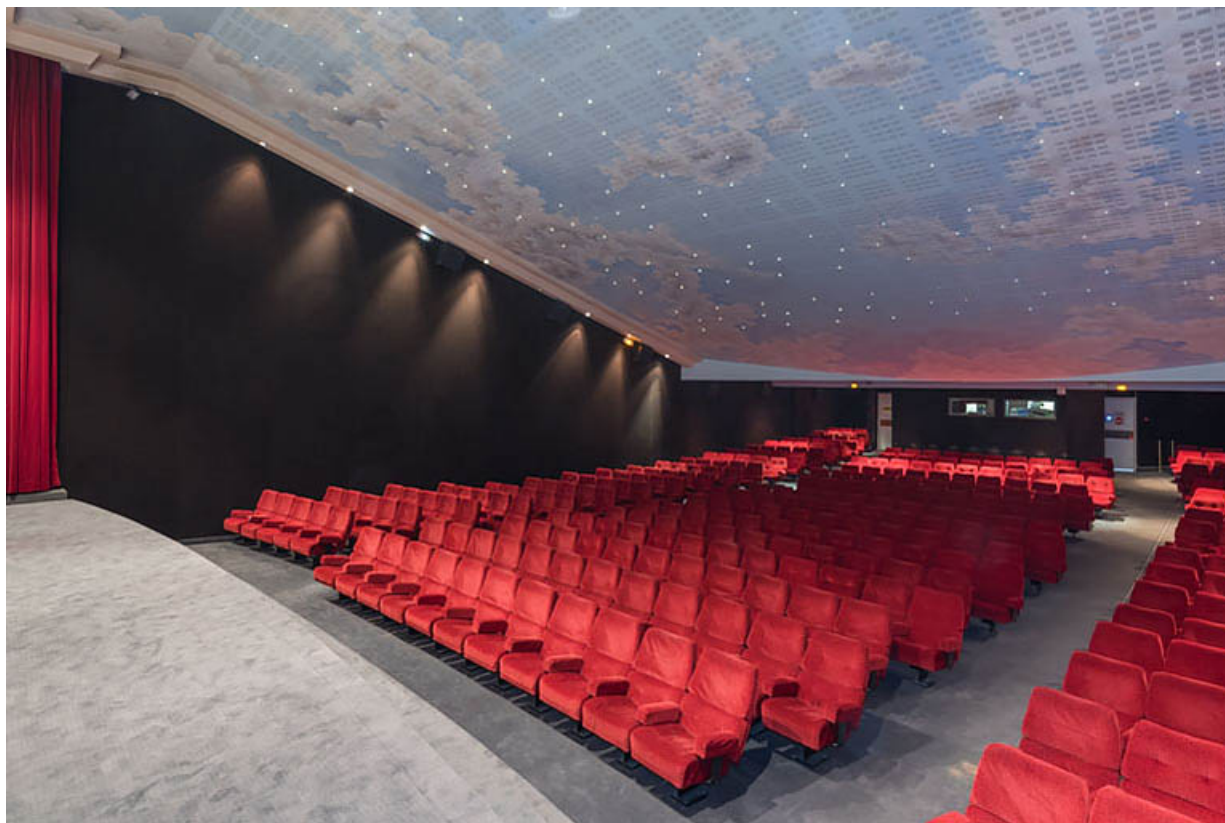
Salle 1 : vue depuis l'écran, de trois quarts droite.