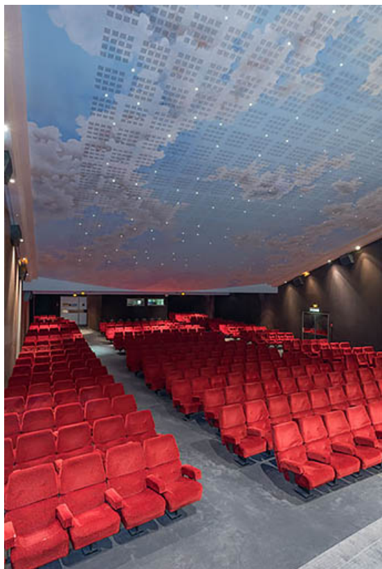
Salle 1 : vue depuis l'écran, montrant le décor du plafond dû à Jean-Claude Misset. 21, Dijon, 8 place Darcy