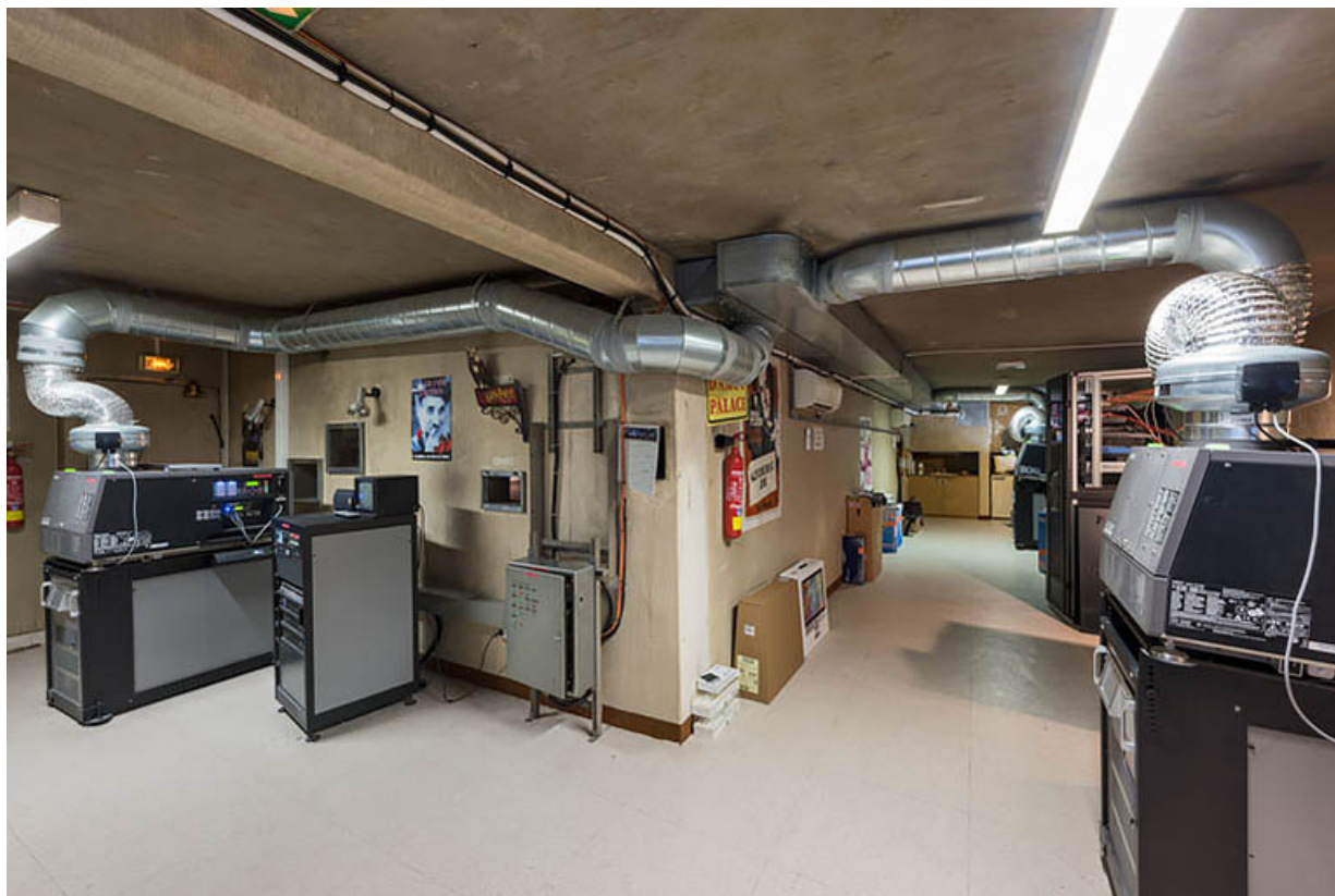
Cabine centrale, avec ses projecteurs numériques desservant les salles 3 à 5. 21, Dijon, 8 place Darcy