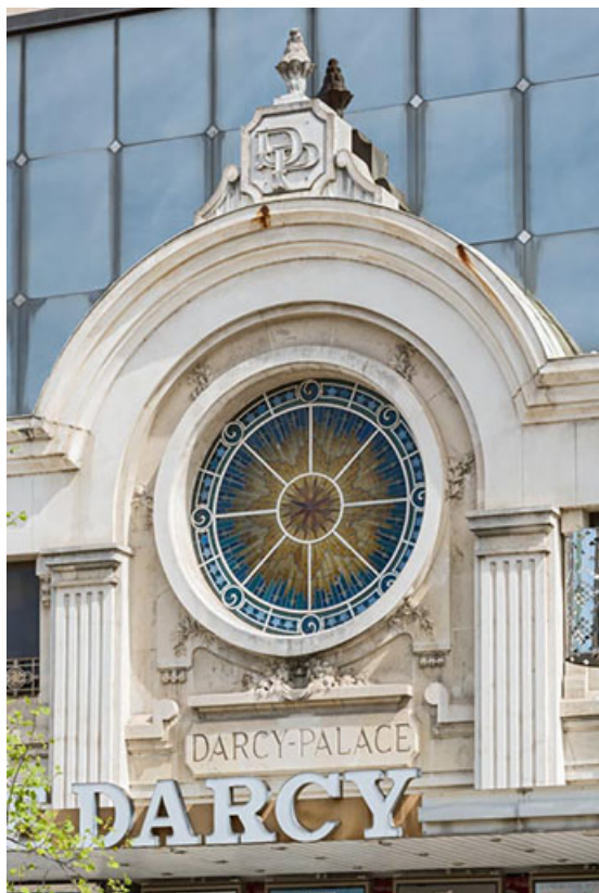
Façade antérieure, étage : partie centrale avec l'oculus. 21, Dijon, 8 place Darcy