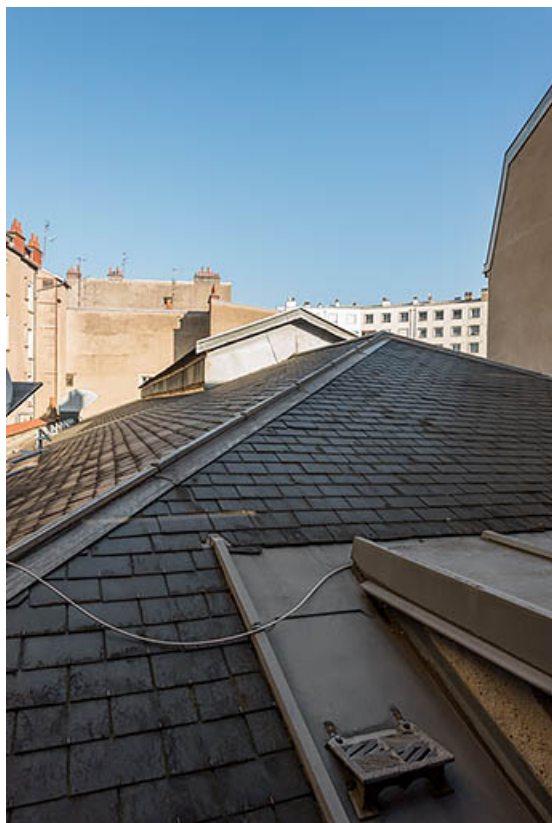
Le toit du cinéma, vu depuis la façade écran.