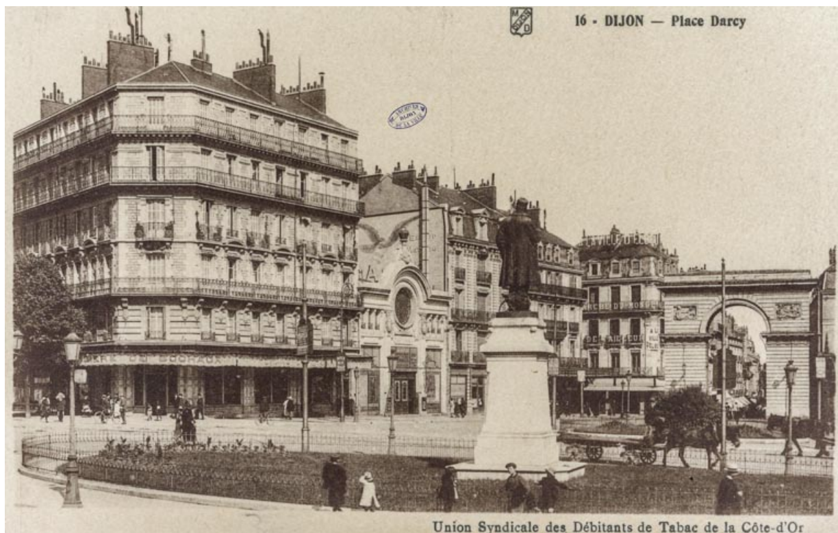
16 - Dijon - Place Darcy. S.d. [1re moitié 20e siècle, après 1916].