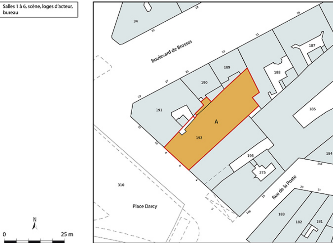
Plan-masse et de situation. Extrait du plan cadastral, 2021, section EW, 1/1 000 agrandi à 1/500. 21, Dijon, 8 place Darcy

A Salles 1 à 6, scène, loges d'acteur, bureau