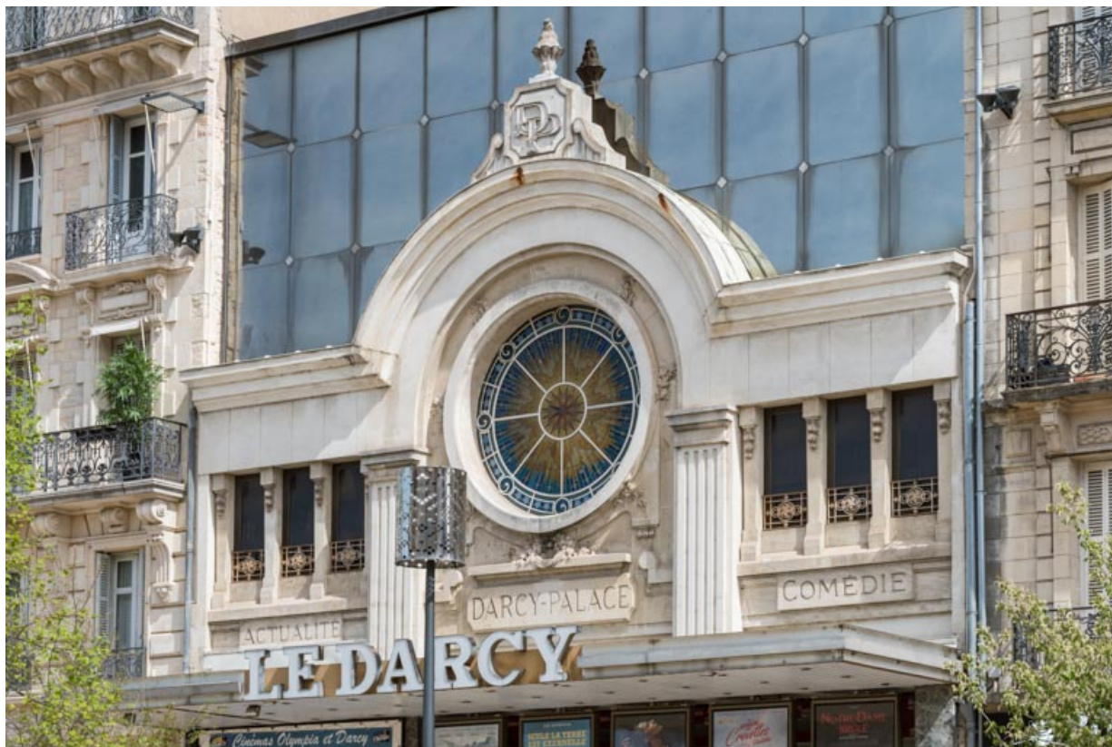
Façade antérieure : décor de l'étage et oculus, de trois quarts droite. 21, Dijon, 8 place Darcy