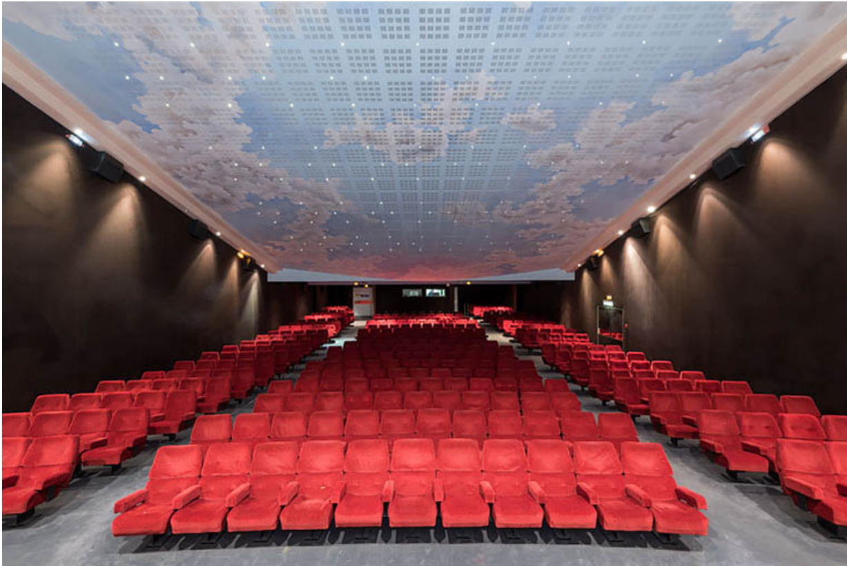
Salle 1 : vue depuis l'écran.