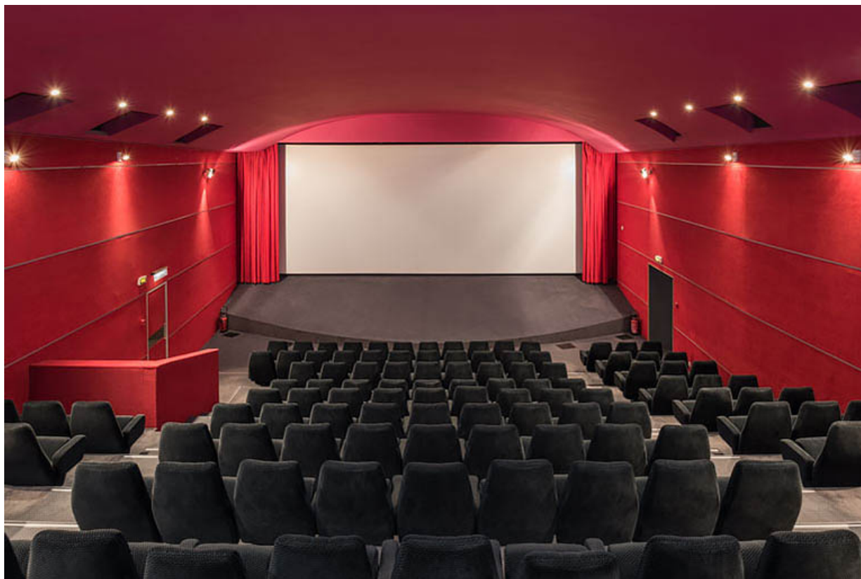
Salle 2 : vue vers l'écran.