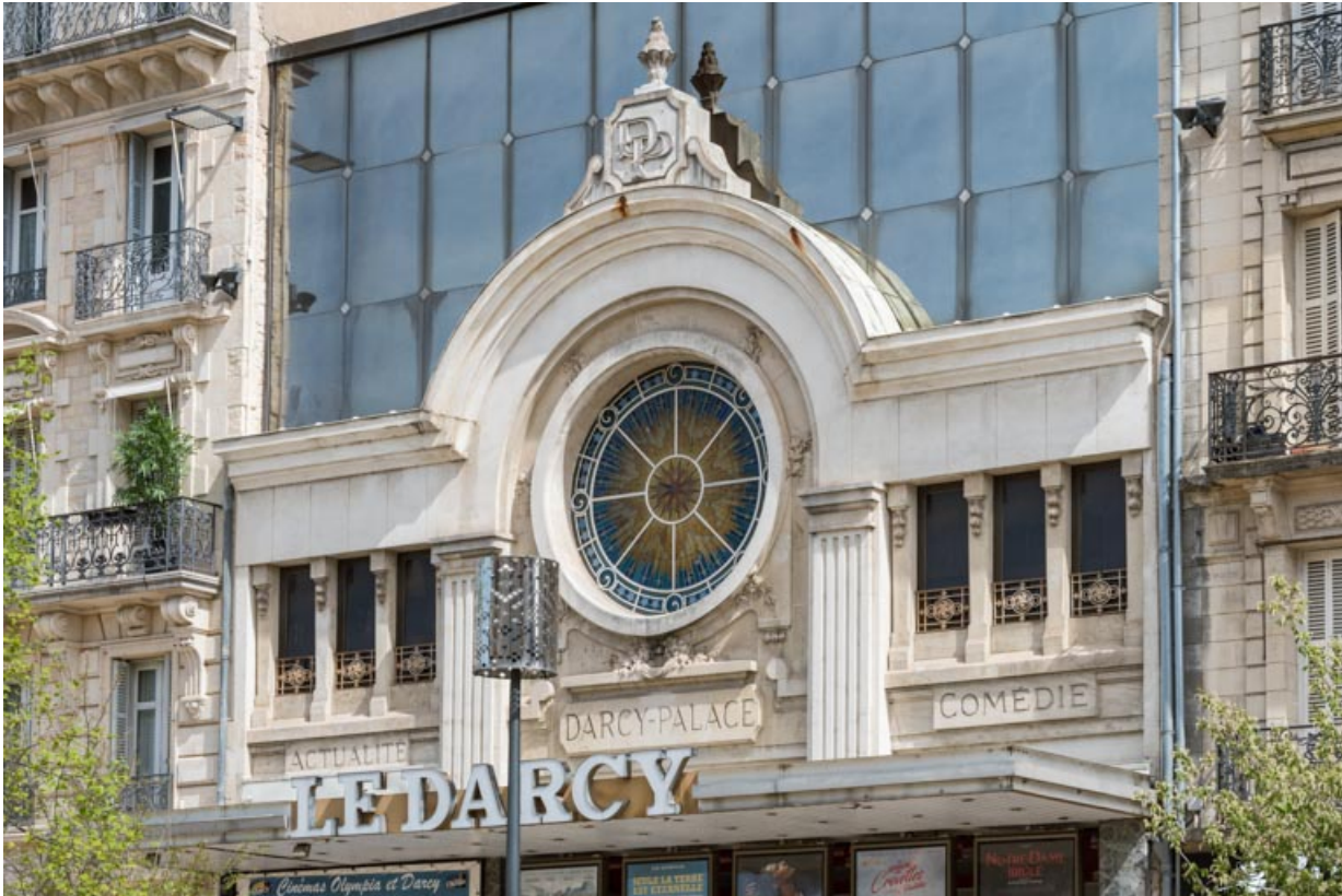
Façade antérieure : décor de l'étage et oculus, de trois quarts droite. 21, Dijon, 8 place Darcy