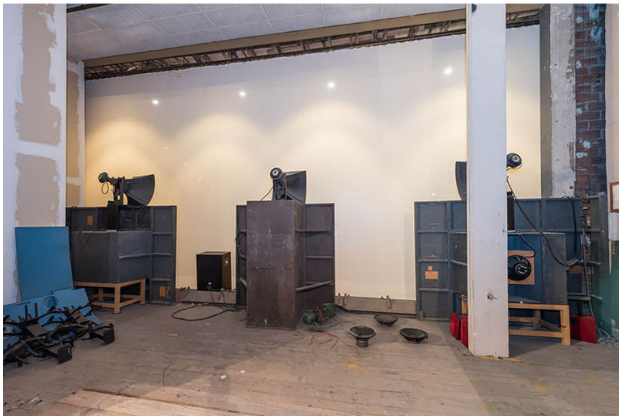
Salle 1 : installation de sonorisation sur la scène conservée à l'arrière de l'écran. 21, Dijon, 8 place Darcy