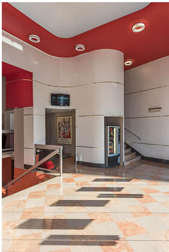
Vestibule. Les salles 3 à 6 (en sous-sol) sont desservies par l'escalier visible à gauche, la salle 2 par celui de droite. 21, Dijon, 8 place Darcy