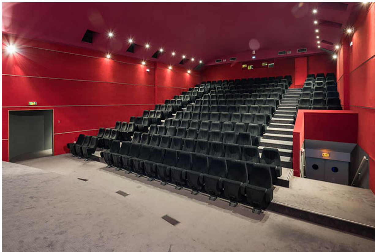
Salle 2 : vue depuis l'écran.