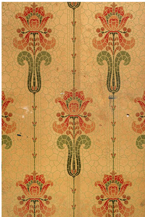
Salle 1, anciennes loges d'acteur : papier peint. 21, Dijon, 8 place Darcy