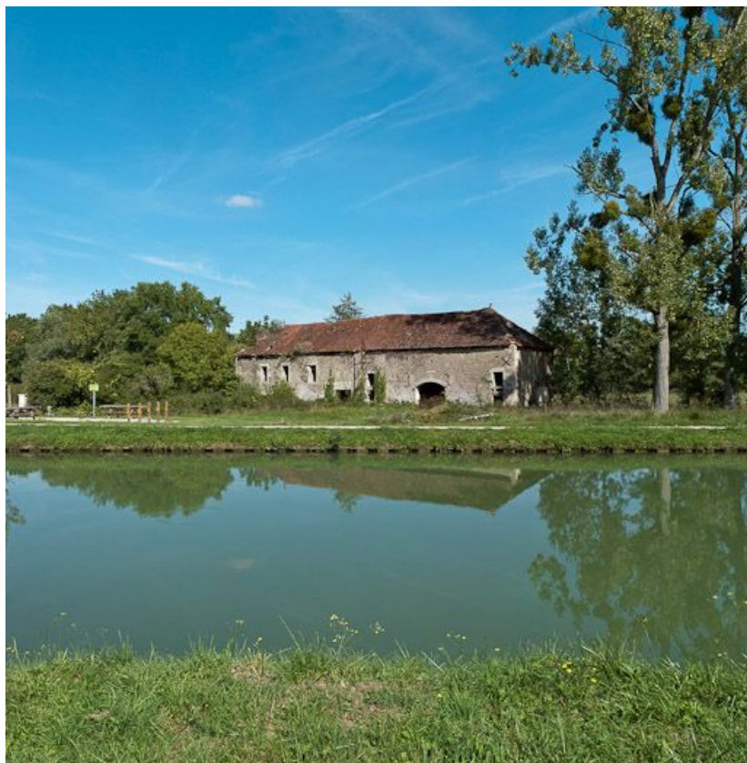
Vue du moulin situé en amont du pont.

21, Nogent-lès-Montbard, lieudit : bief 63 du versant Yonne