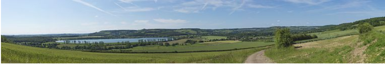
Panorama sur la vallée de Vandenesse-en-Auxois, où passe le canal de Bourgogne et où se trouve le réservoir de Panthier. 21, Vandenesse-en-Auxois, lieudit : Panthier

N° de l'illustration : 20122102800NUC4AQ