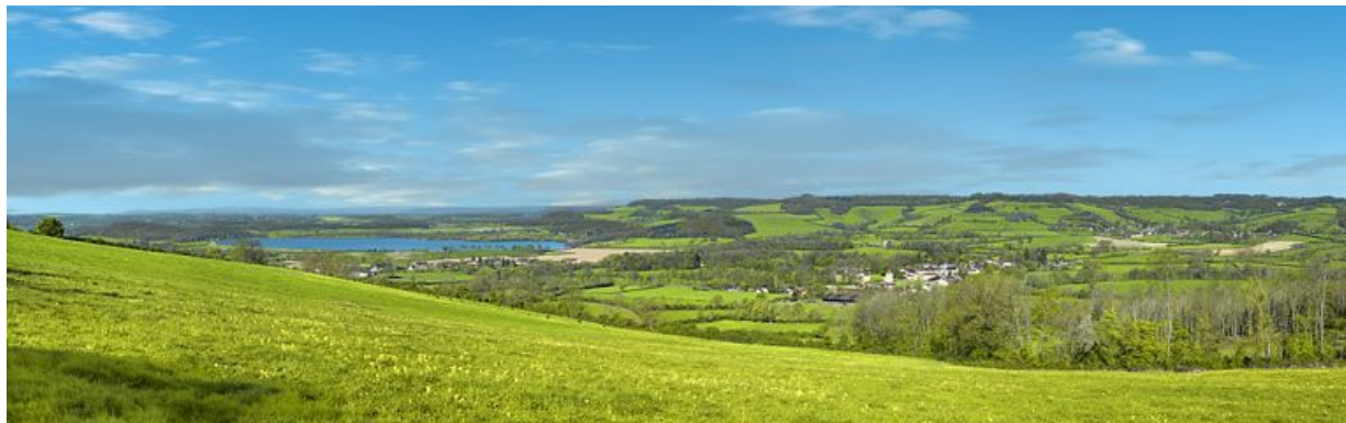
Panorama du réservoir de Panthier, à droite le village de Commarin avec son château.

21, Vandenesse-en-Auxois, lieudit : Panthier