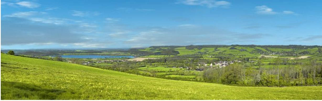
Panorama du réservoir de Panthier, à droite le village de Commarin avec son château.

21, Vandenesse-en-Auxois, lieudit : Panthier