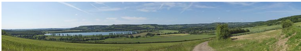
Panorama sur la vallée de Vandenesse-en-Auxois, où passe le canal de Bourgogne et où se trouve le réservoir de Panthier.

N° de l'illustration : 20122102800NUC4AQ