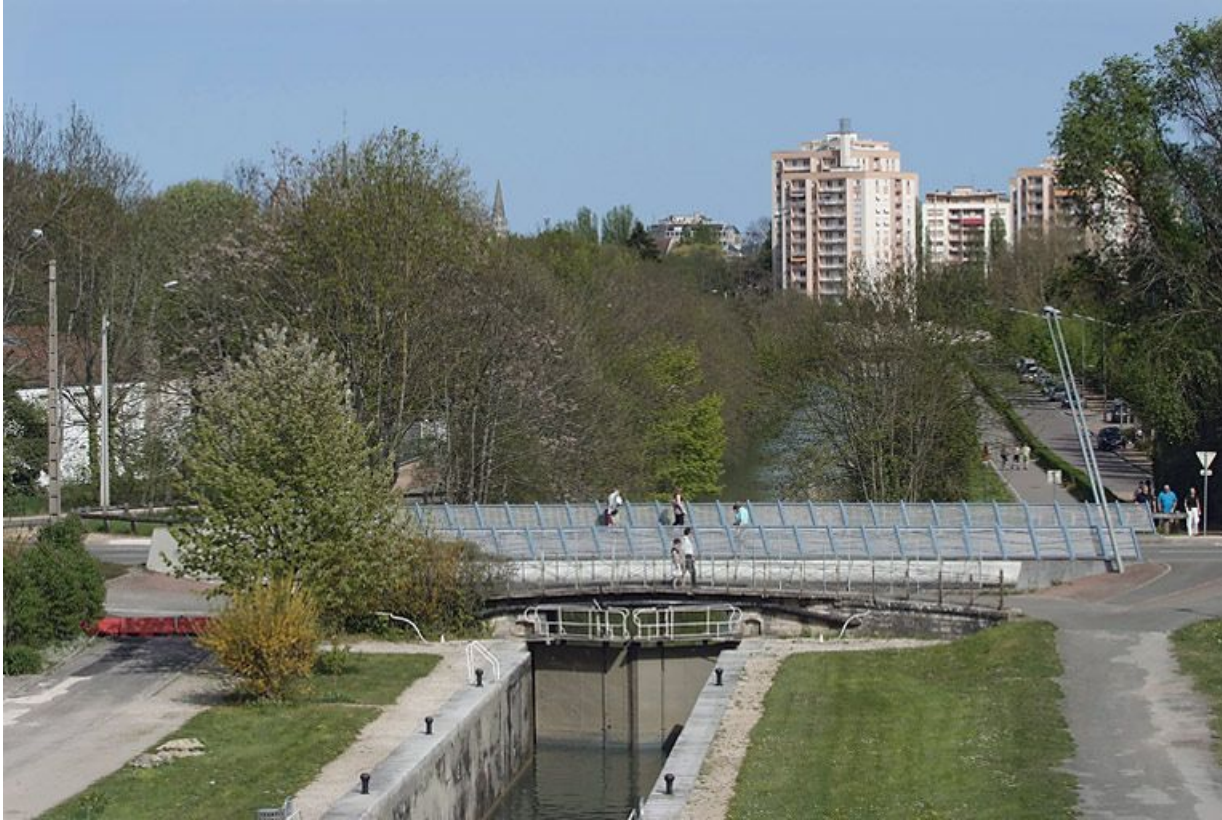
Sas de l'écluse 54, avec le pont ancien sur écluse doublé par le pont moderne.