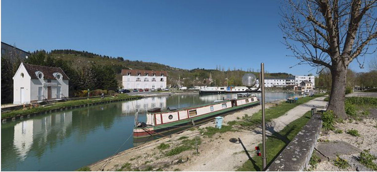
Le port, vu d'amont, petite construction moderne à gauche, puis gare ferroviaire transformée en immeuble à logements. Site d'écluse au fond. Au premier plan, un bateau anglais.

21, Plombières-lès-Dijon, lieudit : bief 50 du versant Saône