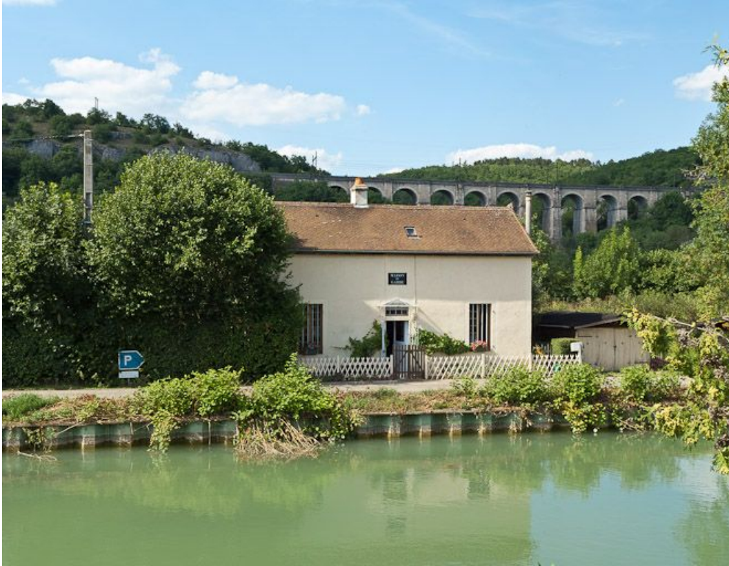
Vue de la maison depuis la rive droite du canal.

21, Velars-sur-Ouche, lieudit : bief 46 du versant Saône