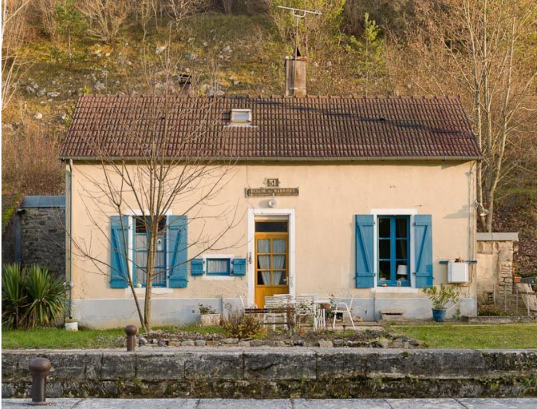
Vue de face de la maison éclusière.

21, Barbirey-sur-Ouche, lieudit : bief 31 du versant Saône