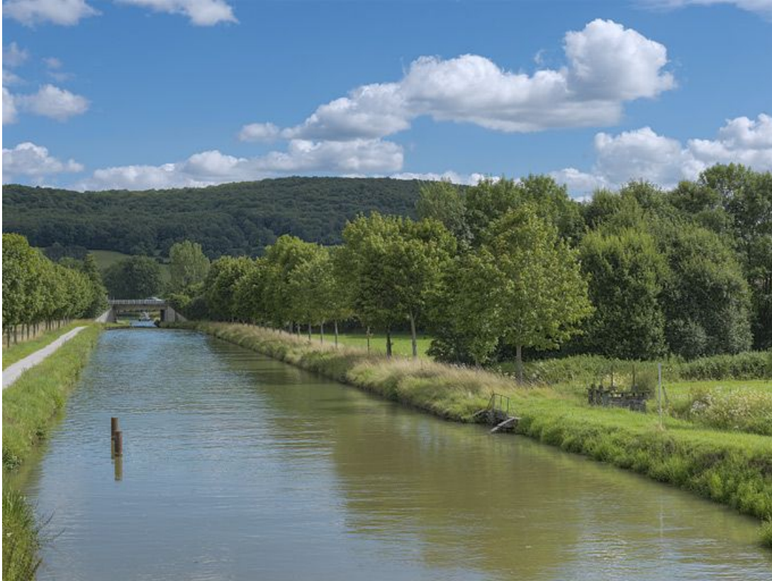
Réseau hydraulique autour de la rigole du Tillot avec pont autoroutier au fond.

21, Sainte-Sabine, lieudit : bief 13 du versant Saône