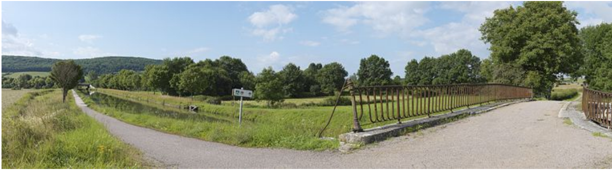
Réseau hydraulique autour de la rigole du Tillot avec pont autoroutier au fond. Pont routier sur écluse à droite.

21, Vandenesse-en-Auxois, lieudit : bief 12 du versant Saône