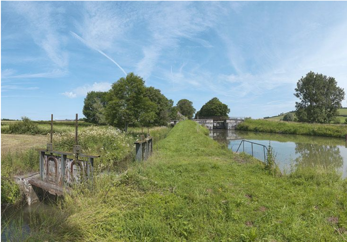
Réseau hydraulique autour de la rigole du Tillot avec arrivée d'eau dans le canal et vannes.

21, Sainte-Sabine, lieudit : bief 13 du versant Saône