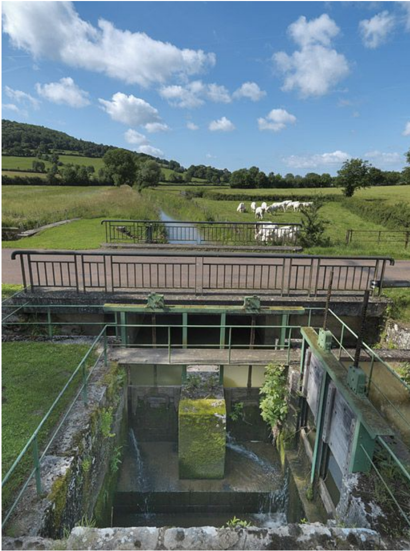
Point de rencontre de la rigole d'alimentation issue du réservoir du Tillot et du ruisseau de la Miotte, en amont du site d'écluse 13. 21, Sainte-Sabine, lieudit : bief 13 du versant Saône