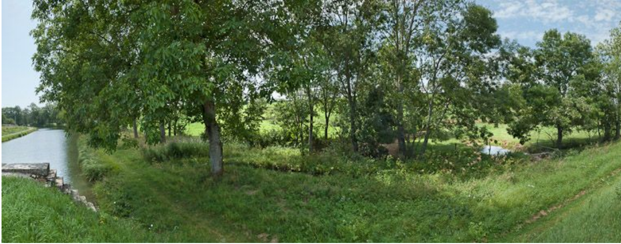
Vue de la rigole d'alimentation débouchant dans le canal.

21, Vandenesse-en-Auxois, lieudit : bief 06 du versant Saône