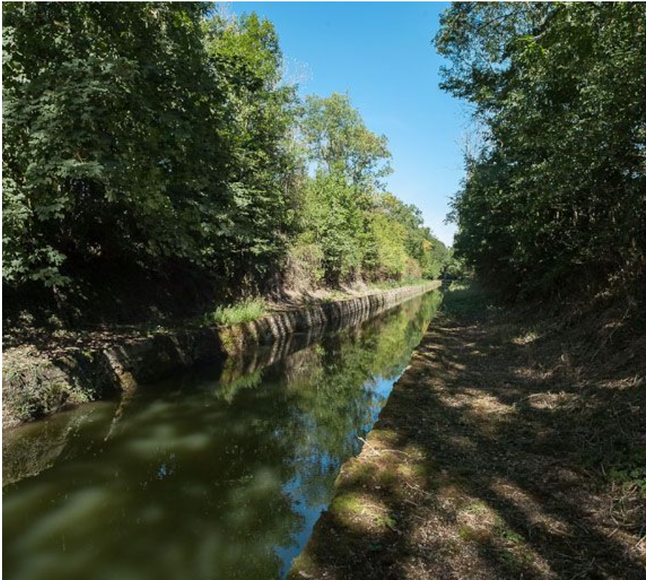
Vue d'ensemble de la tranchée.