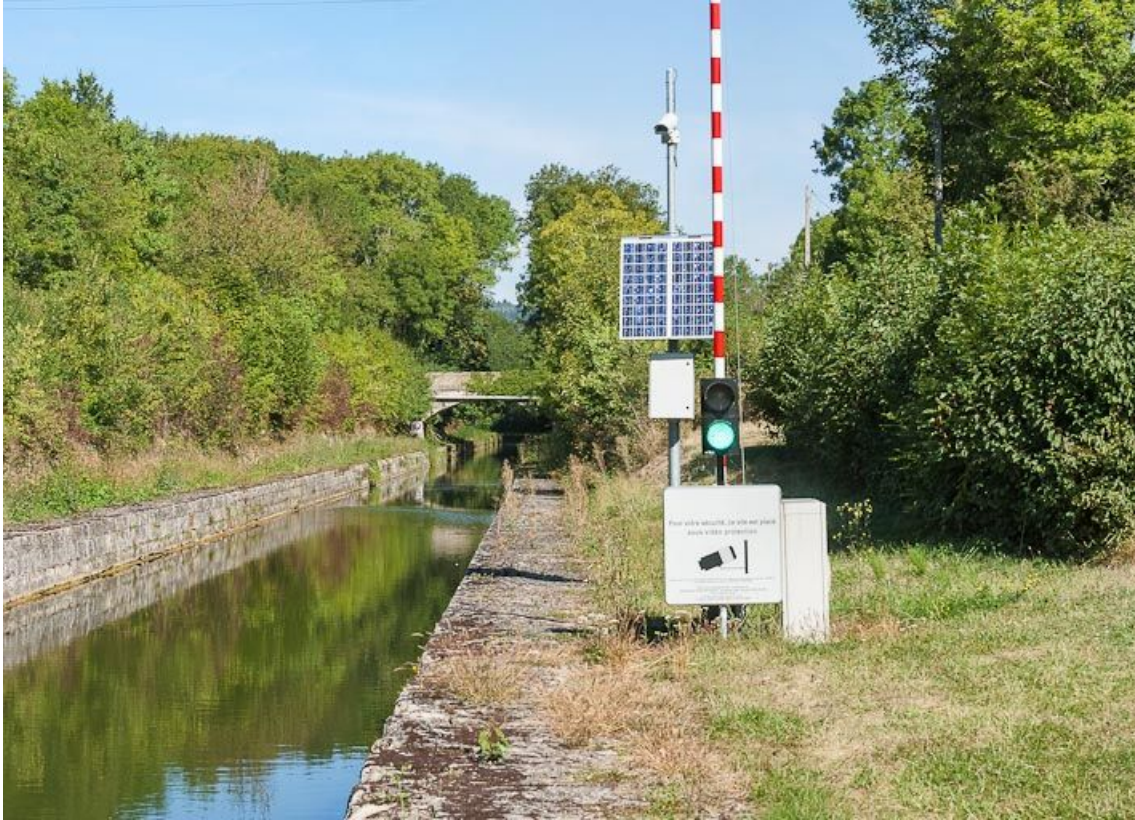
Vue d'ensemble de la tranchée de Créancey, depuis l'aval.