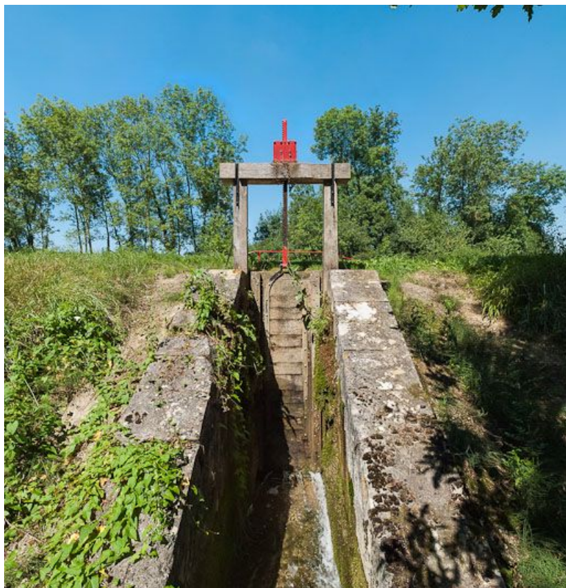
Rigole du déversoir sur le bief 78 du versant Yonne à Chassignelles, vue depuis le bas du talus.

N° de l'illustration : 20128900442NUC4AQ