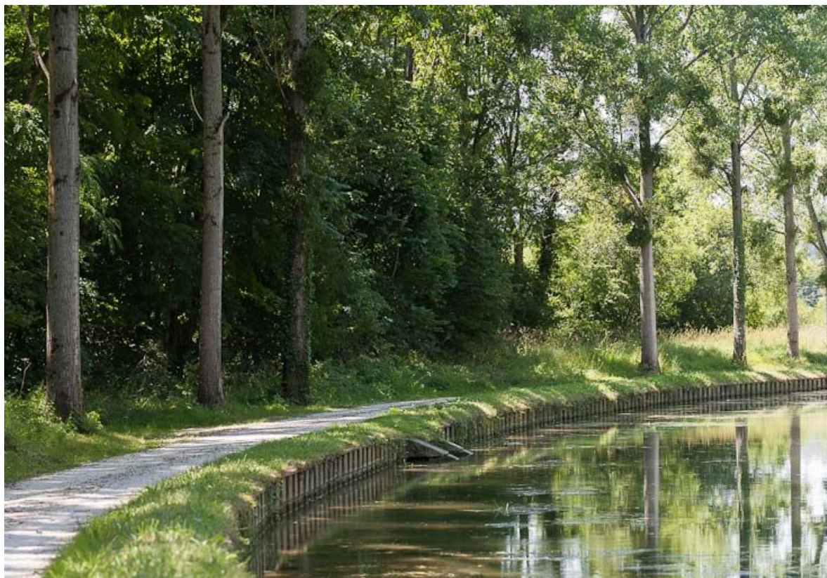
Bief 75 du versant Yonne à Ravières : le déversoir côté canal.

N° de l'illustration : 20128900366NUC4AQ