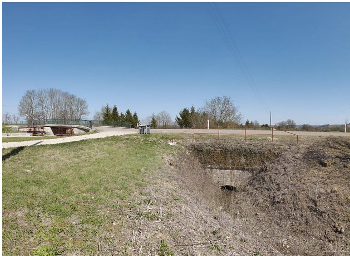
Un ponceau sur le contre-fossé du canal au site d'écluse 16 du versant Yonne, rive gauche, à Charigny.