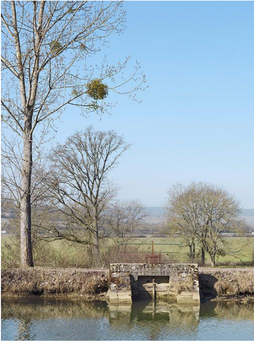
Le déversoir rive gauche de face.

21, Gissey-le-Vieil, lieudit : bief 13 du versant Yonne