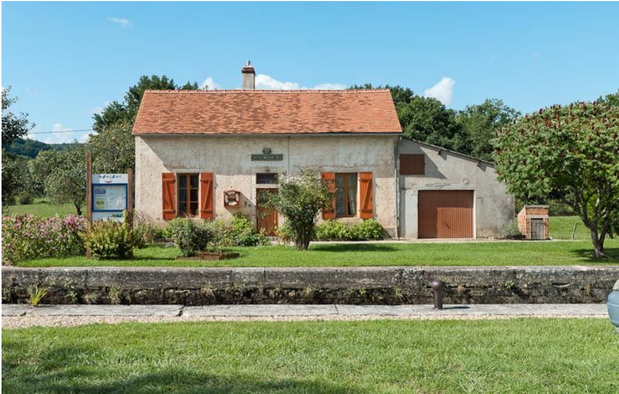
Vue de face de la maison éclusière.

21, Mussy-la-Fosse, lieudit : bief 53 du versant Yonne