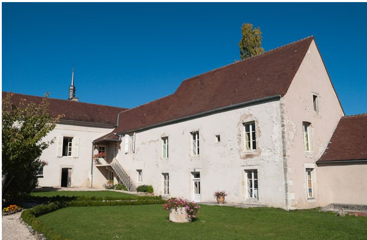
Vue d'ensemble des bâtiments à l'angle nord du jardin : bâtiment de l'apothicaire et ancien bûcher transformé en "salle d'asile". 21, Moutiers-Saint-Jean, 8 place de l' Hôpital