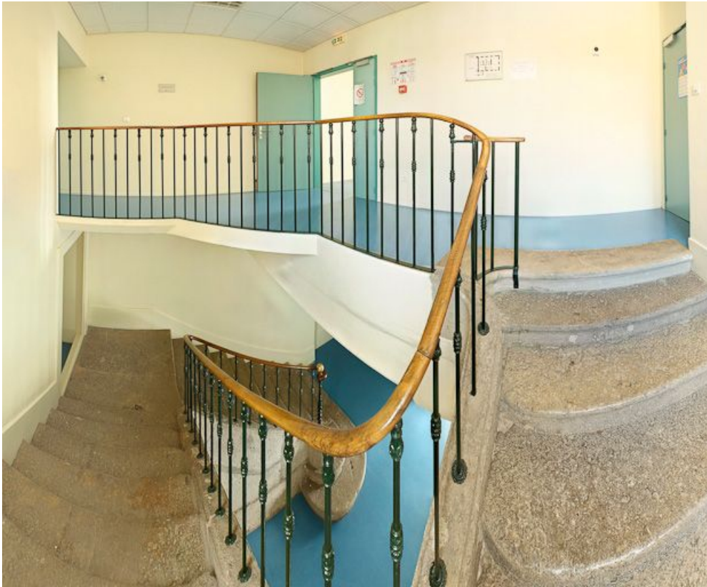
Escalier à gauche de la chapelle.