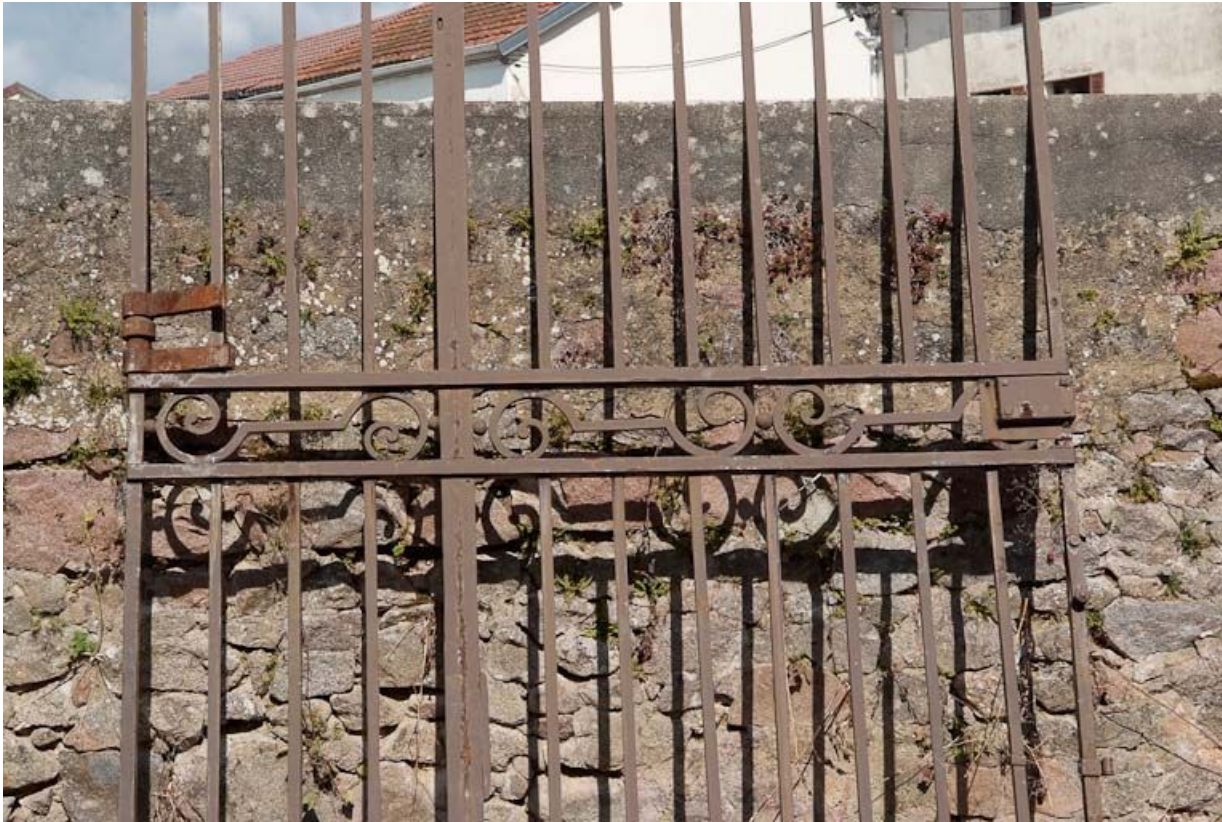
Ancien portail de la cour, détail.