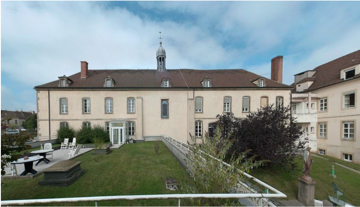
Façade postérieure du bâtiment principal. 21, Saulieu Courtépée

N° de l'illustration : 20082101164NUC2AQ