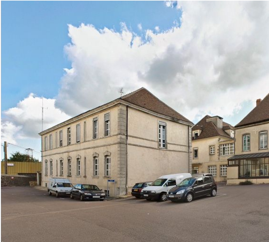
Ancien bâtiment des vieillards, élévations postérieure et gauche. 21, Saulieu Courtépée

N° de l'illustration : 20082101149NUC2AQ