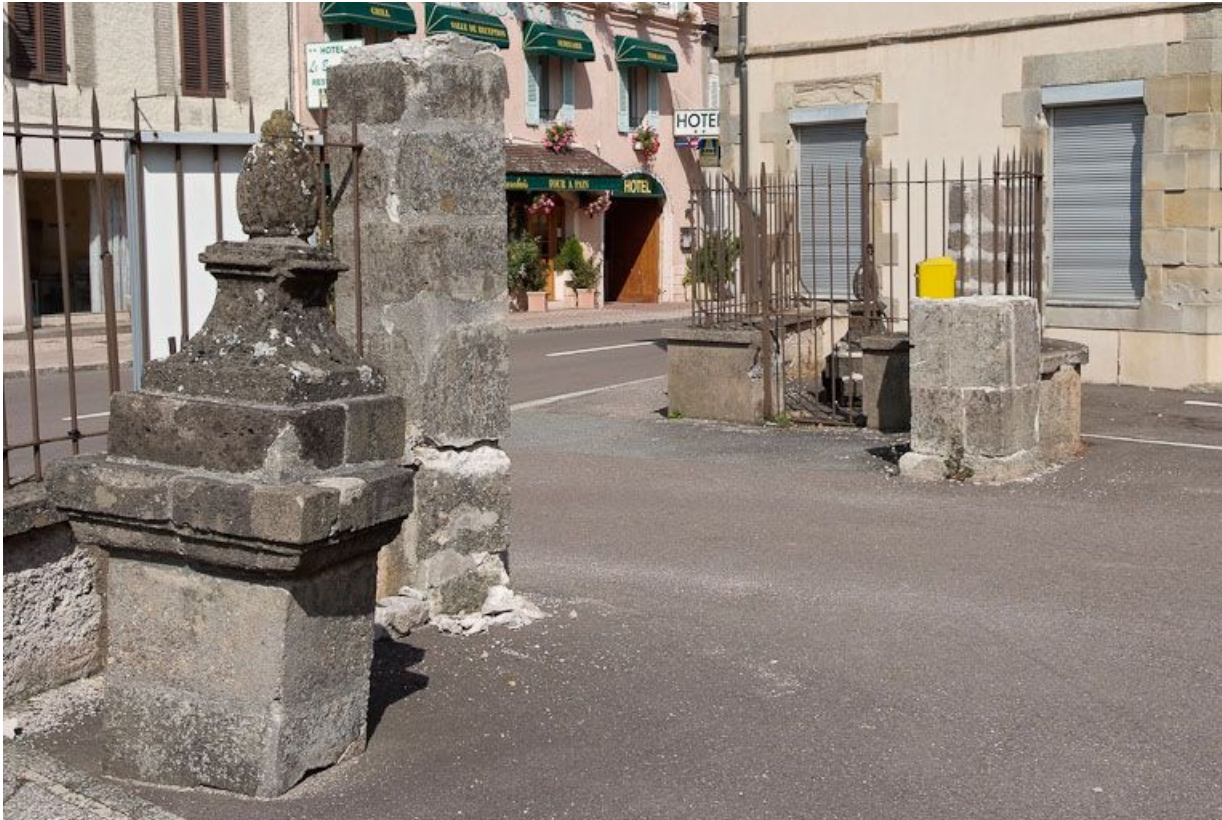
Vestiges du portail d'entrée.