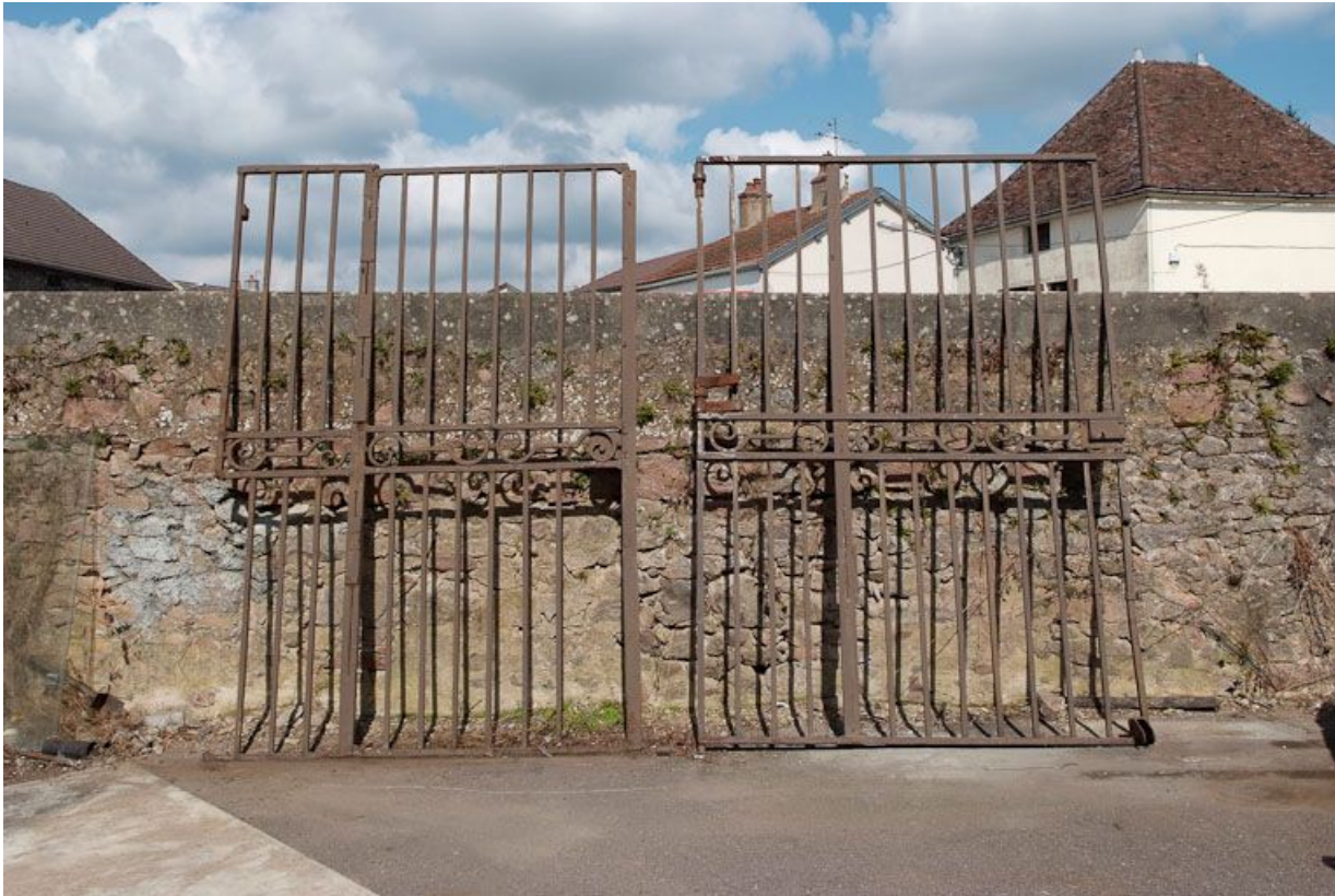
Ancien portail de la cour.