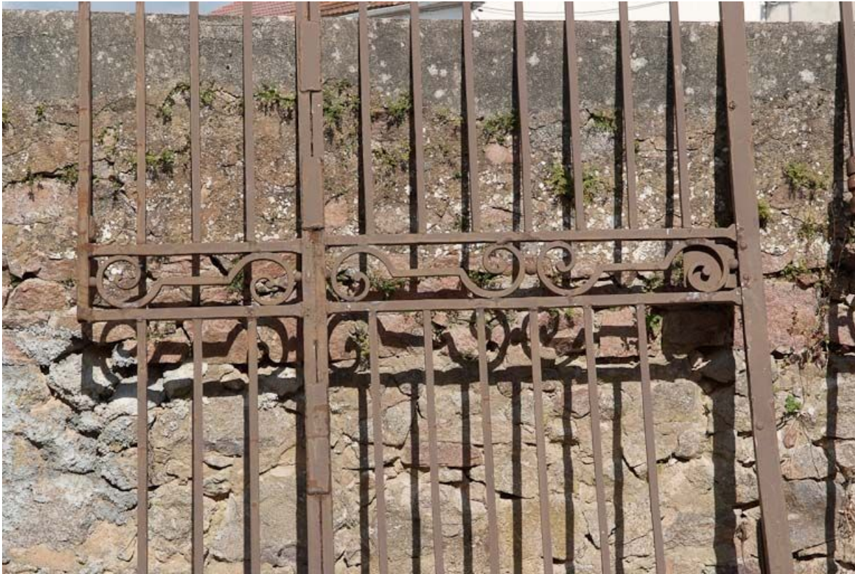
Ancien portail de la cour, détail.