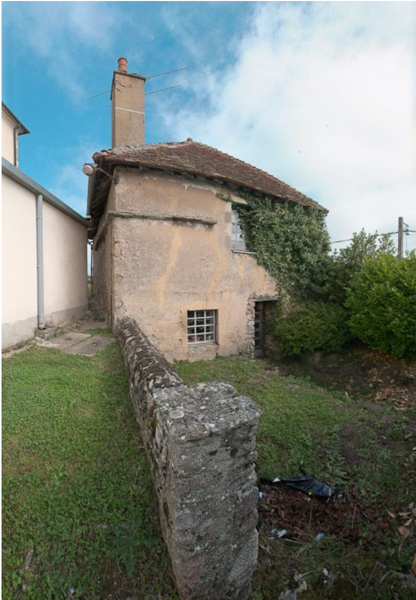
Construction ancienne incluant la tour de Poilbourg.