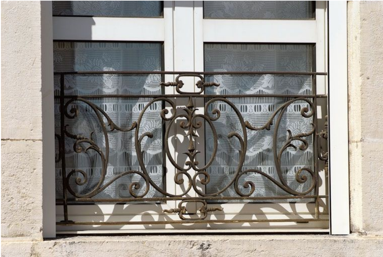
Ancien bâtiment des vieillards : détail d'un garde-corps.