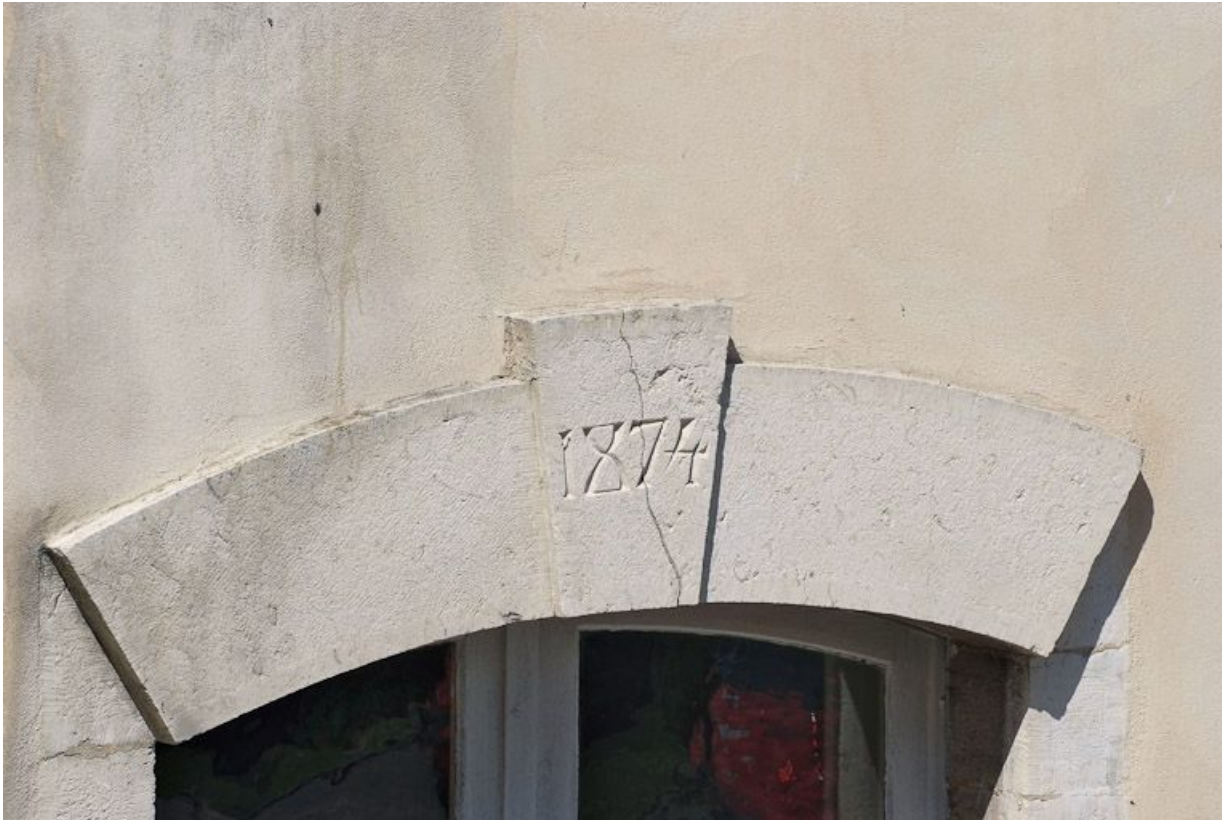
Ancien bâtiment des vieillards : linteau de l'entrée, daté 1874.