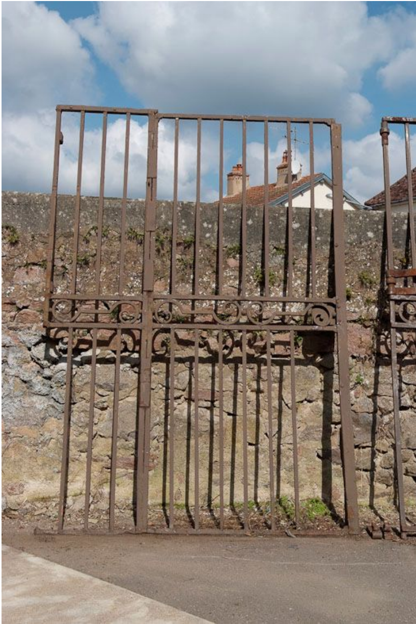
Ancien portail de la cour.