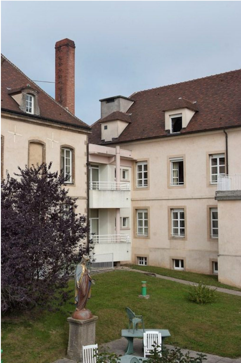
Angle formé par l'ancien hôpital et le nouveau bâtiment nord. 21, Saulieu Courtépée