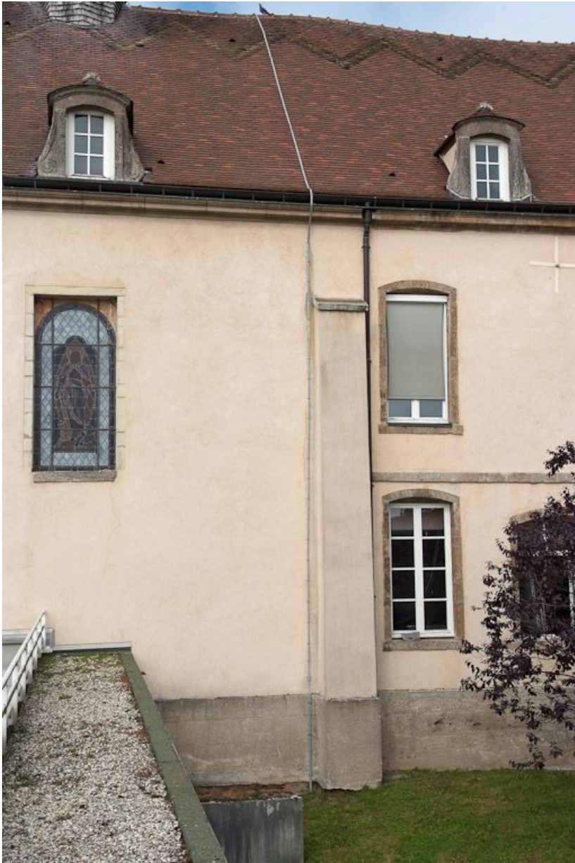
Façade postérieure du bâtiment principal : mur postérieur de la chapelle et contrefort. 21, Saulieu Courtépée