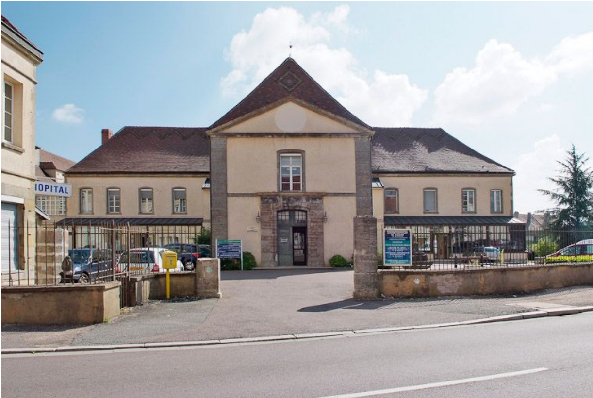
Vue d'ensemble depuis la rue.