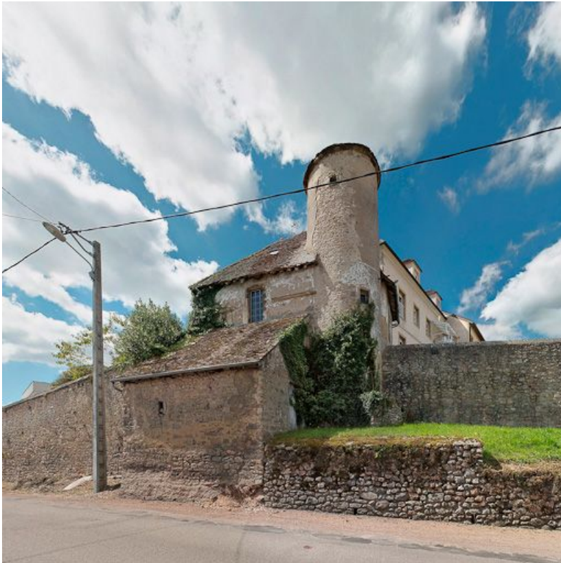
Construction ancienne incluant la tour de Poilbourg.