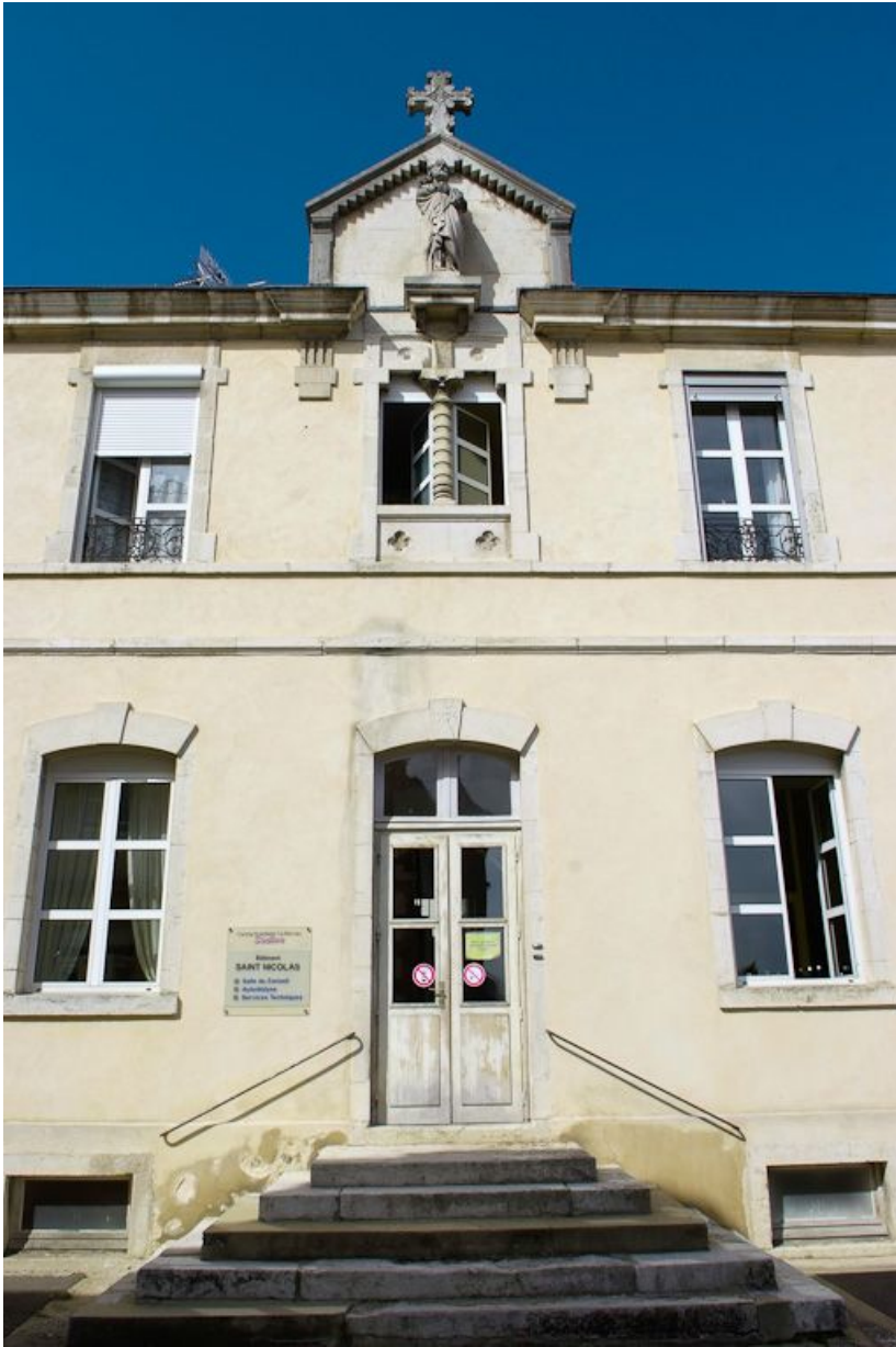
Ancien bâtiment des vieillards : travées centrales. 21, Saulieu Courtepée