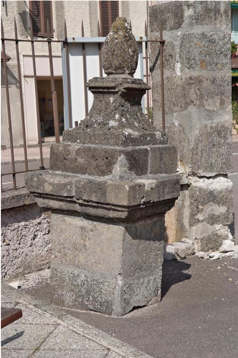
Couronnement d'un des piliers du portail.