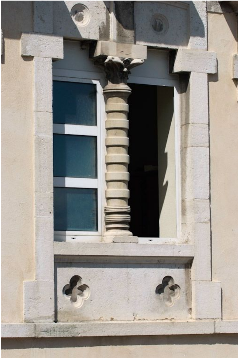
Ancien bâtiment des vieillards, travée centrale : fenêtre de l'étage. 21, Saulieu Courtépée