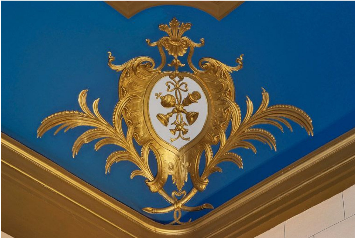
Chapelle : détail du décor du plafond.