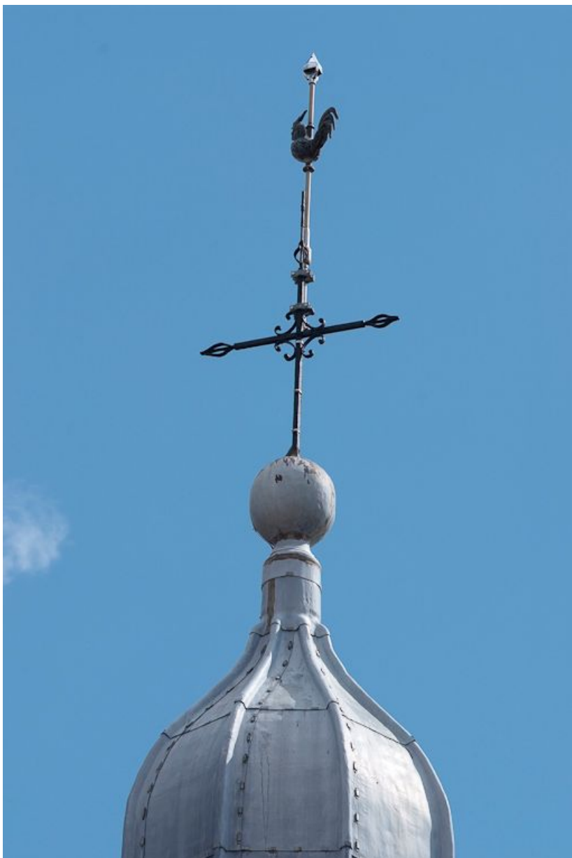
Détail du campanile.