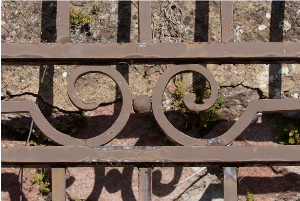
Ancien portail de la cour, détail.