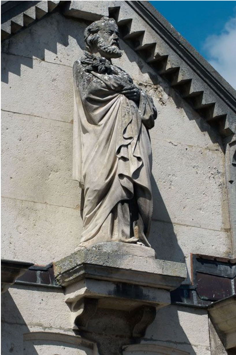
Ancien bâtiment des vieillards, travée centrale : saint Joseph. 21, Saulieu Courtépée