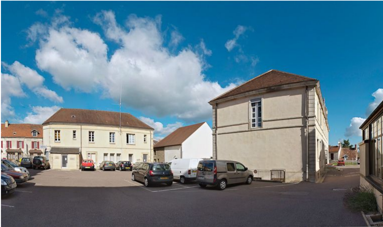
Bâtiment ouest, à gauche de l'entrée de la cour et élévation gauche de l'ancien bâtiment des vieillards. 21, Saulieu Courtépée

N° de l'illustration : 20082101150NUC4AQ