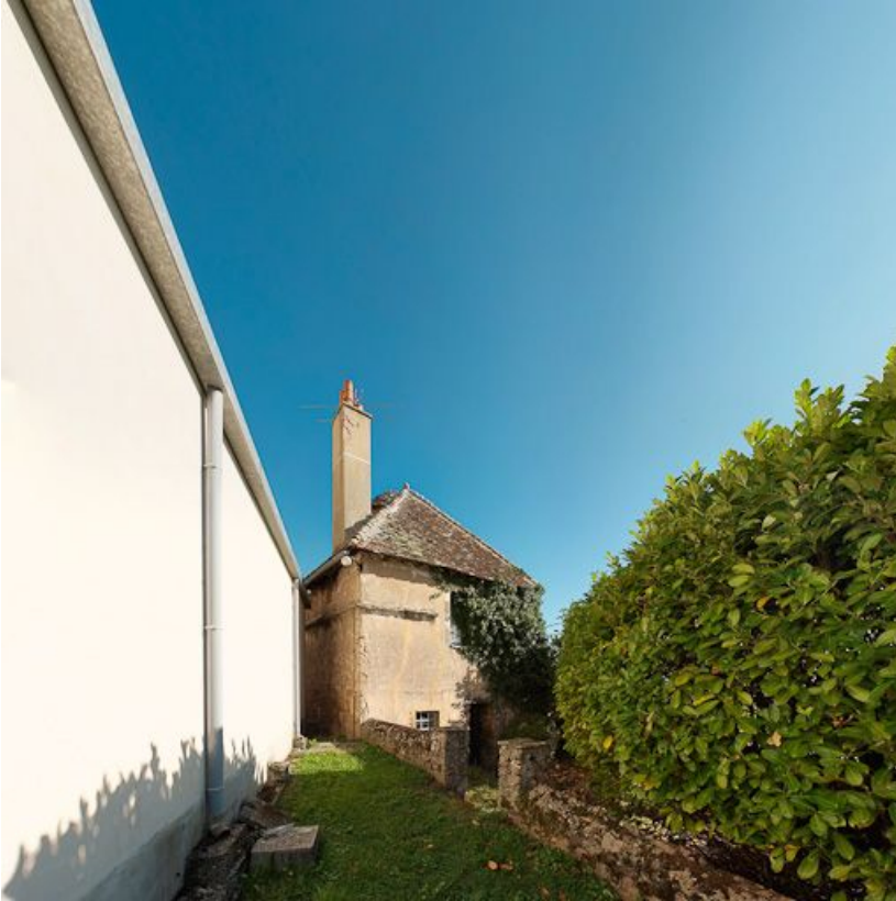
Construction ancienne incluant la tour de Poilbourg.