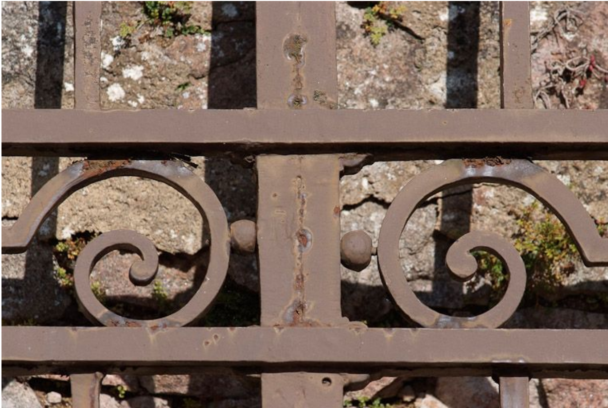
Ancien portail de la cour, détail.