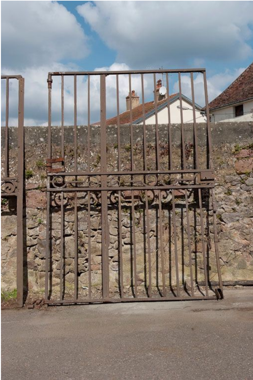
Ancien portail de la cour.