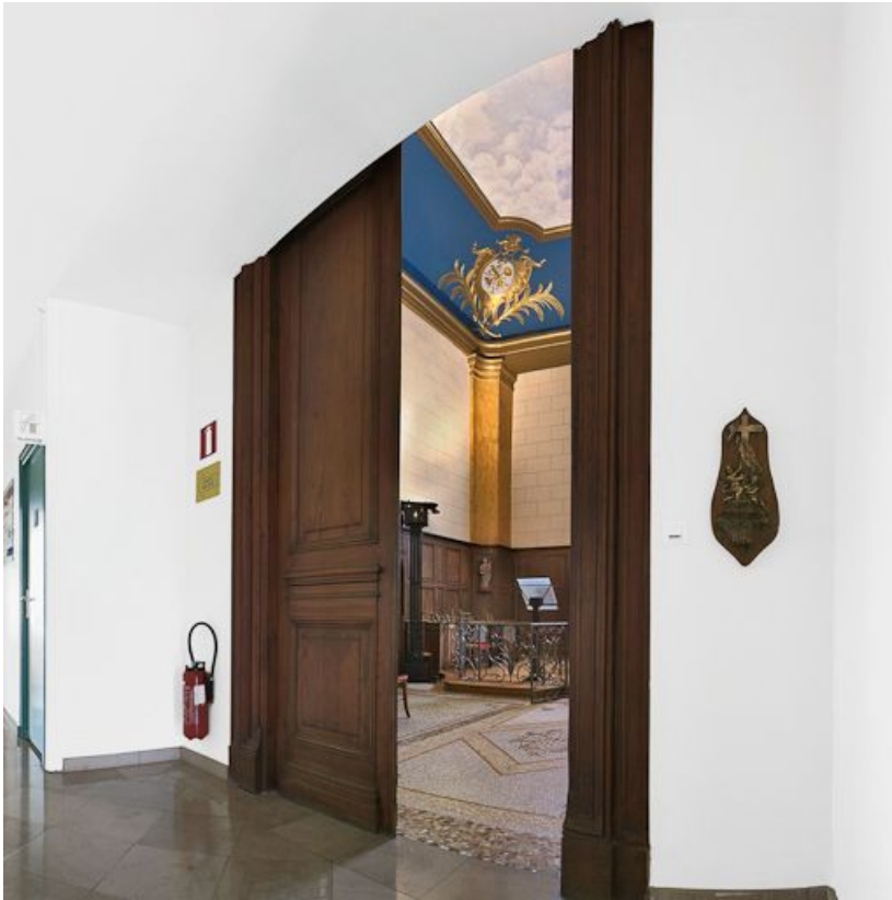
Entrée de la chapelle.