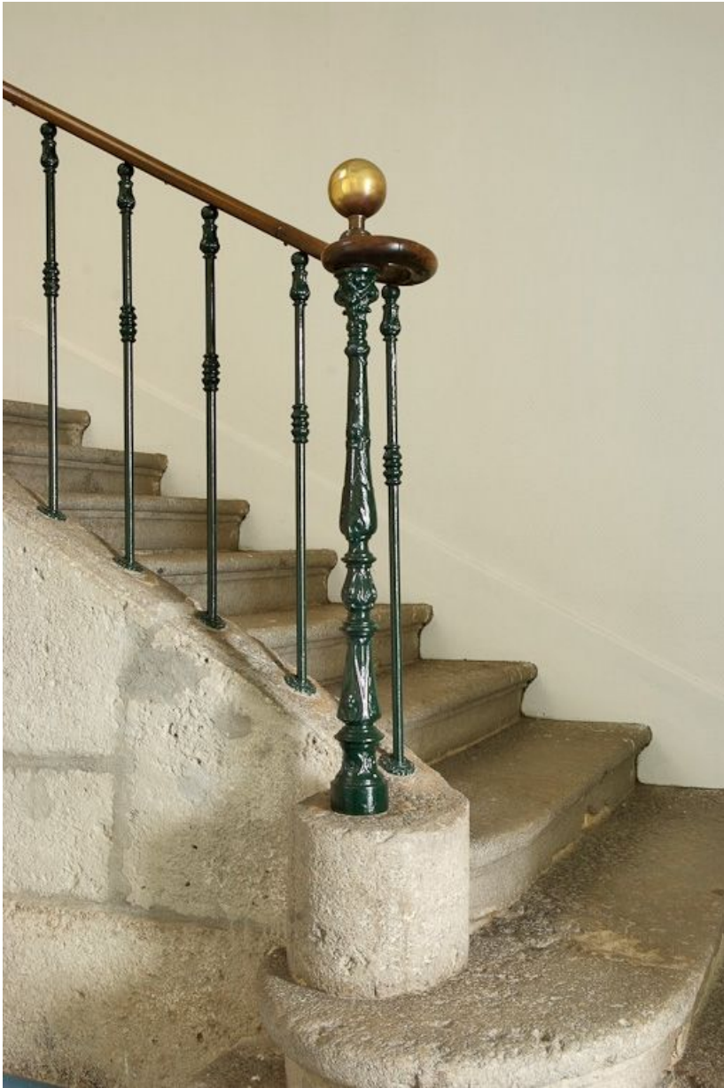
Escalier du vestibule à gauche de la chapelle, détail. 21, Saulieu Courtépée