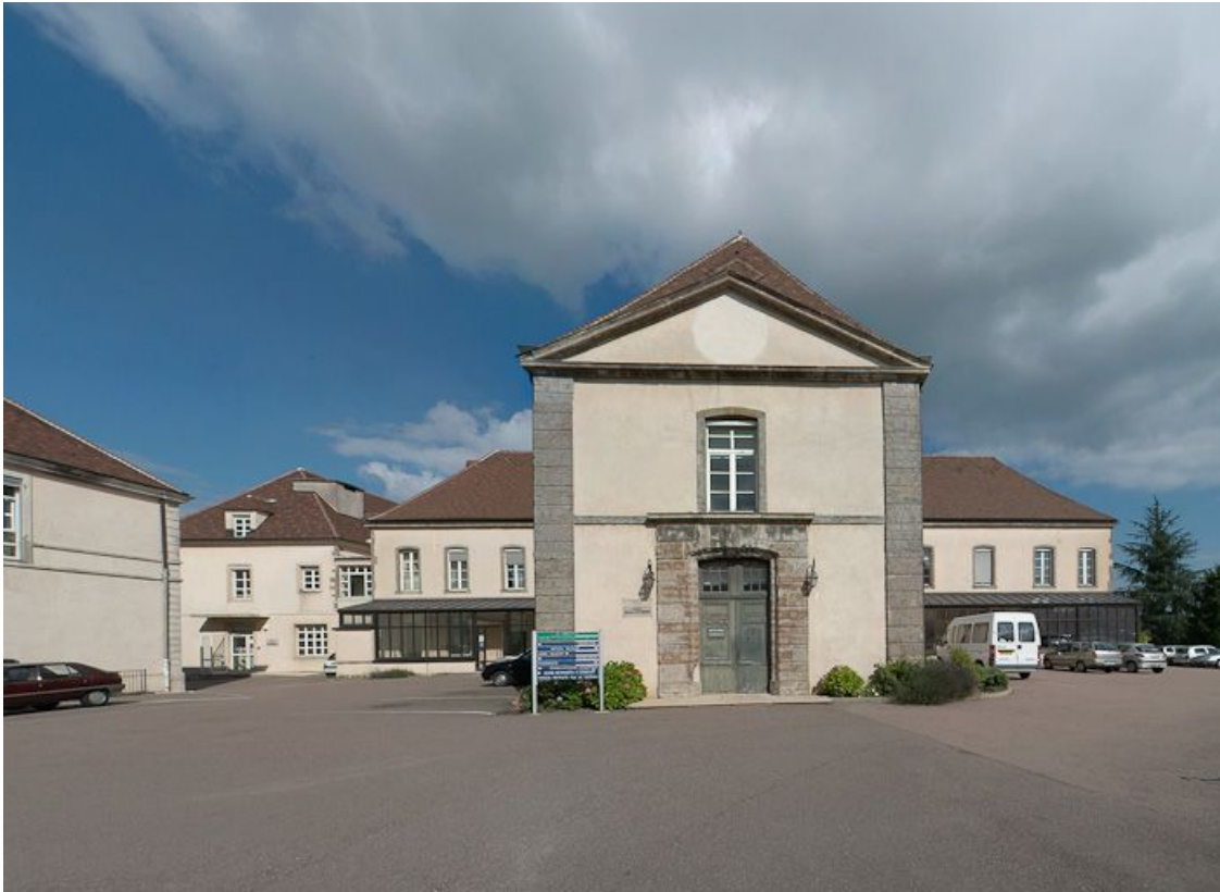
Vue d'ensemble depuis la cour.