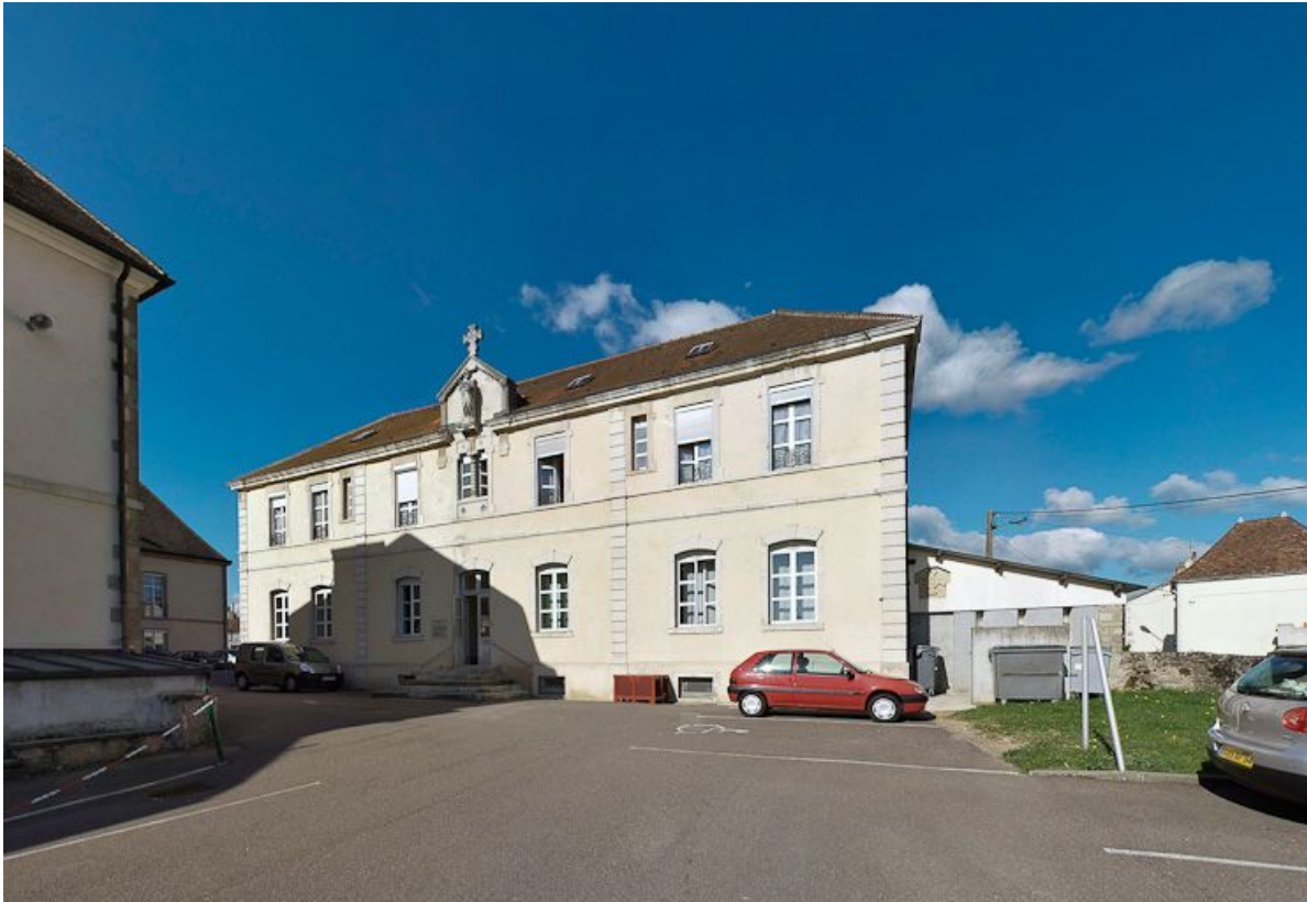
Ancien bâtiment des vieillards : façade.