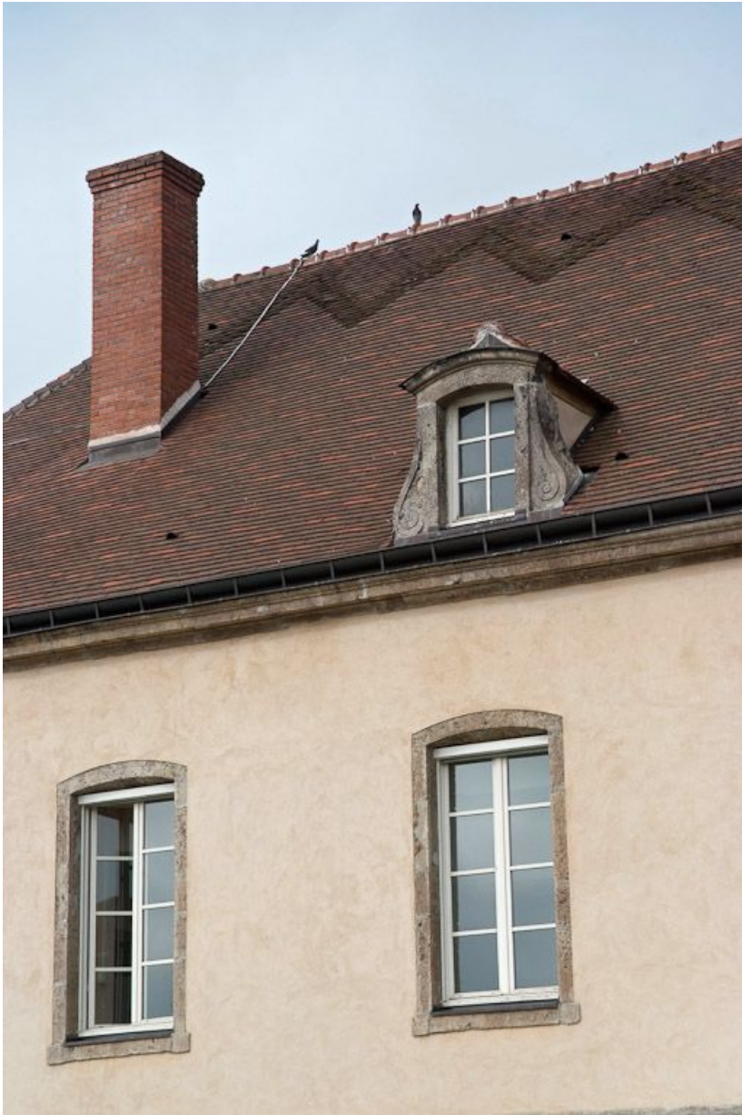
Façade postérieure du bâtiment principal : détail.