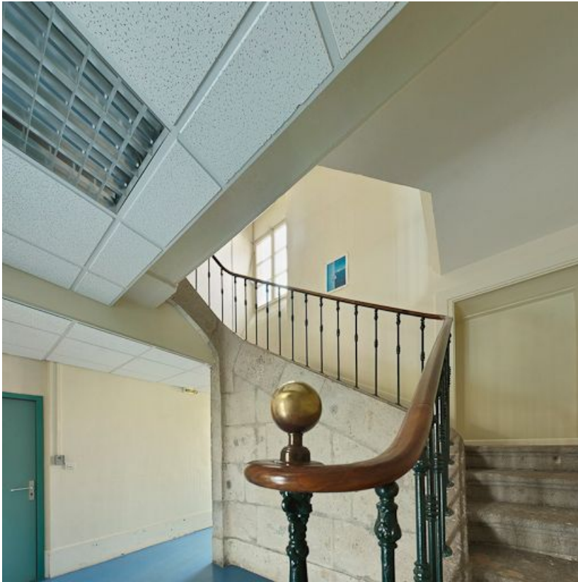
Escalier du vestibule à gauche de la chapelle.