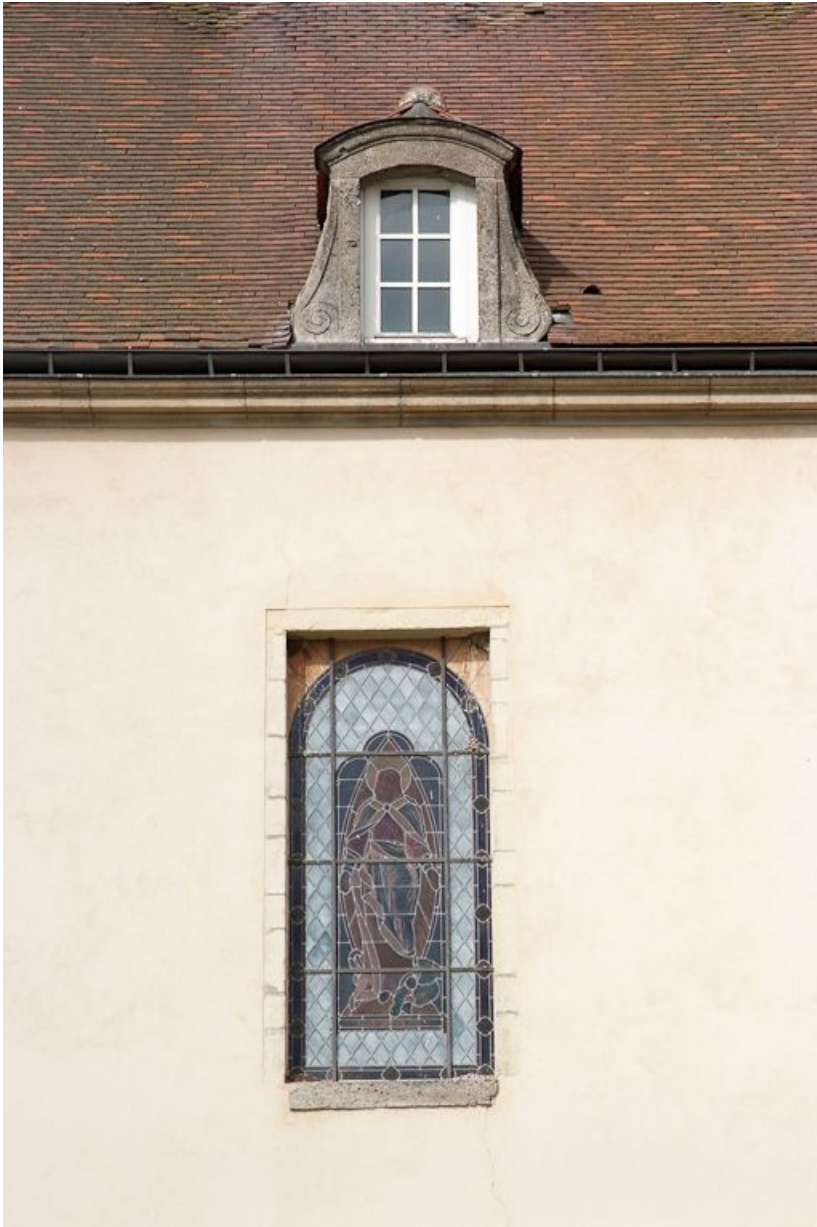
Façade postérieure du bâtiment principal : détail de la fenêtre de la chapelle et d'une lucarne. 21, Saulieu Courtépée