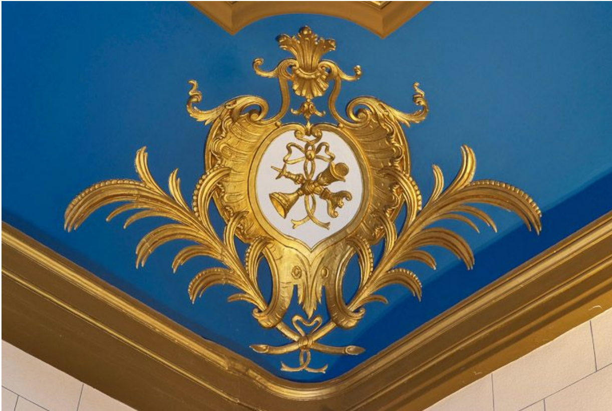
Chapelle : détail du décor du plafond.