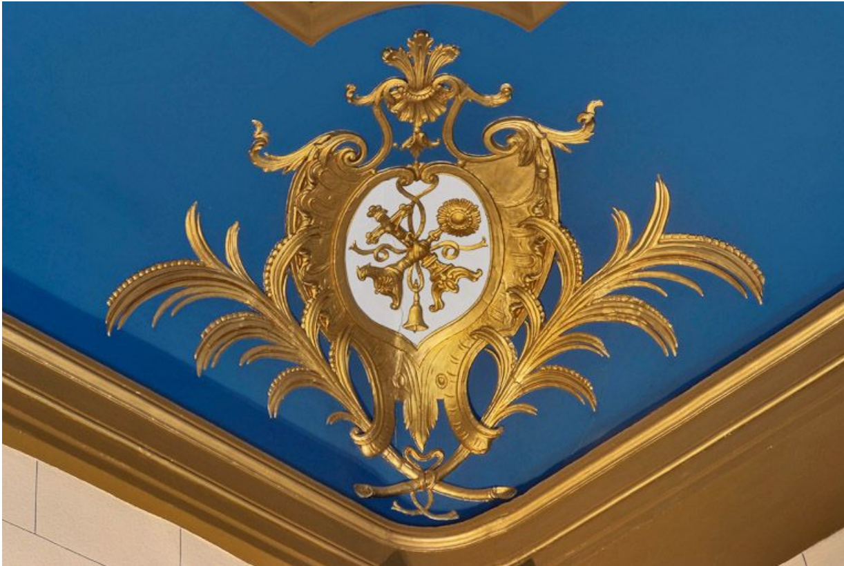
Chapelle : détail du décor du plafond.