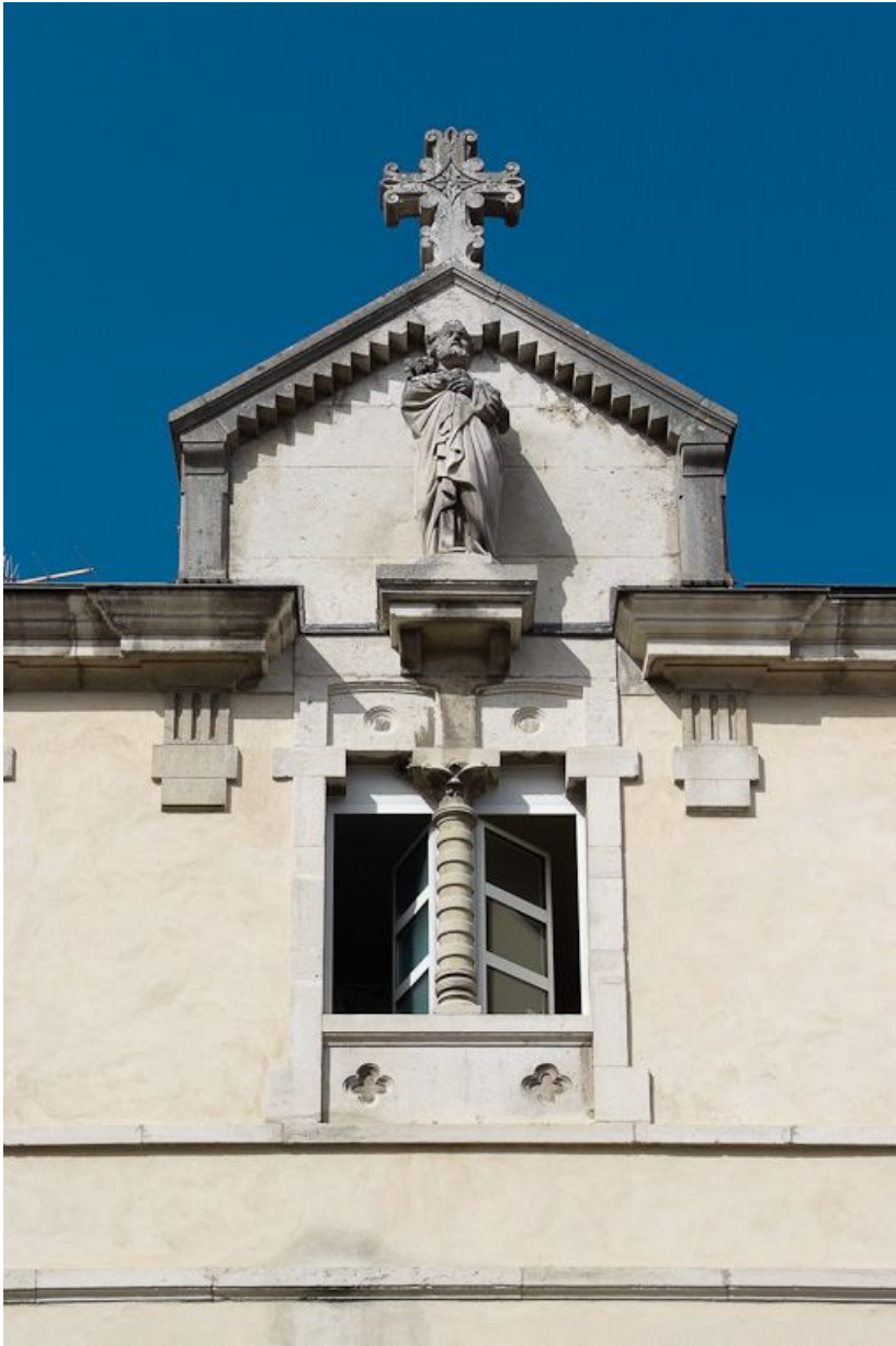
Ancien bâtiment des vieillards, travée centrale : détail de la fenêtre de l'étage et du couronnement. 21, Saulieu Courtépée