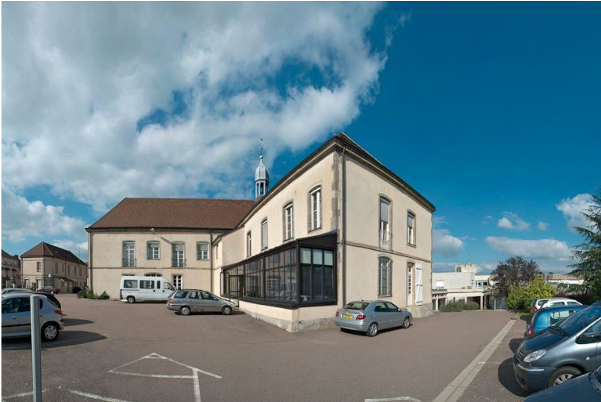
Partie droite du bâtiment principal et corps perpendiculaire dans l'axe de la chapelle. 21, Saulieu Courtépée

N° de l'illustration : 20082101170NUC4AQ