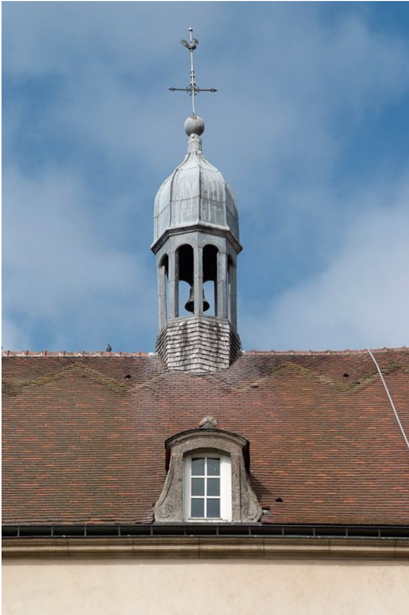
Façade postérieure du bâtiment principal : campanile et lucarne. 21, Saulieu Courtépée