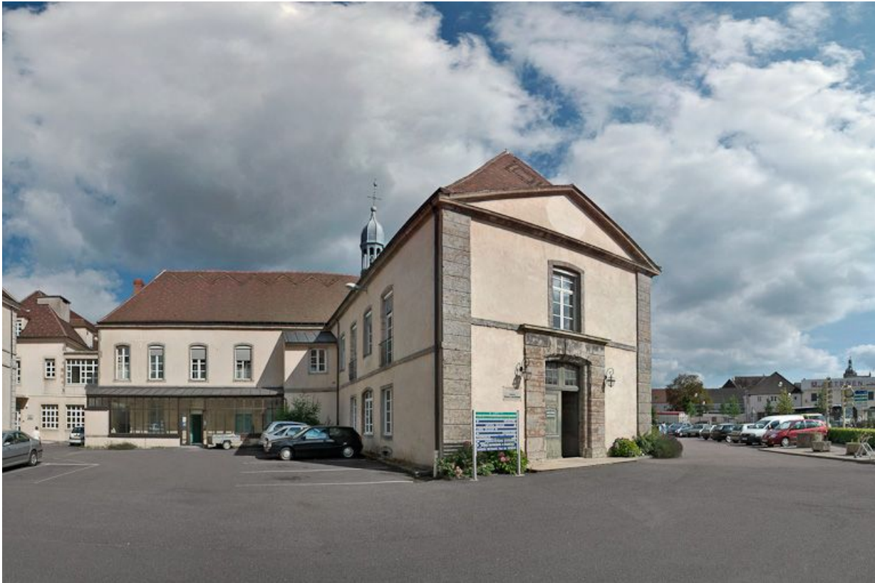
Partie gauche du bâtiment principal et corps perpendiculaire dans l'axe de la chapelle. 21, Saulieu Courtépée

N° de l'illustration : 20082101142NUC4AQ