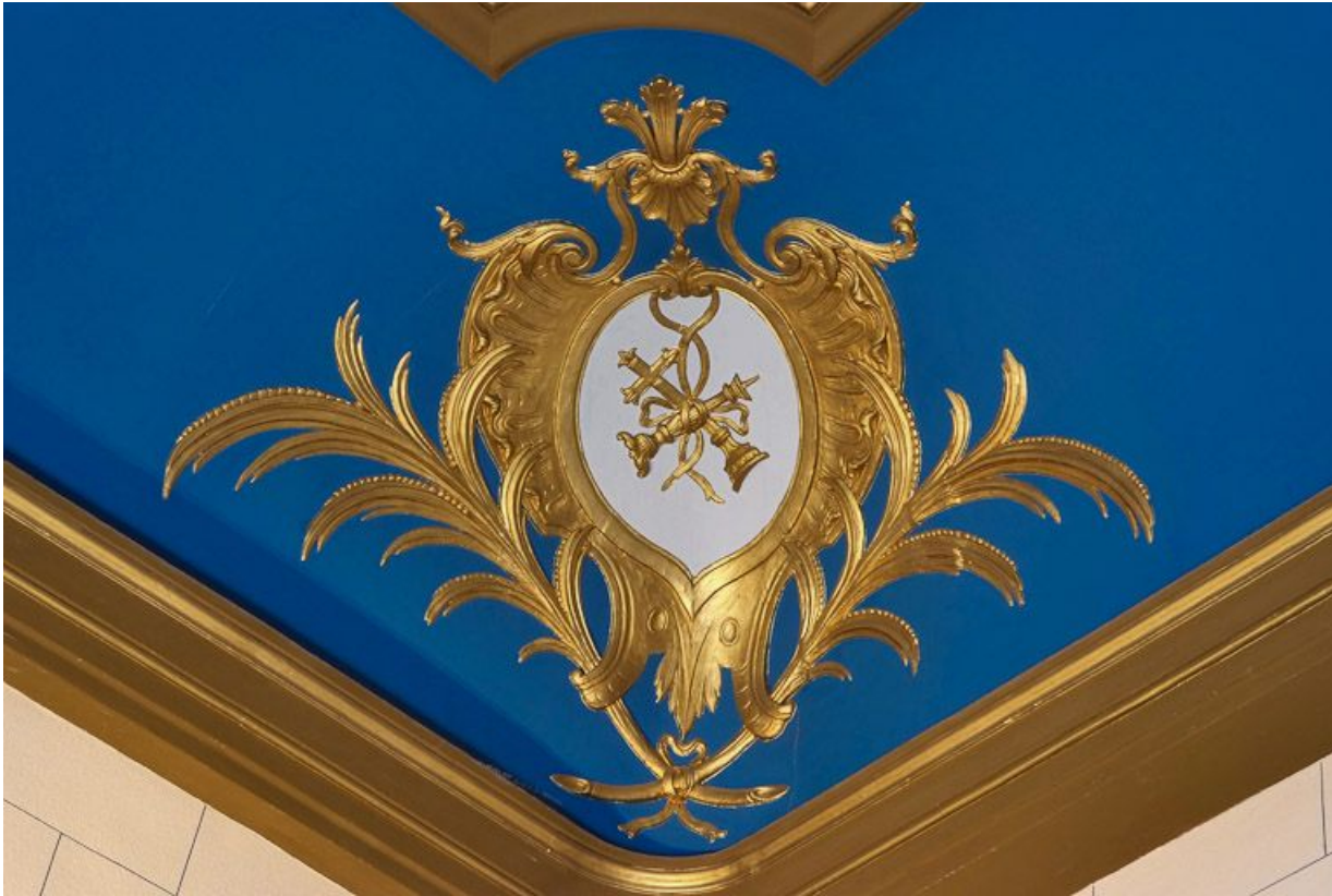
Chapelle : détail du décor du plafond.