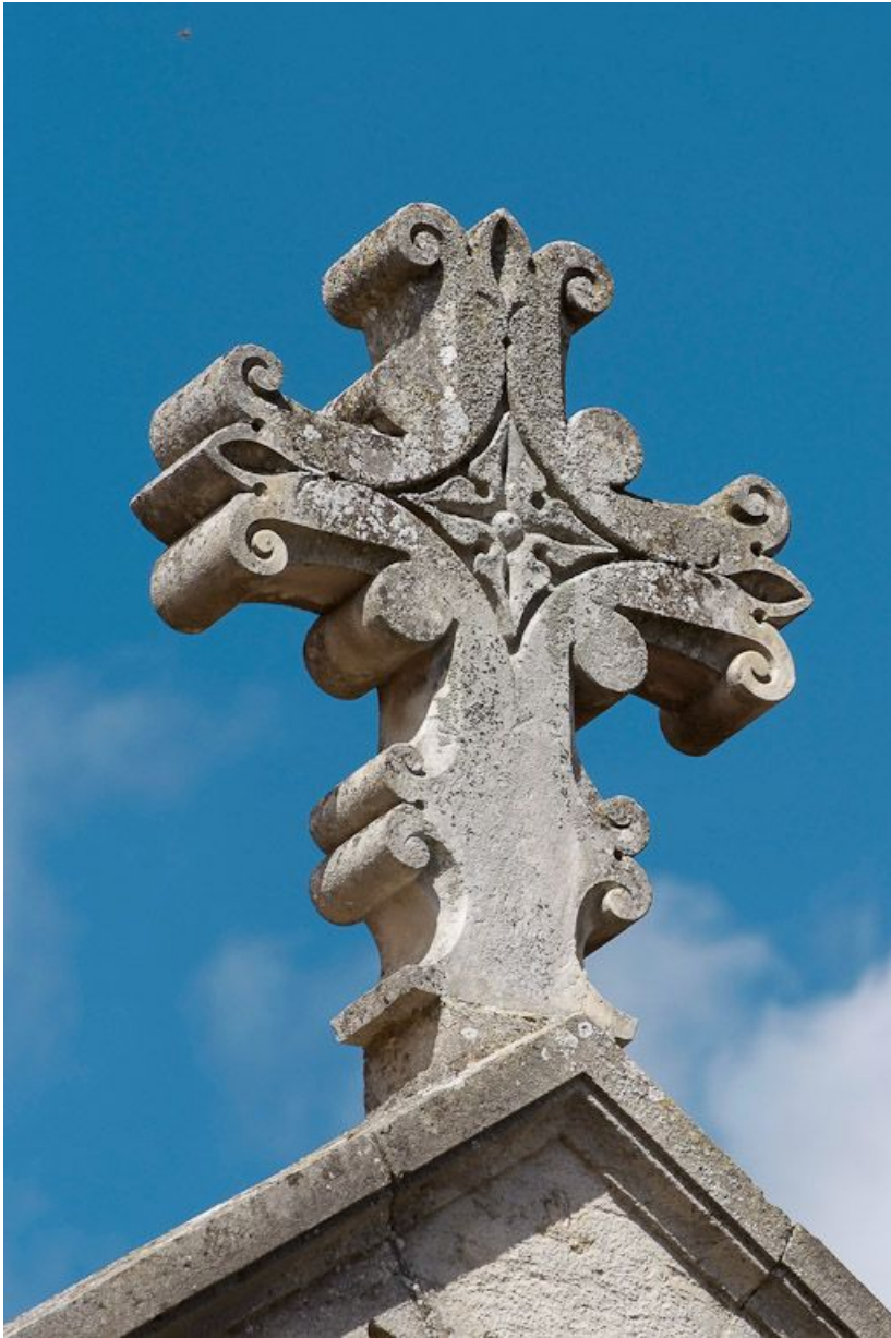
Ancien bâtiment des vieillards, travée centrale : croix du couronnement. 21, Saulieu Courtépée