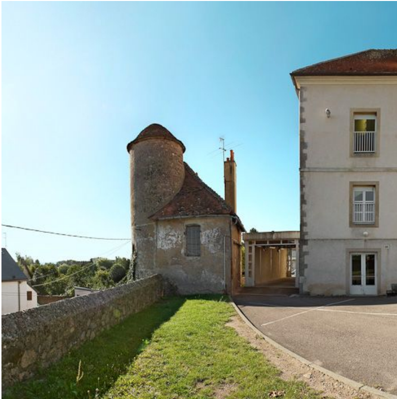
Construction ancienne incluant la tour de Poilbourg.