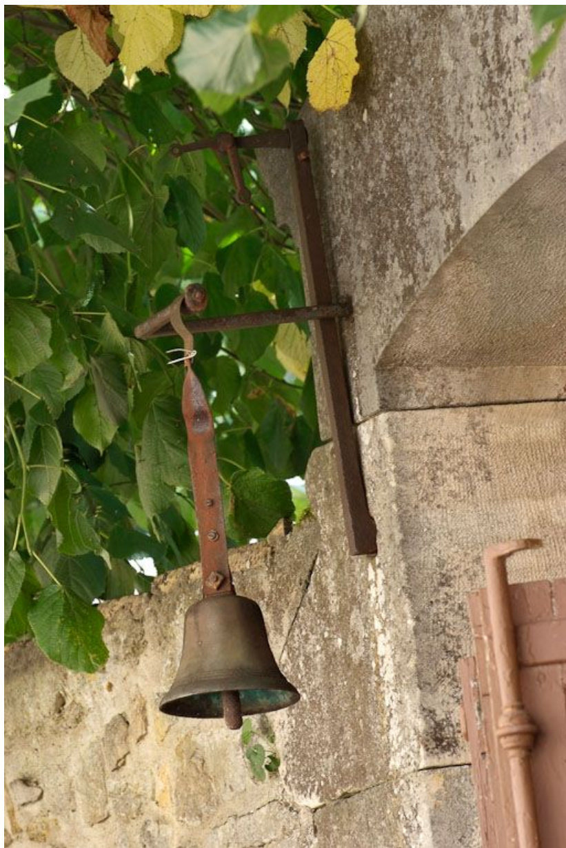
Clochette du portail.