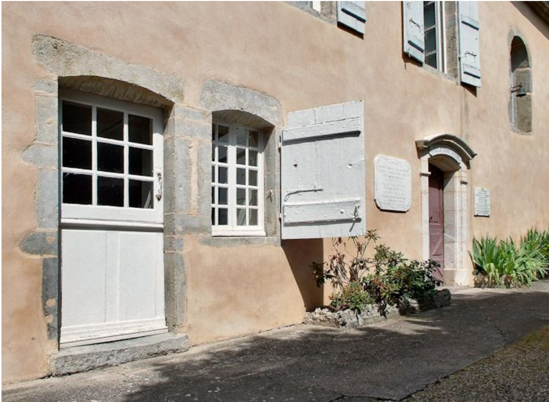
Façade antérieure de l'ancien hôpital, partie centrale.