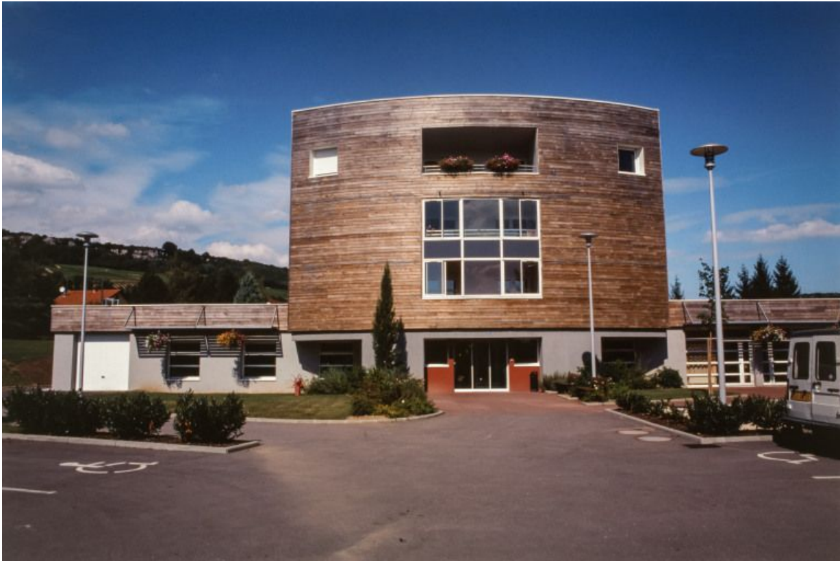
Maison de retraite, élévation antérieure.