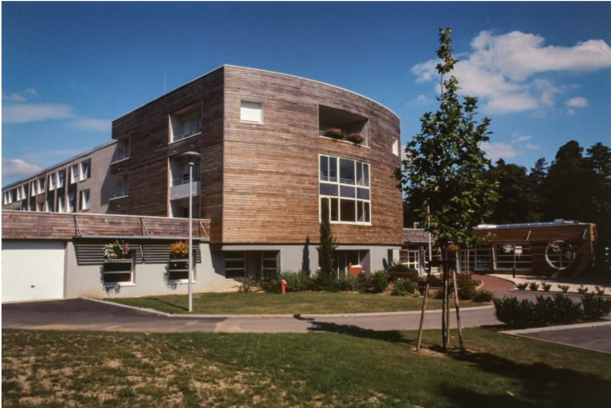
Maison de retraite, élévation antérieure.