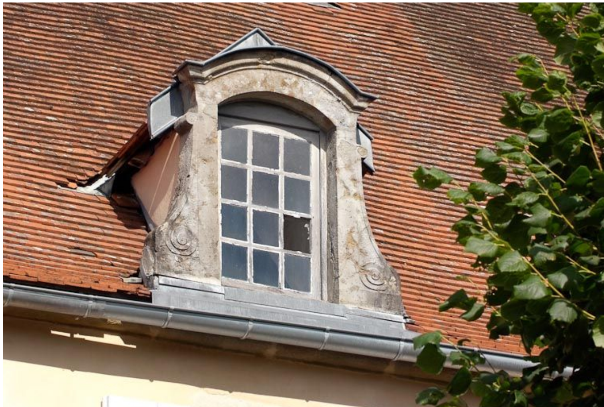
Lucarne de la façade antérieure.