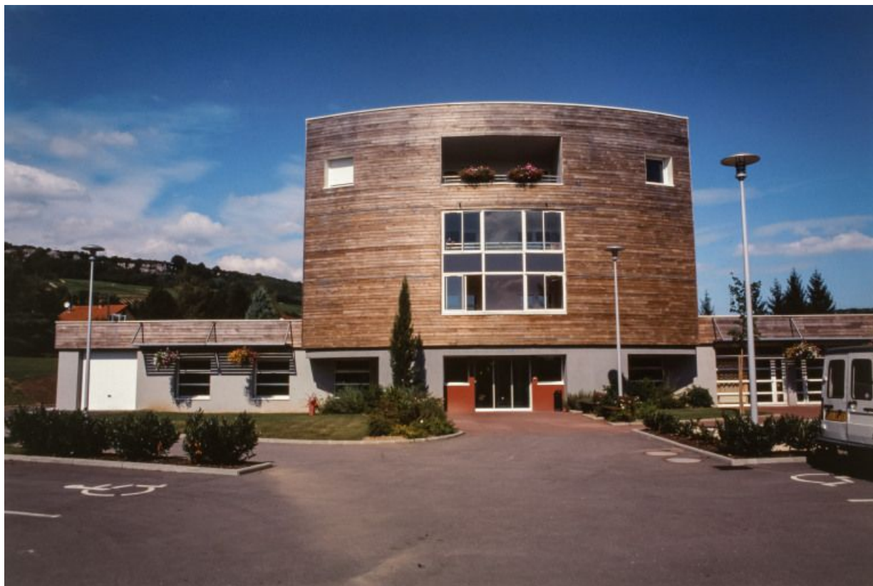
Maison de retraite, élévation antérieure.