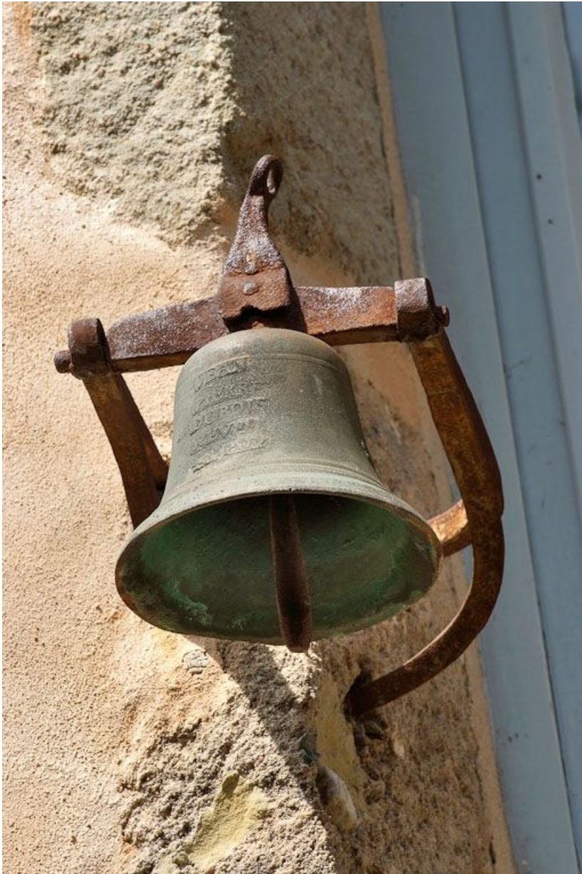
Façade antérieure, cloche d'appel.