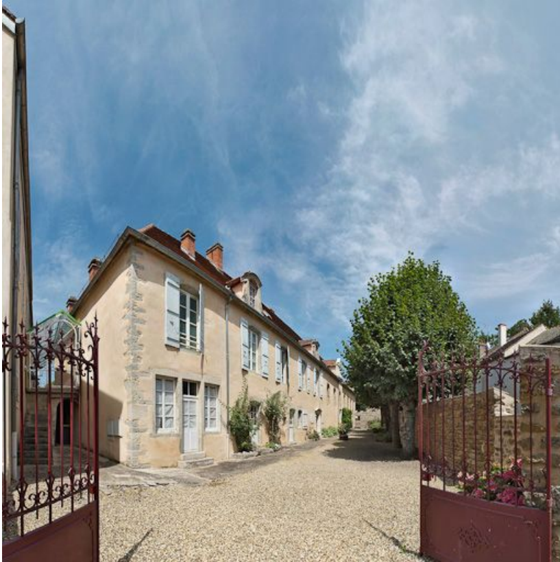
Façade antérieure de l'ancien hôpital.