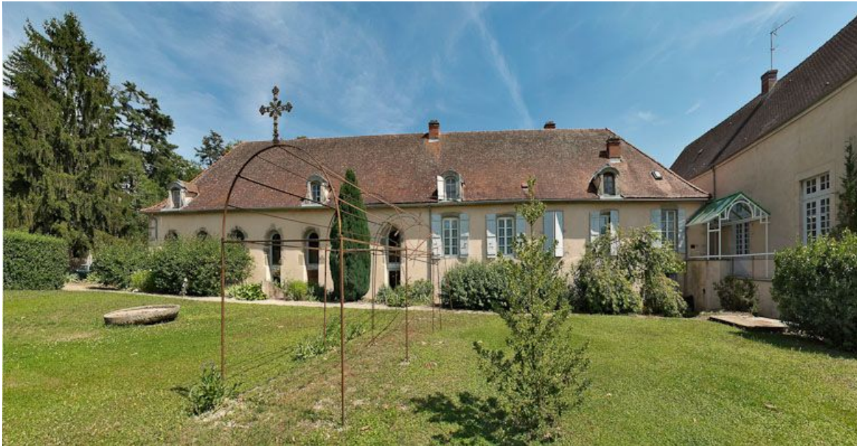
Façade postérieure de l'ancien hôpital.