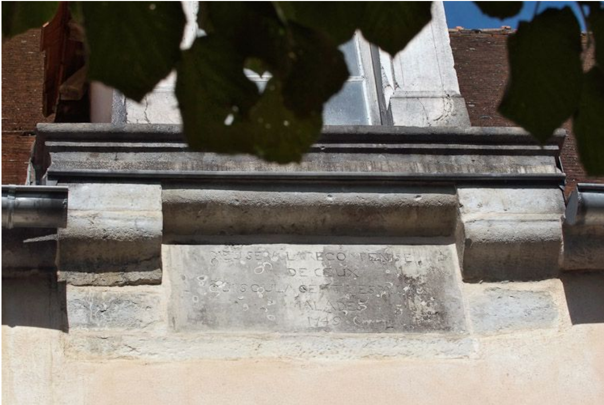
Façade antérieure, détail de l'inscription.