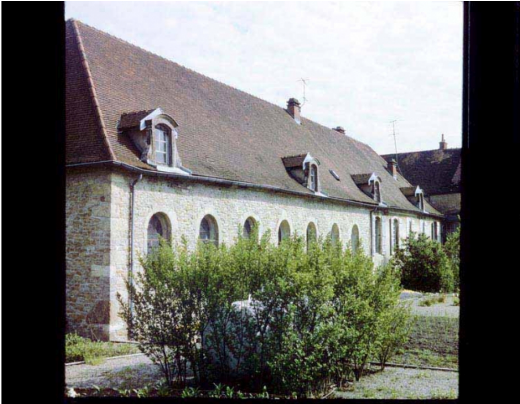
Vue du bâtiment principal.