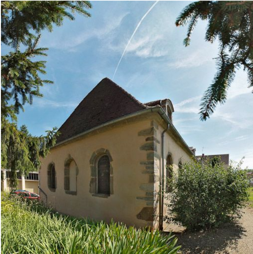
Elévation droite (ancienne chapelle).