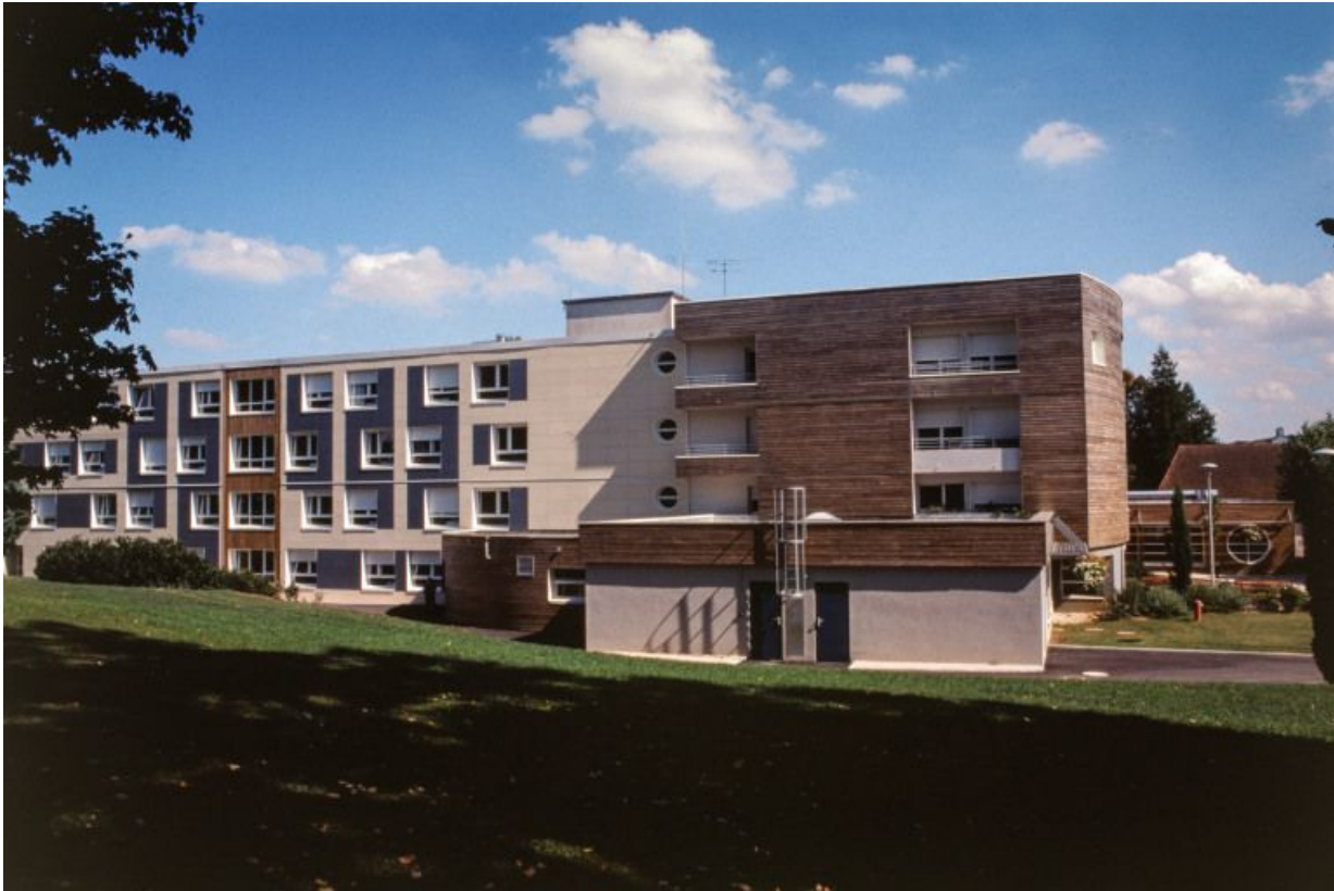
Maison de retraite, élévation latérale.