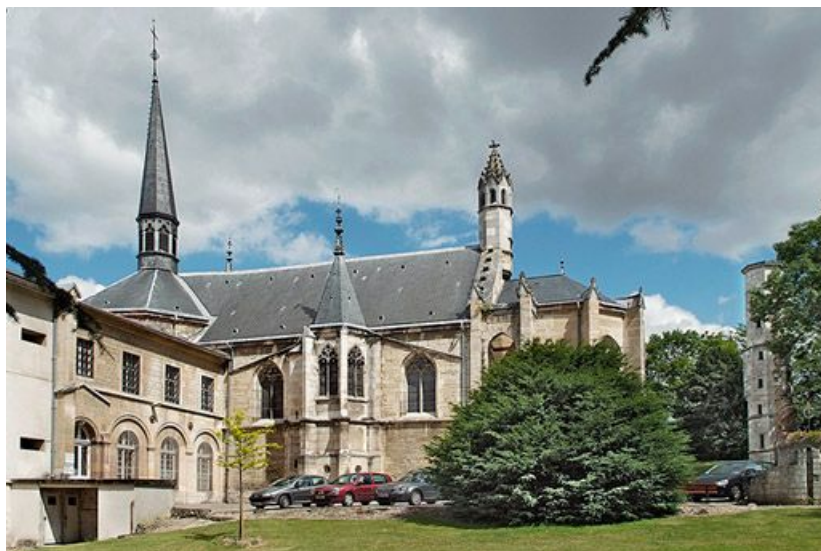
Chapelle : élévation latérale.