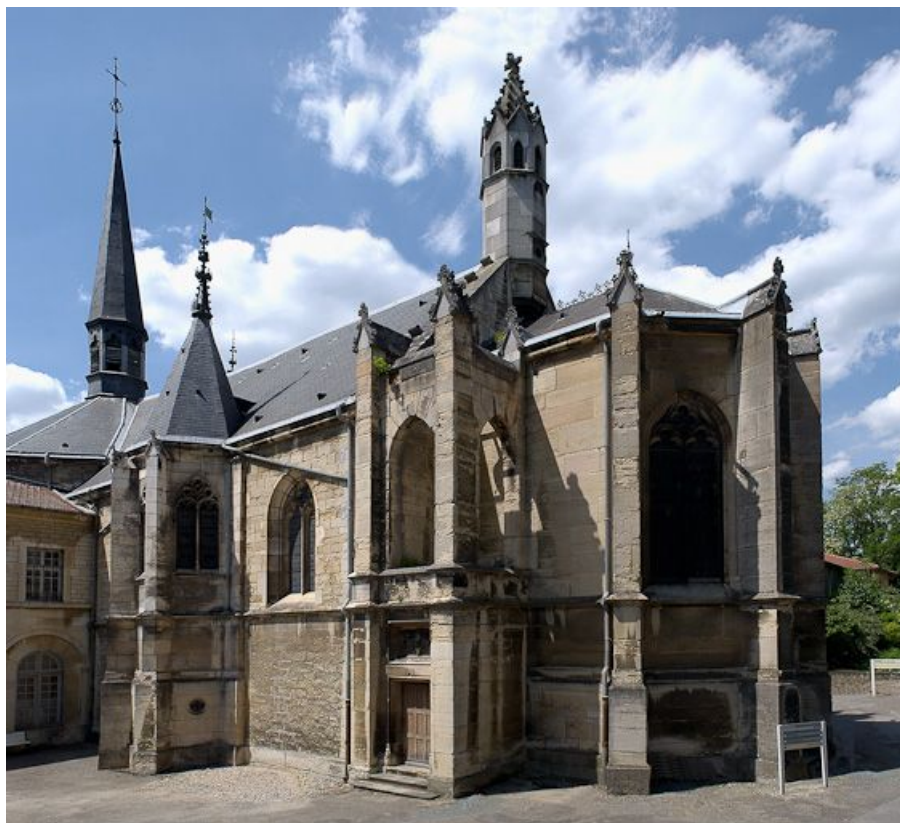
Chevet de la chapelle.