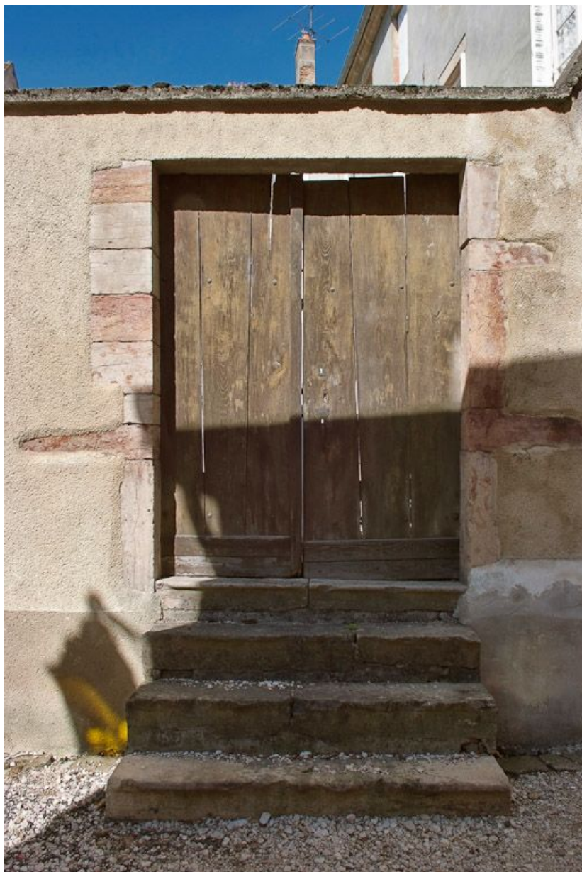
Porte du mur de clôture est de la cour.