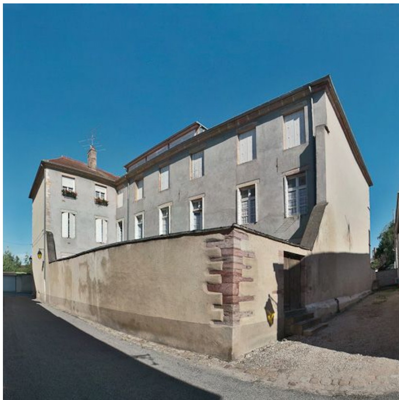
Façades sur cour des deux corps de bâtiment.