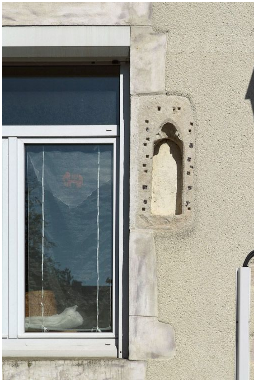
Façade ouest : détail de la petite niche trilobée en rempli.