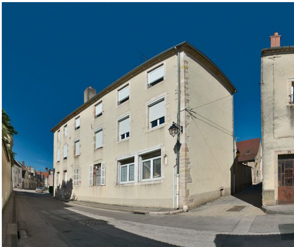
Façade ouest sur la rue Davot et mur de croupe sud sur la ruelle Maillard du Mesle. 21, Auxonne, 20 B rue Davot