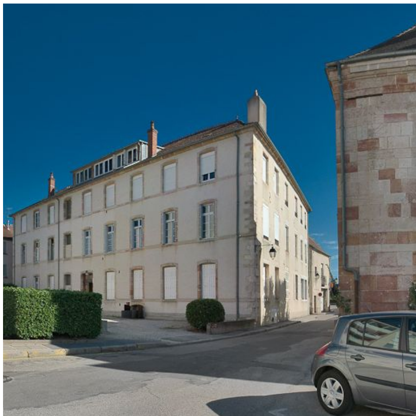
Vue d'ensemble : façade nord sur jardin et élévation ouest sur la rue Davot. 21, Auxonne, 20 B rue Davot