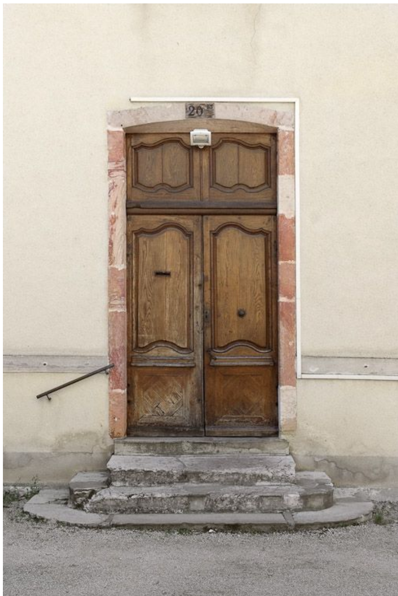
Ancienne porte de la mairie employée dans la façade nord.