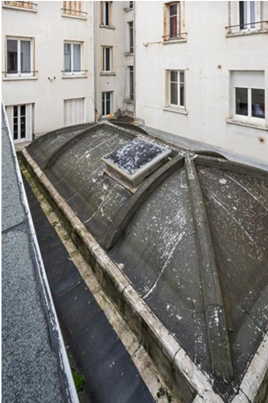
Toit de la salle 9, vu depuis celui de la salle 2.