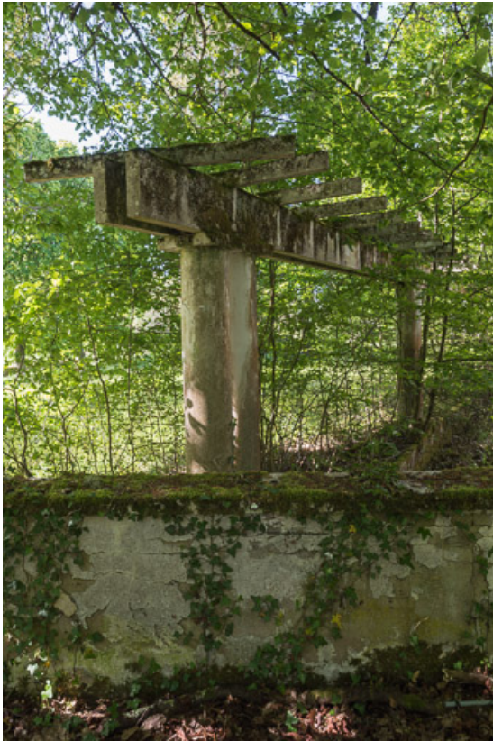
Pergola, vue depuis le nord-est, détail.

21, R.D.17 Magnien rue de la Source, lieudit : écart de Maizières