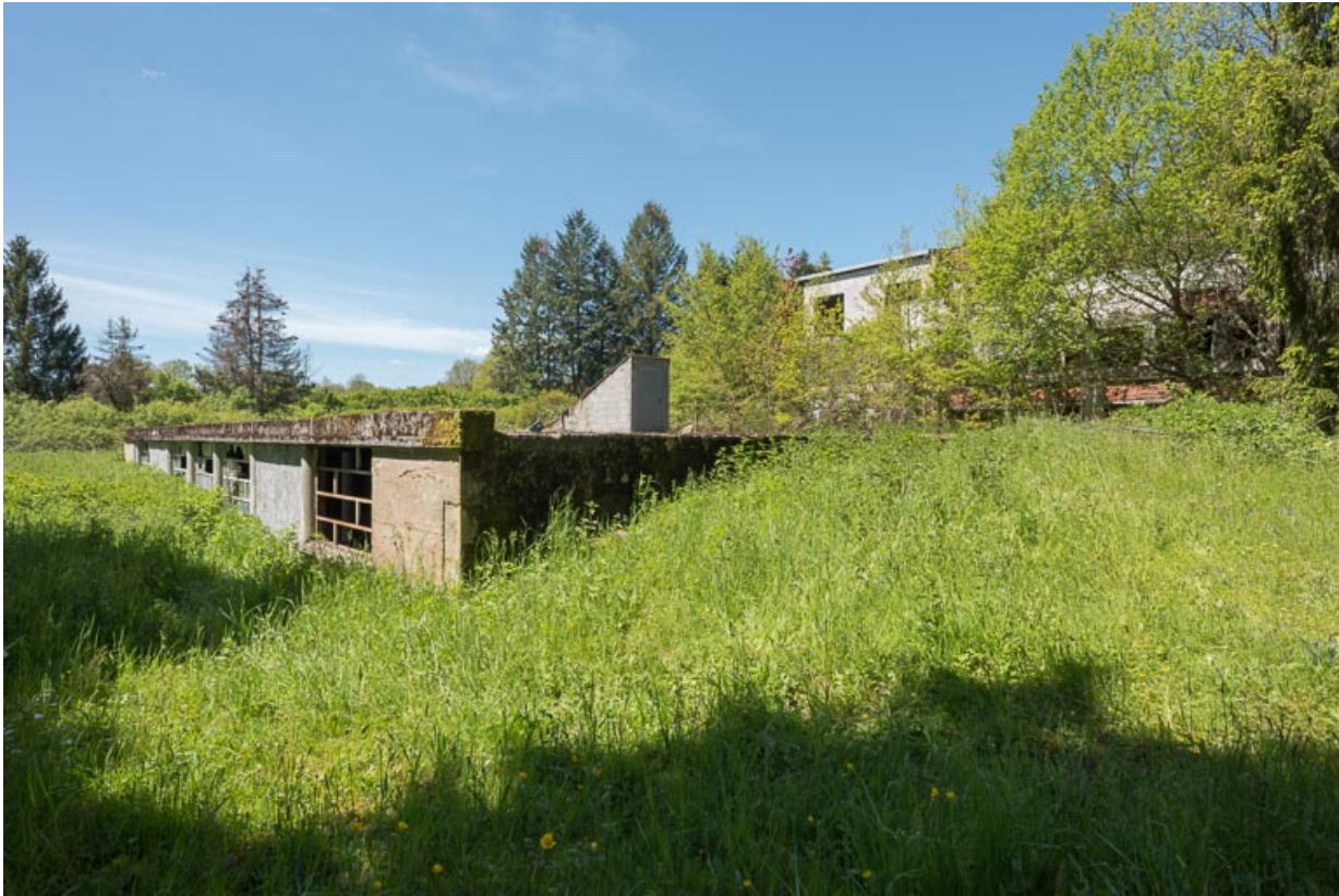
Aménagement du captage de la source, vue extérieure de trois-quarts.

21, R.D.17 Magnien rue de la Source, lieudit : écart de Maizières