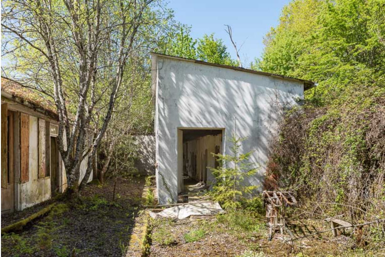
Bâtiment des bains, vue extérieure.

21, R.D.17 Magnien rue de la Source, lieudit : écart de Maizières