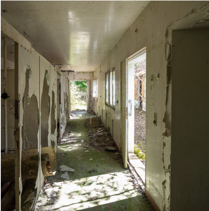
Bâtiment des bains, vue intérieure avec alignement des cabines.

21, R.D.17 Magnien rue de la Source, lieudit : écart de Maizières