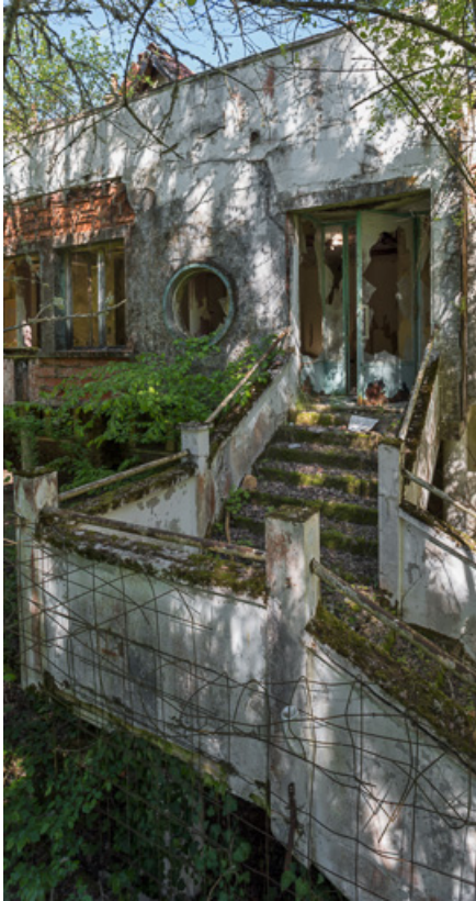
Bâtiment principal, façade antérieure, porte d'entrée précédée de son perron. 21, R.D.17 Magnien rue de la Source, lieudit : écart de Maizières

N° de l'illustration : 20192100058NUC4AQ