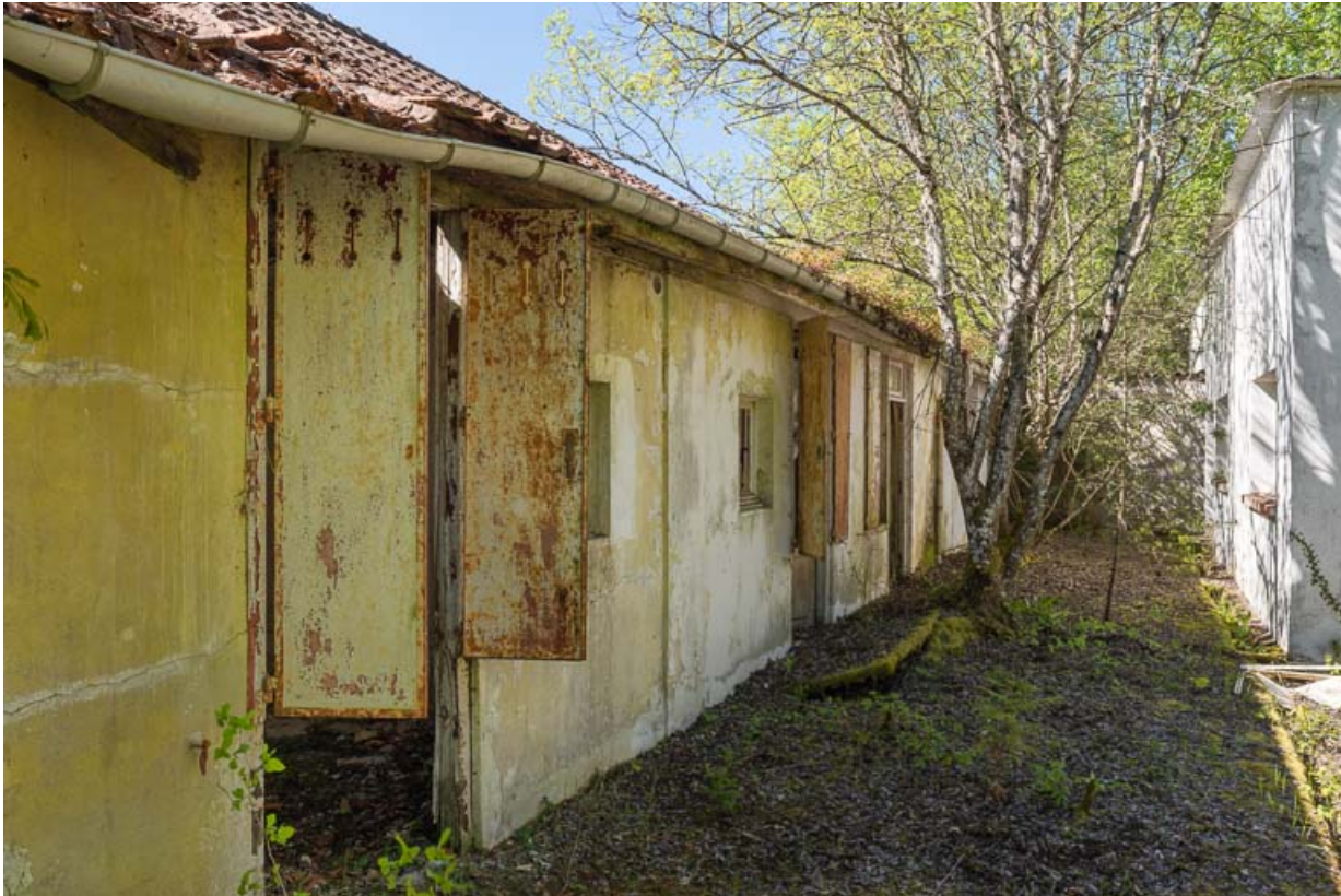
Bâtiment des logements des curistes, vue arrière de trois-quarts avec le bâtiment des bains en face.

21, R.D.17 Magnien rue de la Source, lieudit : écart de Maizières