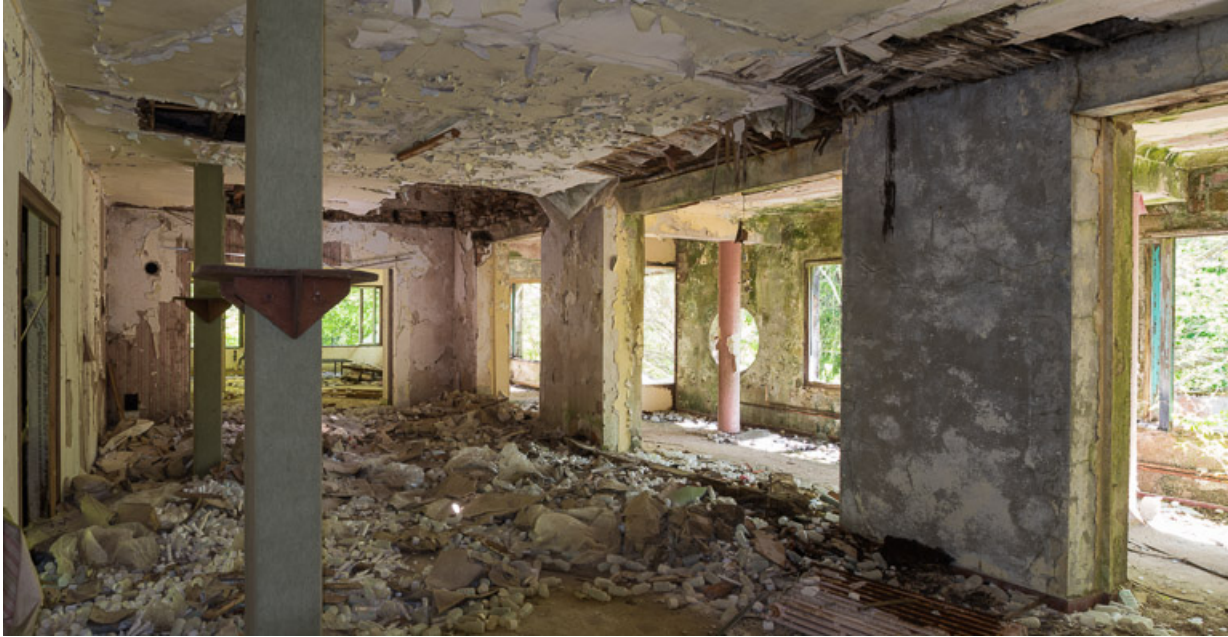
Bâtiment principal, vue intérieure de la salle commune au rez-de-chaussée. 21, R.D.17 Magnien rue de la Source, lieudit : écart de Maizières

N° de l'illustration : 20192100068NUC4AQ