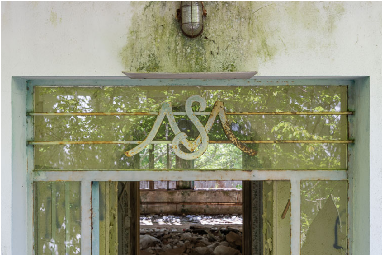
Bâtiment principal, façade postérieure, porte d'entrée, détail.

21, R.D.17 Magnien rue de la Source, lieudit : écart de Maizières