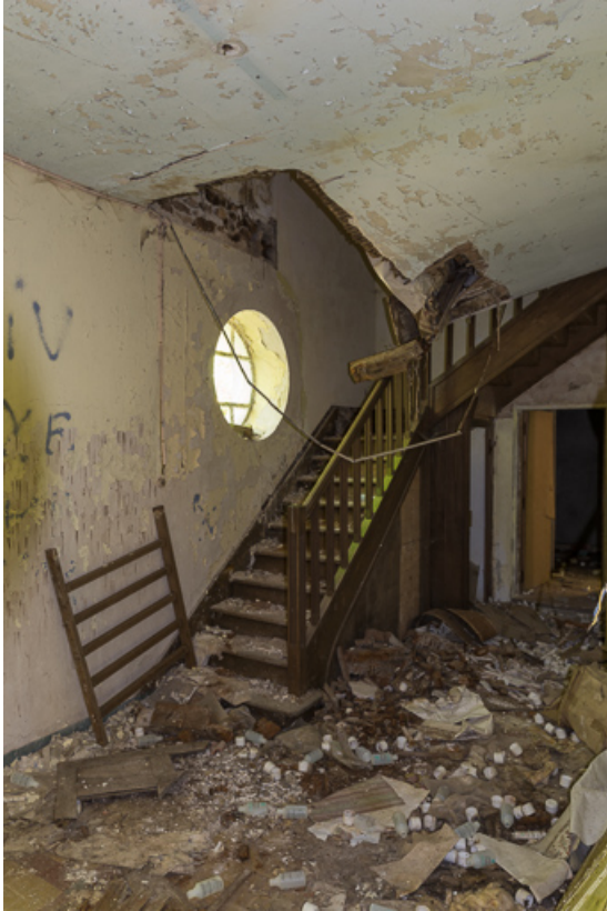
Bâtiment principal, vue intérieure du hall avec l'escalier en bois de l'édifice d'origine.

21, R.D.17 Magnien rue de la Source, lieudit : écart de Maizières