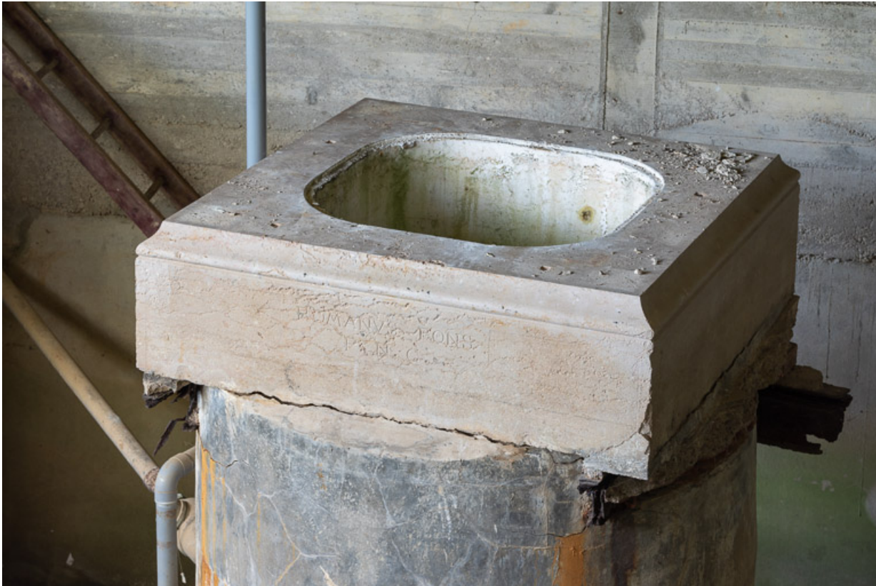
Aménagement du captage de la source, détail du socle de l'ancien temple avec l'inscription FONS ROMANUS. 21, R.D.17 Magnien rue de la Source, lieudit : écart de Maizières