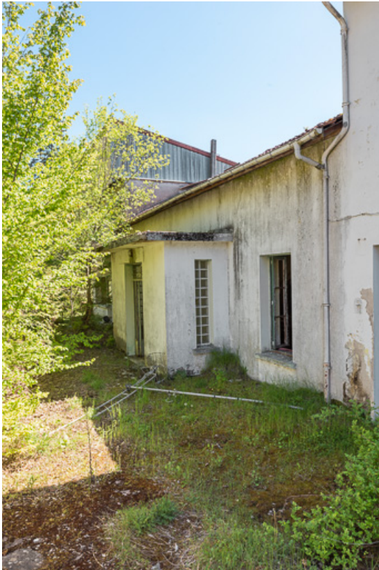
Bâtiment principal, façade postérieure, vue de trois-quarts avec l'entrée en saillie.

21, R.D.17 Magnien rue de la Source, lieudit : écart de Maizières