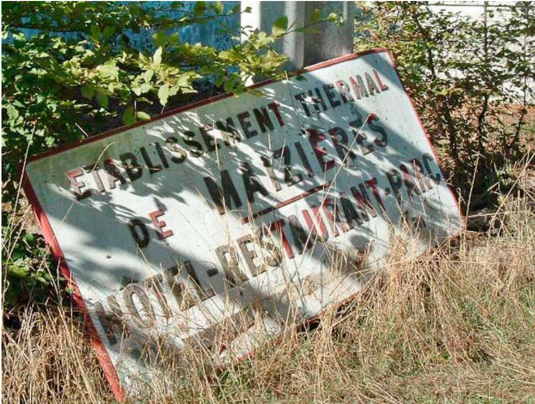
Panneau (ETABLISSEMENT THERMAL DE MAIZIERES HOTEL RESTAURANT).

21, R.D.17 Magnien rue de la Source, lieudit : écart de Maizières