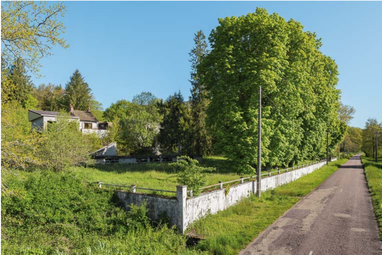
Vue de trois-quarts depuis le sud-ouest.

21, R.D.17 Magnien rue de la Source, lieudit : écart de Maizières