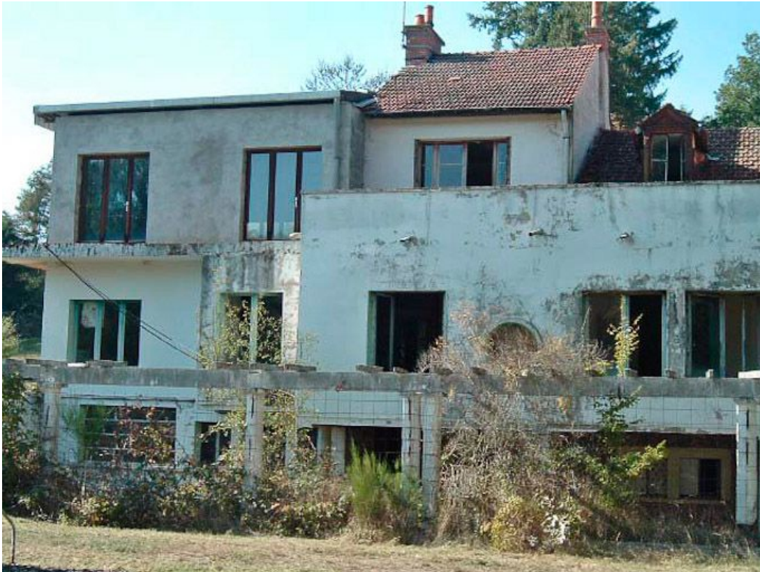
Bâtiment principal, façade antérieure, partie gauche.

21, R.D.17 Magnien rue de la Source, lieudit : écart de Maizières