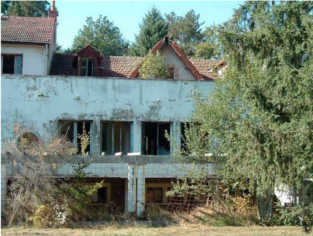
Bâtiment principal, façade antérieure, partie droite.

21, R.D.17 Magnien rue de la Source, lieudit : écart de Maizières