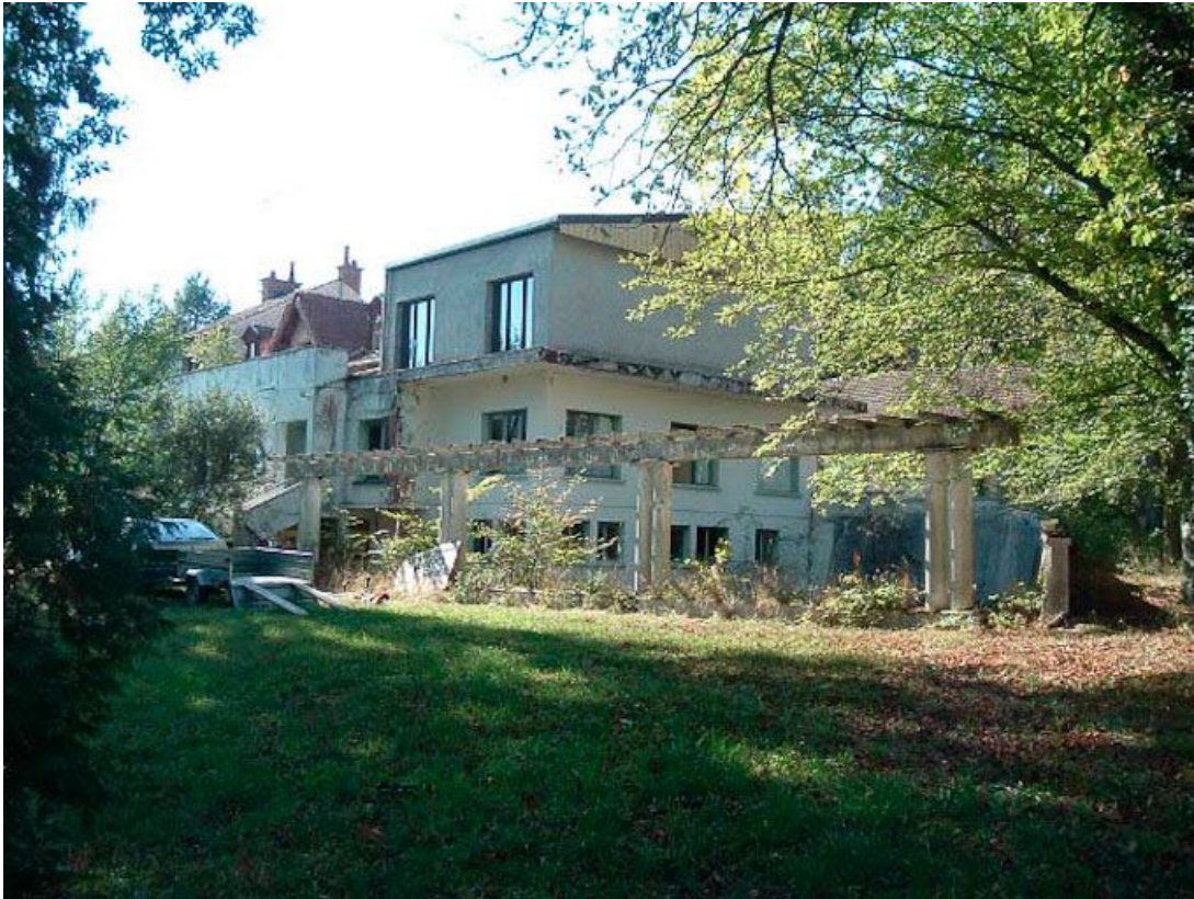
Vue d'ensemble de la façade antérieure, avec pergola au premier plan.

21, R.D.17 Magnien rue de la Source, lieudit : écart de Maizières