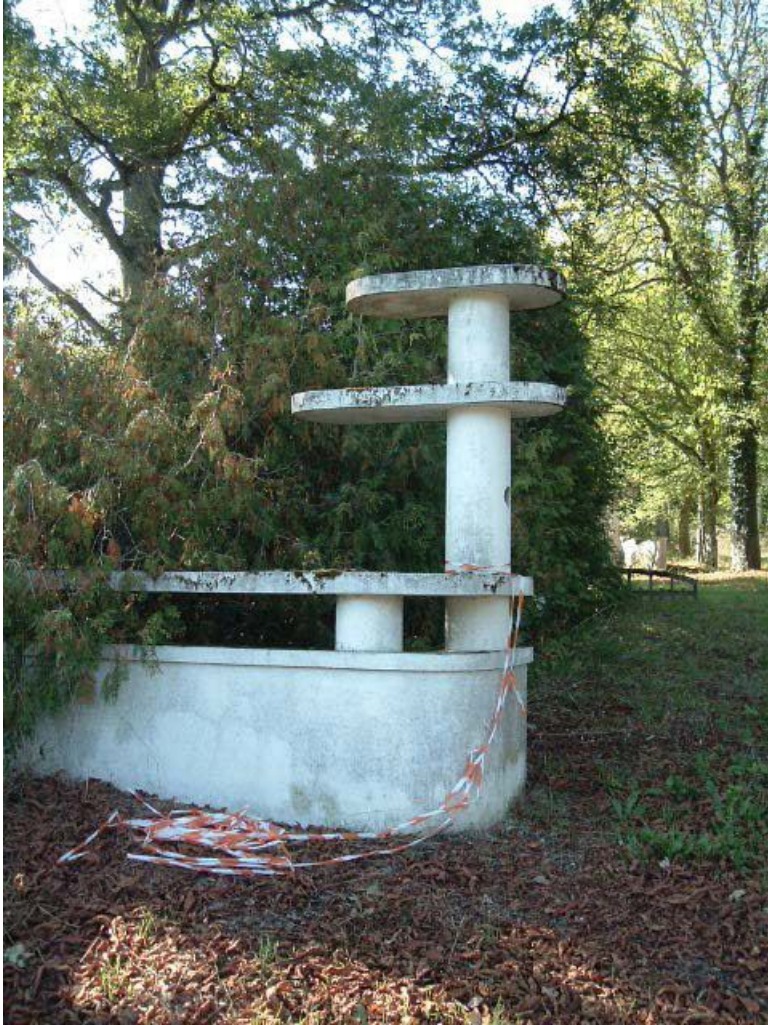
Portail d'entrée, poteau de gauche.

21, R.D.17 Magnien rue de la Source, lieudit : écart de Maizières