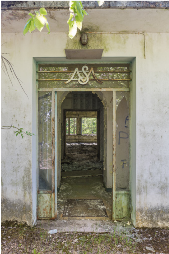
Bâtiment principal, façade postérieure, porte d'entrée.

21, R.D.17 Magnien rue de la Source, lieudit : écart de Maizières