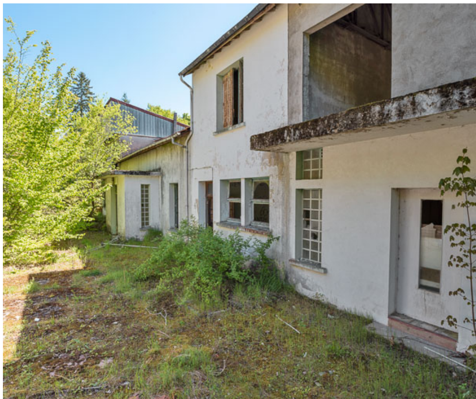
Bâtiment principal, façade postérieure, vue de trois-quarts.

21, R.D.17 Magnien rue de la Source, lieudit : écart de Maizières