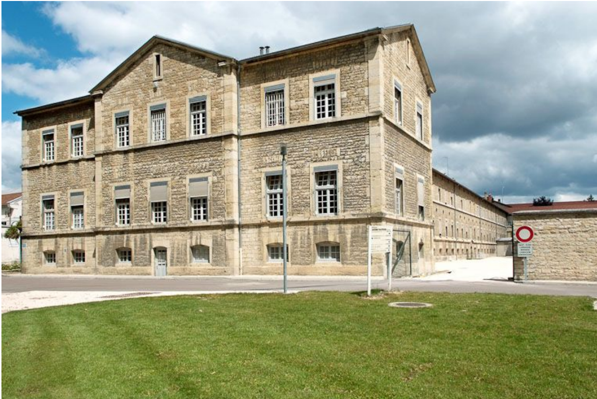
Aile est de l'asile d'aliénés.