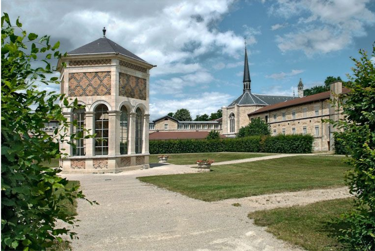
Cour de l'asile d'aliénés et édicule abritant le Puits de Moïse.