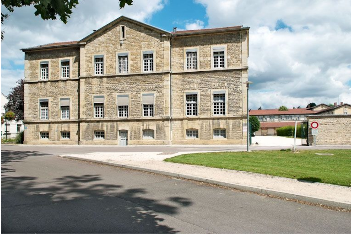
Aile est de l'asile d'aliénés.