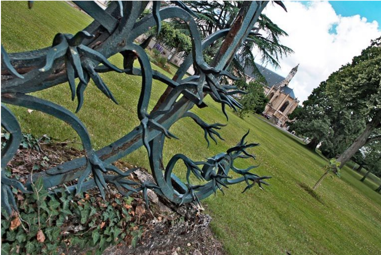
Ferronnerie ouvragée au pied des piliers du portail de l'hôtellerie.