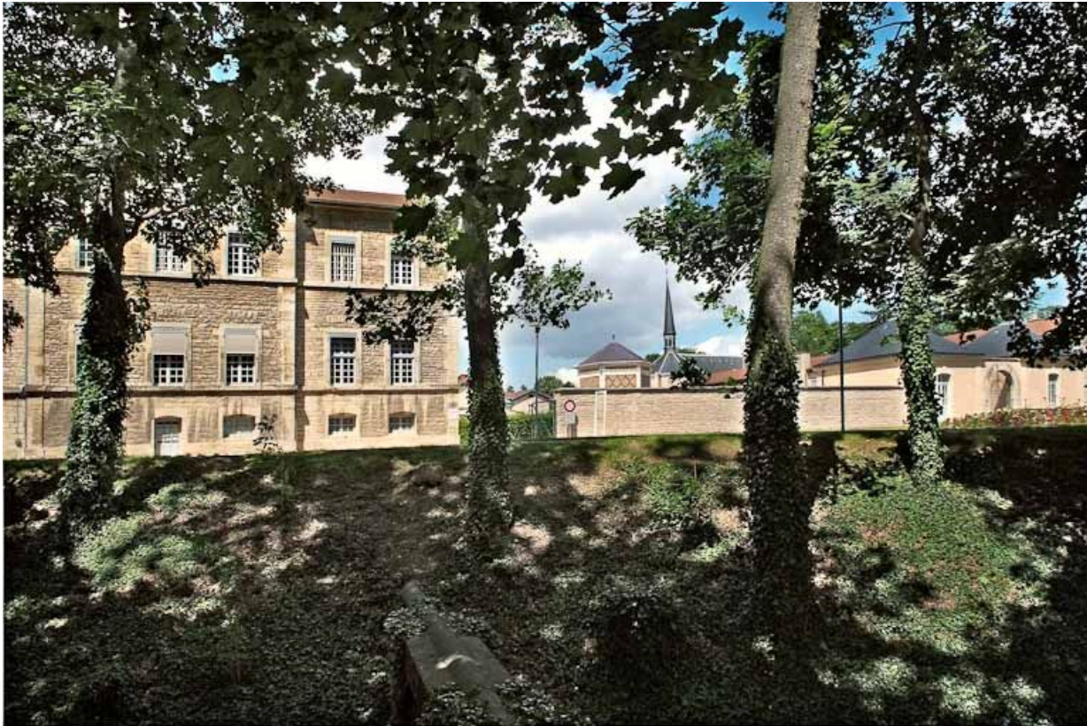
Aile est de l'asile d'aliénés : vue depuis le parc.