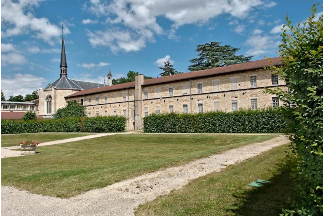
Cour de l'asile d'aliénés : vue vers l'aile ouest.