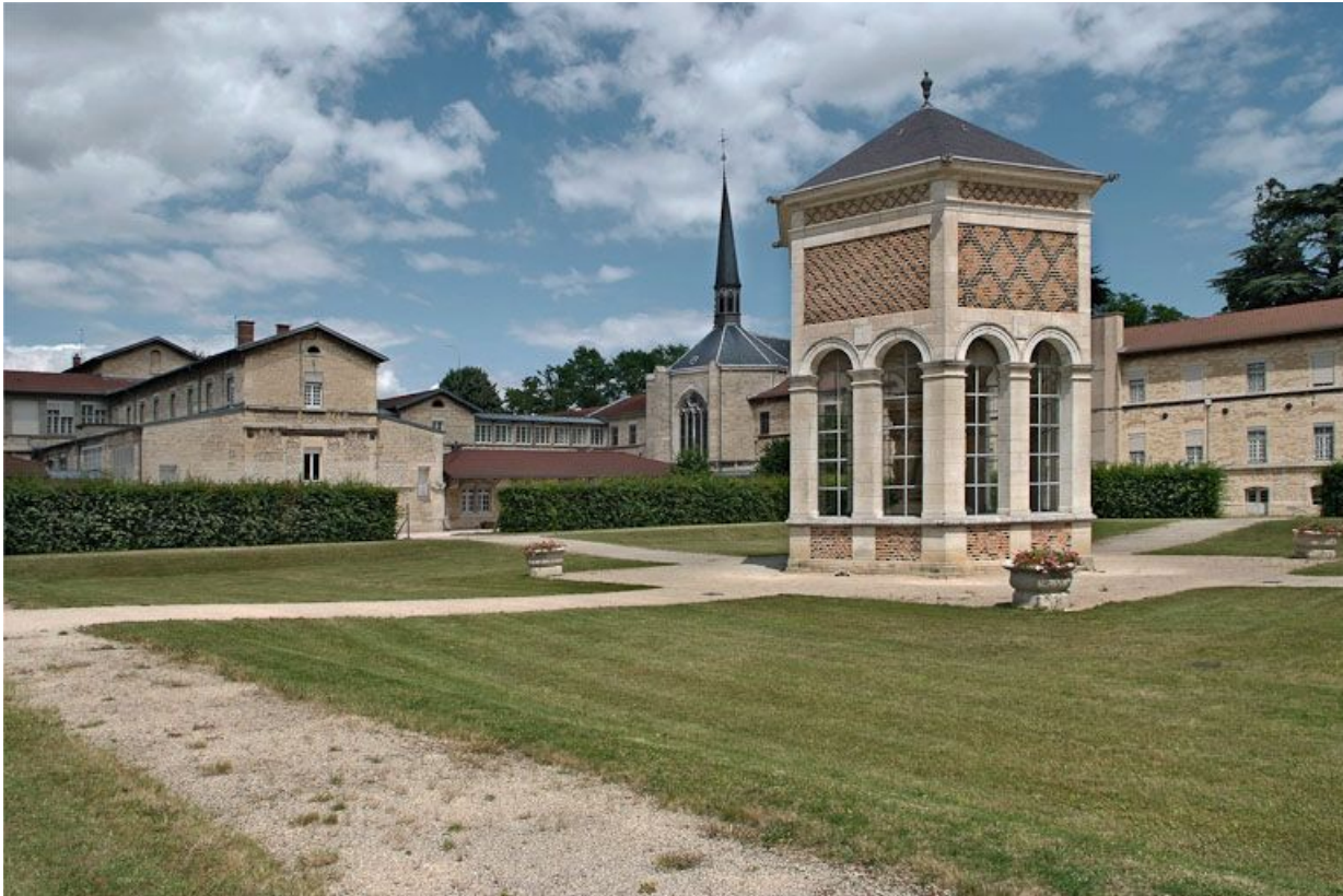
Cour de l'asile d'aliénés et édicule abritant le Puits de Moïse.