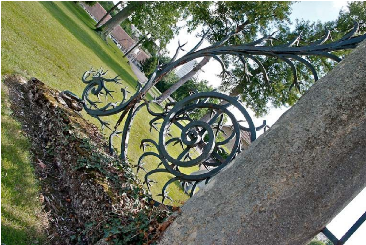
Ferronnerie ouvragée au pied des piliers du portail de l'hôtellerie.