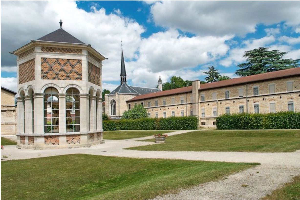
Cour de l'asile d'aliénés et édicule abritant le Puits de Moïse.