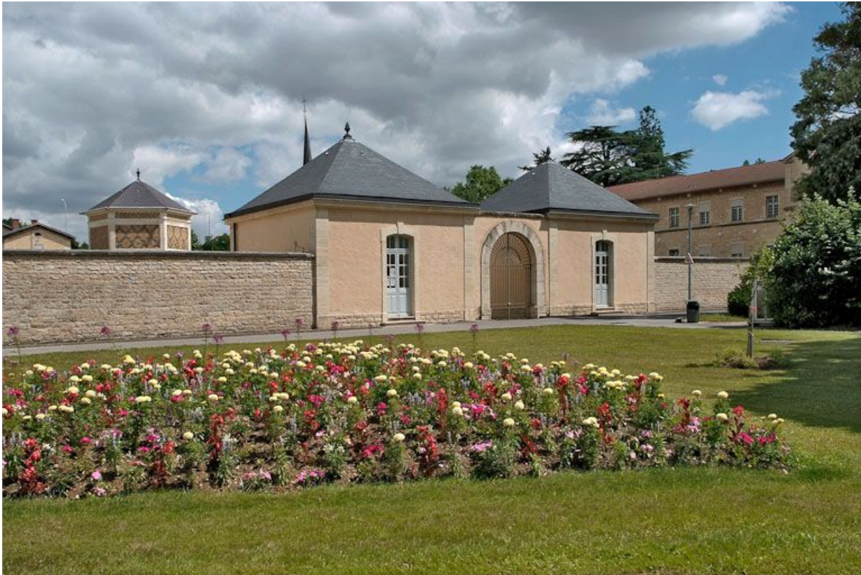
Grille et pavillons d'entrée de l'asile d'aliénés.