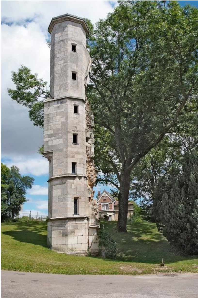
Tourelle d'escalier de l'ancien oratoire.