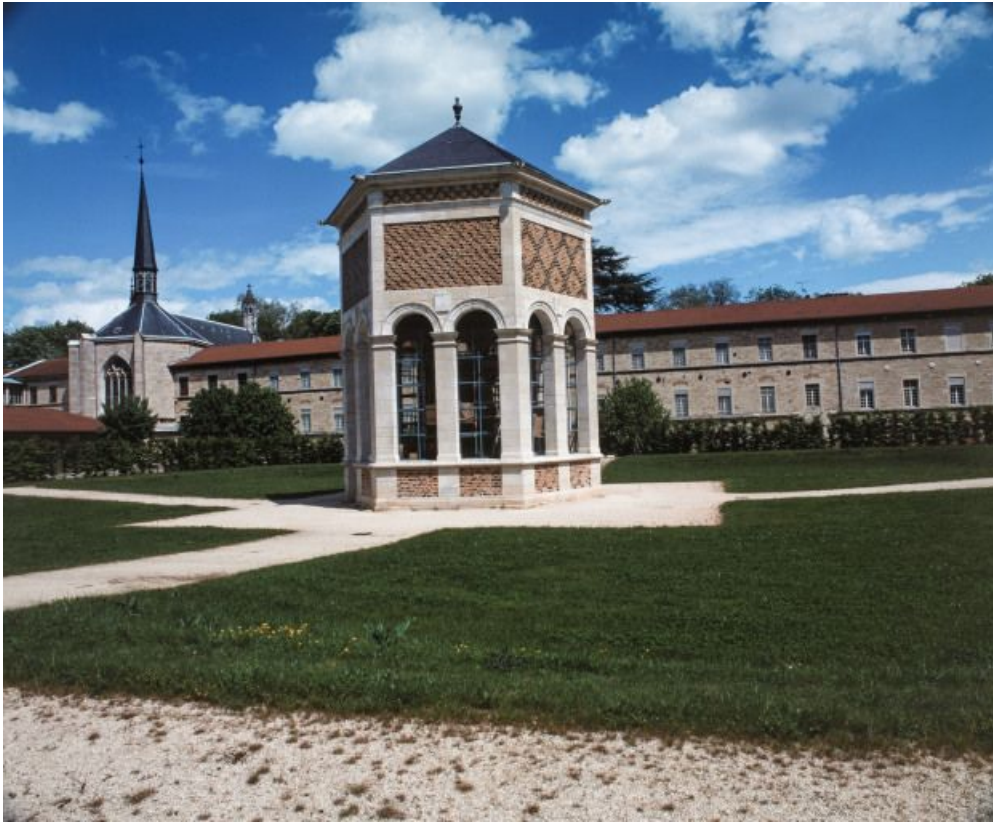
Aile droite du bâtiment construit par l'architecte Pierre-Paul Petit, et édicule abritant le Puits de Moïse au premier plan. 21, Dijon, 1 boulevard Chanoine Kir