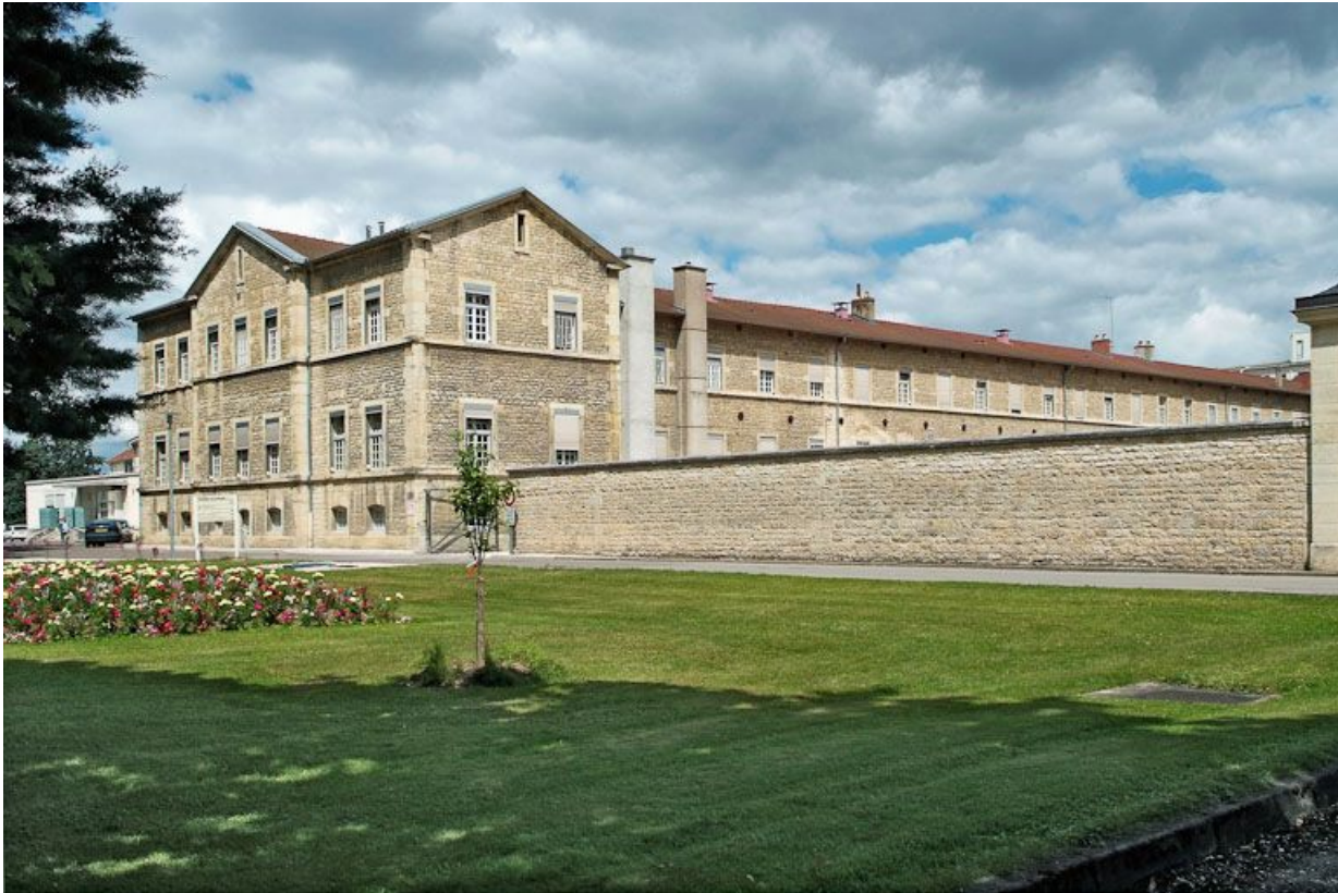
Aile est de l'asile d'aliénés et mur de clôture.