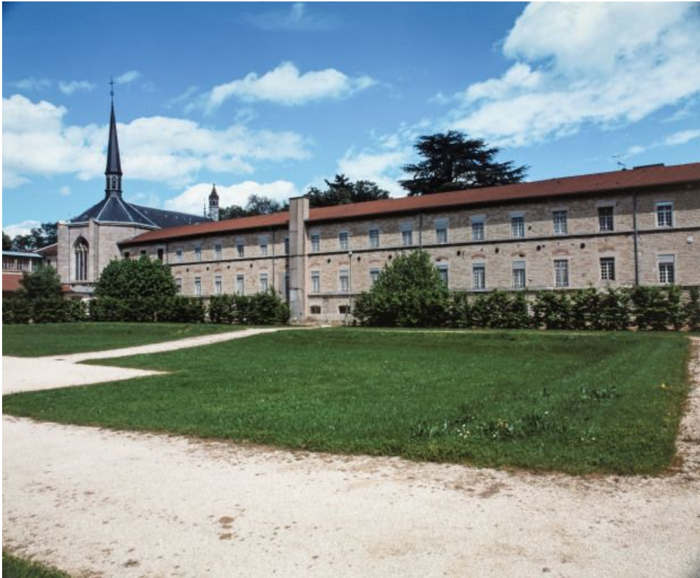
Aile droite du bâtiment construit par l'architecte Pierre-Paul Petit.