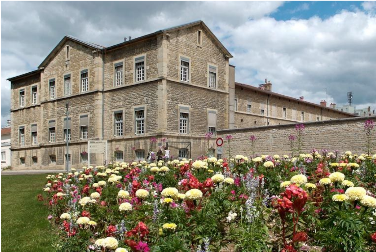
Aile est de l'asile d'aliénés.