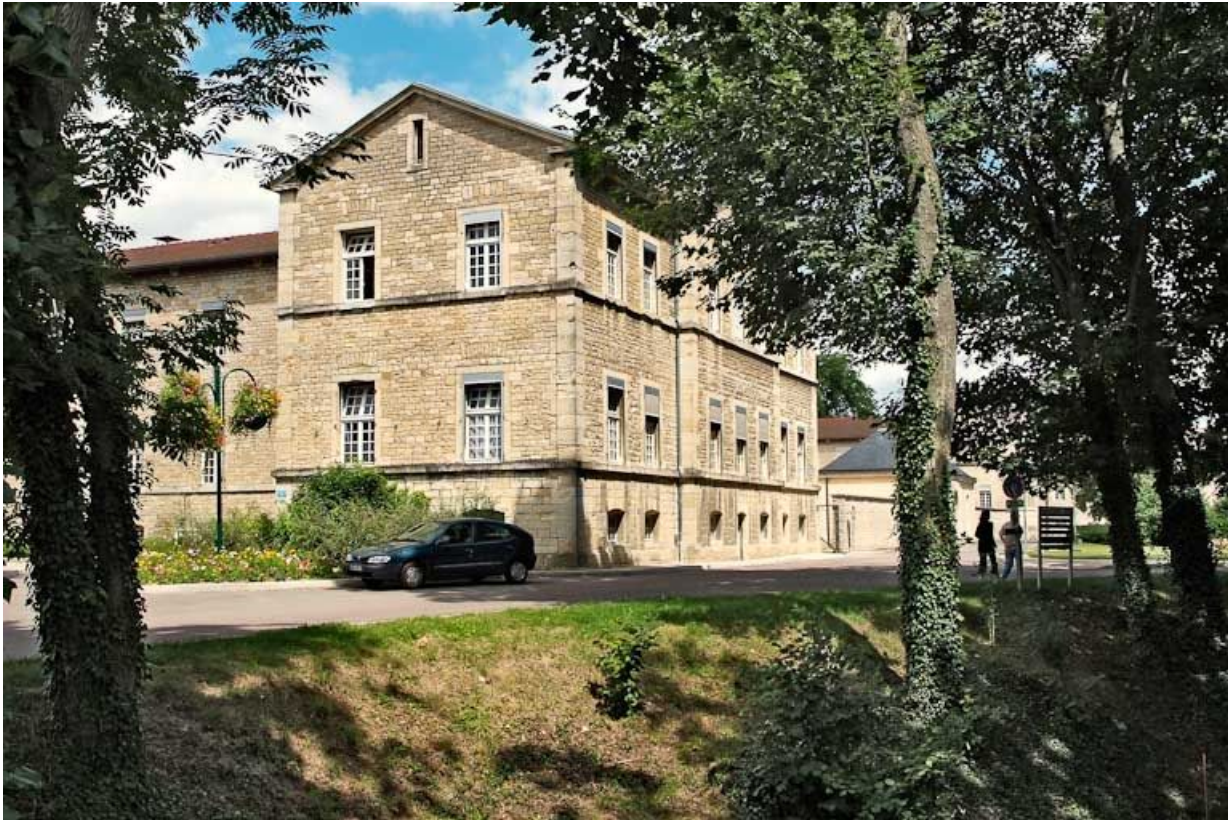
Aile est de l'asile d'aliénés et parc.