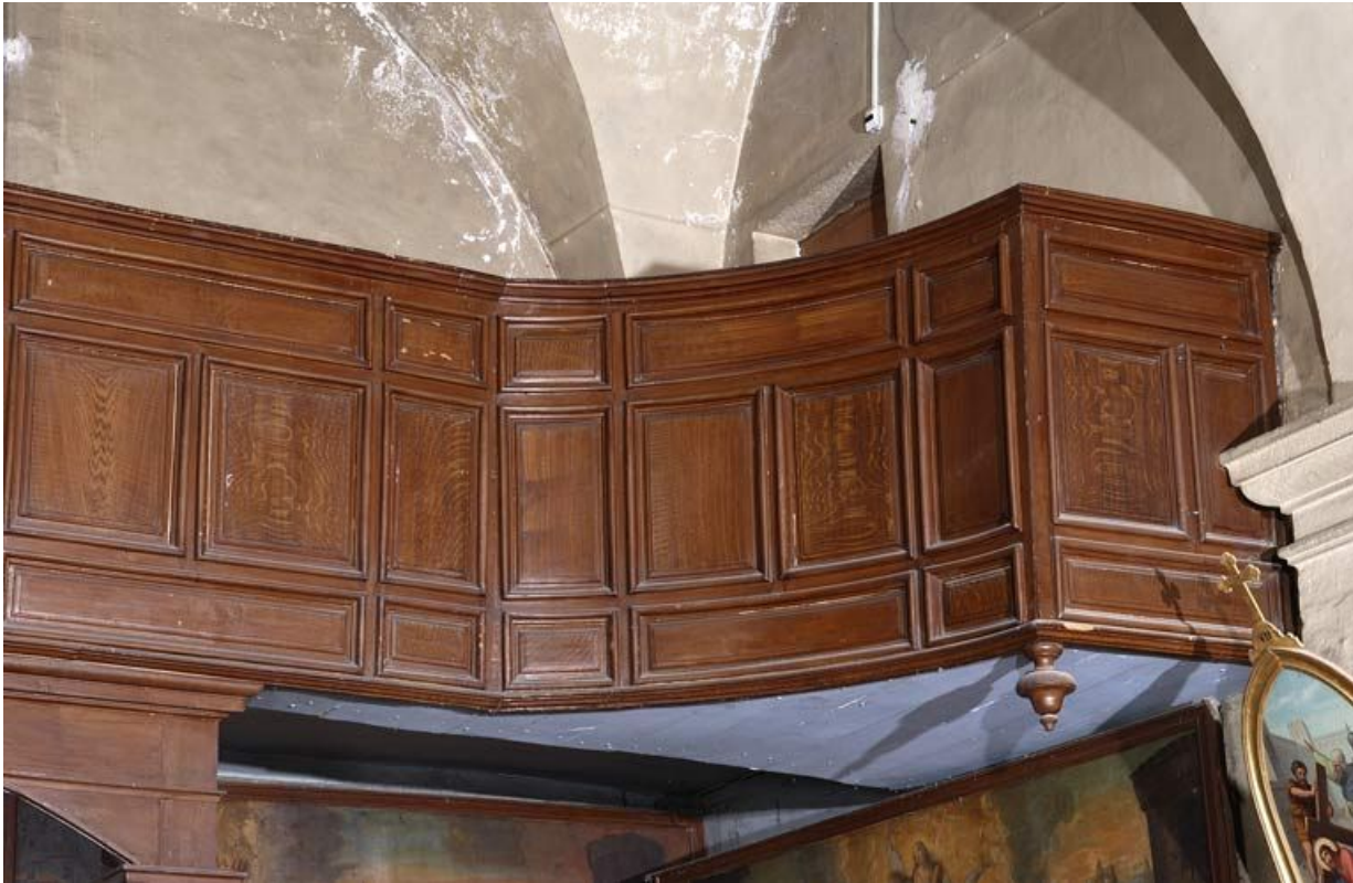
Chapelle : tribune.