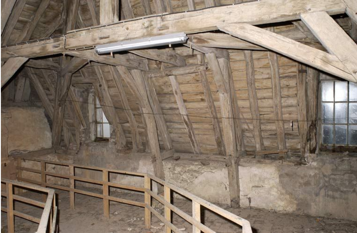
Corps de bâtiment principal : charpente au-dessus de la salle Sainte-Cécile (croupe). 21, Alise-Sainte-Reine Bains