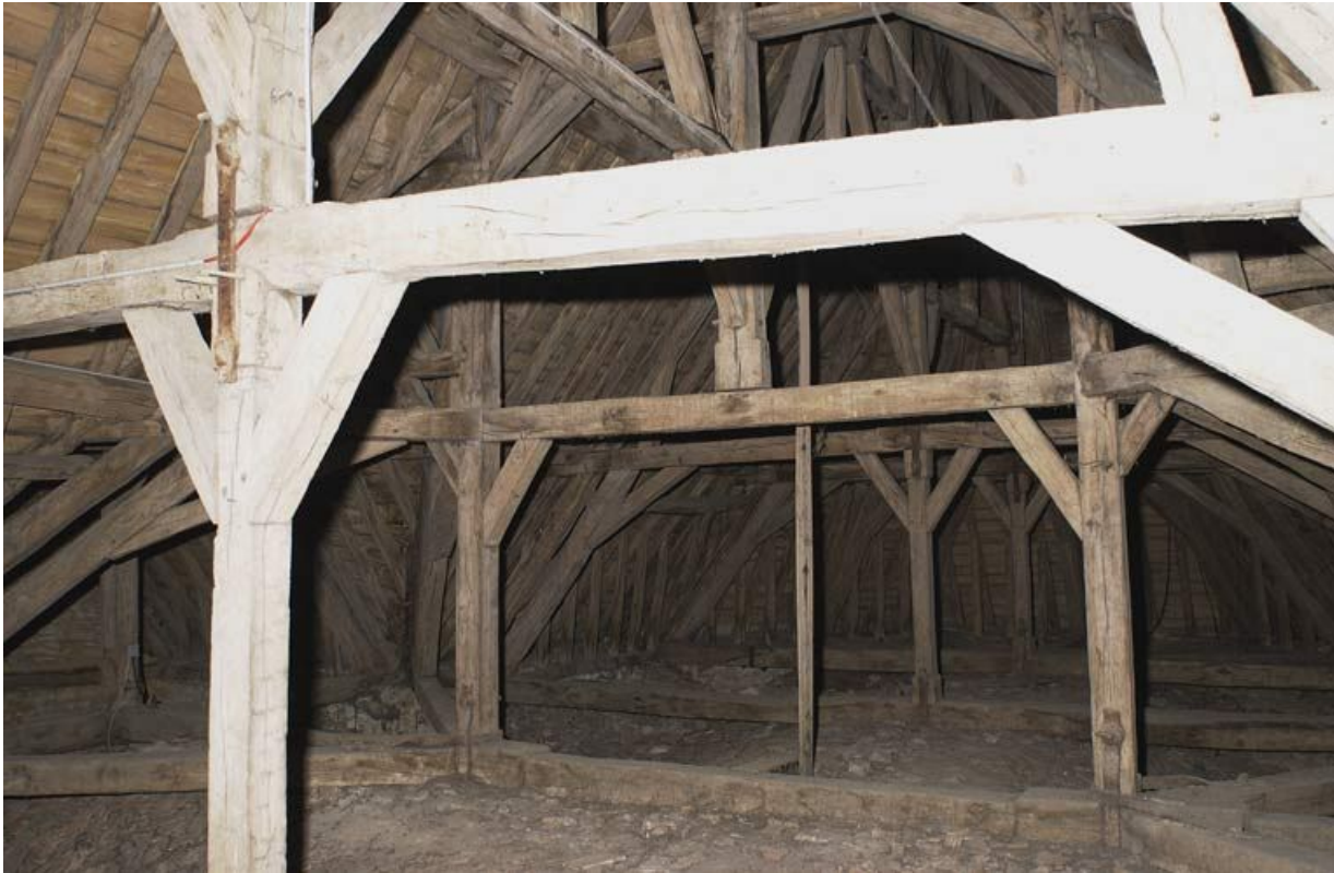
Chapelle : charpente.