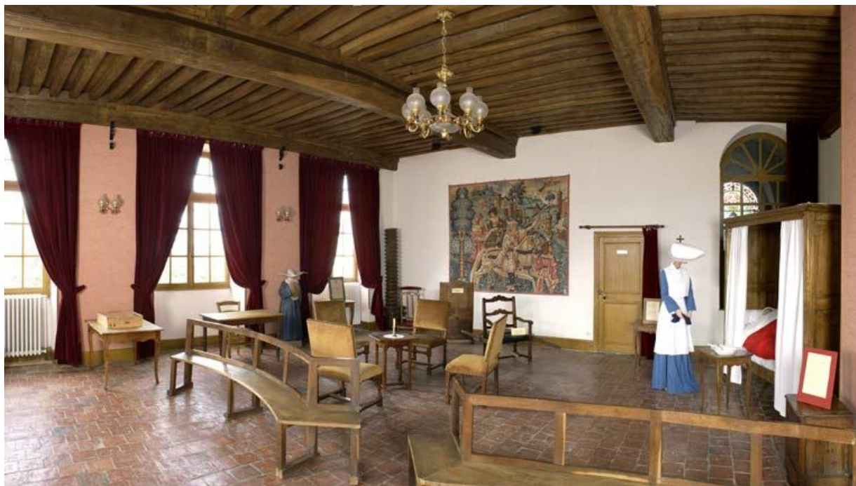
Corps de bâtiment principal : salle Sainte-Cécile (fenêtres ouest et baie en plein-cintre donnant sur la chapelle). 21, Alise-Sainte-Reine Bains