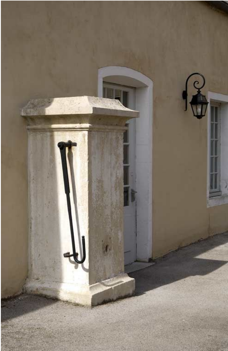
Bâtiment des bains du XVIII e siècle : fontaine (contre la façade est). 21, Alise-Sainte-Reine Bains