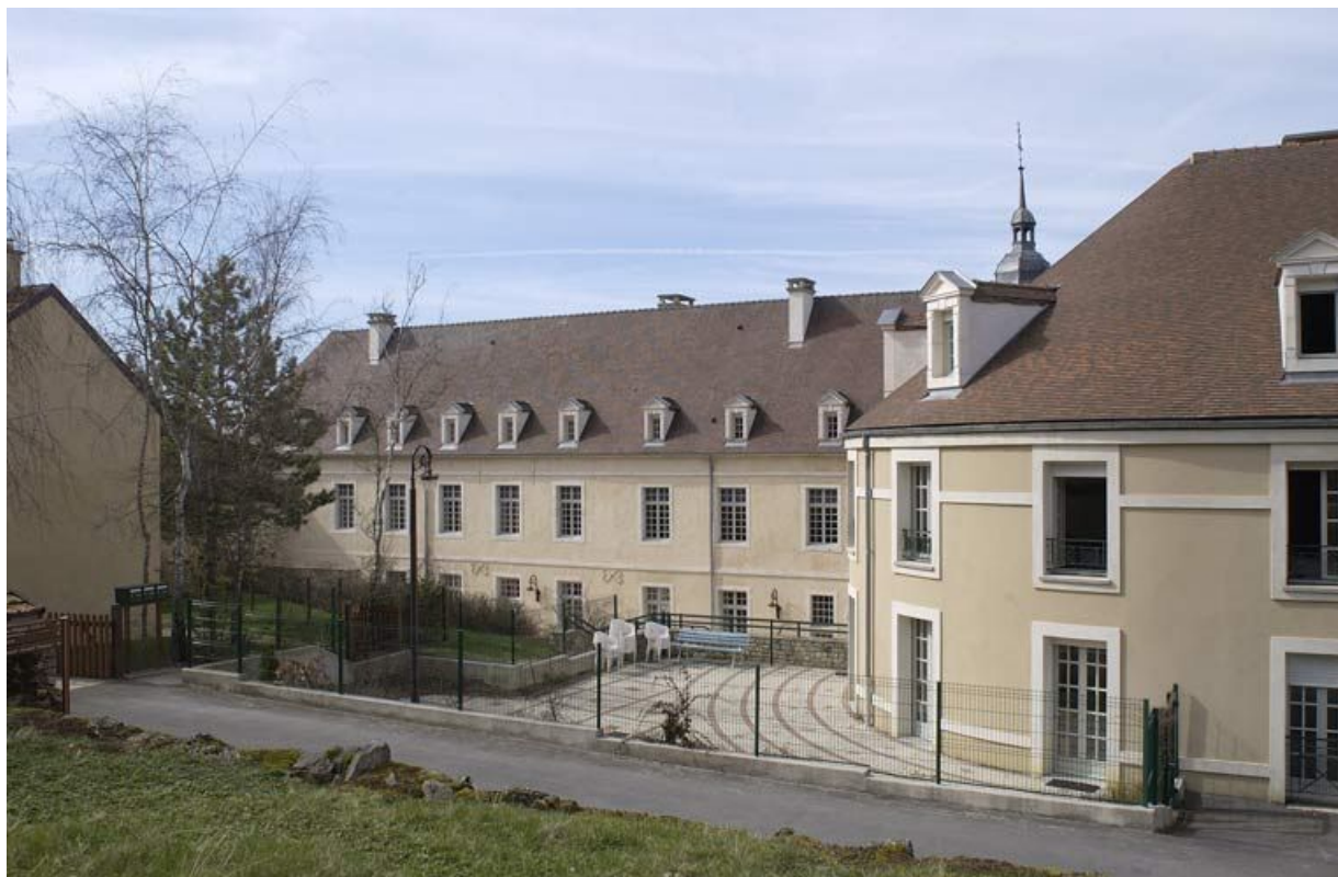
Elévation est de l'aile dite "le grand corps de logis" et bâtiment circulaire (XXe siècle). 21, Alise-Sainte-Reine Bains