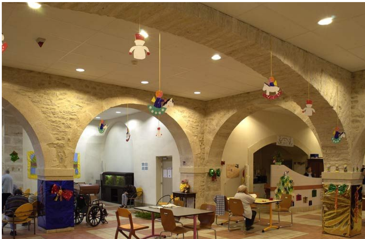
Corps de bâtiment principal : salle des malades (à l'est de la chapelle). 21, Alise-Sainte-Reine Bains