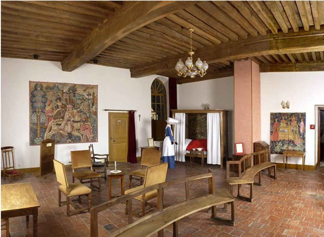
Corps de bâtiment principal : salle Sainte-Cécile (étage).