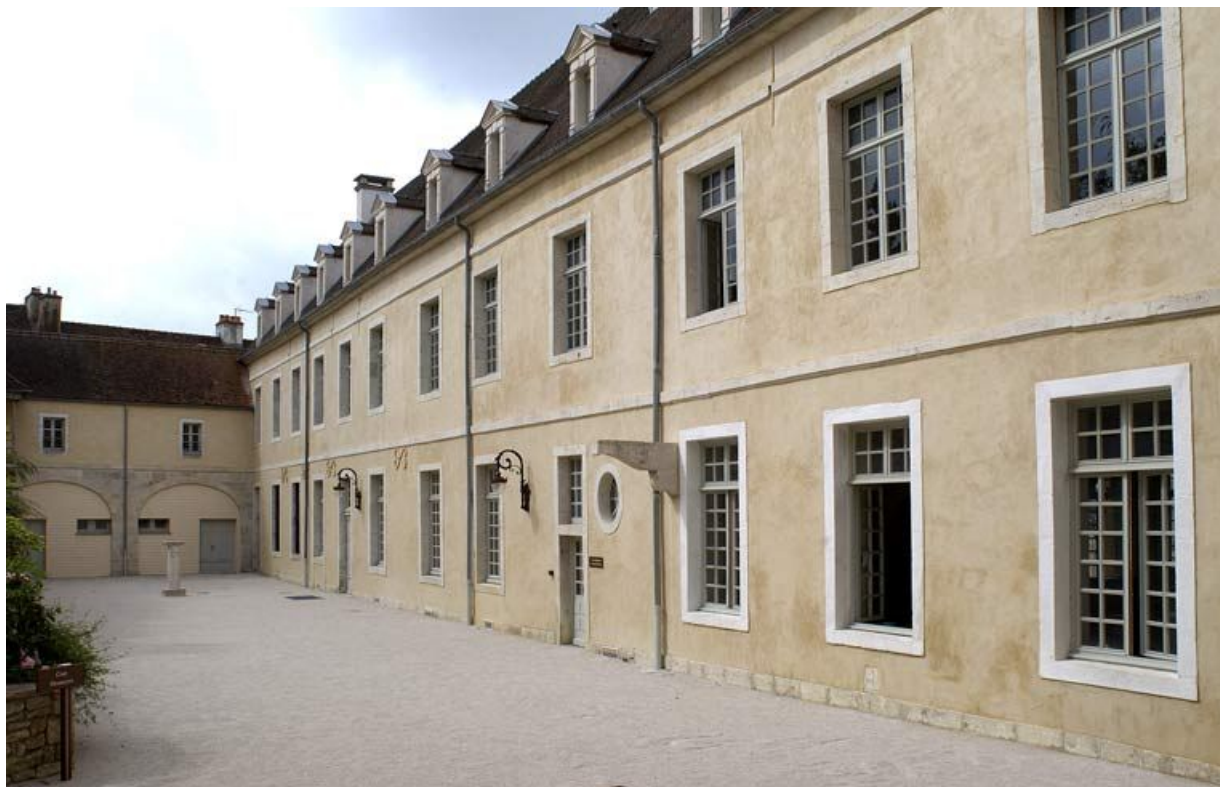
Cour dite des cuisines : élévation est de l'aile droite dite "le grand corps de logis".