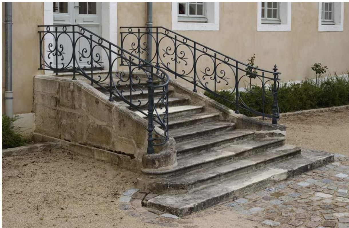
Cour antérieure : degré droit donnant accès à l'aile droite dite "le grand corps de logis". 21, Alise-Sainte-Reine Bains