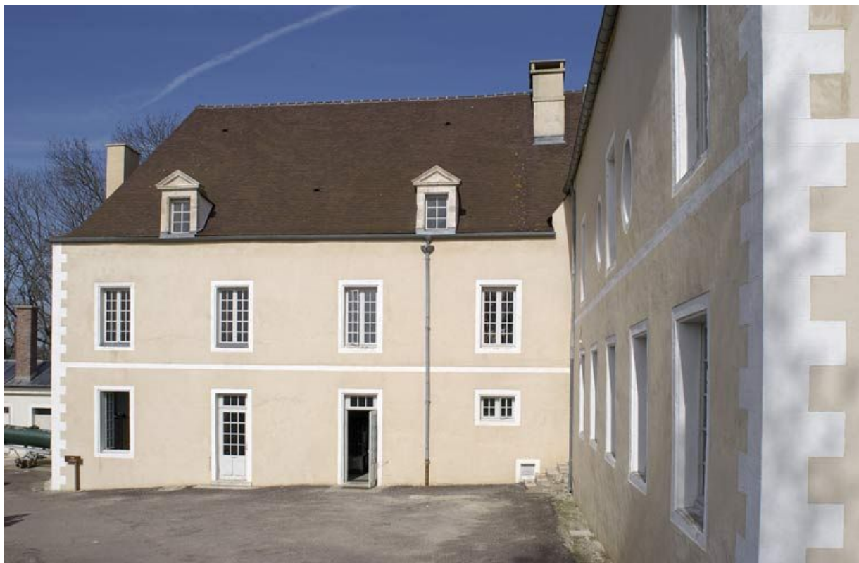
Cour des Bains : bâtiment des bains du XVII e siècle (élévation sud). 21, Alise-Sainte-Reine Bains