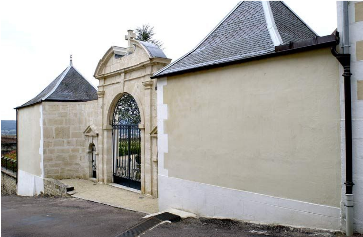
Portail à porte cochère et portes piétonnes entre deux pavillons (côté rue). 21, Alise-Sainte-Reine Bains