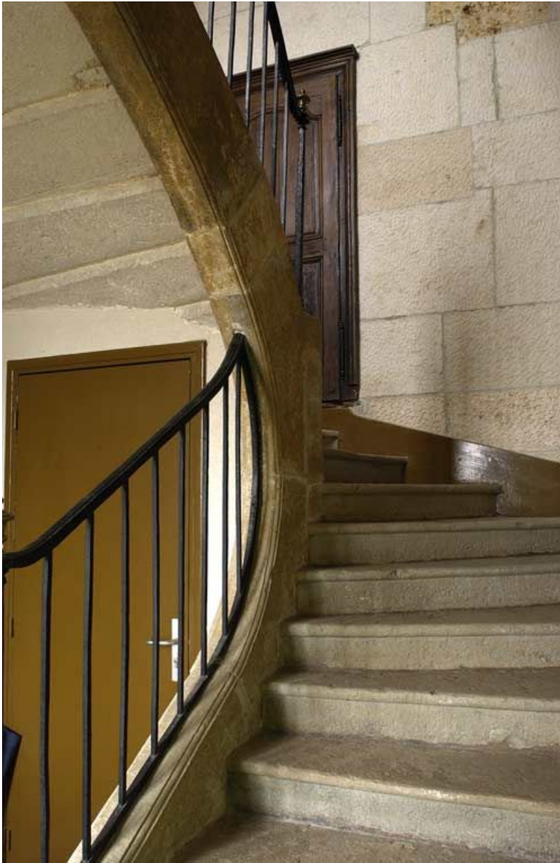
Bâtiment des bains du XVII e siècle : escalier.