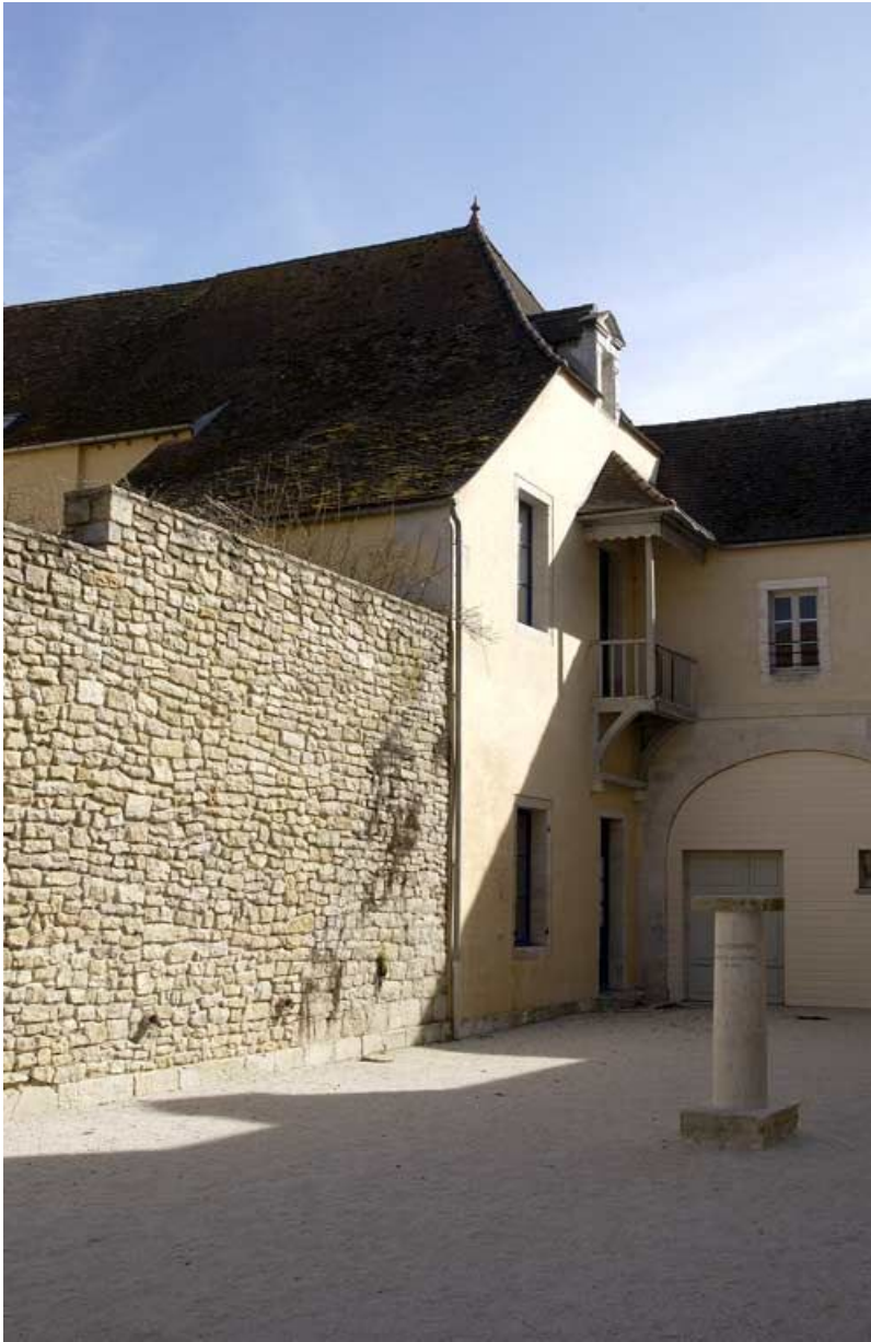
Cour dite des cuisines : la boulangerie (au sud de la cour). 21, Alise-Sainte-Reine Bains