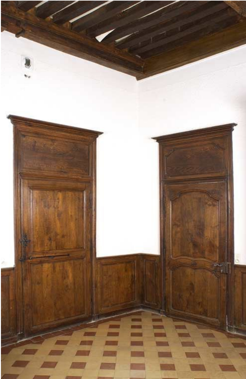
Bâtiment de la communauté des sœurs, réfectoire : porte de la cuisine (à gauche), et du couloir (à droite). 21, Alise-Sainte-Reine Bains