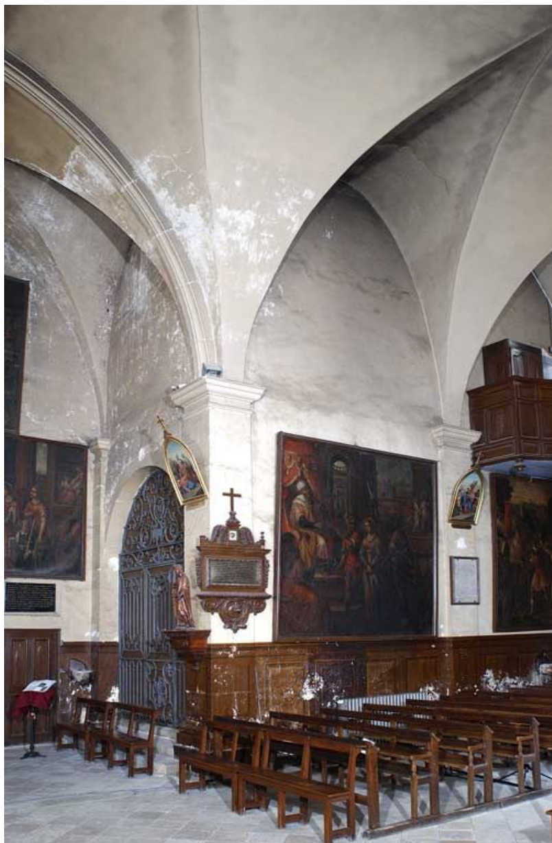
Chapelle : angle du bras droit du transept et de la nef.