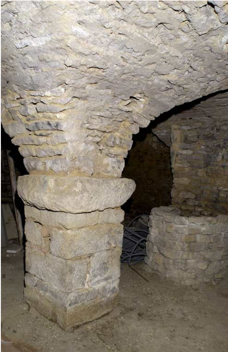
Bâtiment dit salles du Chapelet, en bordure de la rue de l'hôpital : pilier et puits en sous-sol. 21, Alise-Sainte-Reine Bains