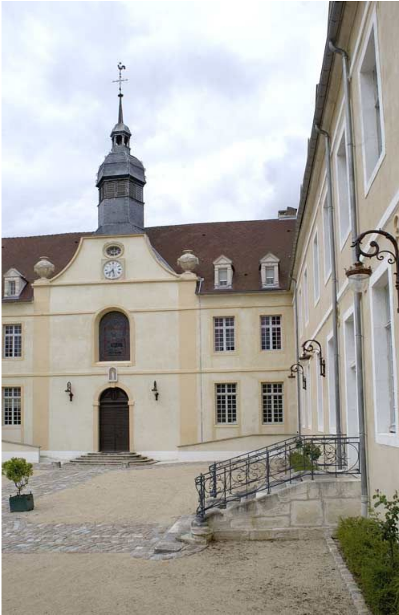
Cour antérieure : corps de bâtiment principal et aile droite (vue partielle). 21, Alise-Sainte-Reine Bains