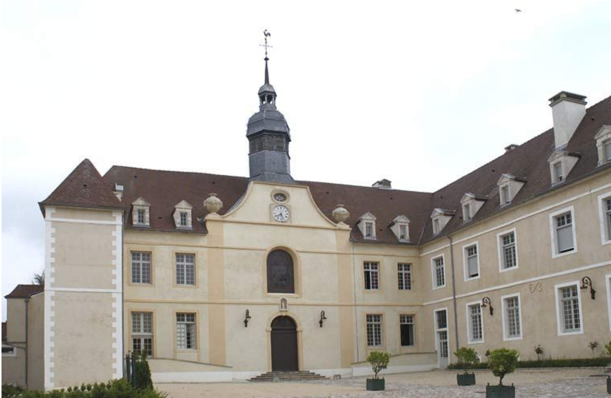
Cour antérieure : élévation antérieure du corps de bâtiment principal et vue partielle de l'aile droite. 21, Alise-Sainte-Reine Bains