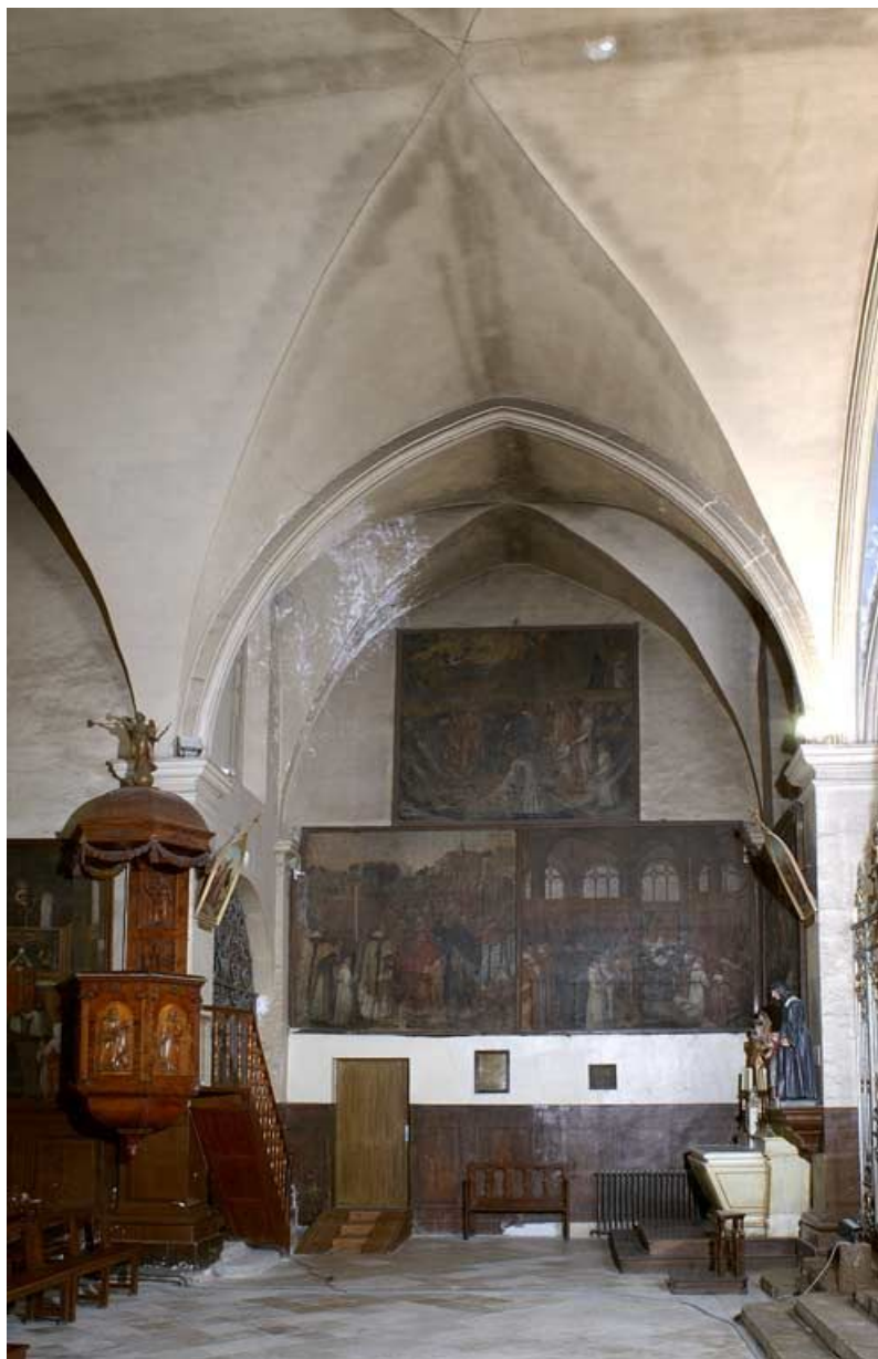
Chapelle : bras gauche du transept.