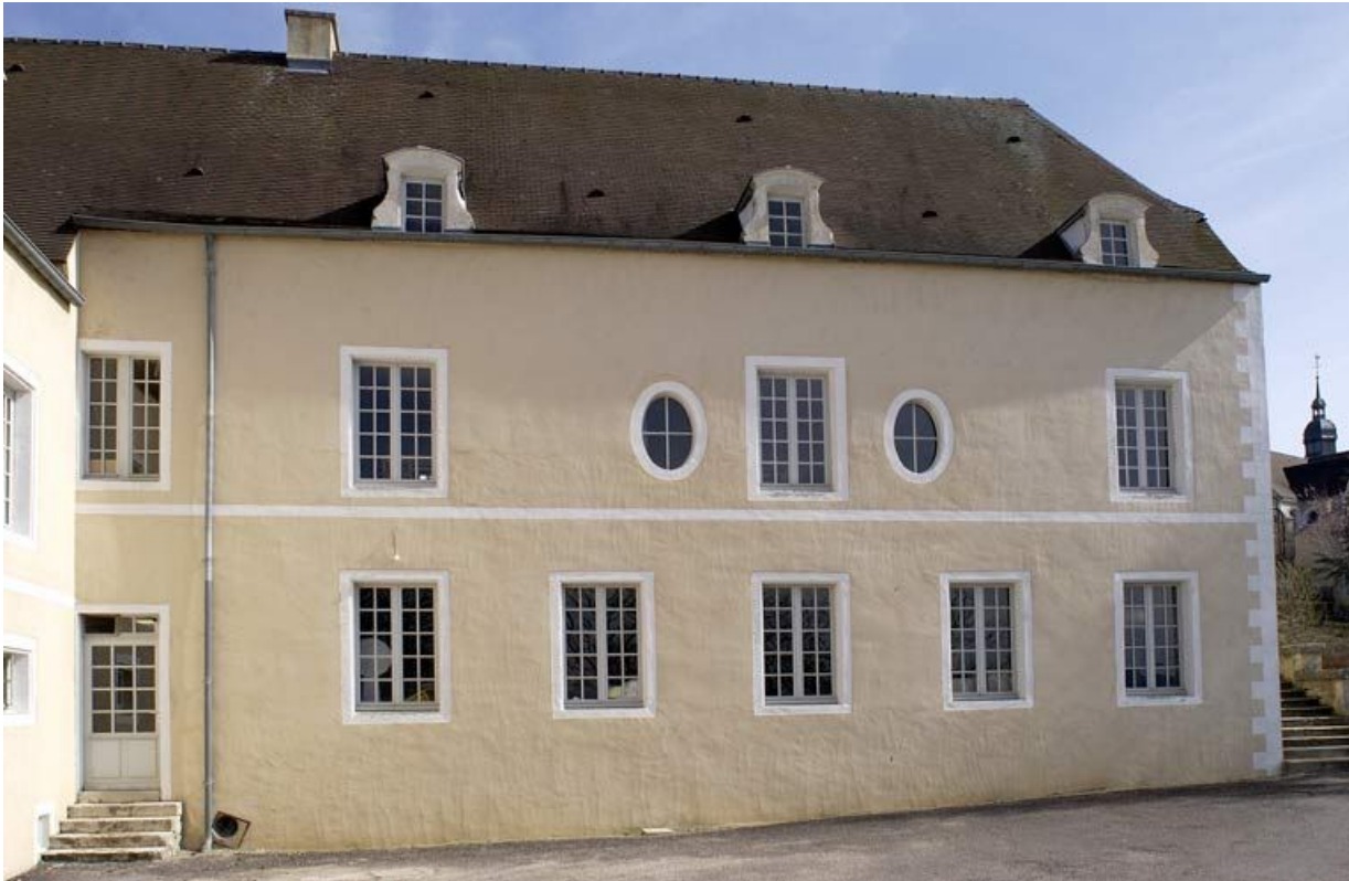
Cour des Bains : bâtiment des bains du XVII e siècle (élévation ouest). 21, Alise-Sainte-Reine Bains