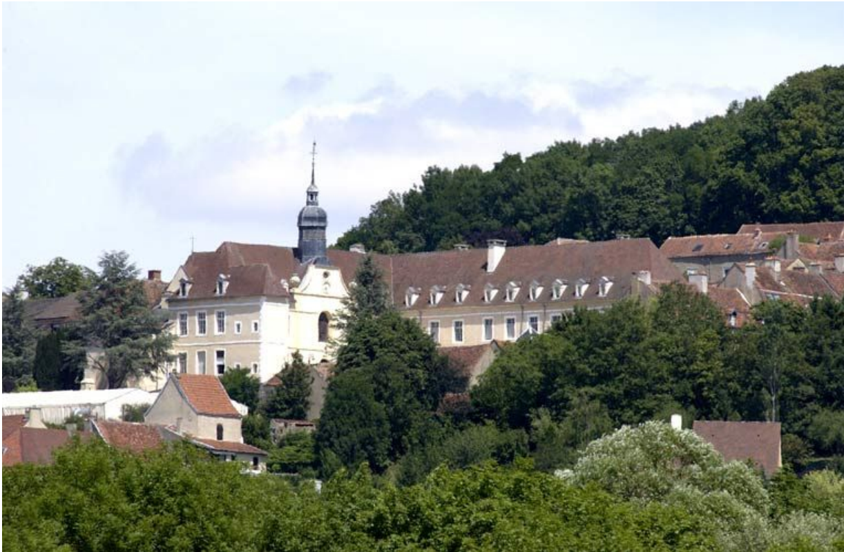
Vue d'ensemble des bâtiments qui encadrent la cour antérieure (prise du sud-ouest). 21, Alise-Sainte-Reine Bains