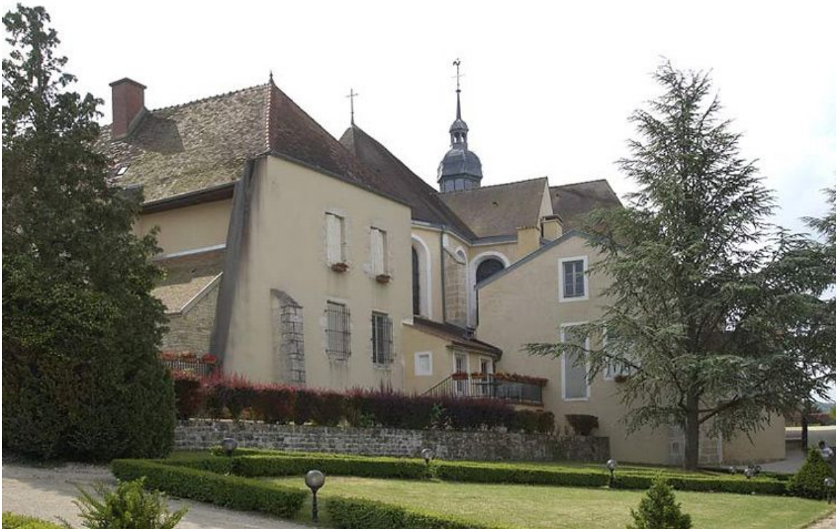
Bâtiment de la communauté des soeurs (au nord de la chapelle), mur latéral droit. 21, Alise-Sainte-Reine Bains