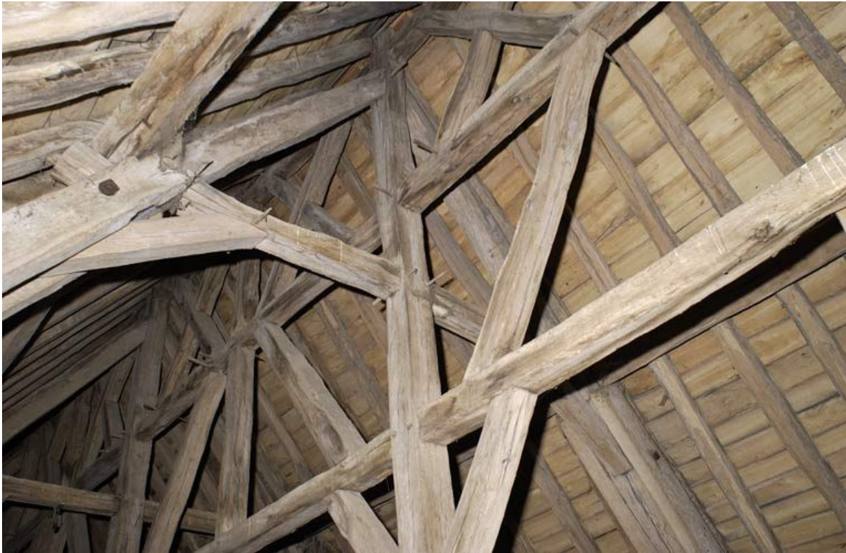
Chapelle : charpente.