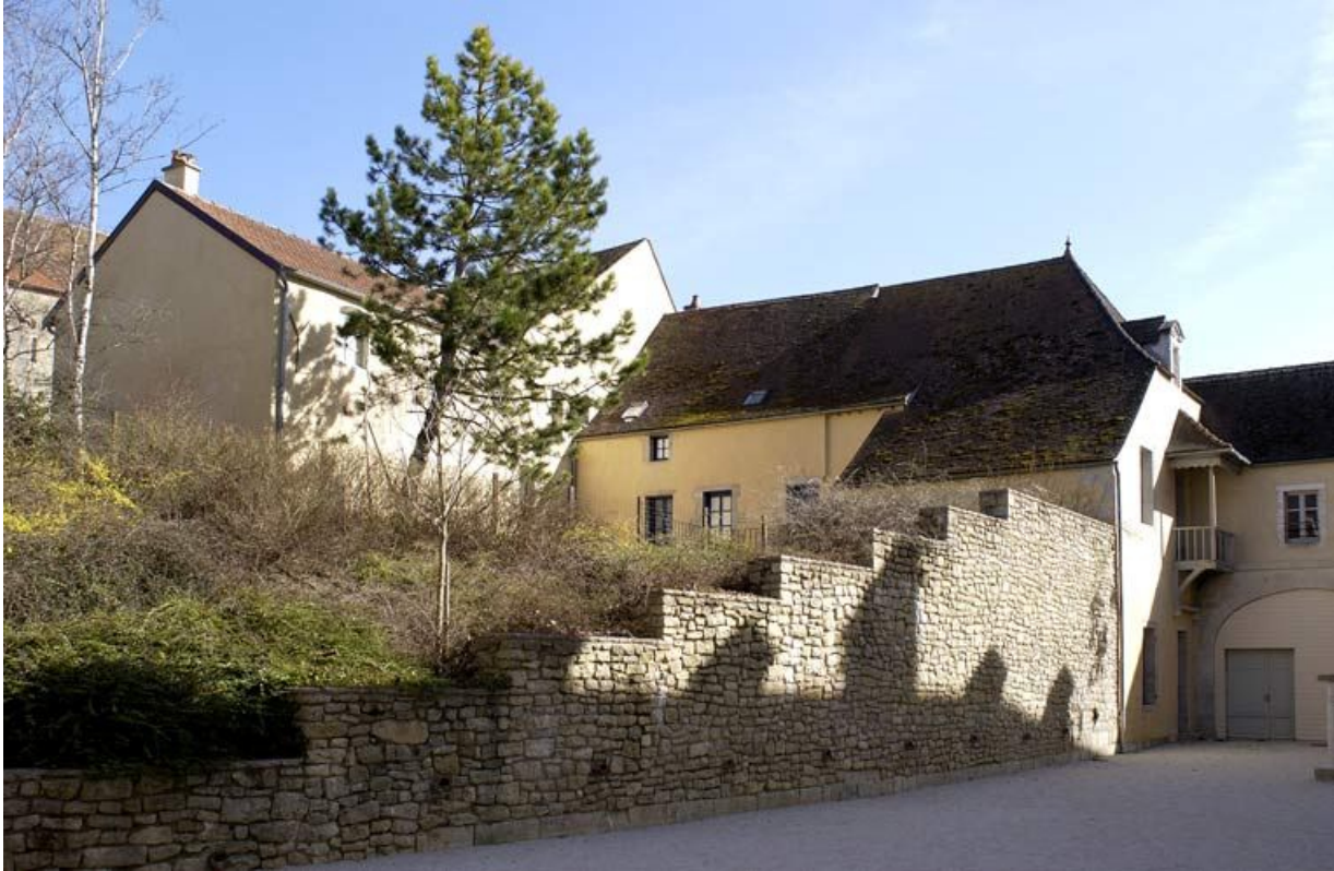
Cour dite des cuisines, boulangerie et bâtiments en bordure de la rue de l'hôpital (salles du Chapelet). 21, Alise-Sainte-Reine Bains