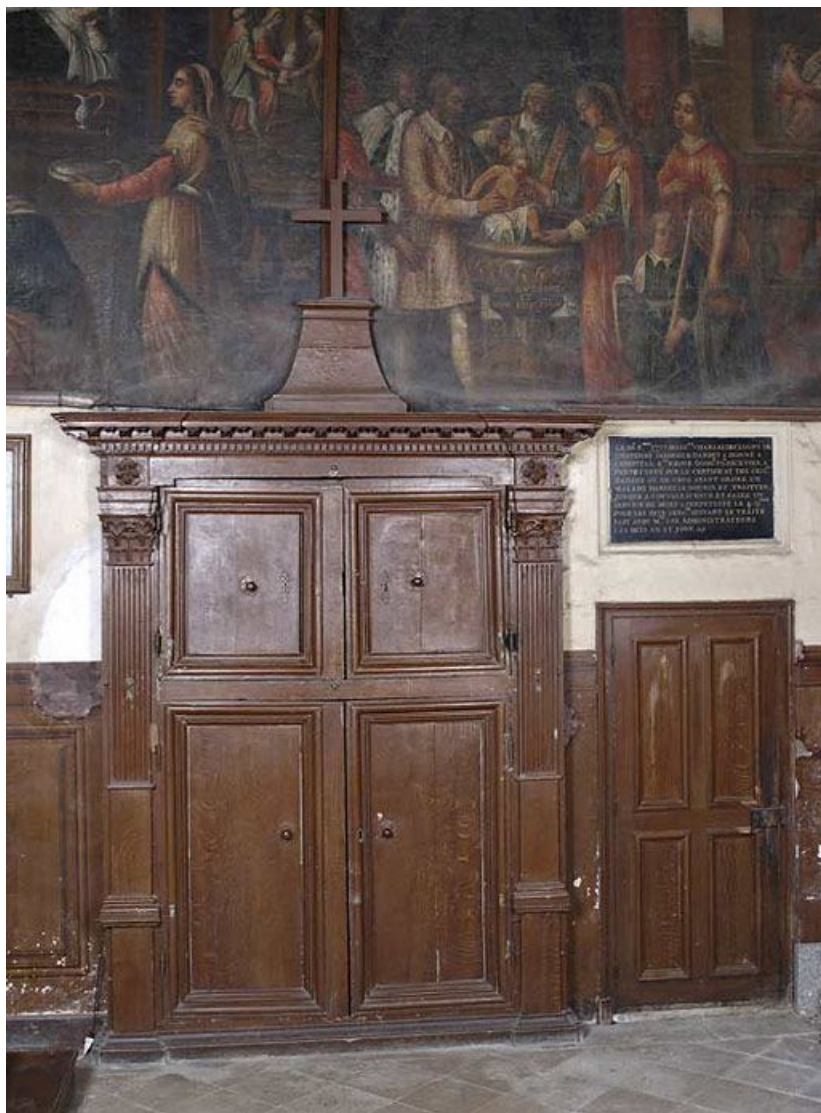
Chapelle, bras droit du transept : portes du mur est. 21, Alise-Sainte-Reine Bains