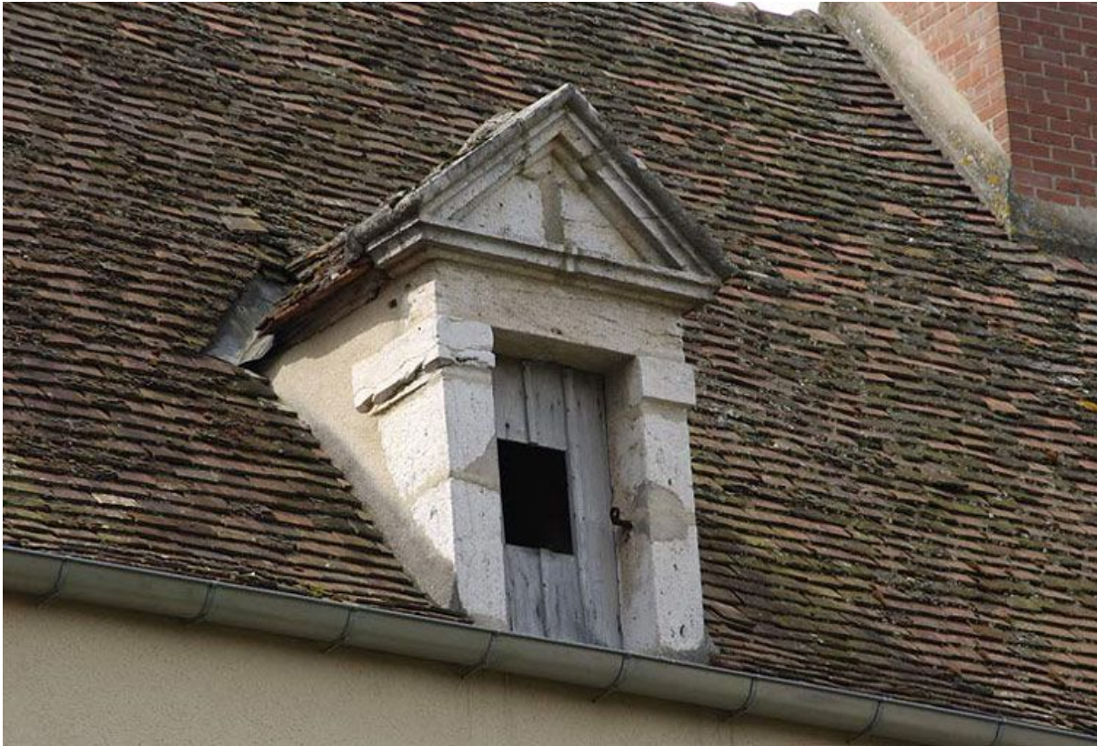
Bâtiment de la communauté des soeurs : lucarne.