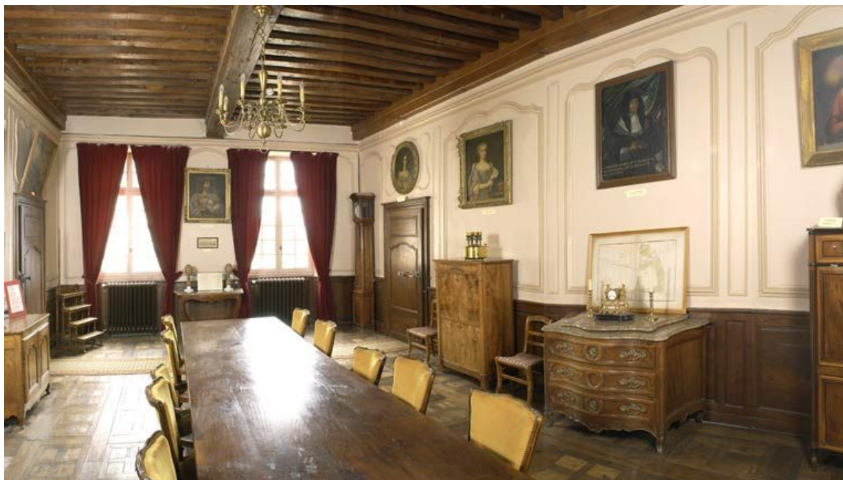
Corps de bâtiment principal : salle de réunion du Conseil d'administration (à l'étage, à droite de la chapelle). 21, Alise-Sainte-Reine Bains