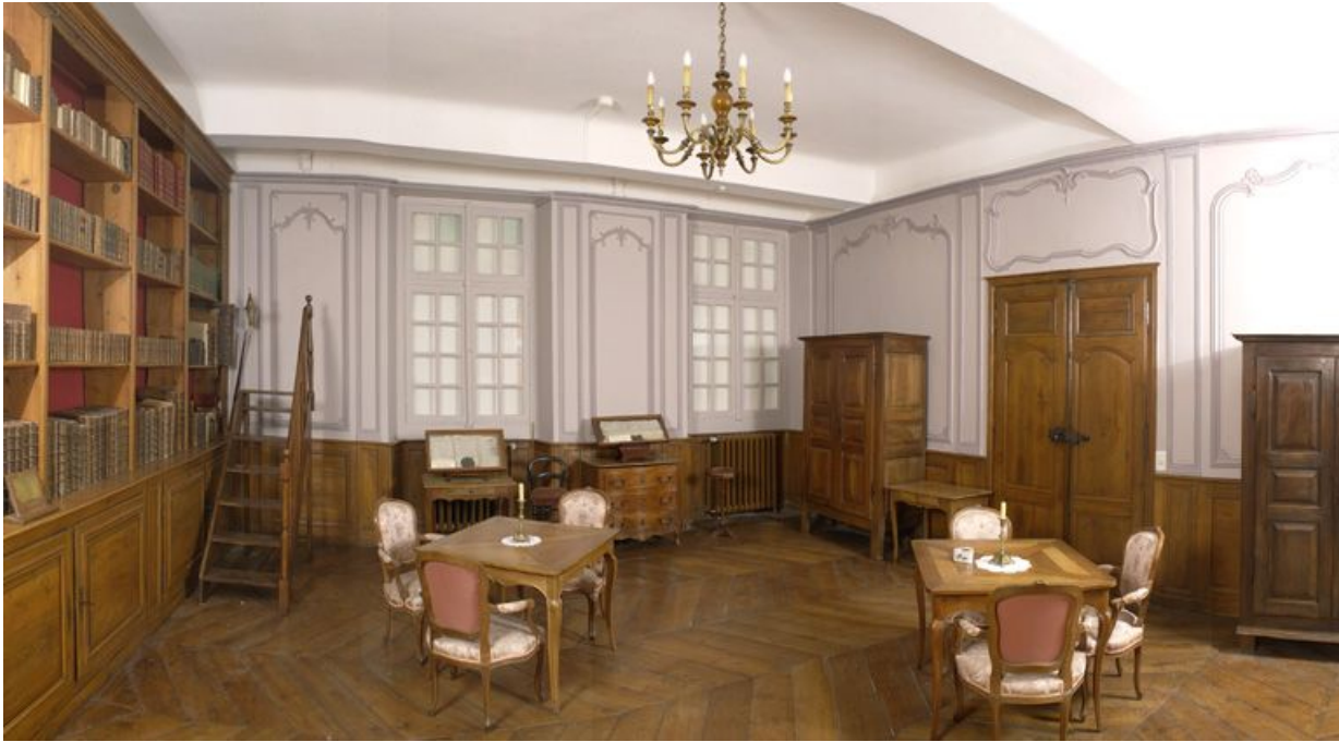
Corps de bâtiment principal : bibliothèque (premier étage).