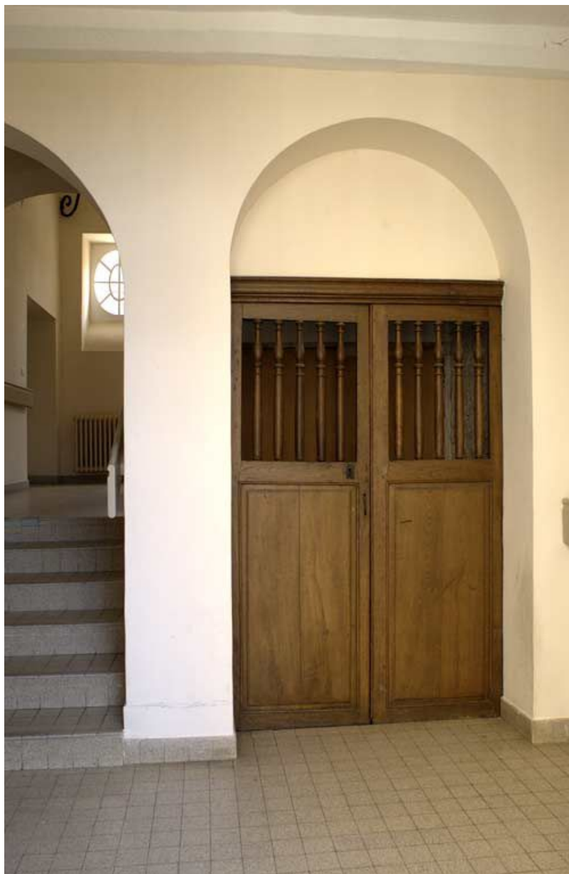
Aile droite dite "le grand corps de logis" : première volée de l'escalier (accès au rez-de-chaussée surélevé) et porte d'accès à la descente de cave.