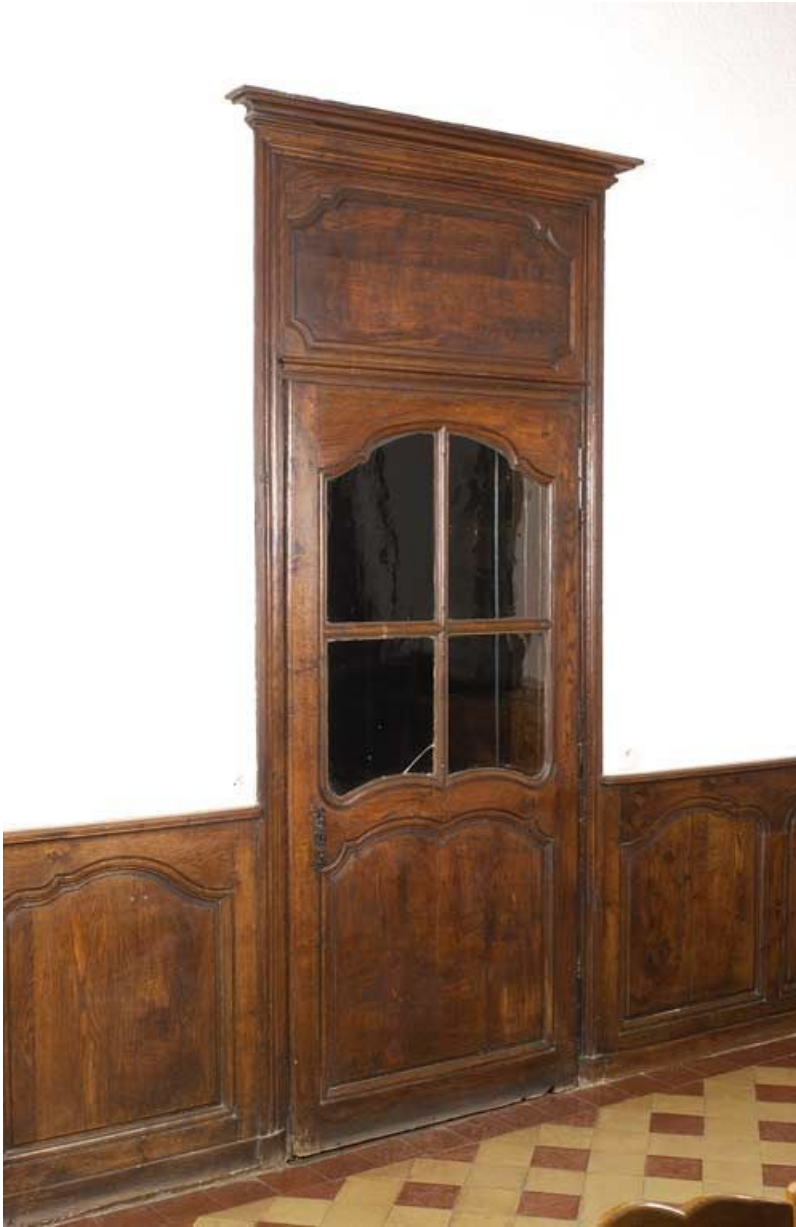
Bâtiment de la communauté des sœurs, réfectoire : porte de la pharmacie. 21, Alise-Sainte-Reine Bains