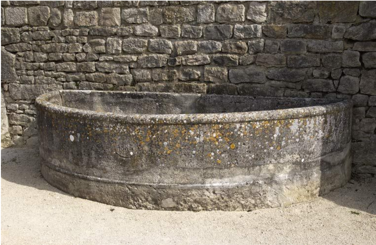
Bassin adossé au mur ouest des bâtiments qui fermaient la cour Saint-Louis à l'ouest. 21, Alise-Sainte-Reine Bains