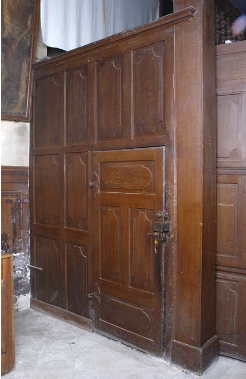
Chapelle : tambour sous la tribune, panneau latéral (vu depuis la nef). 21, Alise-Sainte-Reine Bains