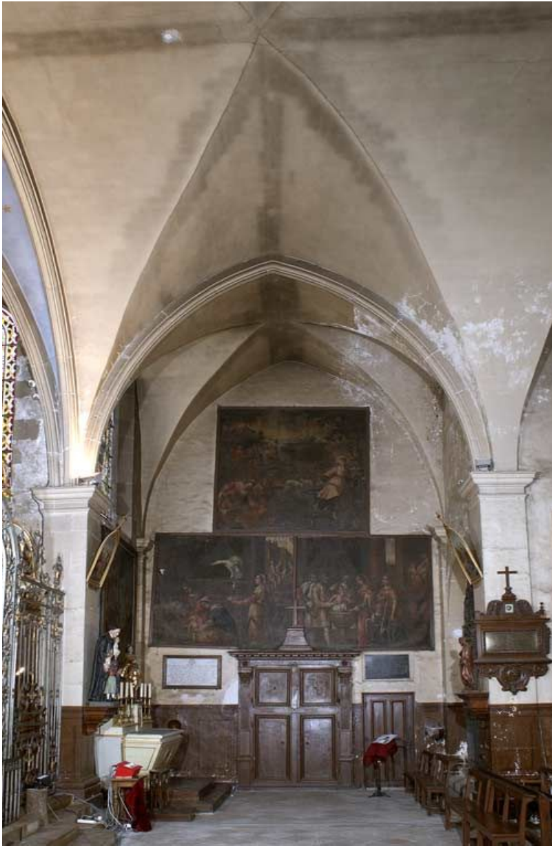
Chapelle : bras droit du transept.