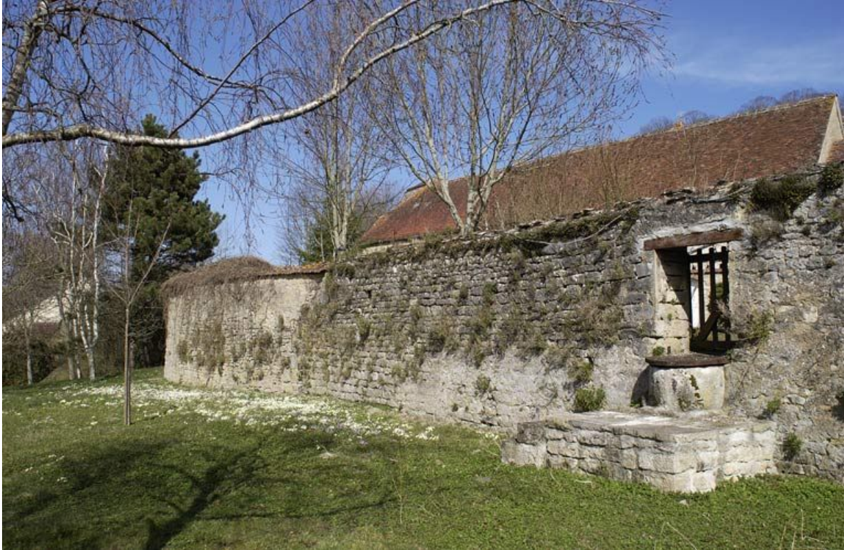
Mur de clôture à l'est de la cour dite des cuisines, et puits.