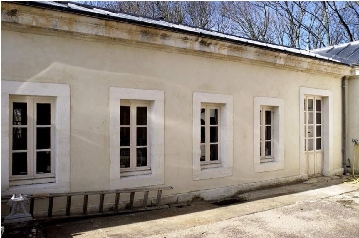
Cour des Bains : bâtiment des bains-douches. 21, Alise-Sainte-Reine Bains