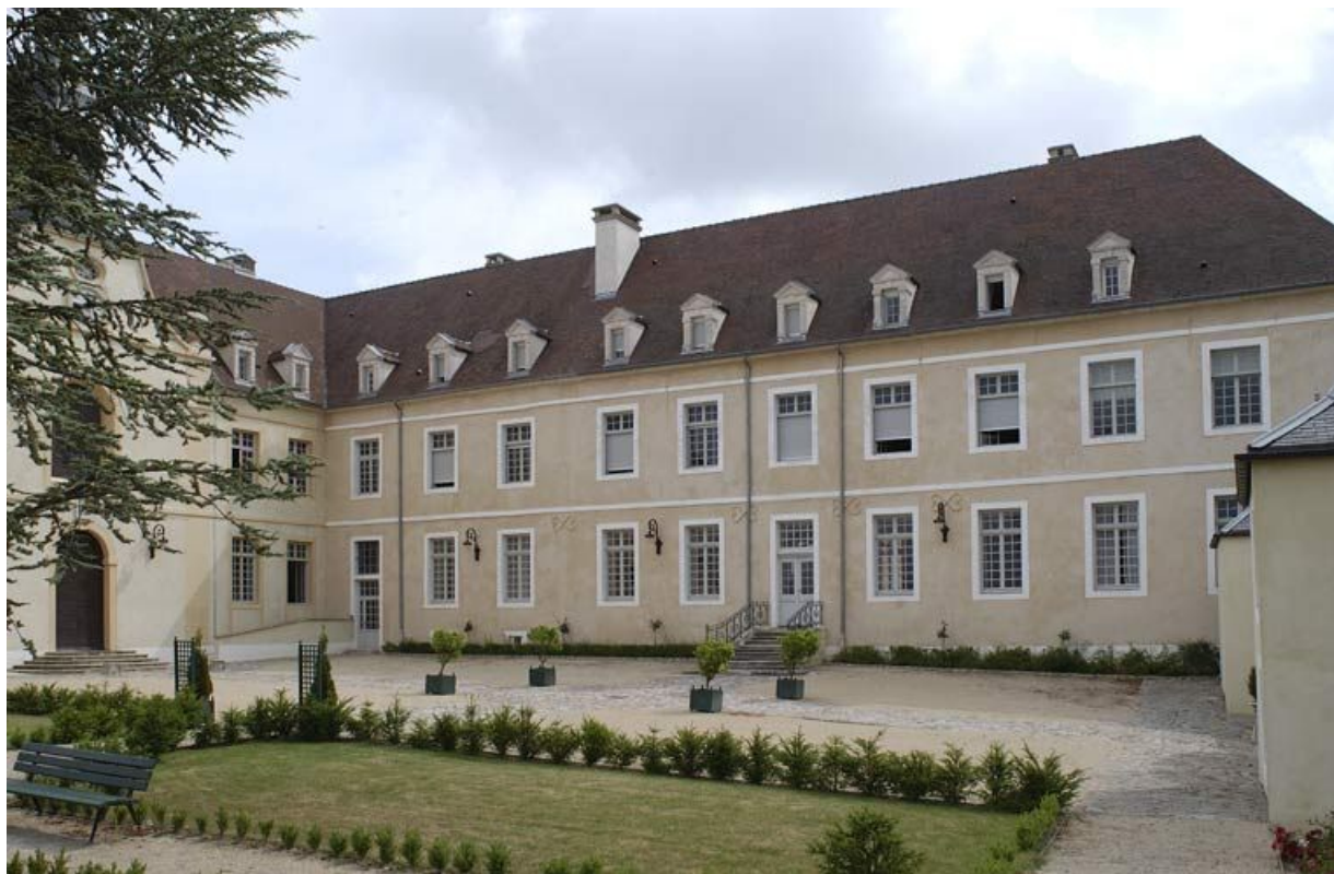
Cour antérieure : aile droite dite "le grand corps de logis".