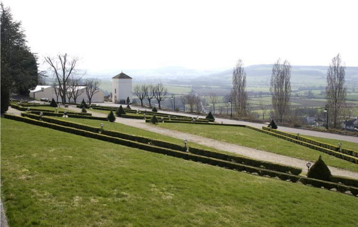
Jardin de l'esplanade Blondel et terrasse du pigeonier.