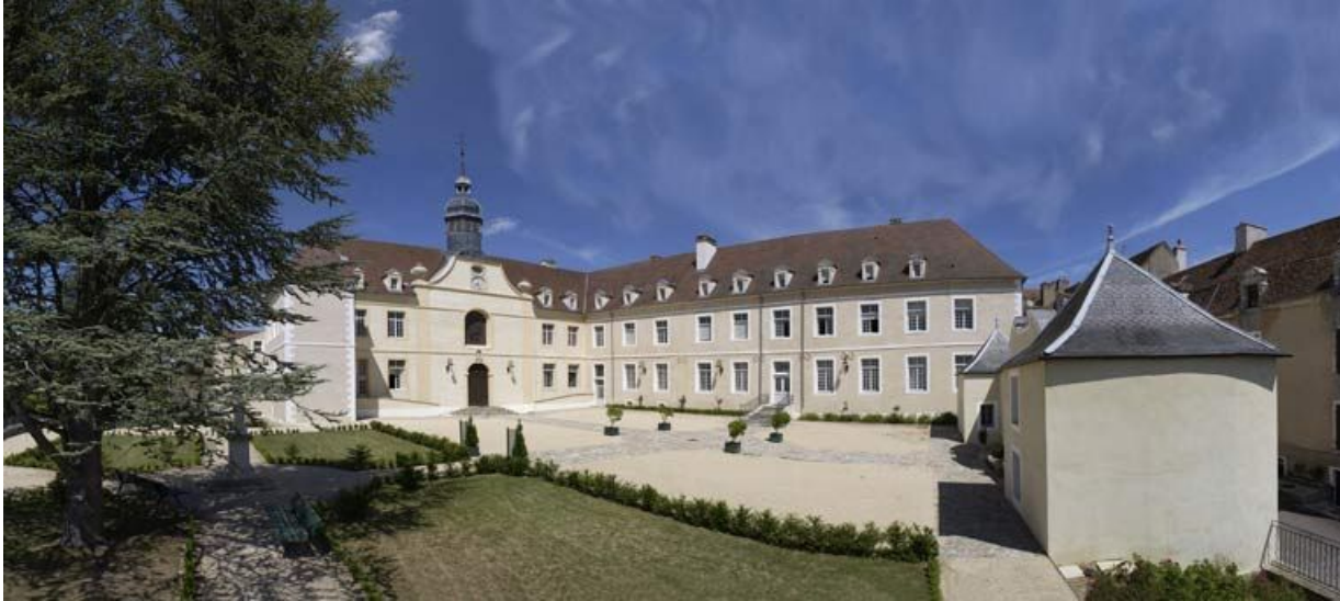
Cour antérieure : vue d'ensemble.