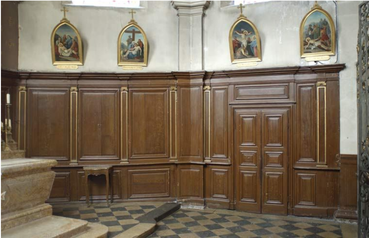
Chapelle, chœur : lambris de demi-revêtement et porte de la sacristie. 21, Alise-Sainte-Reine Bains