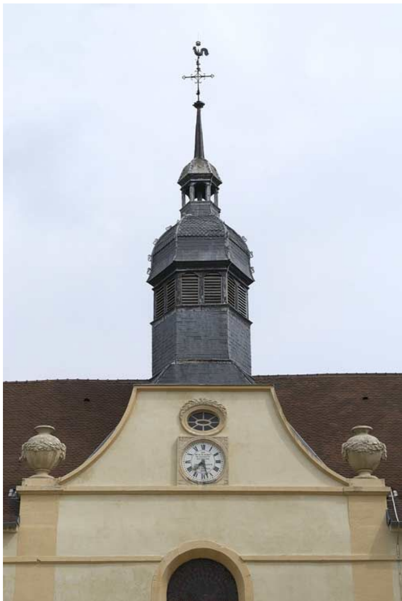
Cour antérieure : fronton de la chapelle et chœur.