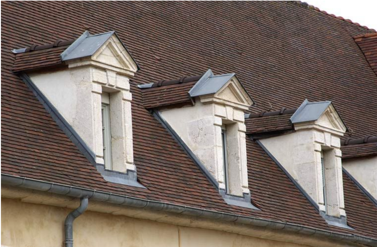
Cour dite des cuisines : lucarnes de l'aile droite dite "le grand corps de logis". 21, Alise-Sainte-Reine Bains