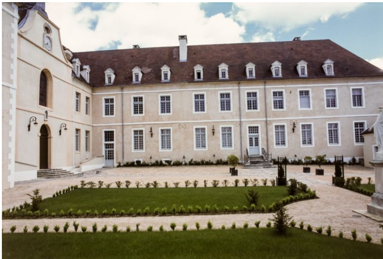
Cour antérieure : aile droite.