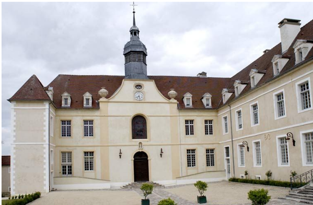
Cour antérieure : élévation antérieure du corps de bâtiment principal et vue partielle de l'aile droite. 21, Alise-Sainte-Reine Bains