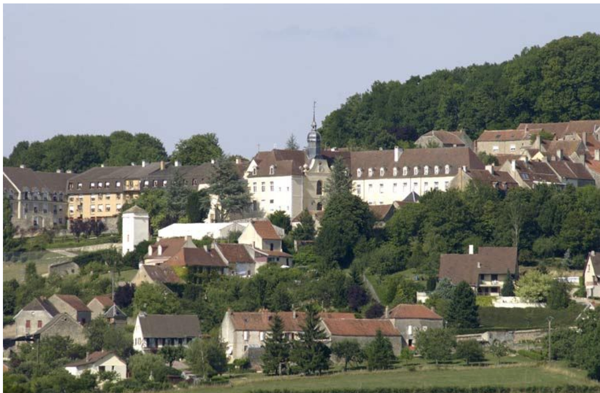
Vue d'ensemble de l'hôpital (prise du sud-ouest).