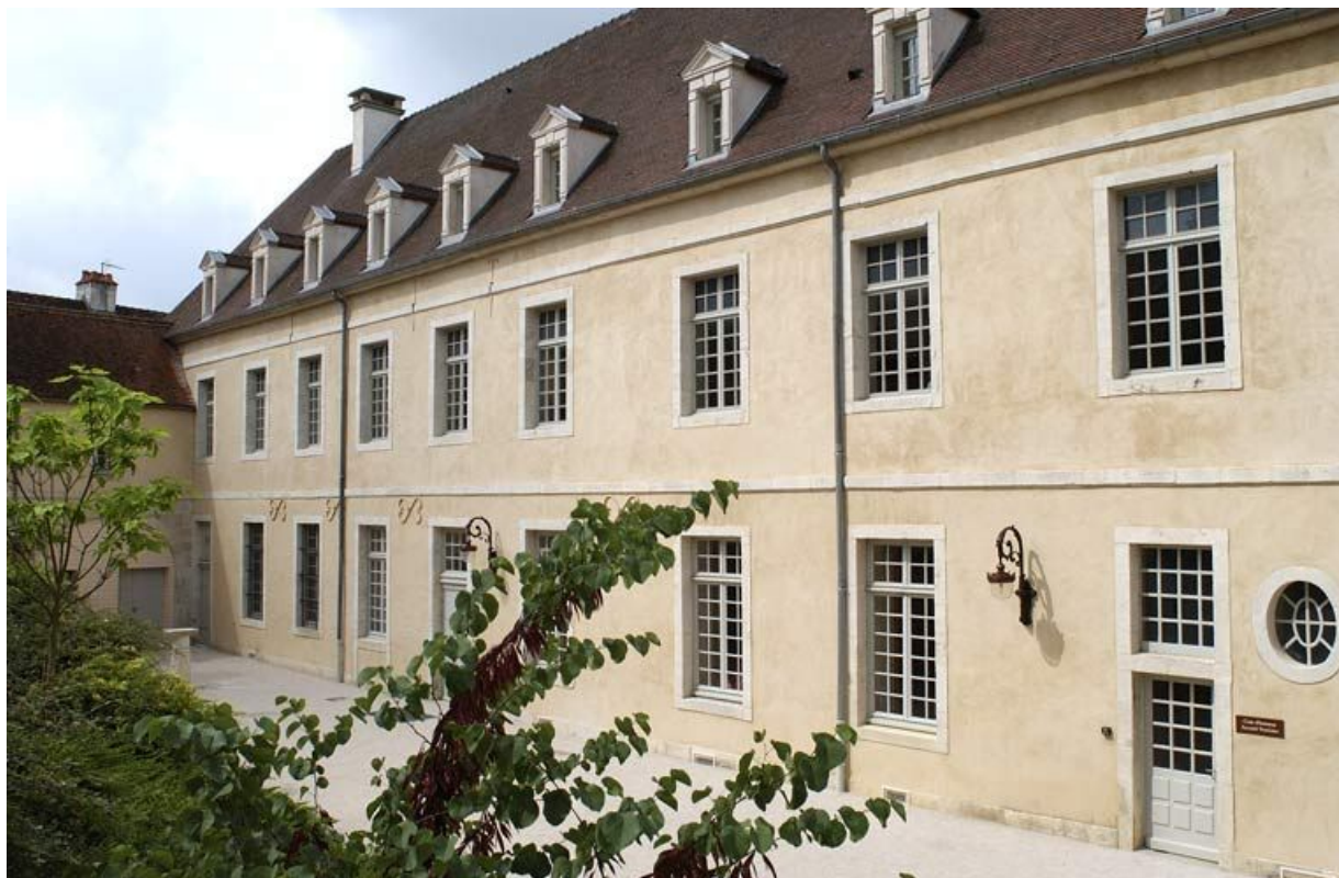
Cour dite des cuisines : élévation est de l'aile droite dite "le grand corps de logis". 21, Alise-Sainte-Reine Bains