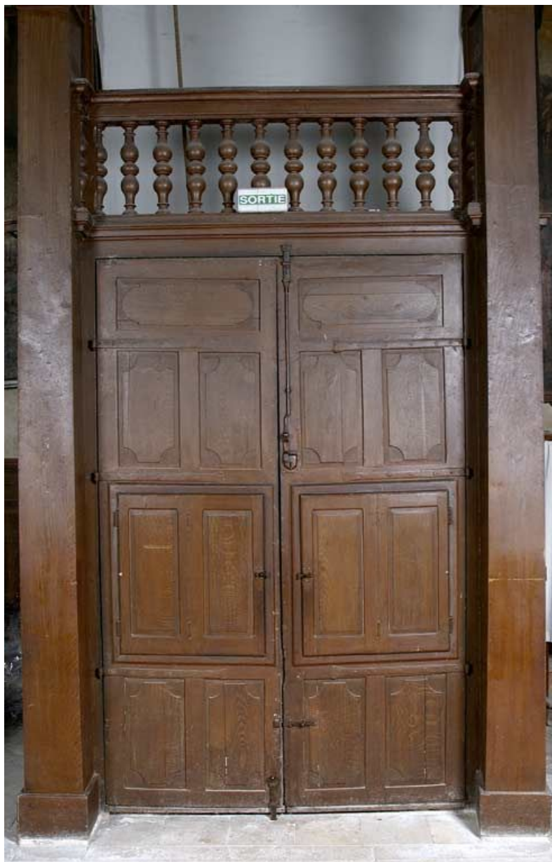
Chapelle : tambour sous la tribune, porte d'entrée principale (vue depuis la nef). 21, Alise-Sainte-Reine Bains