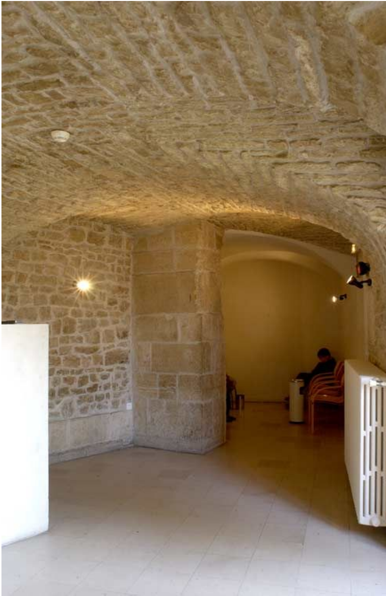
Passage voûté construit contre l'abside de la chapelle.