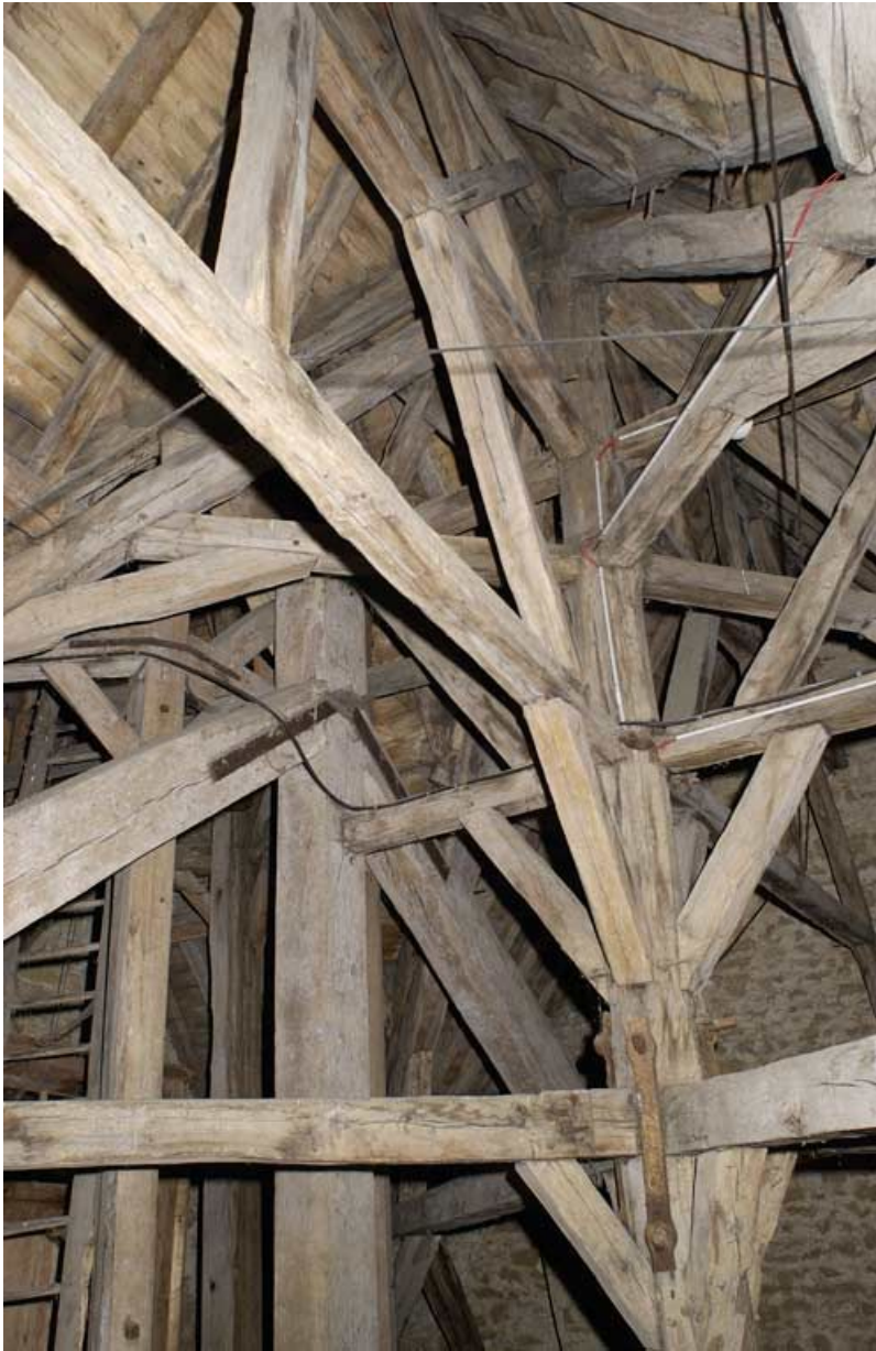
Chapelle : charpente.