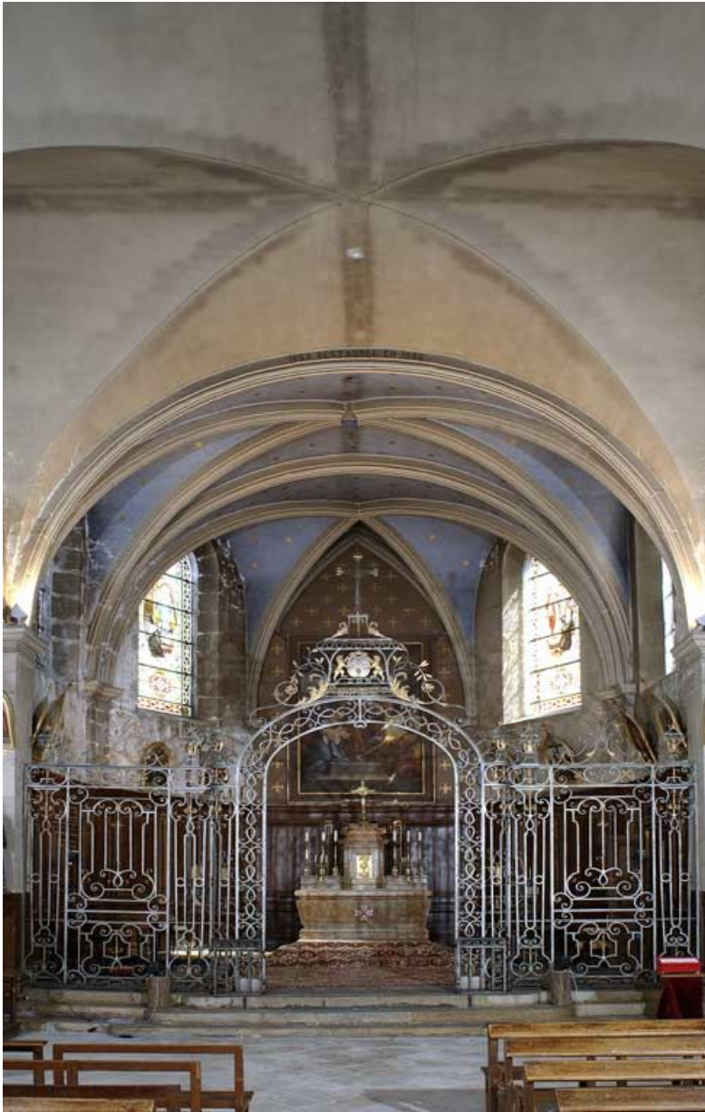
Chapelle vue depuis l'entrée.