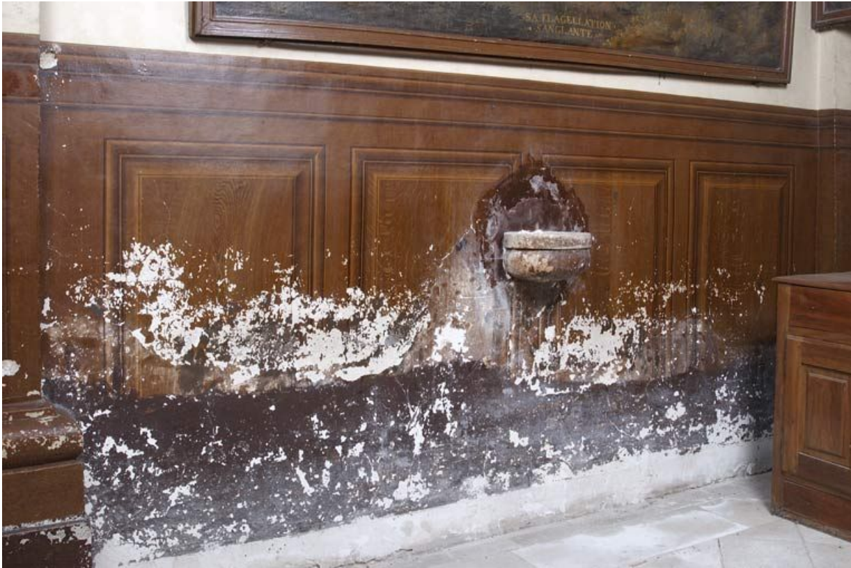
Chapelle : mur droit de la nef (trompe-l'oeil : lambris). 21, Alise-Sainte-Reine Bains