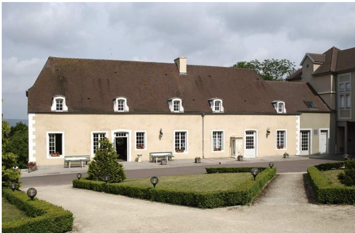
Bâtiment des bains du XVIII e siècle : façade est (rez-de-chaussée surélevé de plain-pied avec l'esplanade Blondel). 21, Alise-Sainte-Reine Bains