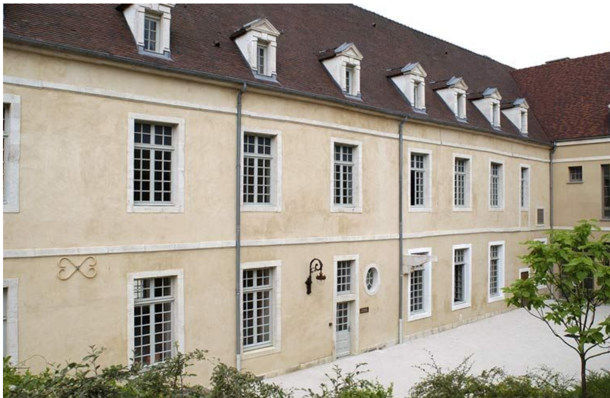
Cour dite des cuisines : élévation est de l'aile droite dite "le grand corps de logis".