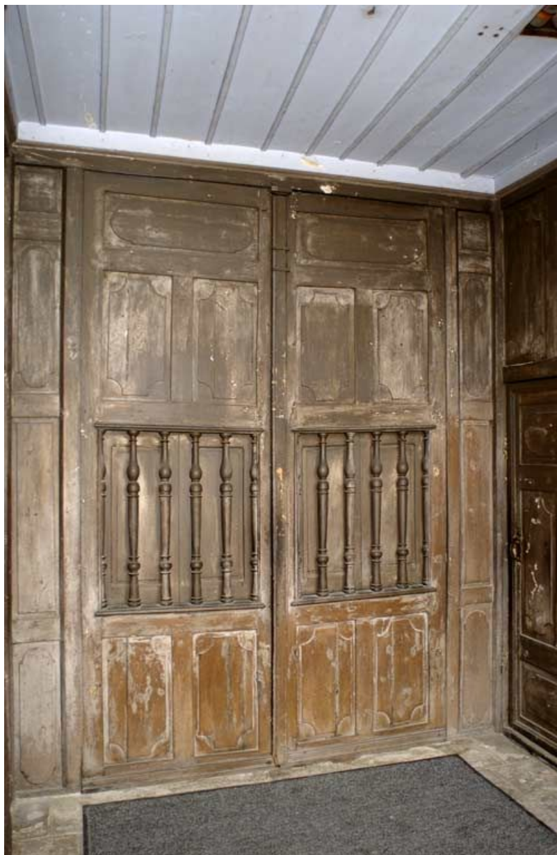
Chapelle : tambour sous la tribune, porte d'entrée principale. 21, Alise-Sainte-Reine Bains