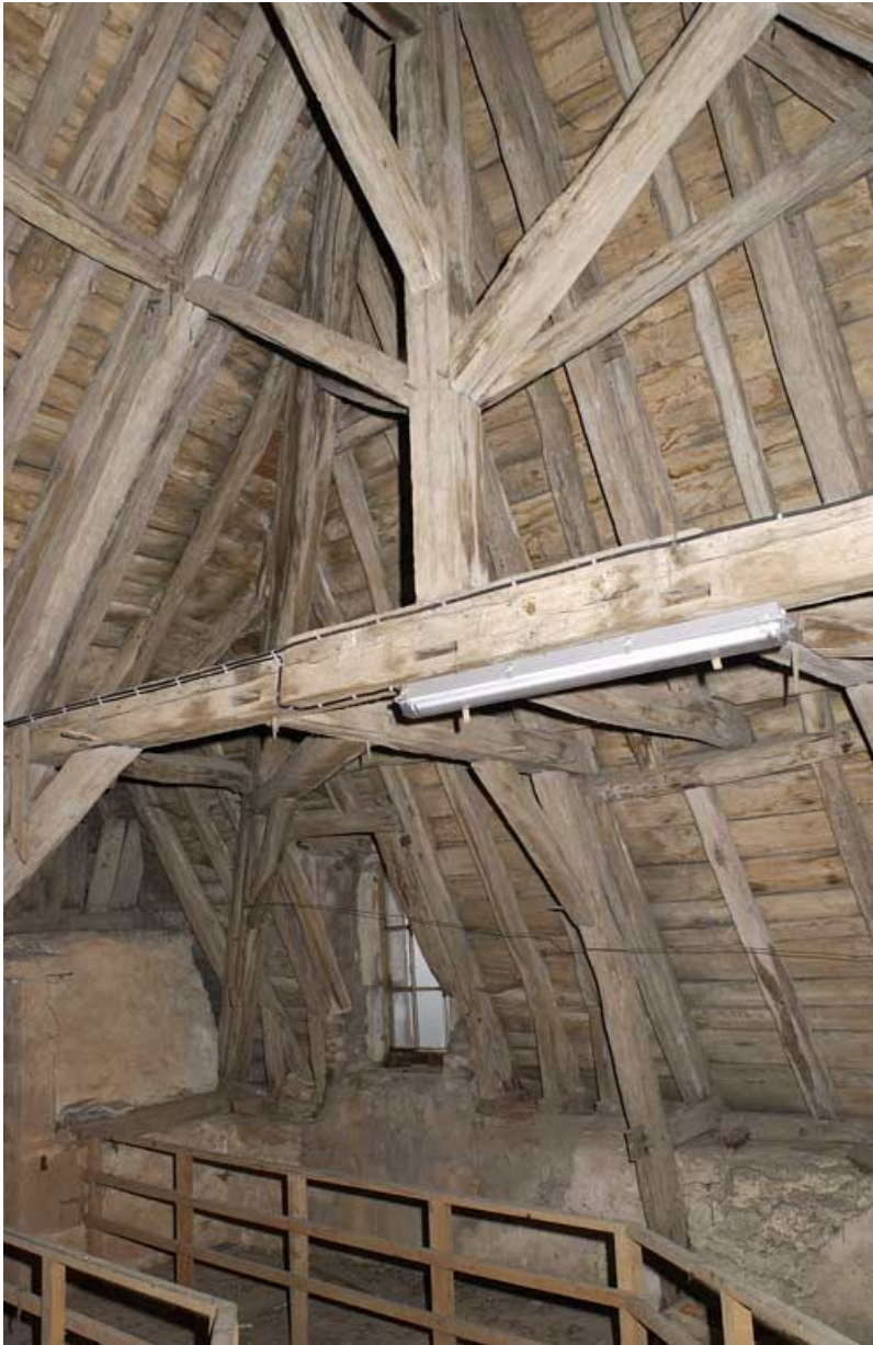
Corps de bâtiment principal : charpente au-dessus de la salle Sainte-Cécile (croupe). 21, Alise-Sainte-Reine Bains