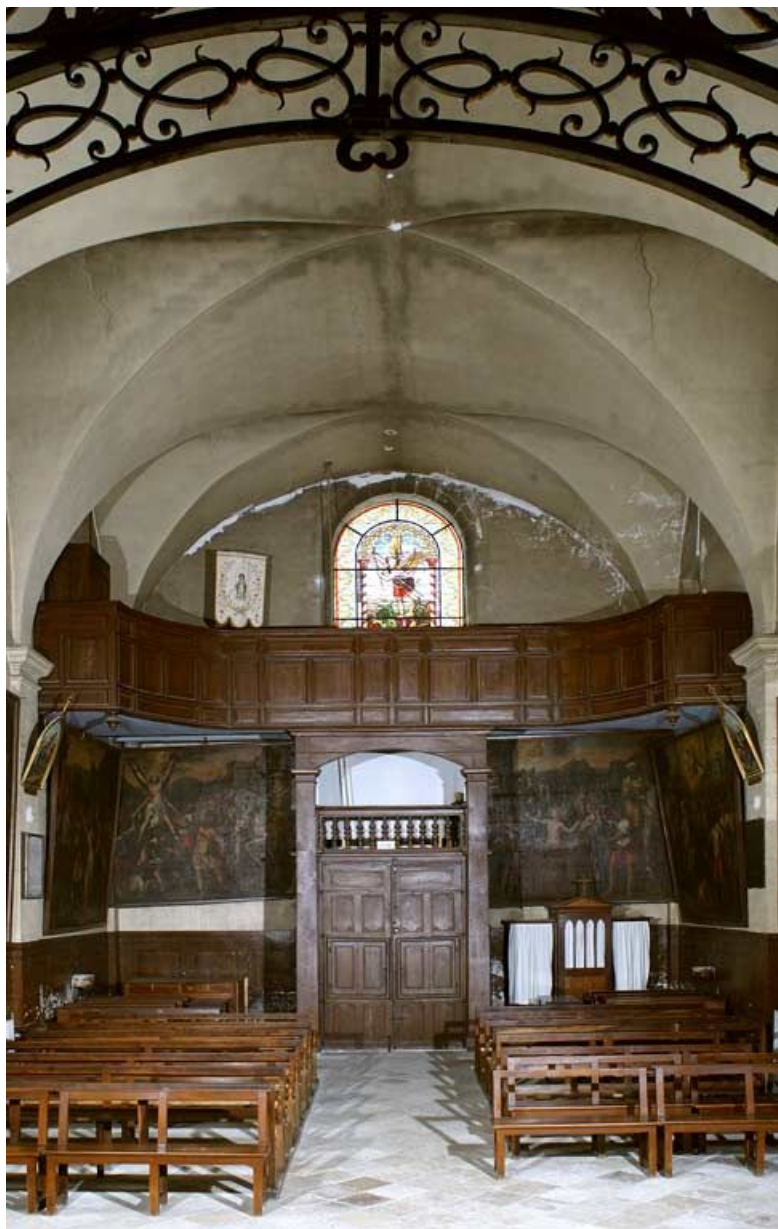
Chapelle : nef et tribune.