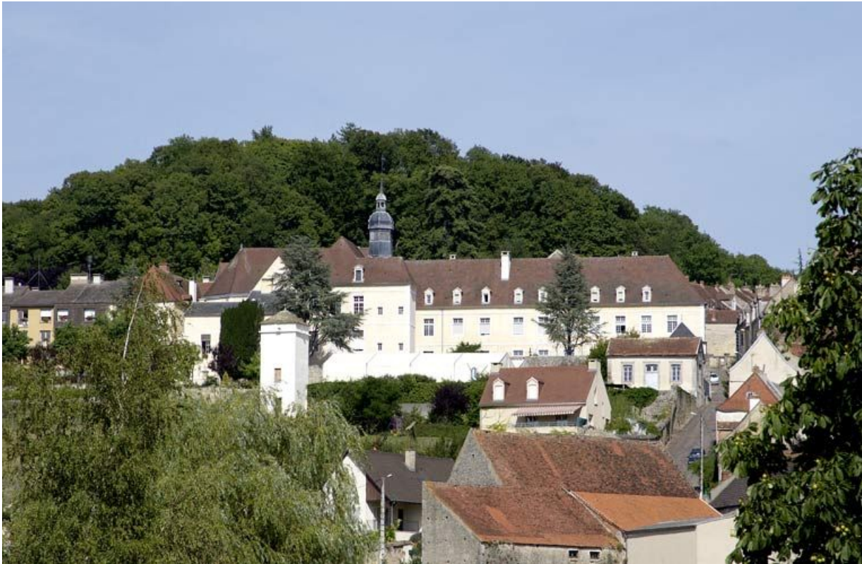
Vue d'ensemble des bâtiments qui encadrent la cour antérieure (prise depuis l'ouest). 21, Alise-Sainte-Reine Bains