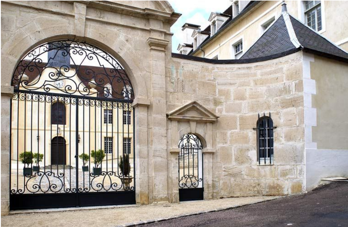
Portail et porte piétonne.