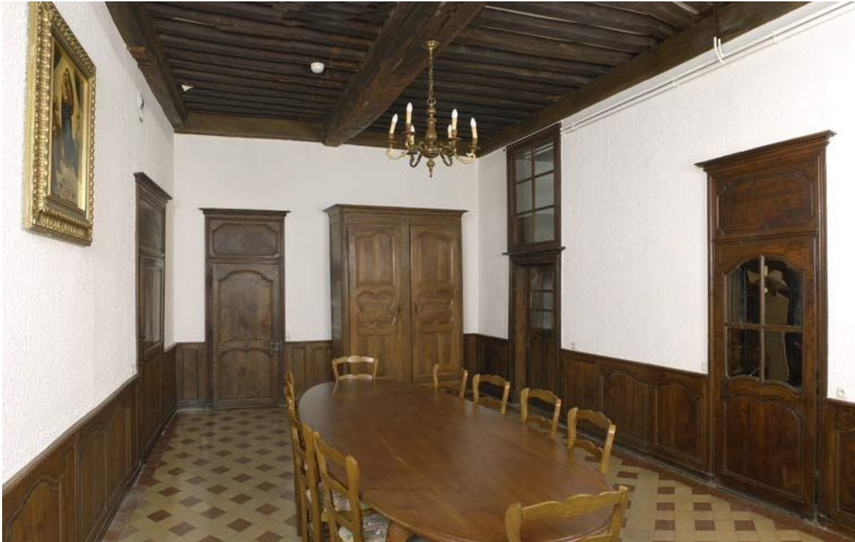
Bâtiment de la communauté des sœurs : réfectoire.