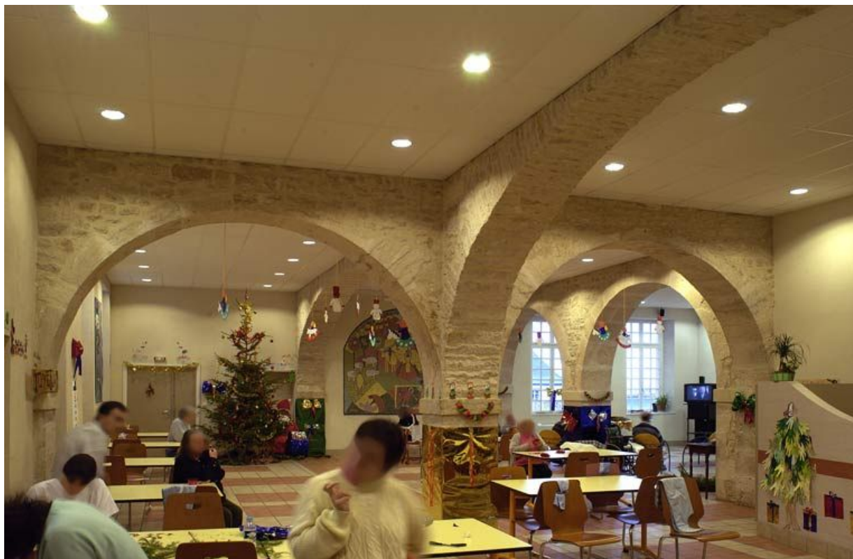
Corps de bâtiment principal : salle des malades (à l'est de la chapelle). 21, Alise-Sainte-Reine Bains