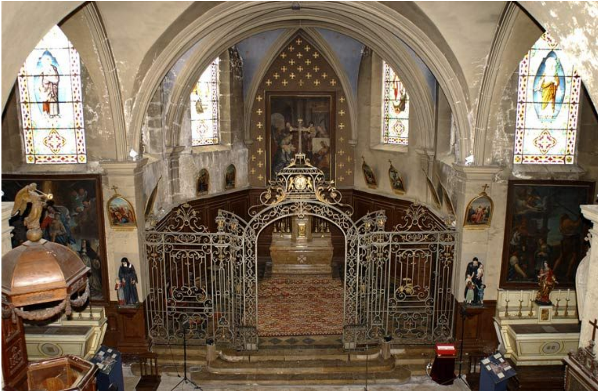
Chapelle vue depuis la tribune.