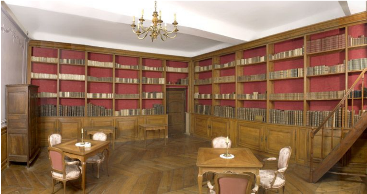
Corps de bâtiment principal : bibliothèque (premier étage). 21, Alise-Sainte-Reine Bains