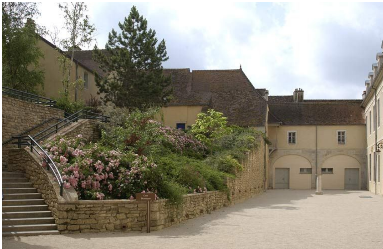
Cour dite des cuisines : boulangerie et bâtiments en bordure de la rue de l'Hôpital (Salles du Chapelet).