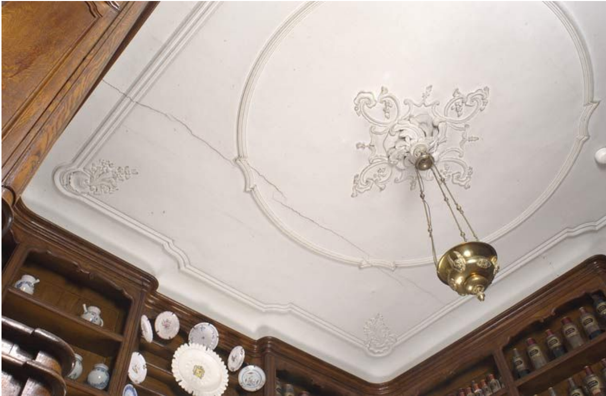
Bâtiment de la communauté des soeurs : pharmacie, plafond. 21, Alise-Sainte-Reine Bains