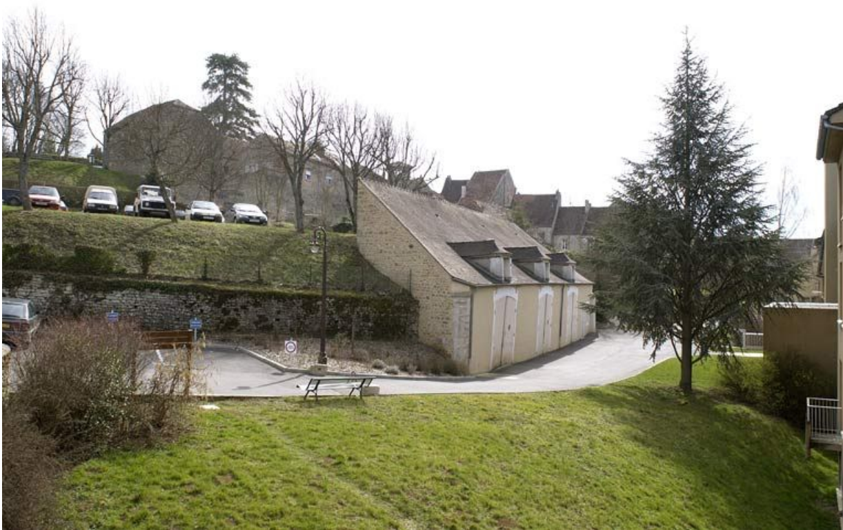
Bâtiment dit les Granges.