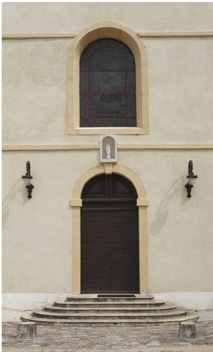
Cour antérieure, façade de la chapelle : porte d'entrée.