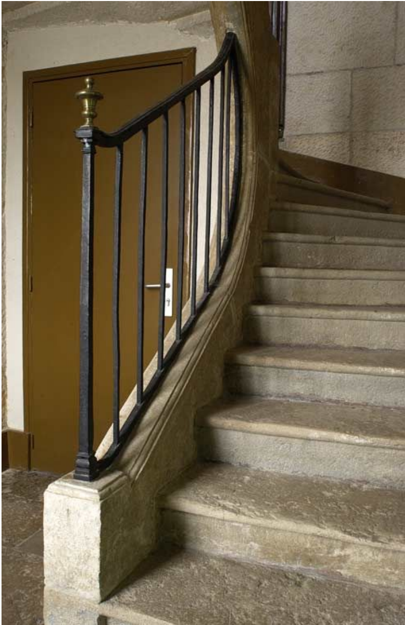
Bâtiment des bains du XVII e siècle : escalier.