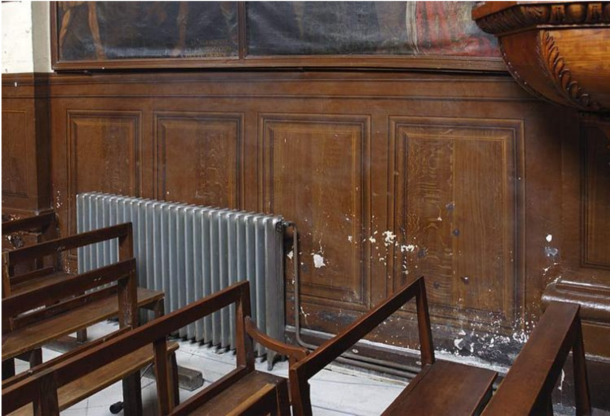
Chapelle : mur gauche de la nef (trompe-l'oeil : lambris). 21, Alise-Sainte-Reine Bains