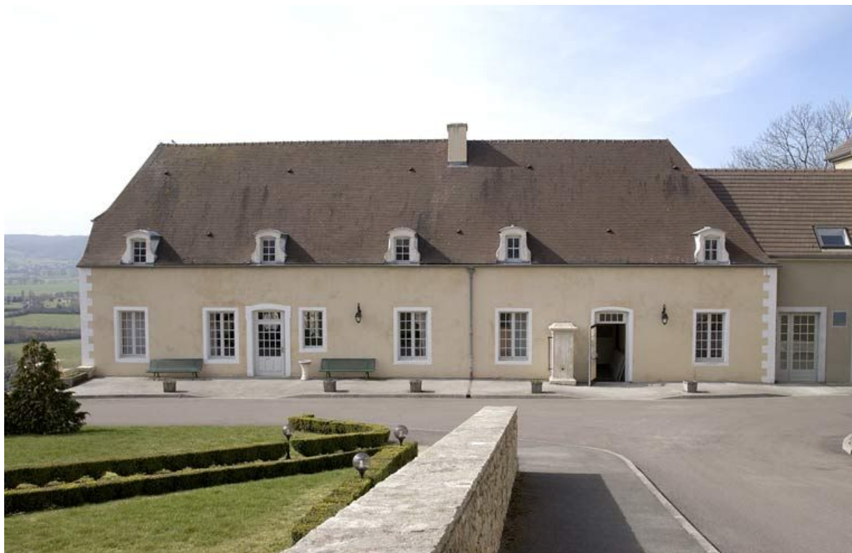
Bâtiment des bains du XVIII e siècle : façade est (rez-de-chaussée surélevé de plain-pied avec l'esplanade Blondel). 21, Alise-Sainte-Reine Bains