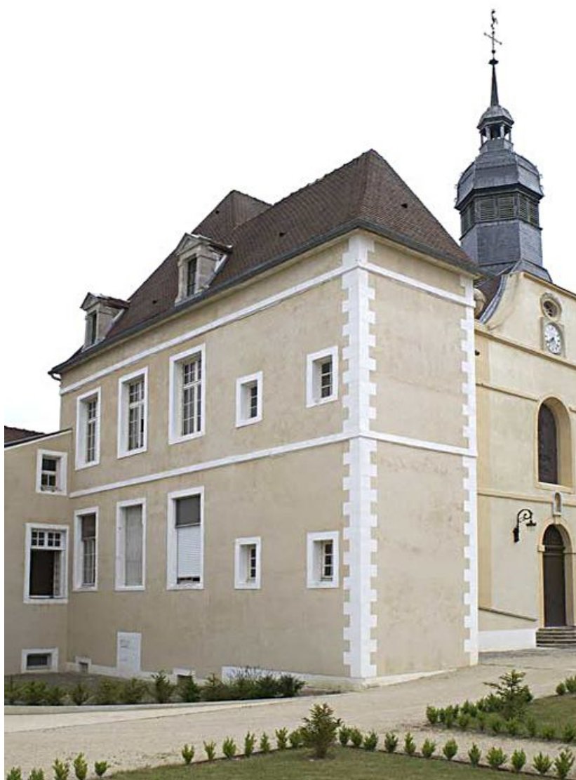
Cour antérieure : corps de bâtiment en retour d'équerre à gauche de la chapelle (salle des femmes au rez-de-chaussée, salle Sainte-Cécile à l'étage et cage d'escalier).