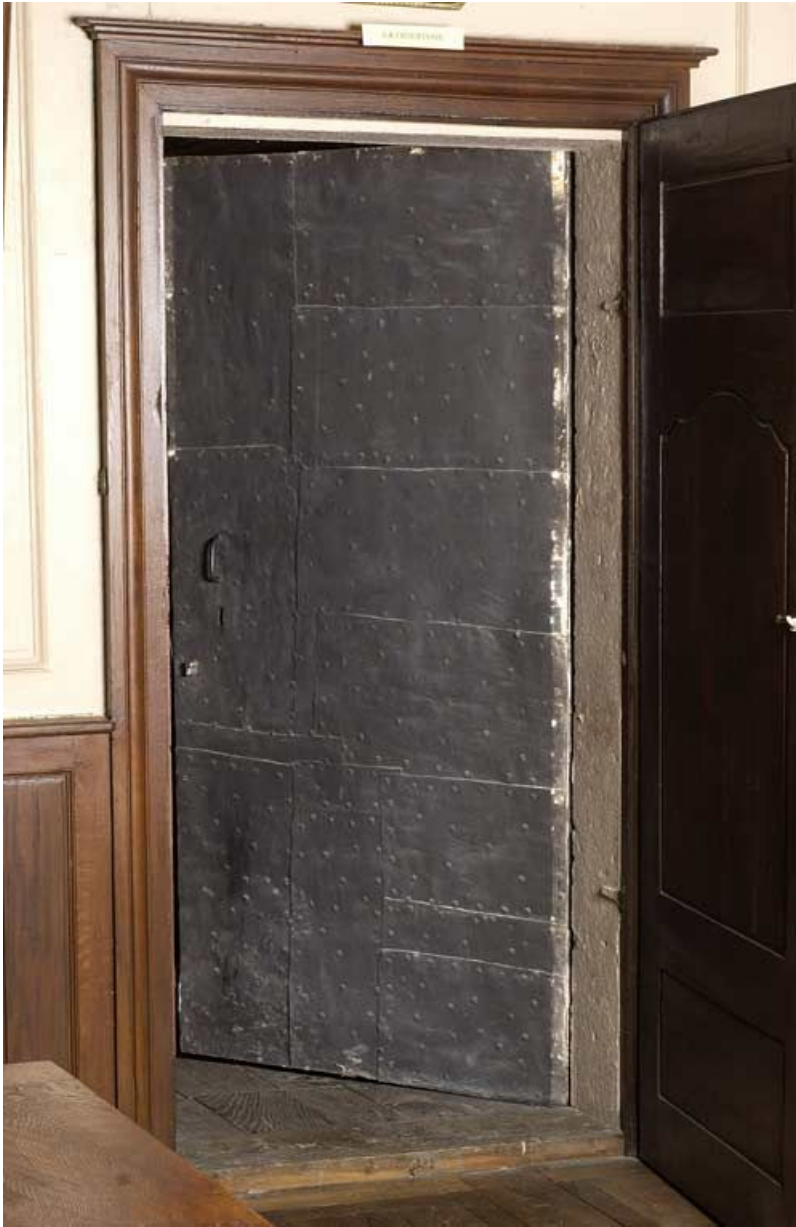
Corps de bâtiment principal : salle de réunion du Conseil d'administration, porte de la salle des archives. 21, Alise-Sainte-Reine Bains