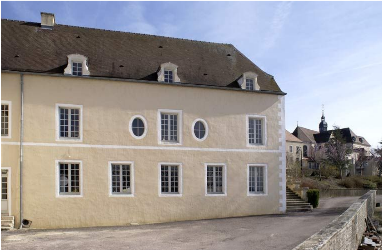
Cour des Bains : bâtiment des bains du XVII e siècle (élévation ouest). 21, Alise-Sainte-Reine Bains