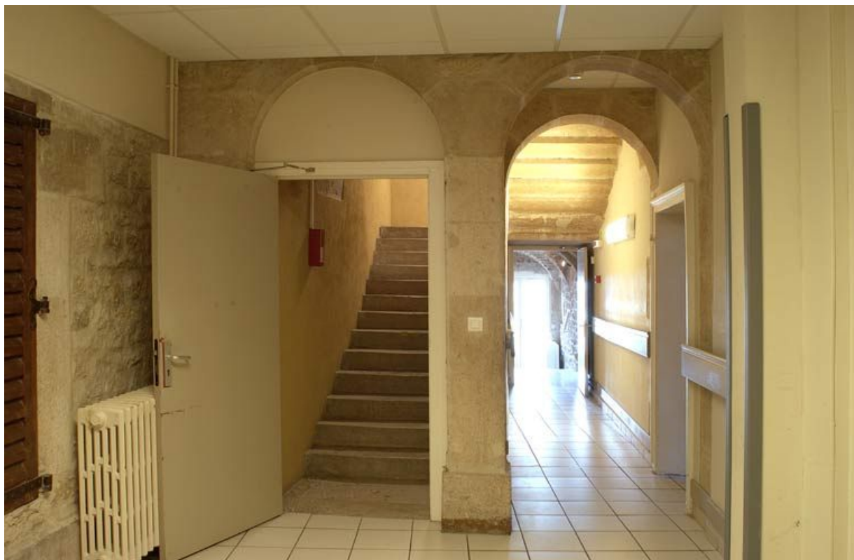
Bâtiment de la communauté des soeurs : escalier construit dans la cour qui s'étendait entre la chapelle et le logis des soeurs. 21, Alise-Sainte-Reine Bains