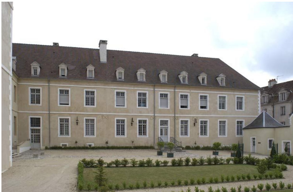
Cour antérieure : aile droite dite "le grand corps de logis".