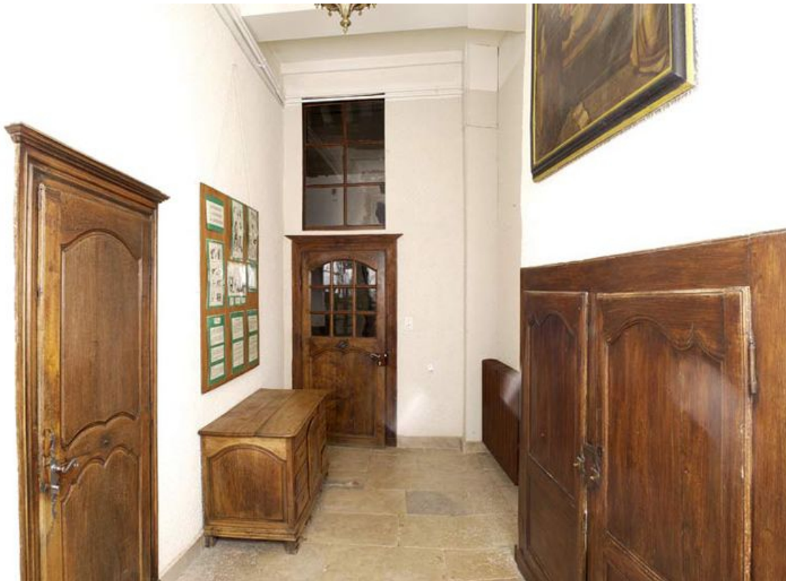
Bâtiment de la communauté des soeurs : laboratoire.