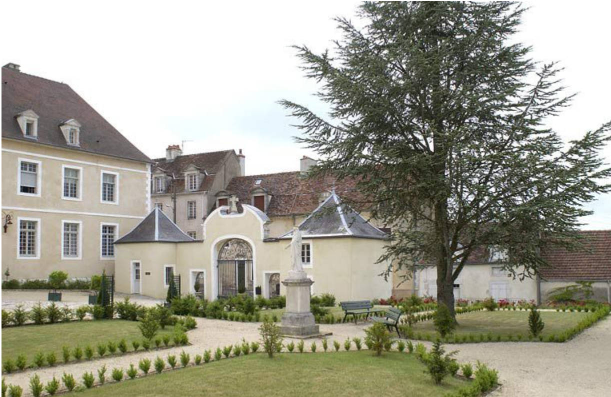
Portail à porte cochère et portes piétonnes entre deux pavillons (côté cour). 21, Alise-Sainte-Reine Bains