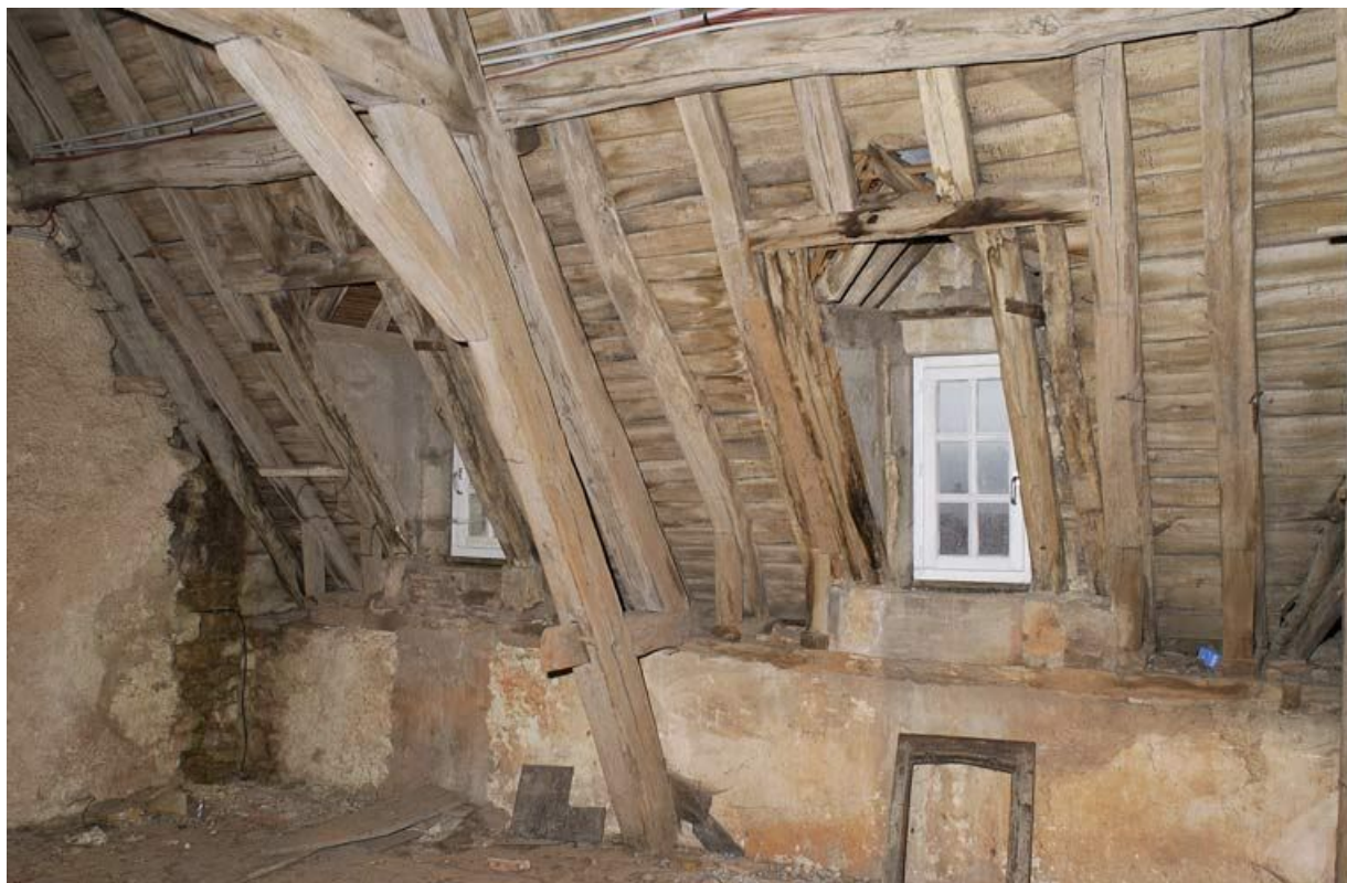
Corps de bâtiment principal : charpente au-dessus de la salle Sainte-Cécile (versant antérieur). 21, Alise-Sainte-Reine Bains