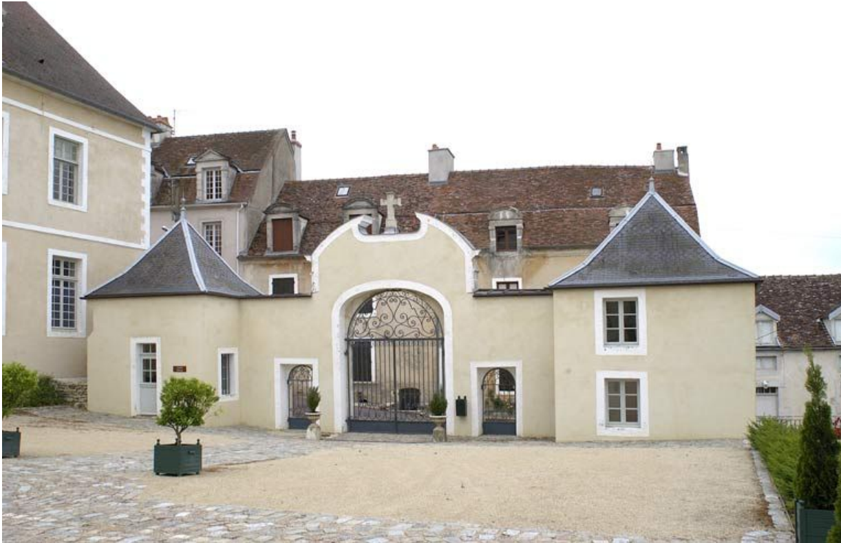
Portail à porte cochère et portes piétonnes entre deux pavillons (côté cour). 21, Alise-Sainte-Reine Bains