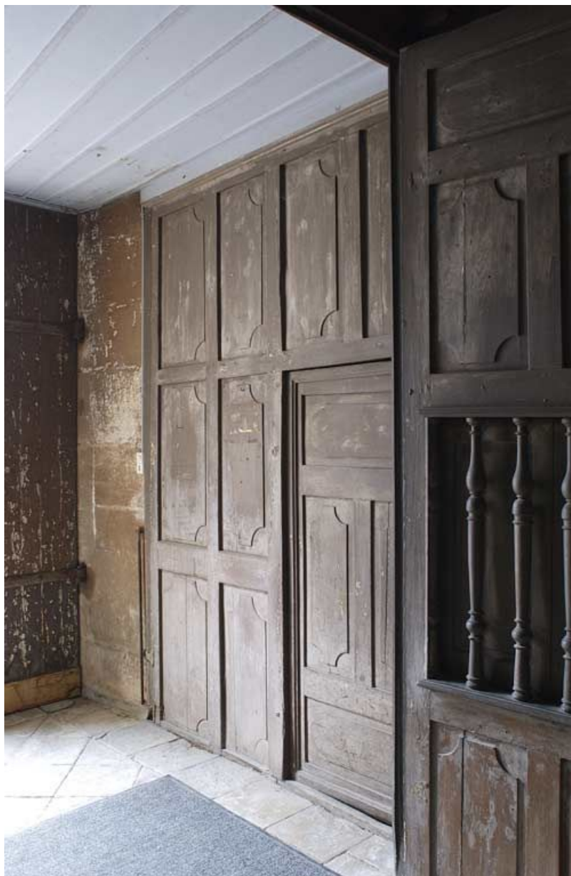
Chapelle : tambour sous la tribune, panneau latéral (à gauche en entrant dans la chapelle). 21, Alise-Sainte-Reine Bains