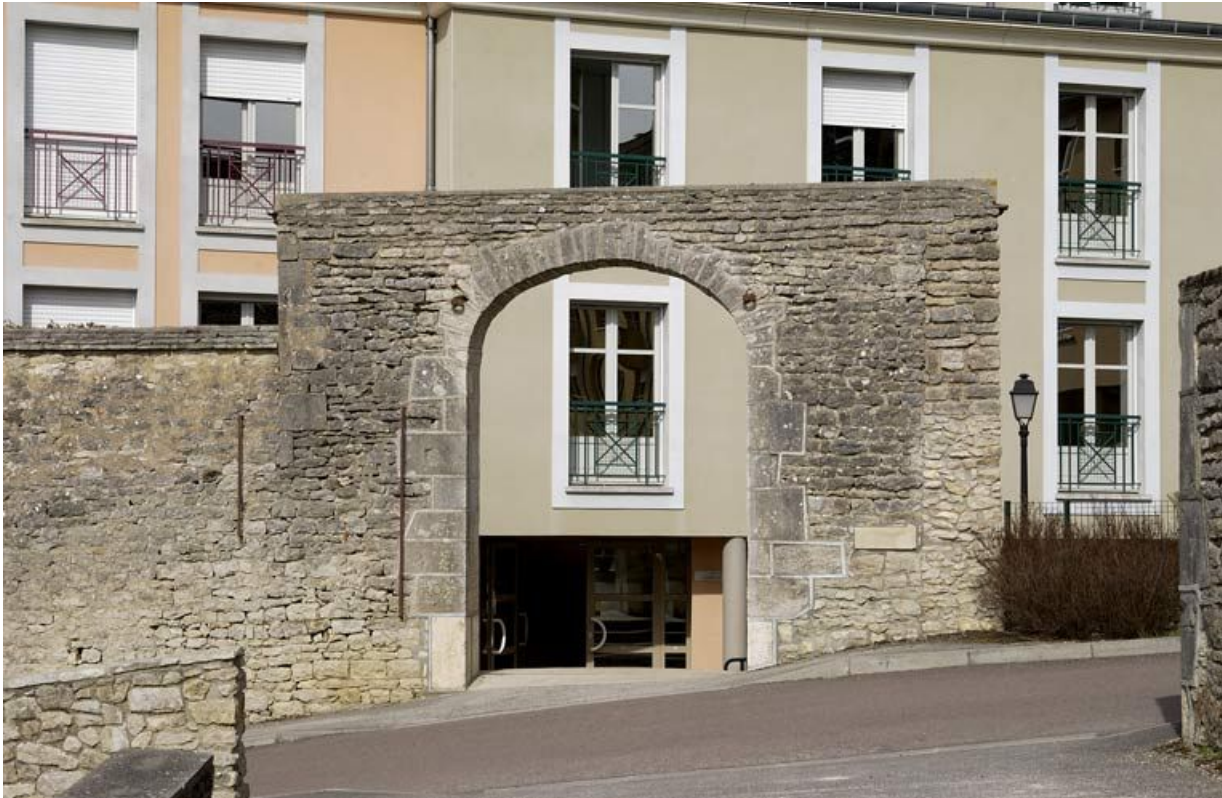
Ancienne porte du passage couvert de l'hôpital Saint-Louis (?).