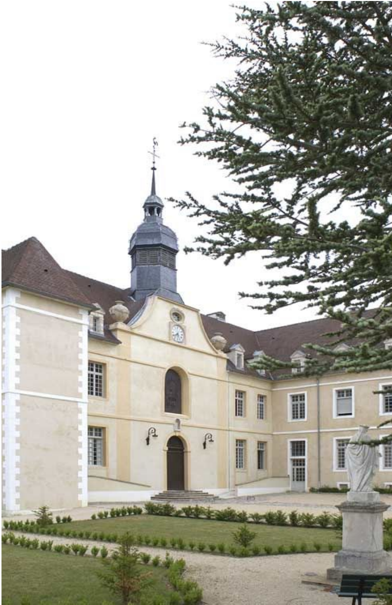
Cour antérieure : corps de bâtiment principal et aile droite (vue partielle). 21, Alise-Sainte-Reine Bains