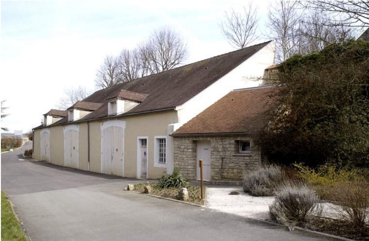
Bâtiment dit les Granges. 21, Alise-Sainte-Reine Bains