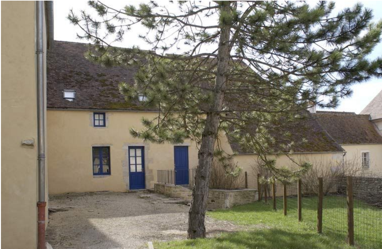
Bâtiment dit salles du Chapelet, en bordure de la rue de l'hôpital : élévation nord. 21, Alise-Sainte-Reine Bains