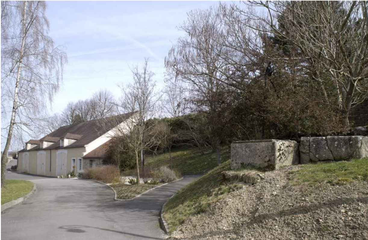
Bâtiment dit les Granges. 21, Alise-Sainte-Reine Bains