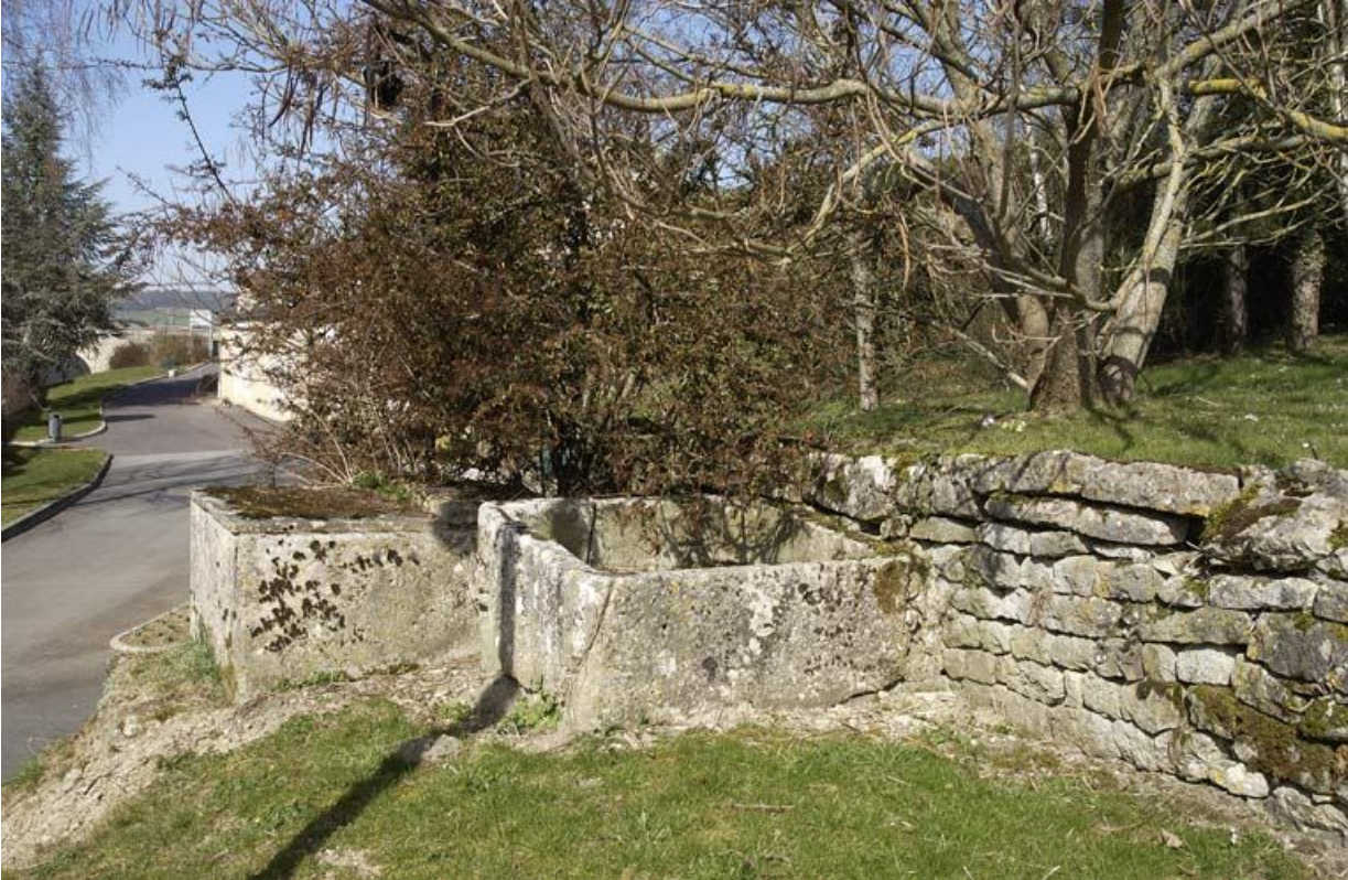
Puits à proximité du bâtiment dit les Granges. 21, Alise-Sainte-Reine Bains