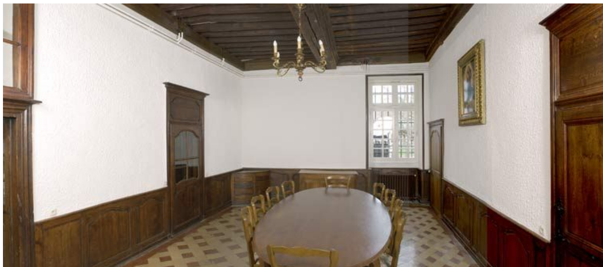
Bâtiment de la communauté des soeurs : réfectoire.