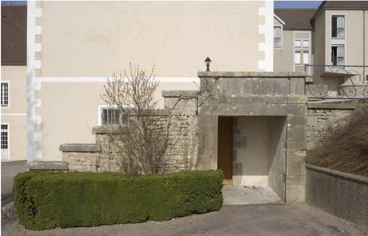
Escalier entre la cour des Bains et l'esplanade Blondel.