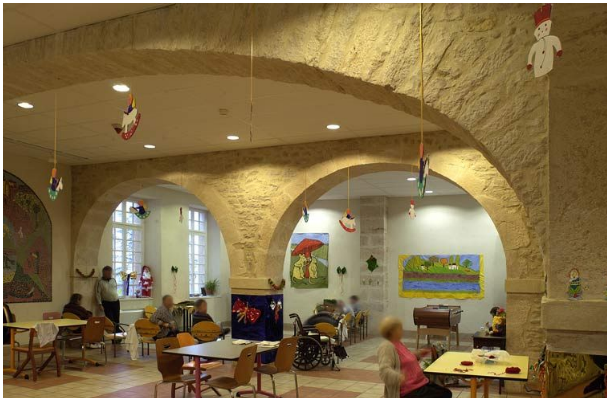
Corps de bâtiment principal : salle des malades (à l'est de la chapelle). 21, Alise-Sainte-Reine Bains