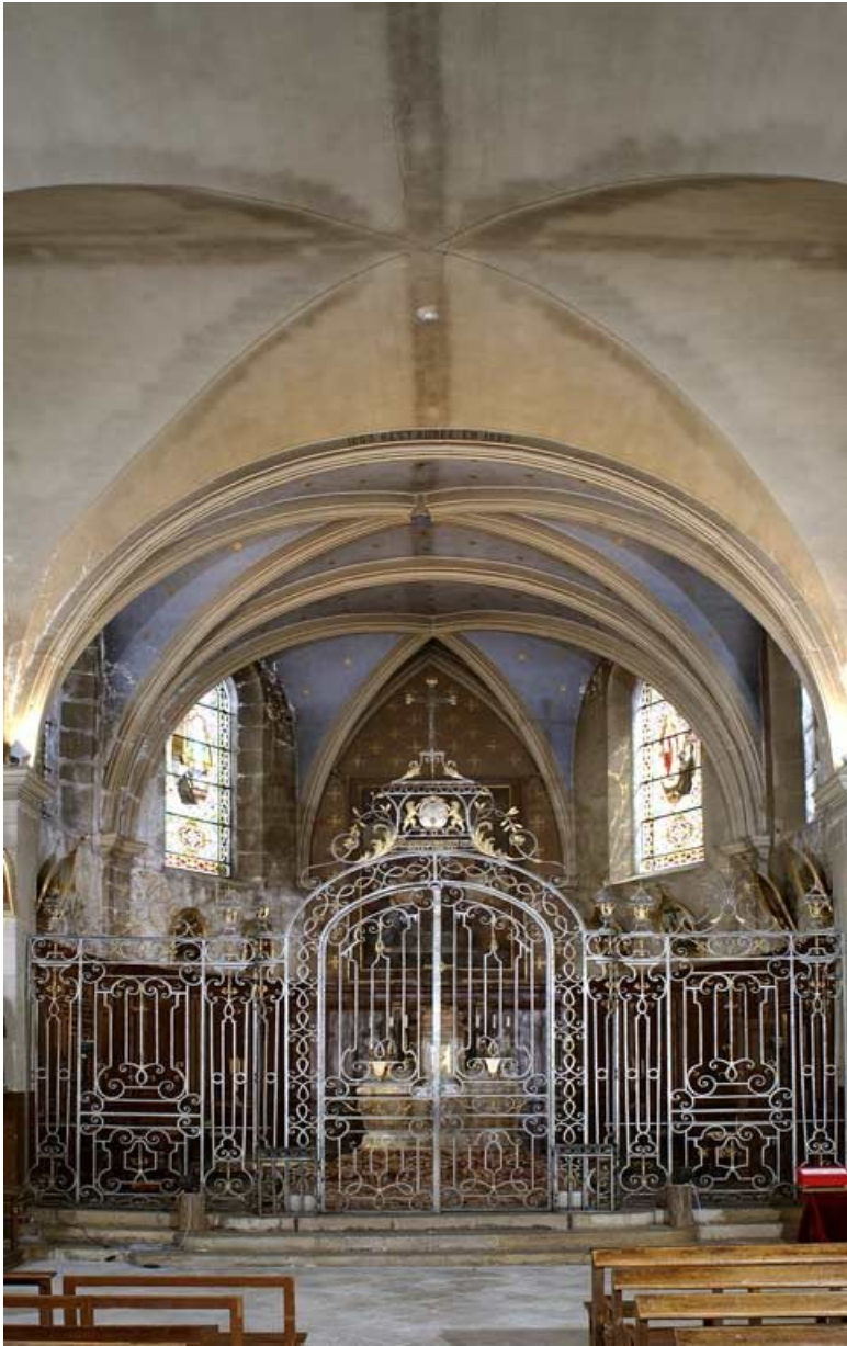
Chapelle vue depuis l'entrée.