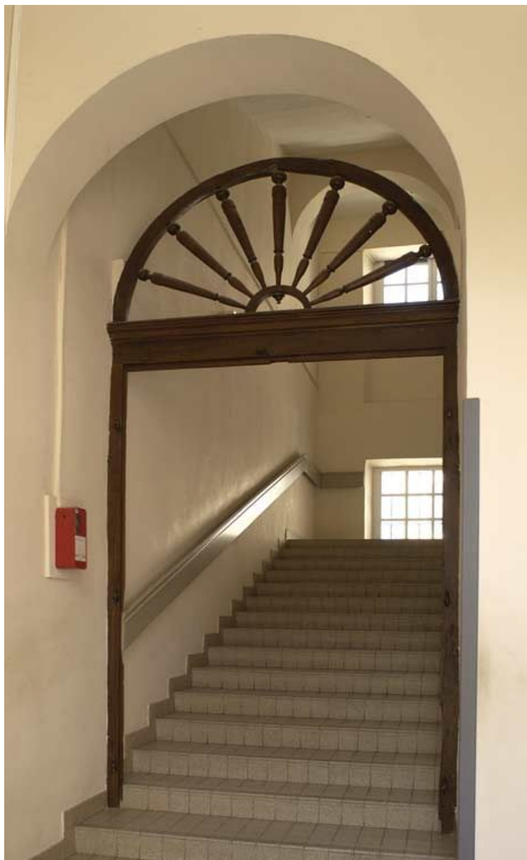
Aile droite dite "le grand corps de logis" : deuxième volée de l'escalier (accès au premier étage). 21, Alise-Sainte-Reine Bains