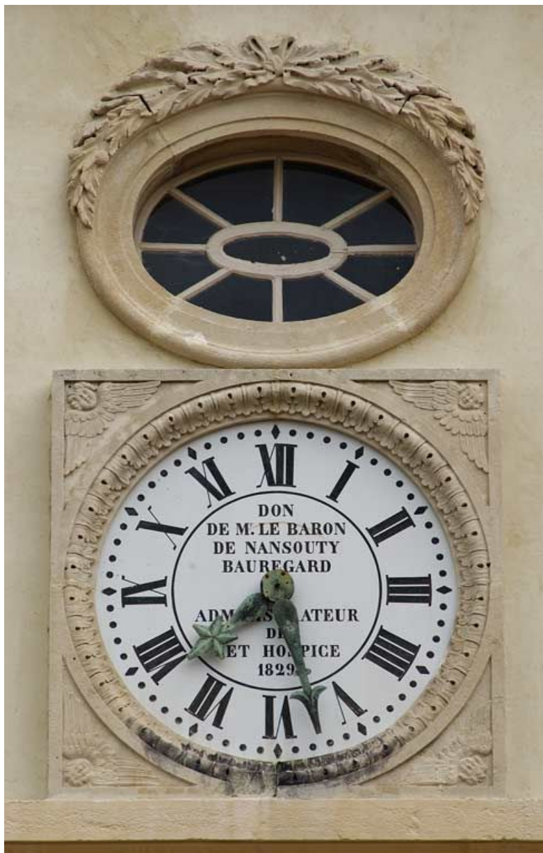
Cour antérieure, façade de la chapelle : oculus et horloge. 21, Alise-Sainte-Reine Bains