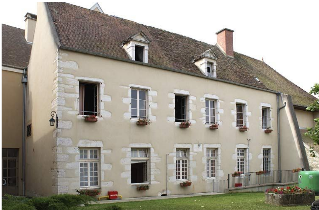
Bâtiment de la communauté des soeurs, élévation nord.