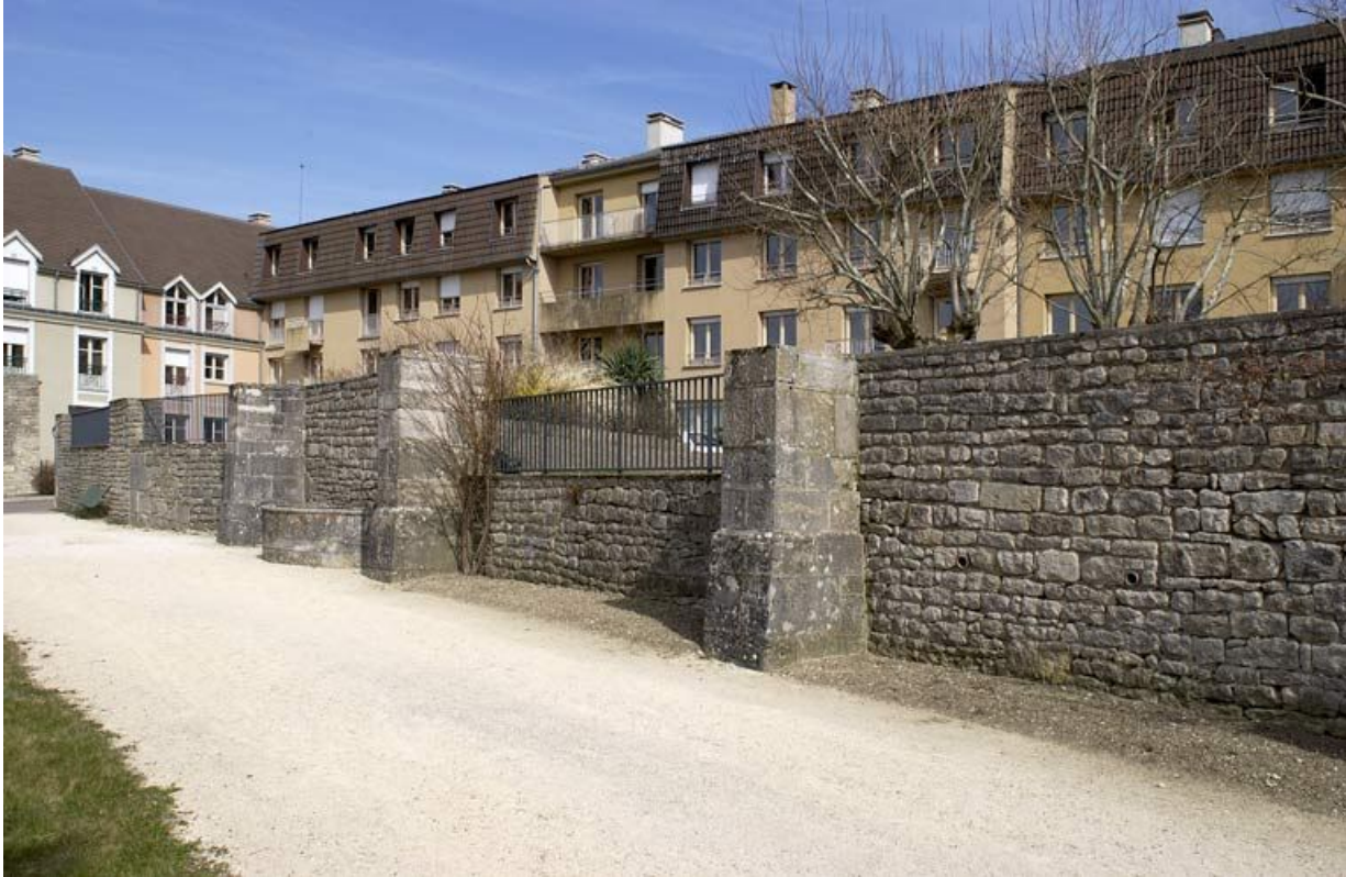
Vestiges des bâtiments ouest de l'ancienne cour Saint-Louis (élévations ouest). 21, Alise-Sainte-Reine Bains