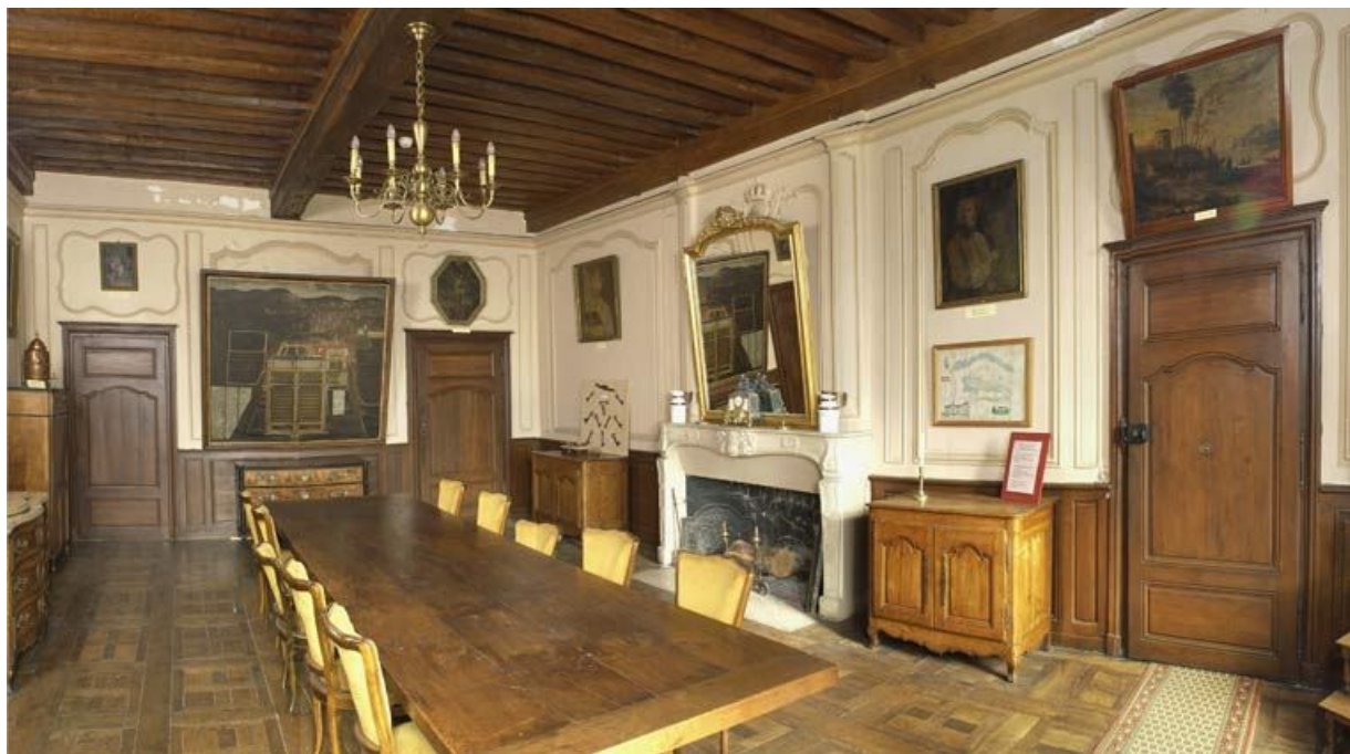
Corps de bâtiment principal : salle de réunion du Conseil d'administration (à l'étage, à droite de la chapelle). 21, Alise-Sainte-Reine Bains