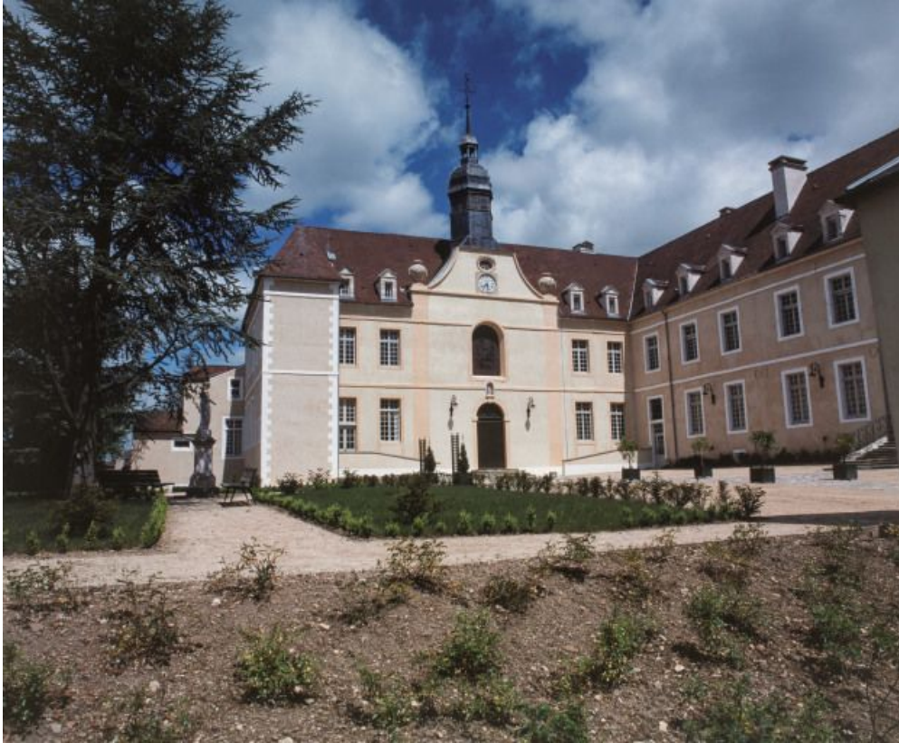
Vue d'ensemble de la cour antérieure.