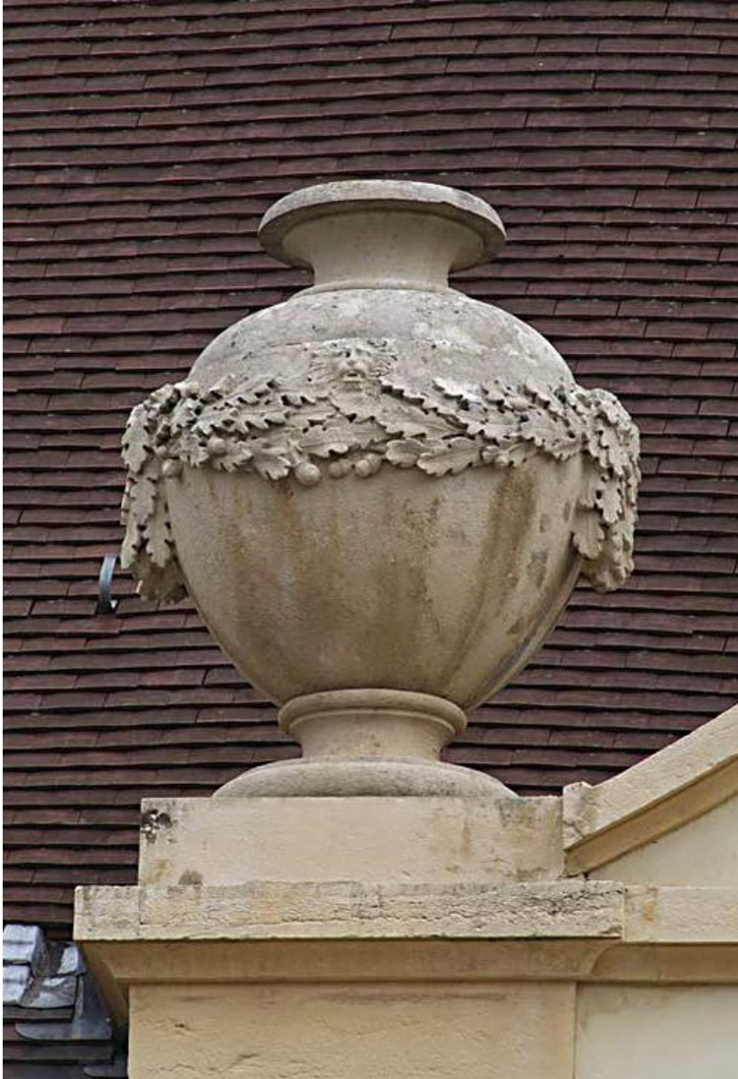
Cour antérieure, façade de la chapelle : vase d'amortissement. 21, Alise-Sainte-Reine Bains