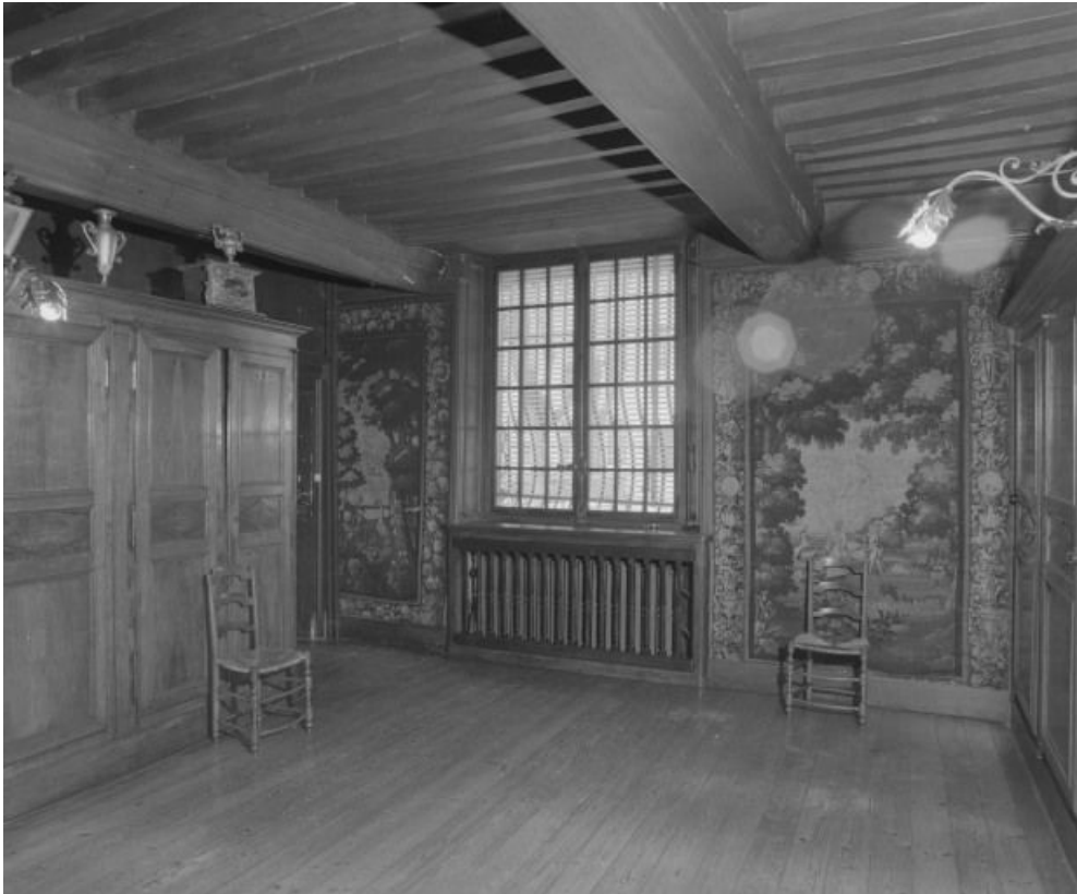
Grande sacristie, vue vers la cour.