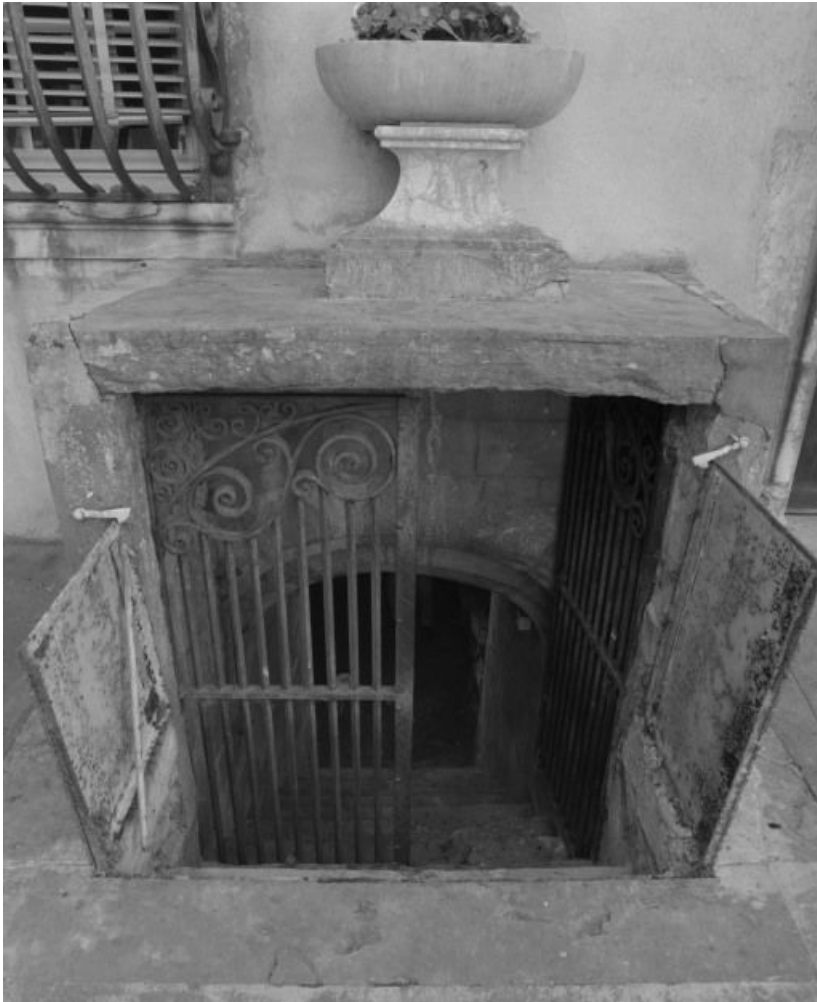
Entrée de la crypte sous la sacristie.