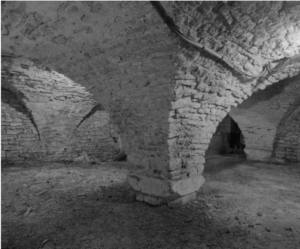
Partie de la crypte se prolongeant sous la sacristie.