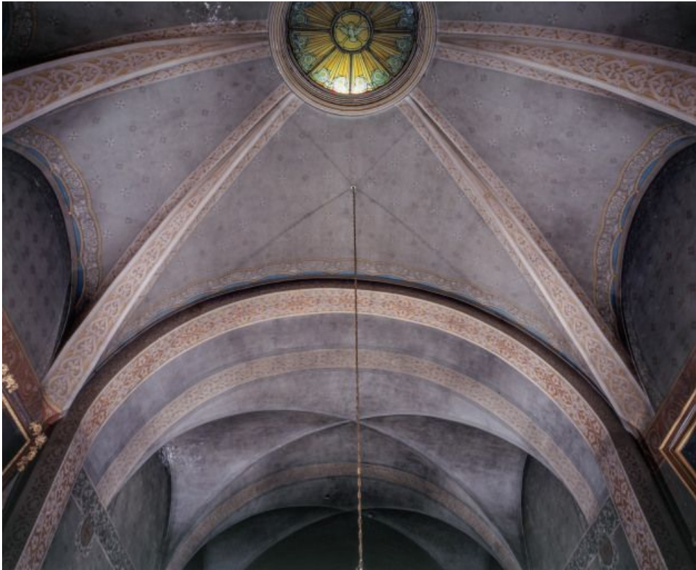
Voûte du chœur.