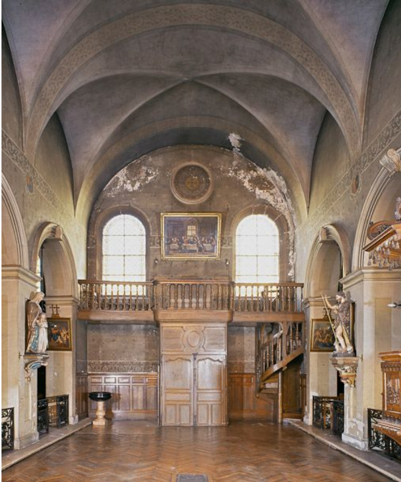
Nef, vaisseau central, vue prise du chœur. 21, Beaune Lorraine