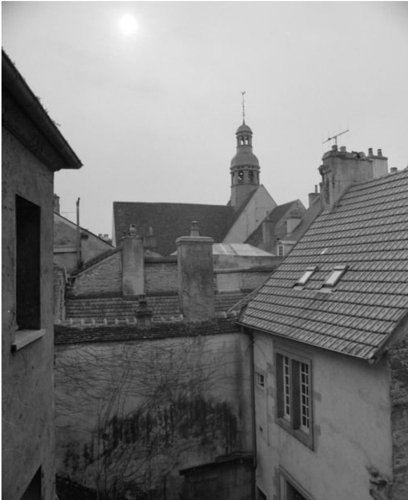
Côté nord des toitures.