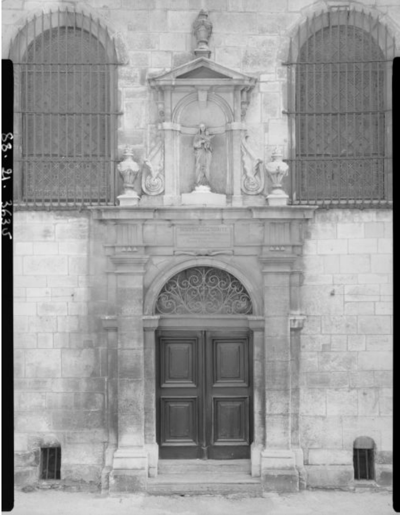
Détail de la façade.