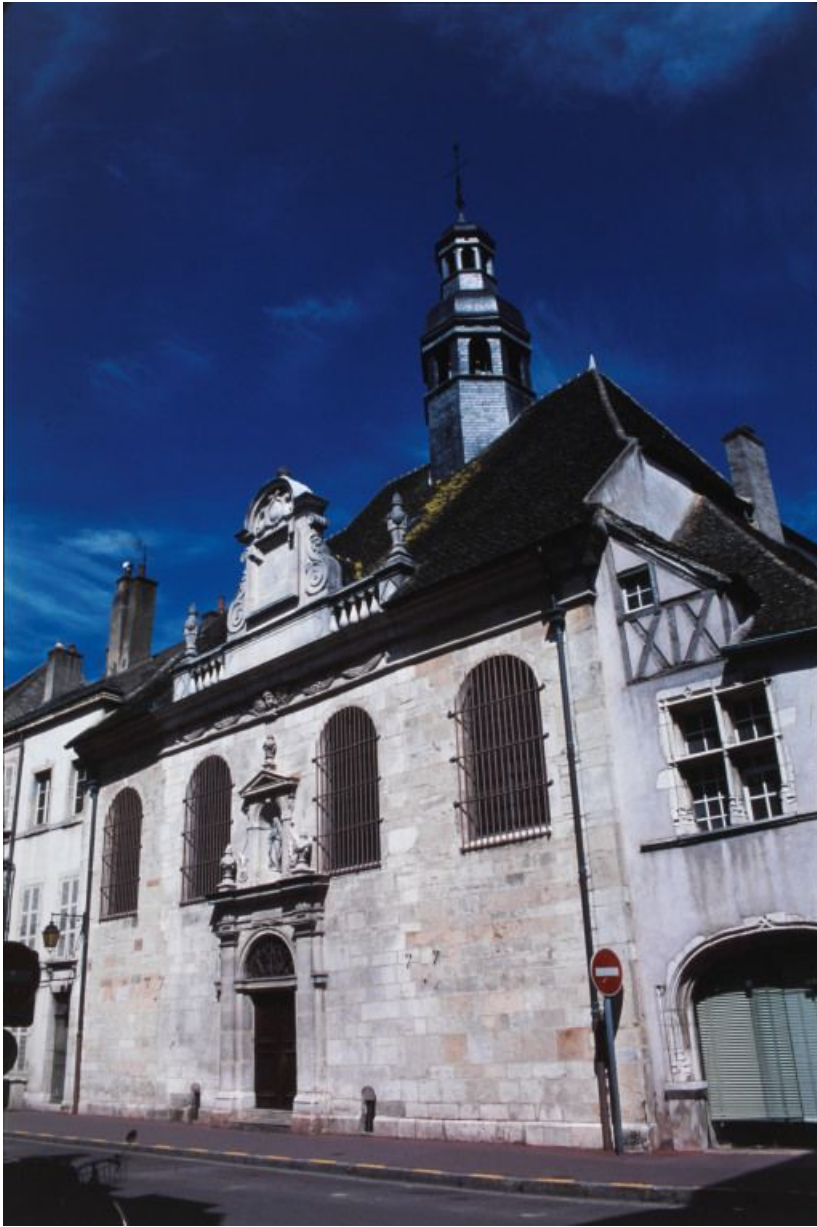
Vue d'ensemble depuis la rue de Lorraine. 21, Beaune Lorraine