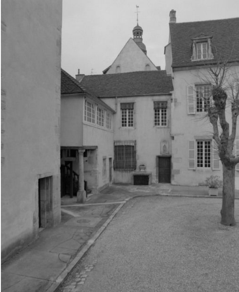
Pignon du chœur surplombant les sacristies. 21, Beaune Lorraine