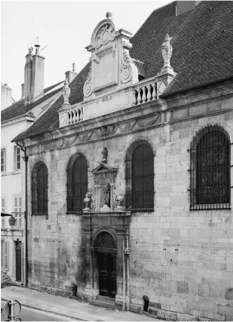
Façade rue de Lorraine.