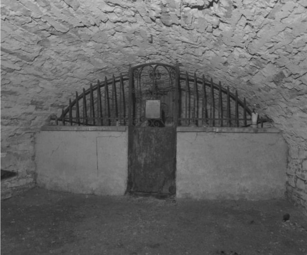
Caveau du collatéral gauche, vue prise de l'est ; partie où reposent les 12 premières soeurs de l'hôpital, décédées de 1715 à 1783. 21, Beaune Lorraine