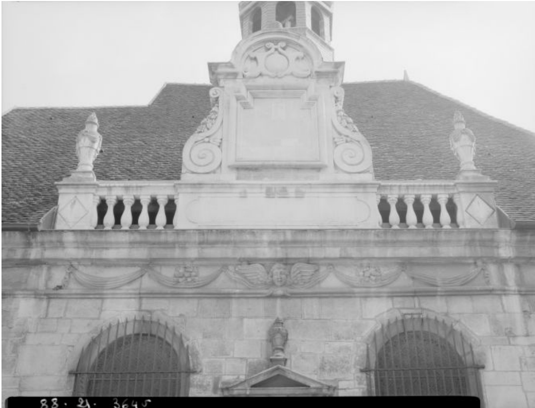
Détail du couronnement de la façade.