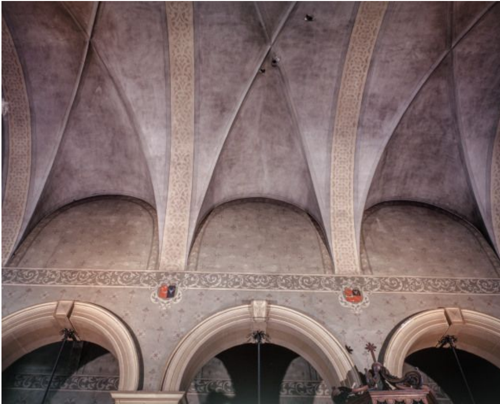
Nef, vaisseau central, détail des grandes arcades et de la voûte.