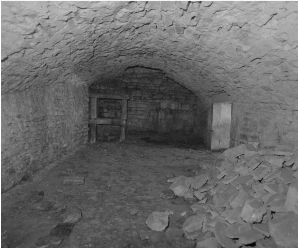
Caveau du collatéral droit, vue prise de l'ouest.