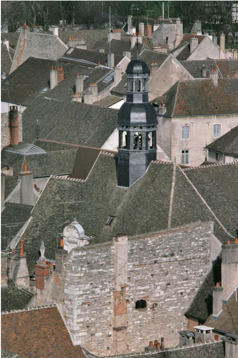
Vue d'ensemble prise du clocher de la Collégiale Notre-Dame.