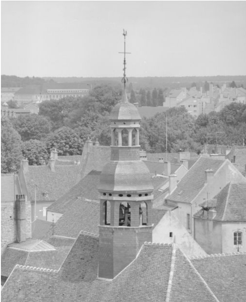
Vue du clocher depuis le beffroi.