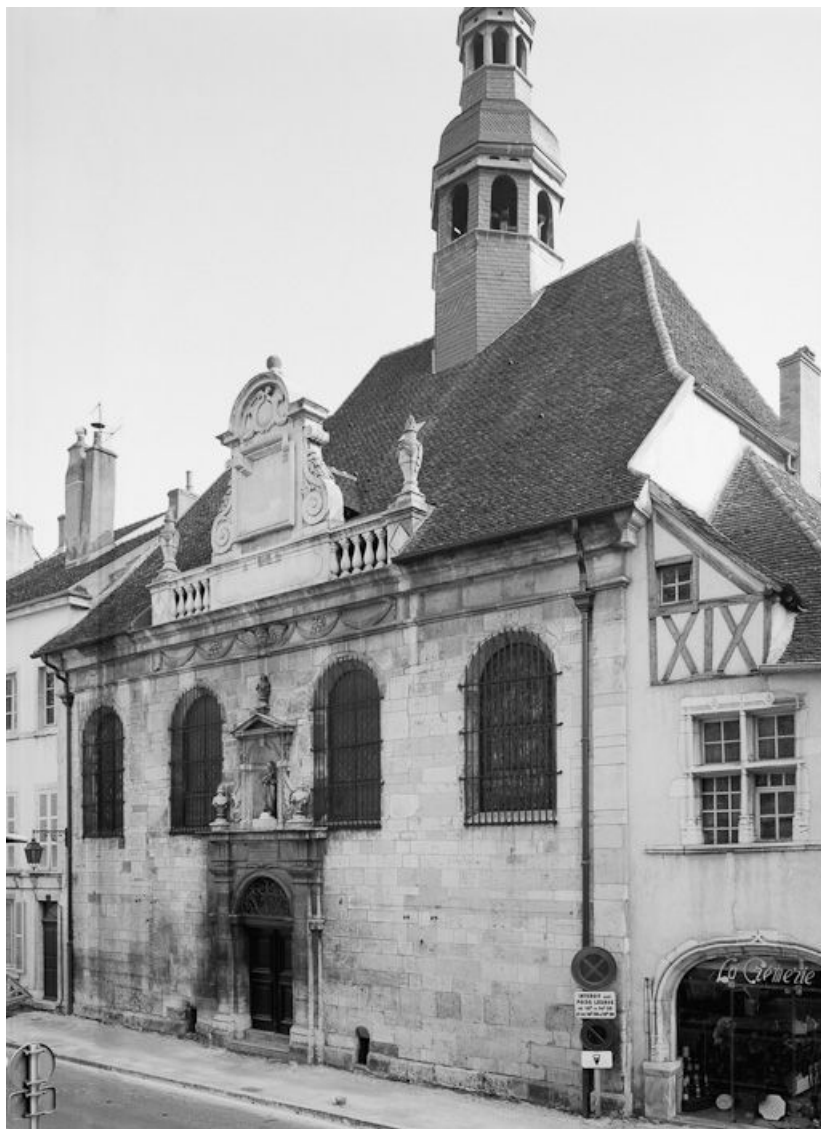
Vue d'ensemble depuis la rue de Lorraine.