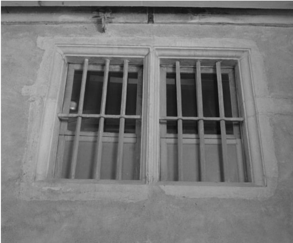
Fenêtre de la petite sacristie, vue prise côté cour.