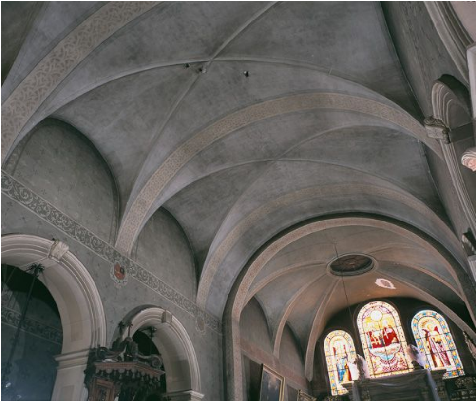
Voûtes du vaisseau central de la nef et du chœur.