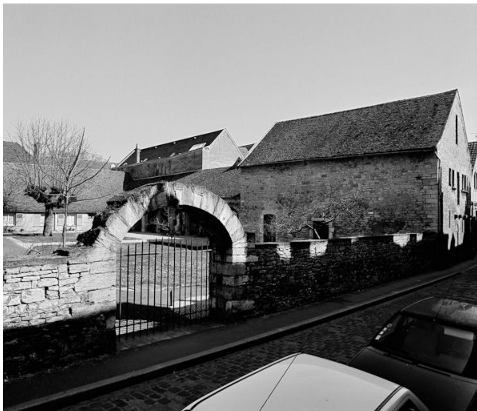
Vue d'ensemble de trois-quarts depuis la rue.