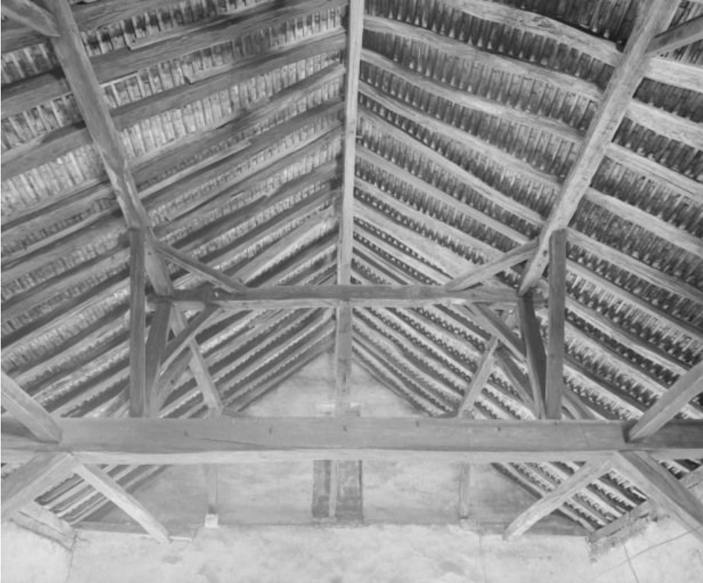
Niveau supérieur : vue de la charpente.