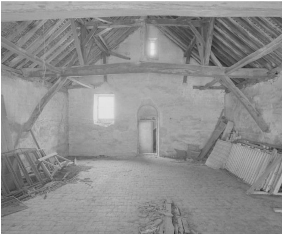
Niveau supérieur : vue d'ensemble prise depuis le pignon sur rue.