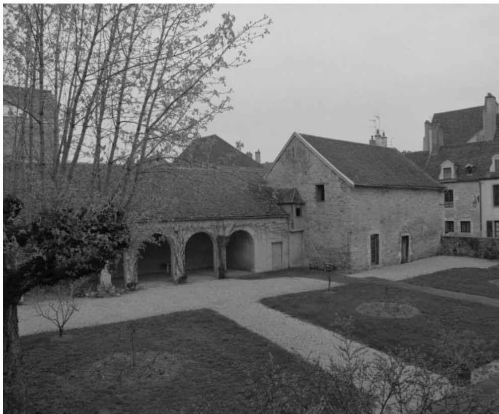
Vue d'ensemble, de trois-quarts, depuis la cour.