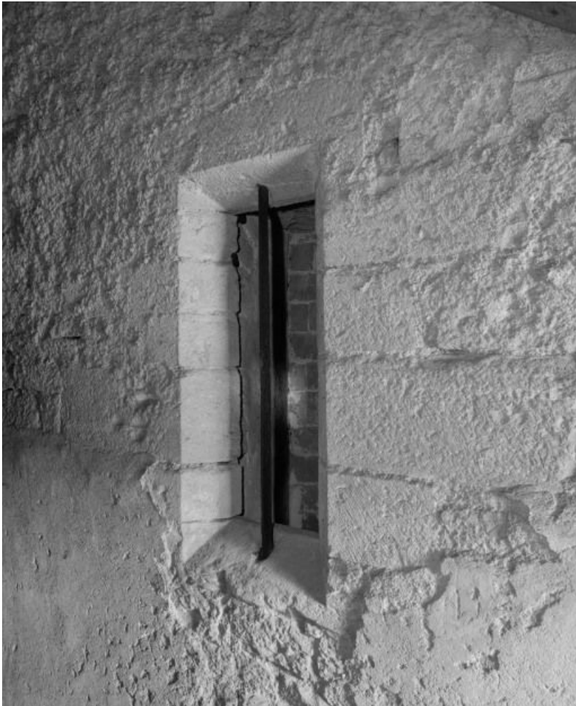
Niveau supérieur : fenêtre à droite de la porte du pignon sur cour. 21, Beaune, 3 rue Rousseau Deslandes