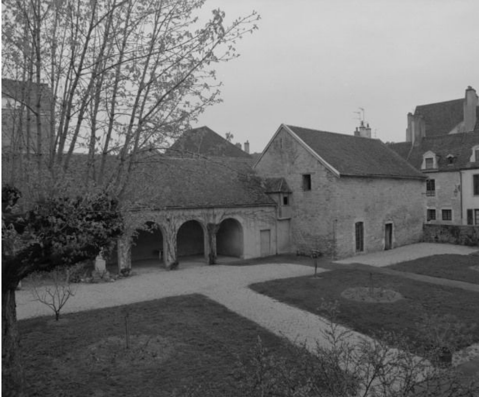
Vue d'ensemble, de trois-quarts, depuis la cour.