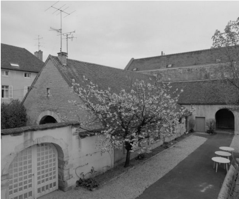
Ancienne grange vigneronne.