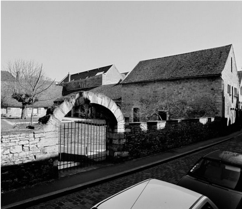
Vue d'ensemble de trois-quarts depuis la rue.