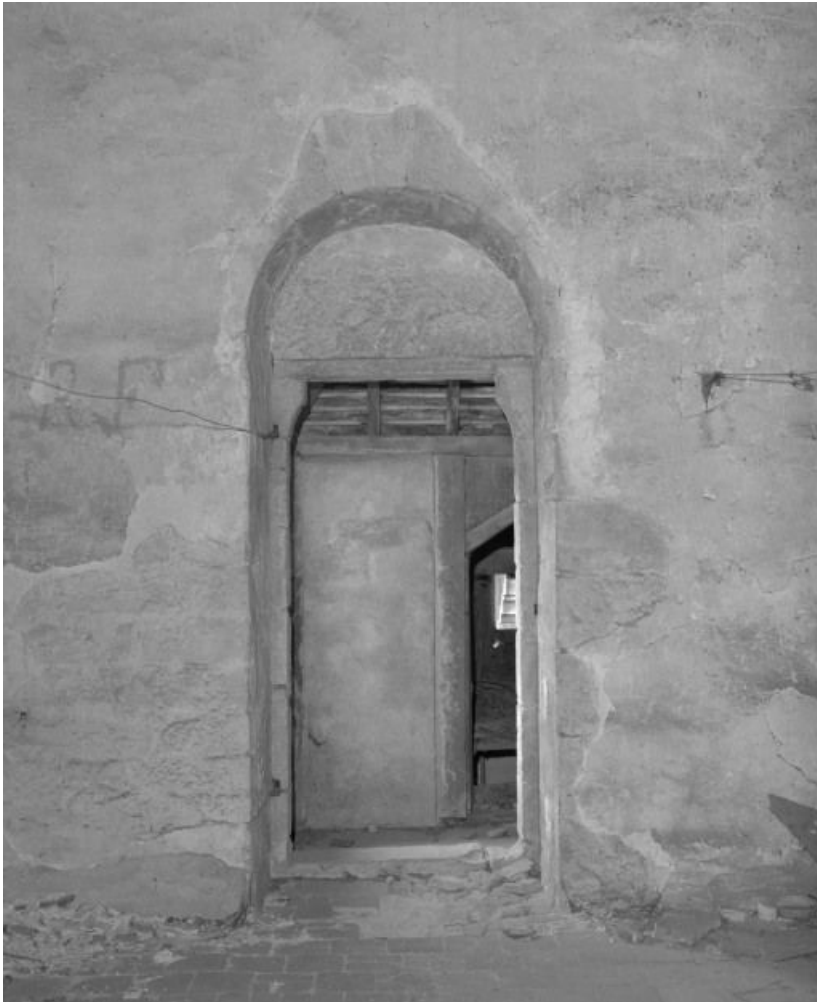
Niveau supérieur : porte du pignon sur cour.