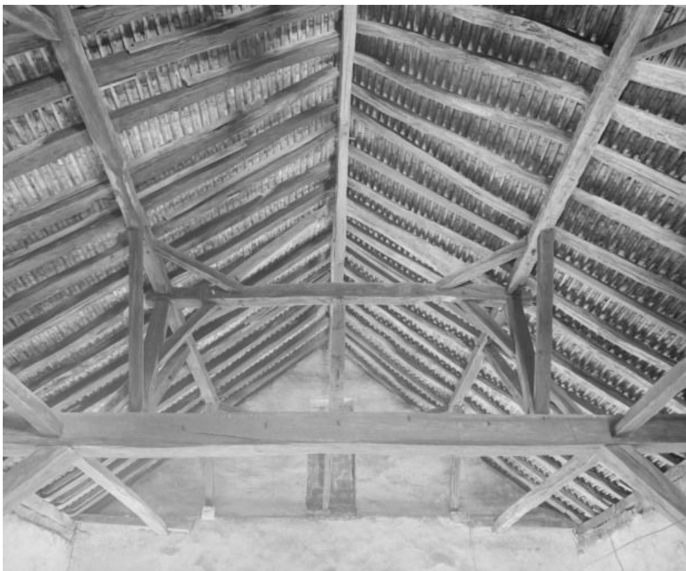
Niveau supérieur : vue de la charpente.