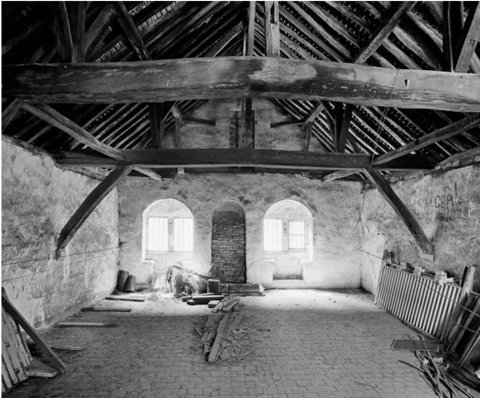
Niveau supérieur : vue d'ensemble prise depuis le pignon sur cour.