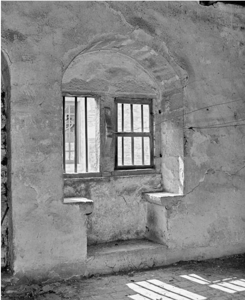
Niveau supérieur : embrasure à coussièges des fenêtres du pignon sur rue. 21, Beaune, 3 rue Rousseau Deslandes