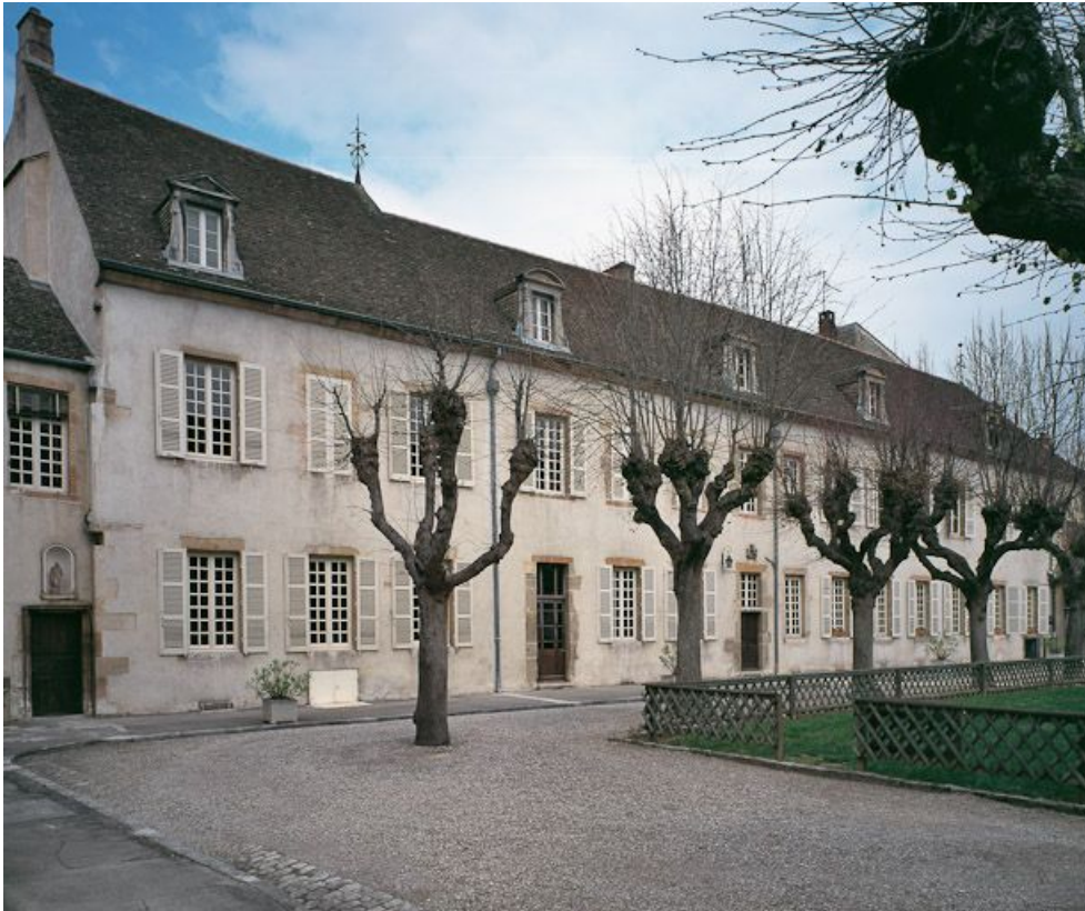
Bâtiment de la Communauté des sœurs et des orphelines, élévation est, sur cour. 21, Beaune, 3 rue Rousseau Deslandes