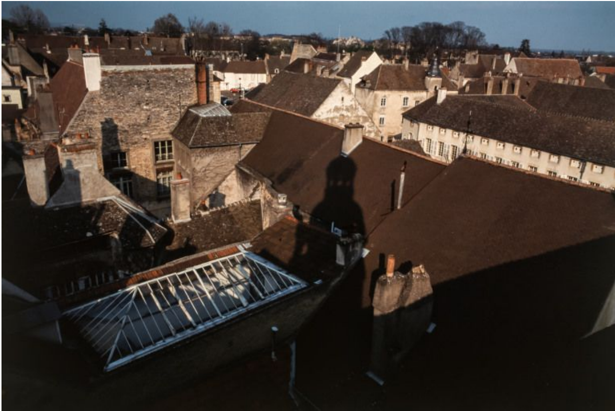
Toitures des différents corps composant le bâtiment de la Communauté des soeurs et des orphelines, vue prise du clocher de l'église.