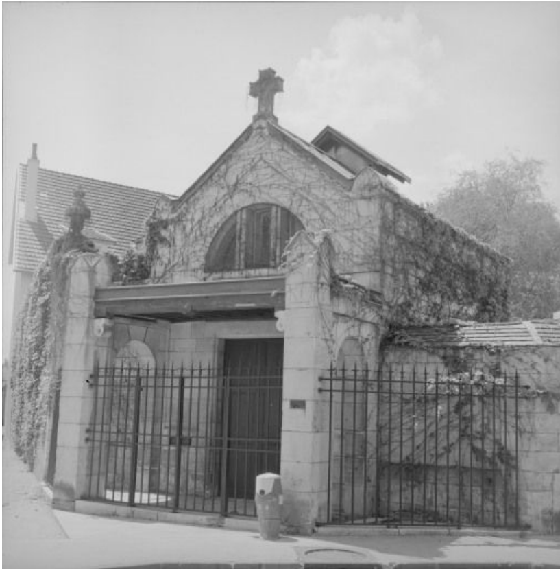
Dépositaire : élévation sur la rue.