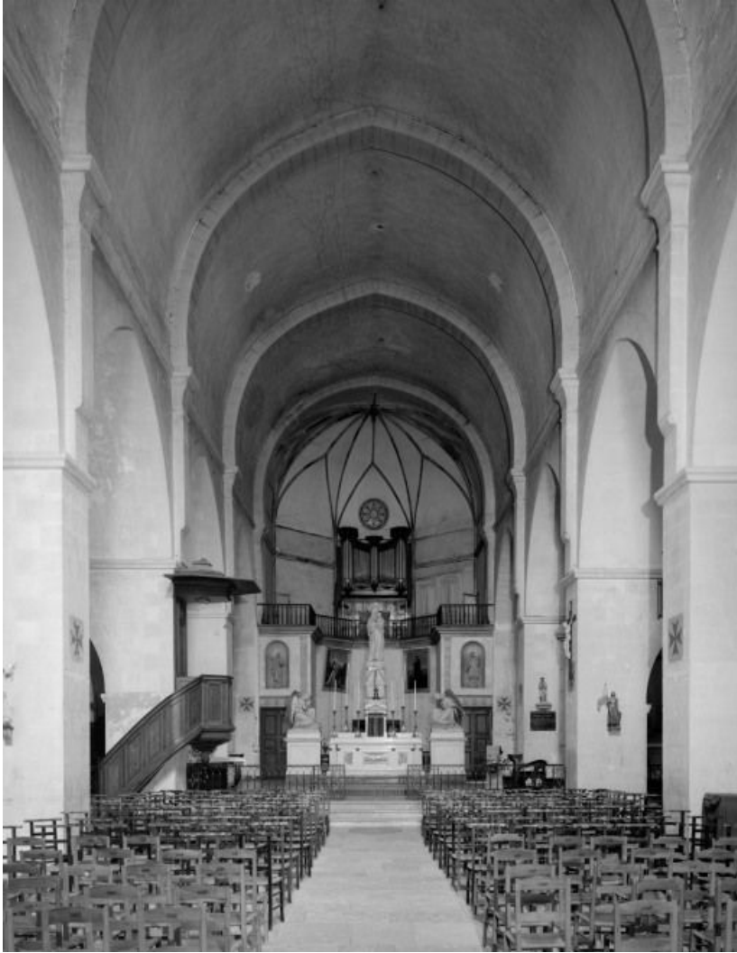
Eglise : nef et chœur, vue prise de l'entrée. 21, Châtillon-sur-Seine, 10 rue de la Libération