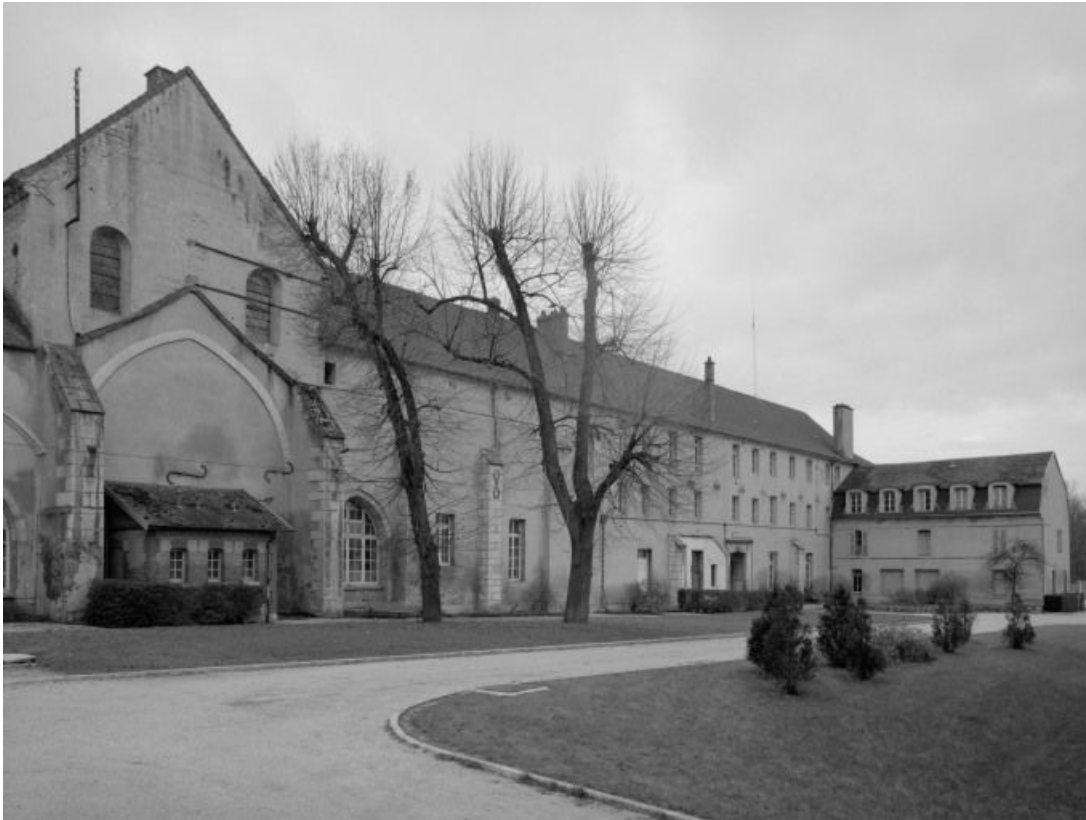
Façade postérieure du bâtiment conventuel et chevet de l'église.

21, Châtillon-sur-Seine, 10 rue de la Libération