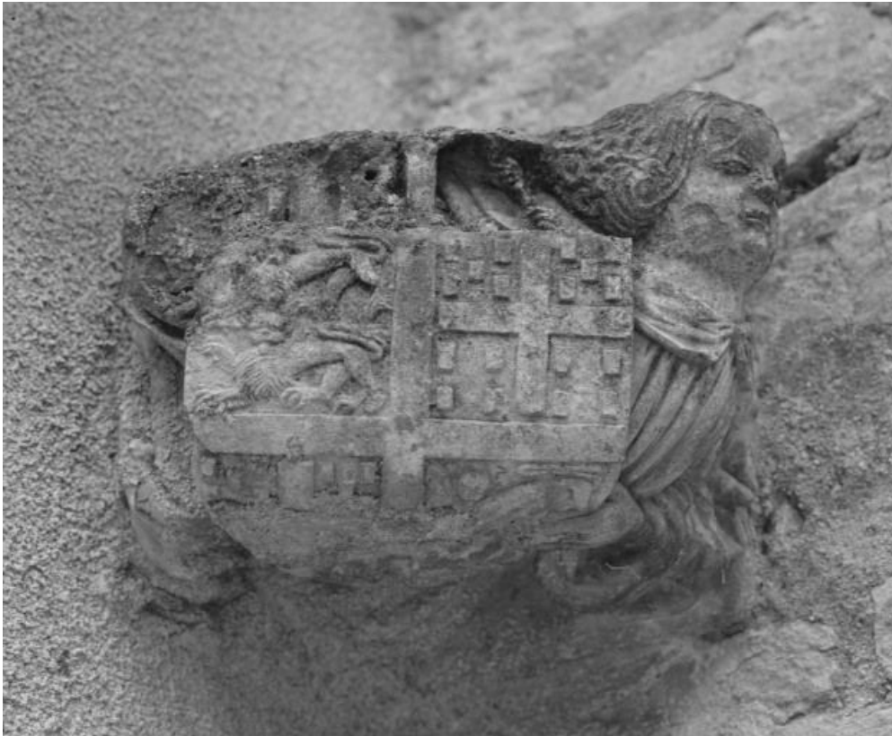
Eglise : élévation gauche, culot aux armes de l'abbé François de Dinteville, dans l'angle du transept et du bas-côté. 21, Châtillon-sur-Seine, 10 rue de la Libération