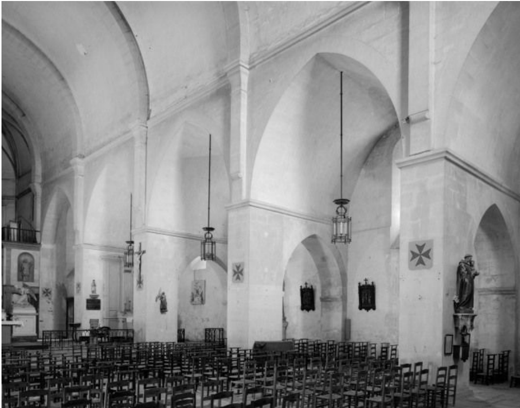
Eglise : nef et bas-côté droit, vue prise depuis la première travée du bas-côté gauche.

21, Châtillon-sur-Seine, 10 rue de la Libération