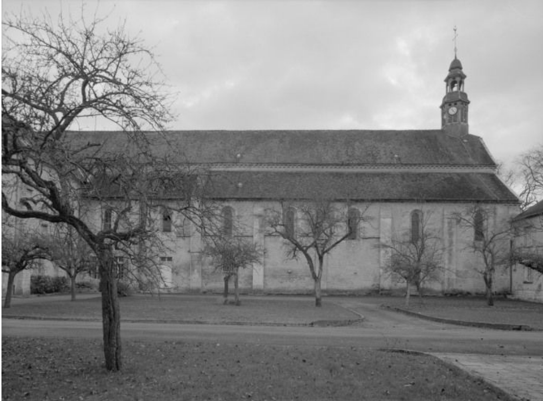
Eglise : élévation gauche.

21, Châtillon-sur-Seine, 10 rue de la Libération