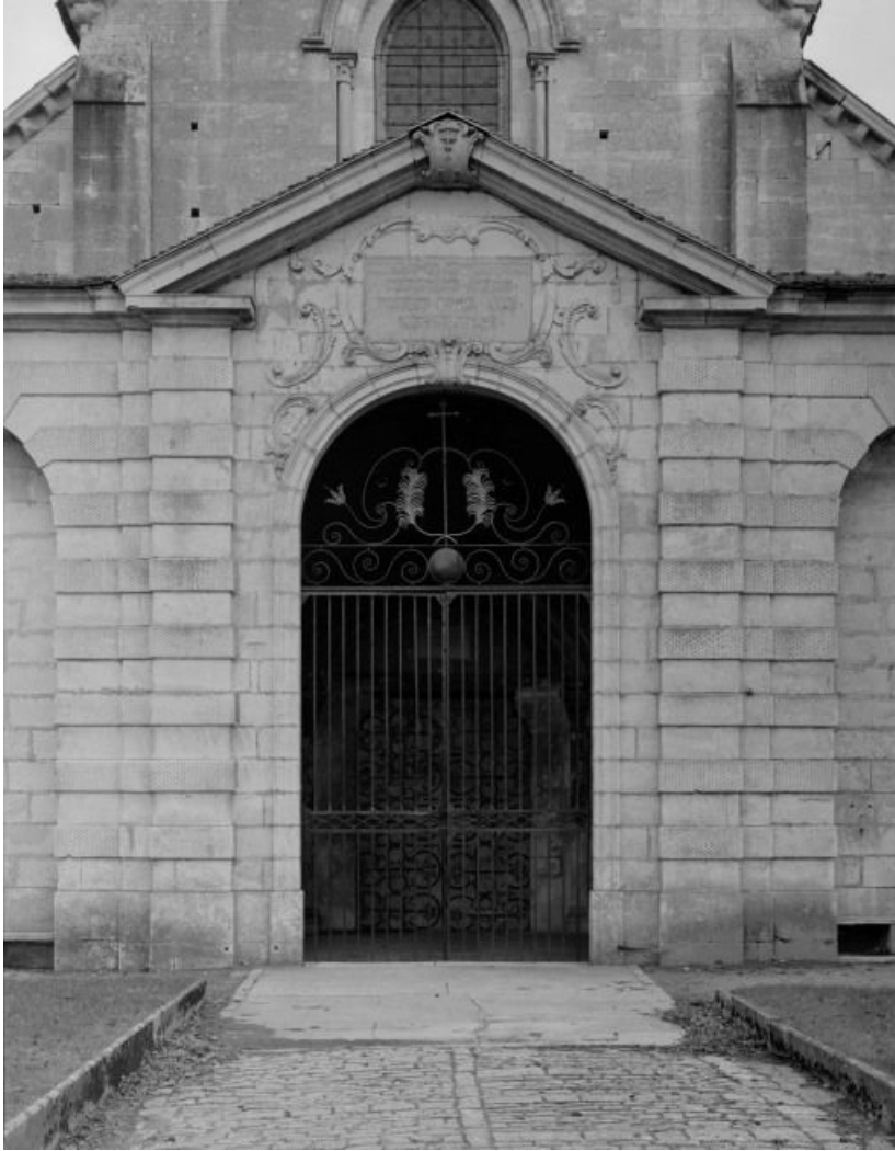
Eglise : porche.

21, Châtillon-sur-Seine, 10 rue de la Libération