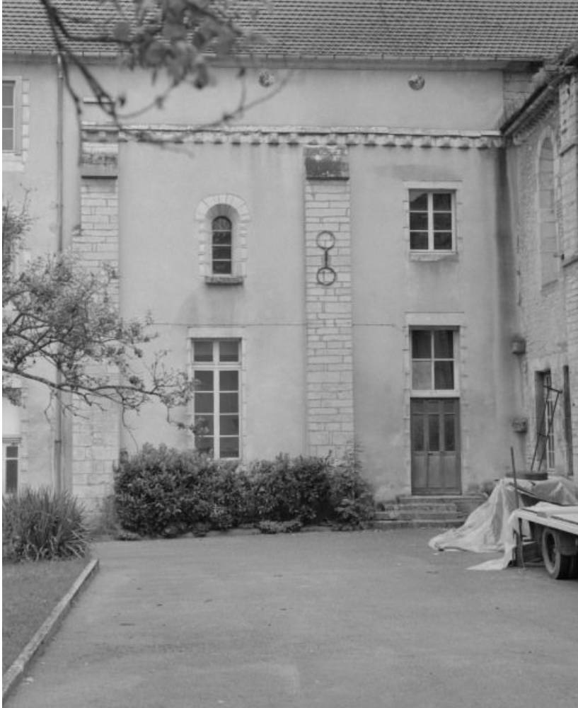
Eglise : bras gauche du transept, élévation antérieure.

21, Châtillon-sur-Seine, 10 rue de la Libération