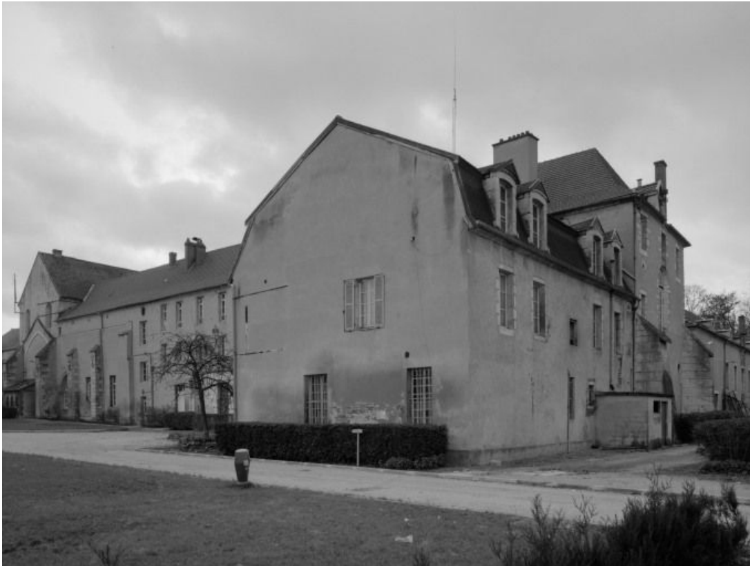
Bâtiment conventuel : élévations postérieure et latérale.

21, Châtillon-sur-Seine, 10 rue de la Libération