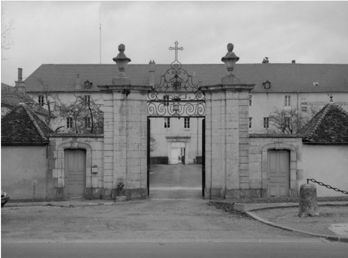
Portail de l'abbaye.

21, Châtillon-sur-Seine, 10 rue de la Libération