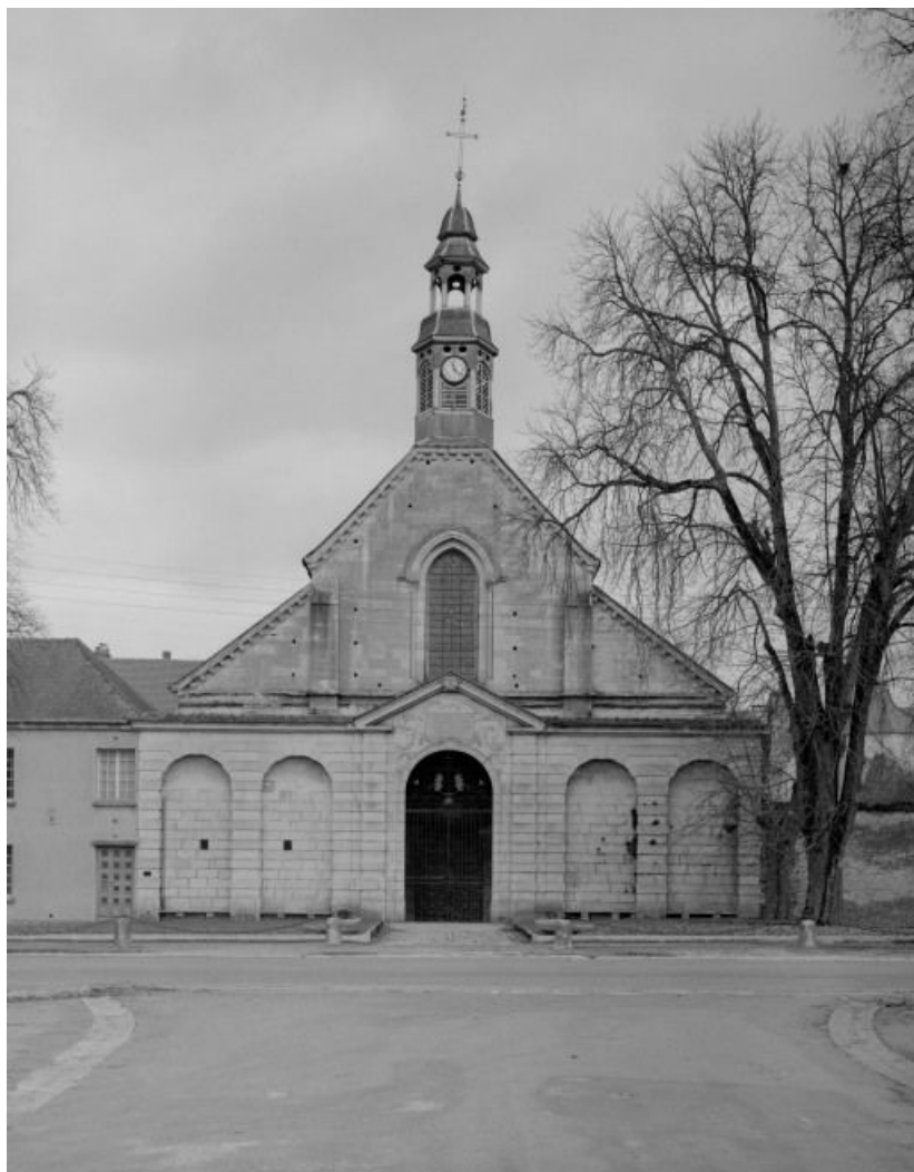
Eglise : façade.

21, Châtillon-sur-Seine, 10 rue de la Libération