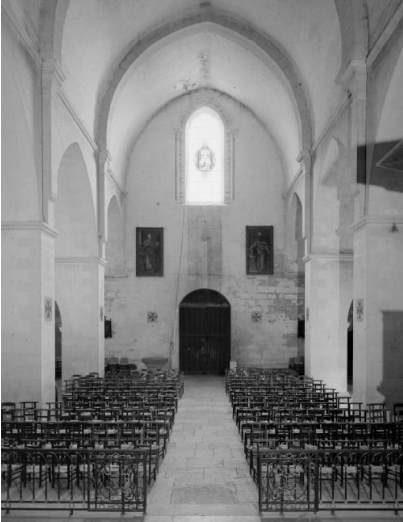
Eglise : nef, vue prise du chœur.

21, Châtillon-sur-Seine, 10 rue de la Libération