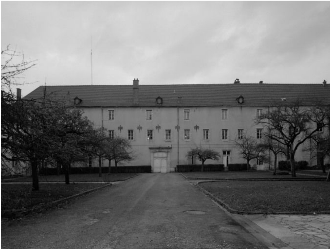
Bâtiment conventuel : façade.

21, Châtillon-sur-Seine, 10 rue de la Libération