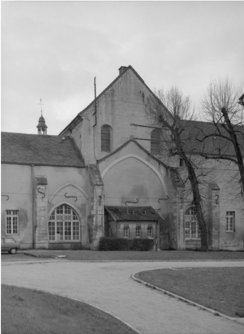
Eglise : chevet.

21, Châtillon-sur-Seine, 10 rue de la Libération