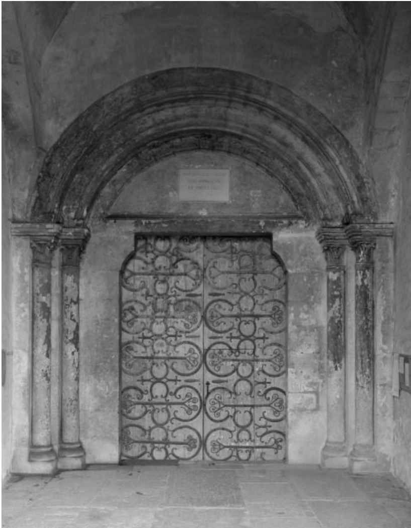
Eglise : porte antérieure de la nef.

21, Châtillon-sur-Seine, 10 rue de la Libération