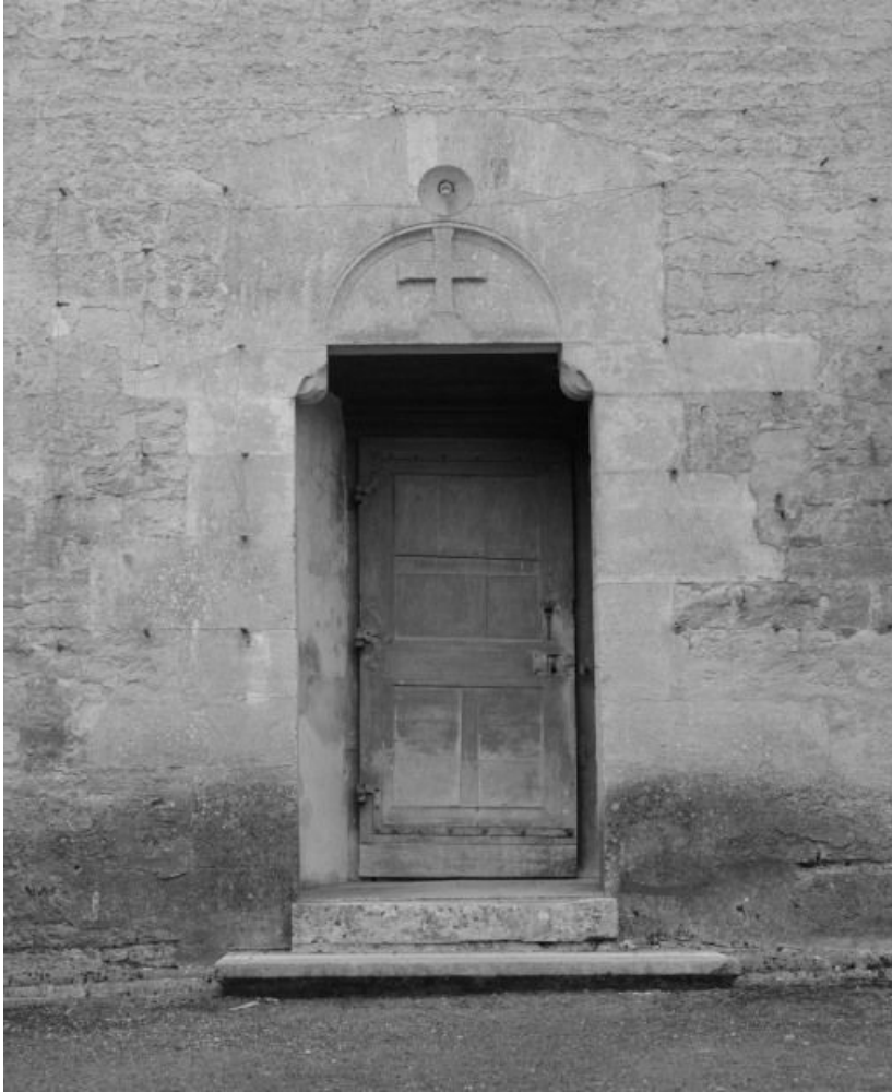
Eglise : élévation gauche, porte de la deuxième travée du bas-côté. 21, Châtillon-sur-Seine, 10 rue de la Libération