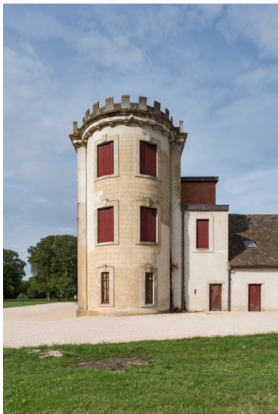
Élévation postérieure (est) : corps sud (remise et sellerie au rez-de-chaussée, salle des fêtes au 1er étage et logement au 2e). 21, Chevigny-en-Valière, 23 rue Mercey