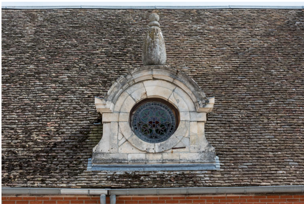
Élévation antérieure : oeil-de-boeuf du corps central.