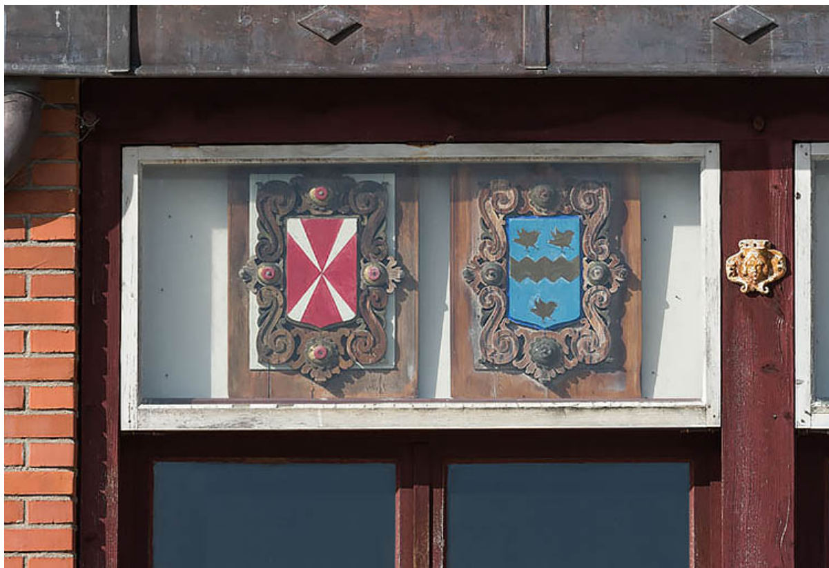
Communs (mur oriental du foyer) : deux armoiries (1er ensemble sur six en partant de la gauche).