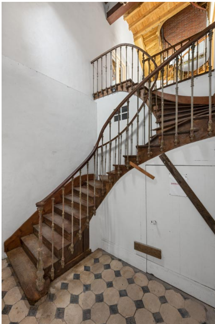
Corps sud : escalier desservant le 1er étage.