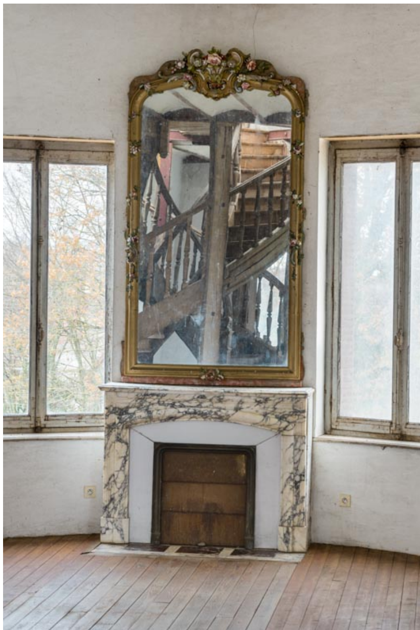
Corps sud, 2e étage : cheminée.