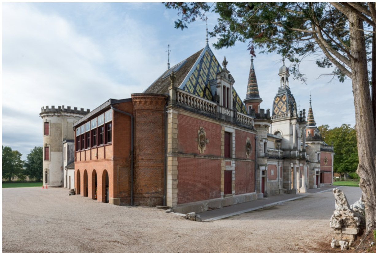
Vue d'ensemble, depuis le nord-est.