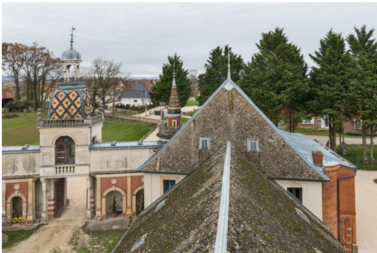
Toitures du corps nord et du corps central, depuis le "Donjon".