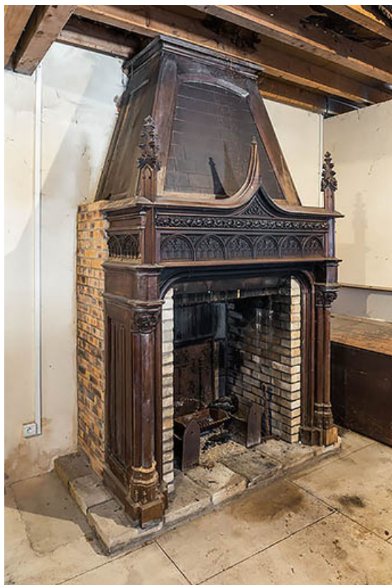
Corps central : cheminée au rez-de-chaussée.