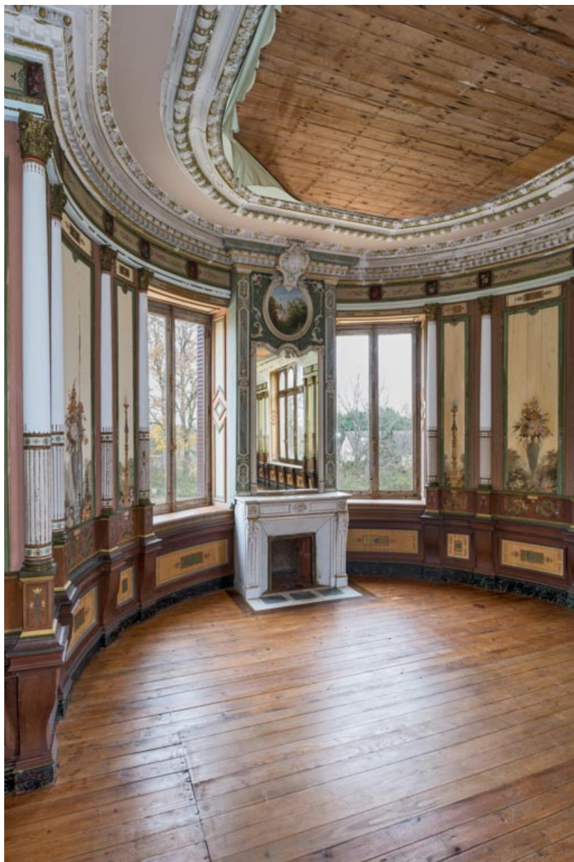
Corps sud, 1er étage : extrémité est.