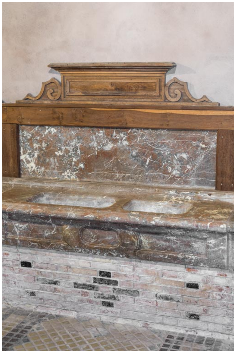
Corps central, écurie : détail d'une mangeoire en marbre.