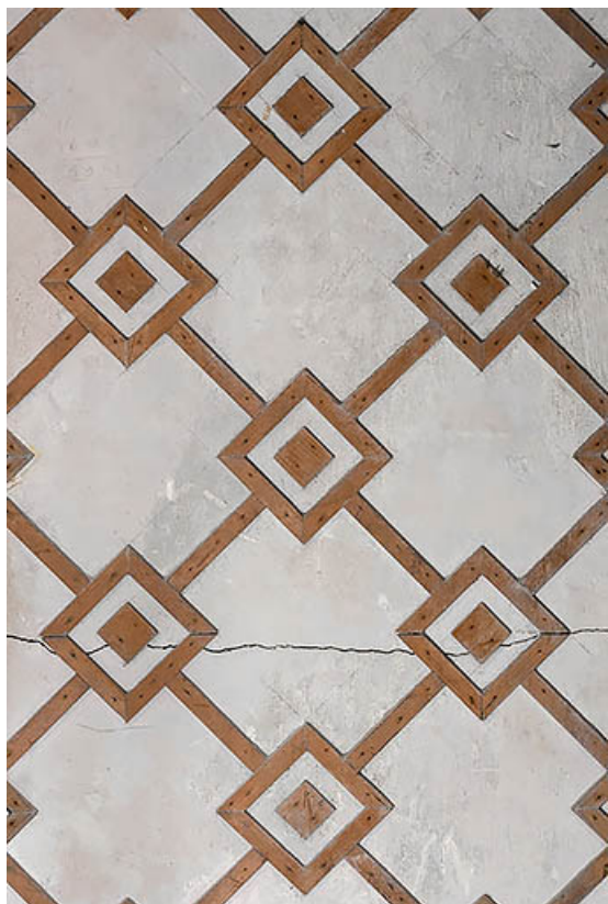
Corps nord (théâtre) : décor dans la cage d'escalier donnant accès au balcon. 21, Chevigny-en-Valière, 23 rue Mercey