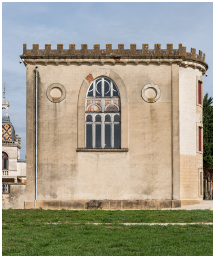
Élévation latérale droite (corps sud).