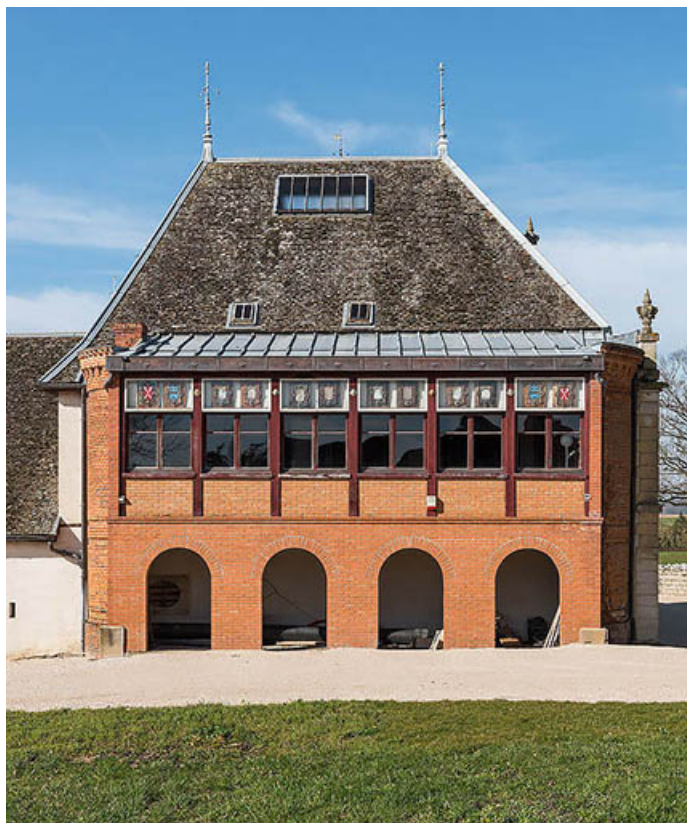
Élévation postérieure : le foyer, adossé au corps nord. Noter la tabatière dans le toit, donnant de la lumière à la salle. 21, Chevigny-en-Valière, 23 rue Mercey