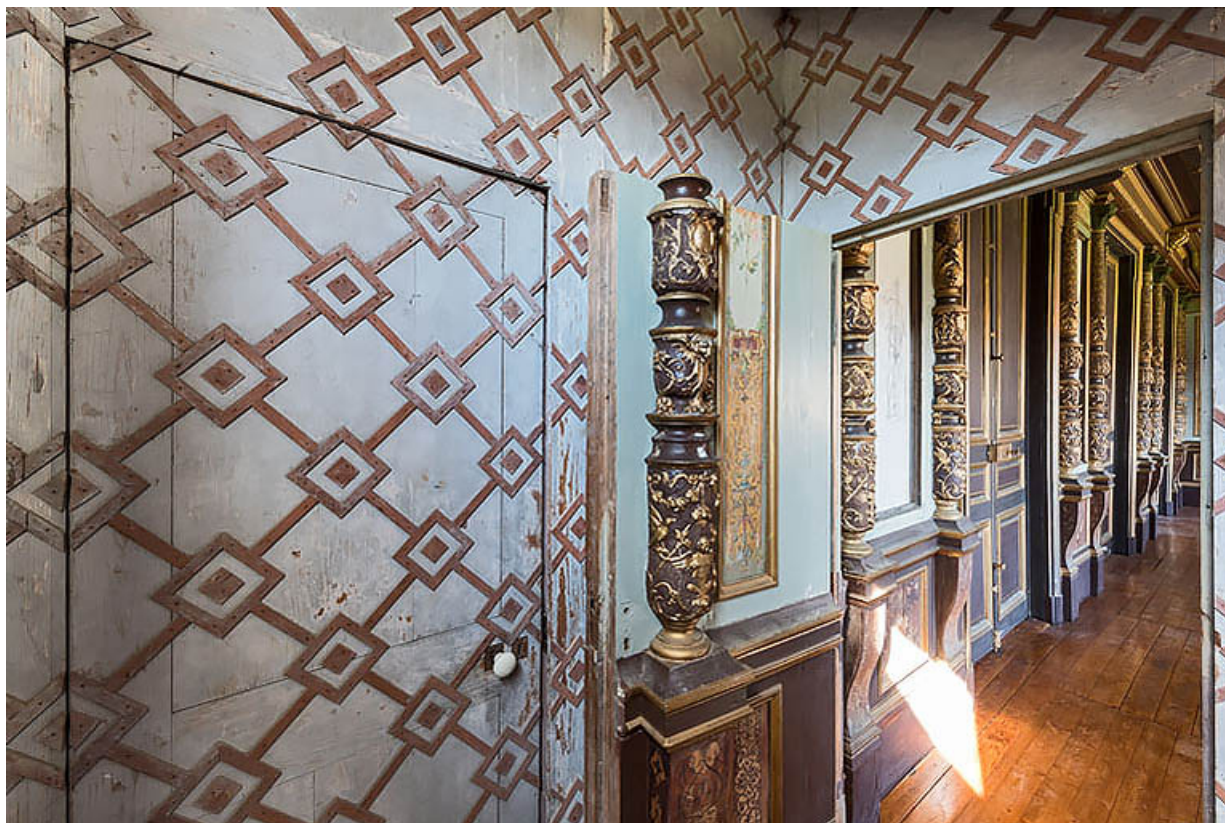
Corps nord (théâtre) : le foyer, vu depuis l'escalier d'accès au balcon.