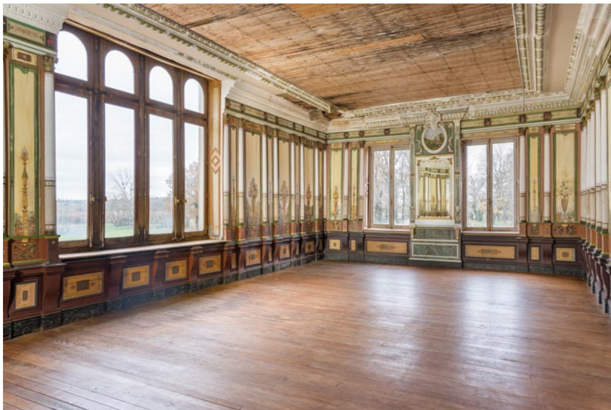
Corps sud ("Donjon") : salle des fêtes au 1er étage (vue vers l'ouest). 21, Chevigny-en-Valière, 23 rue Mercey