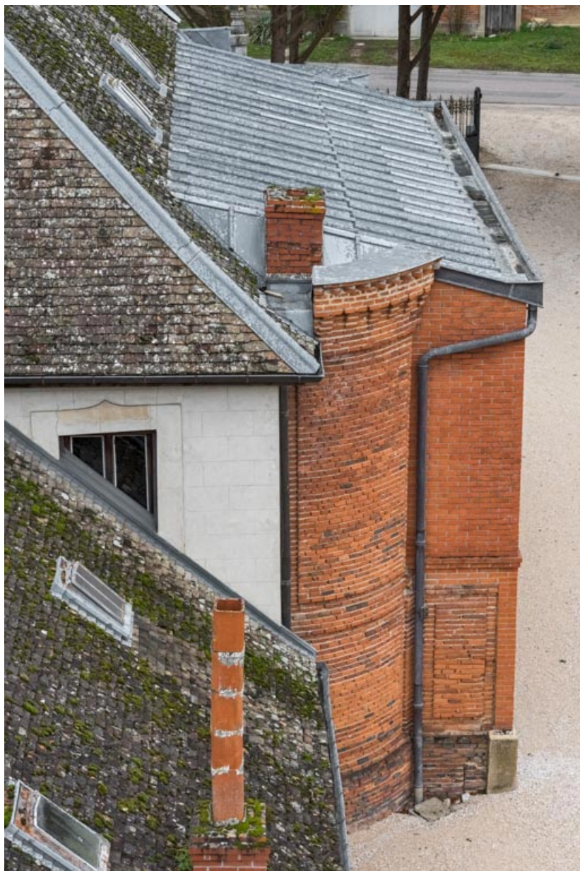
Toiture du foyer (corps nord), depuis le "Donjon".