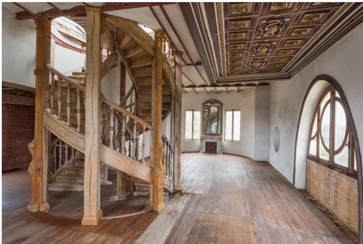
Corps sud : 2e étage avec l'escalier dit de Chambord.