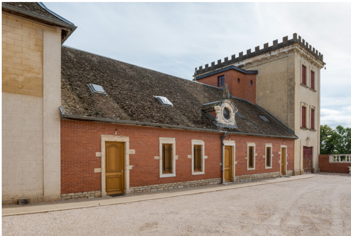
Élévation antérieure (ouest) : corps central (écurie) et corps sud (remise, salle des fêtes, logement). 21, Chevigny-en-Valière, 23 rue Mercey