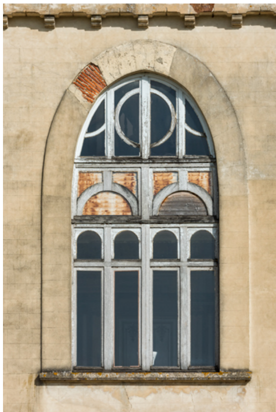
Élévation latérale droite (corps sud) : fenêtre.