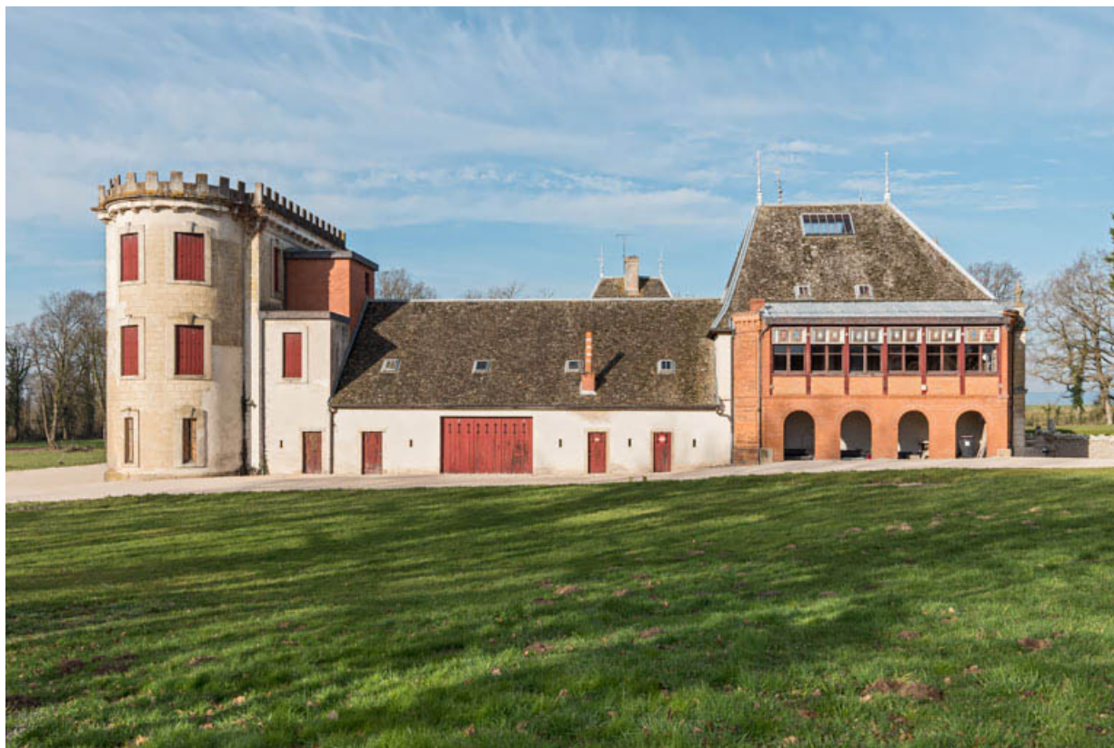
Élévation postérieure (est). De gauche à droite : corps nord (remise, sellerie, salle des fêtes et logement), central (écurie) et sud (chai et théâtre, avec le foyer en avant-plan).