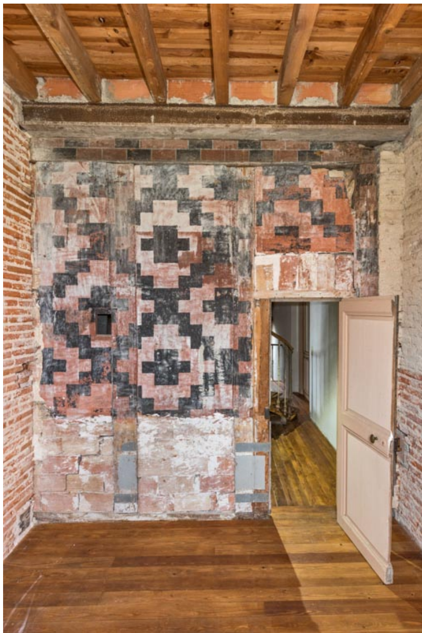
Corps sud, 1er étage : mur peint du fumoir.