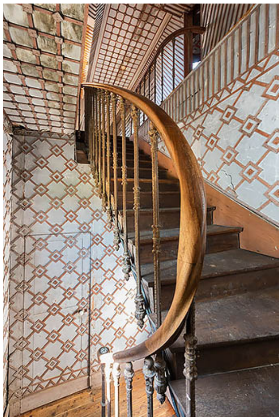
Corps nord (théâtre) : escalier d'accès au balcon.