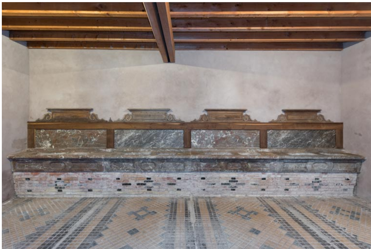
Corps central, écurie : mangroies.