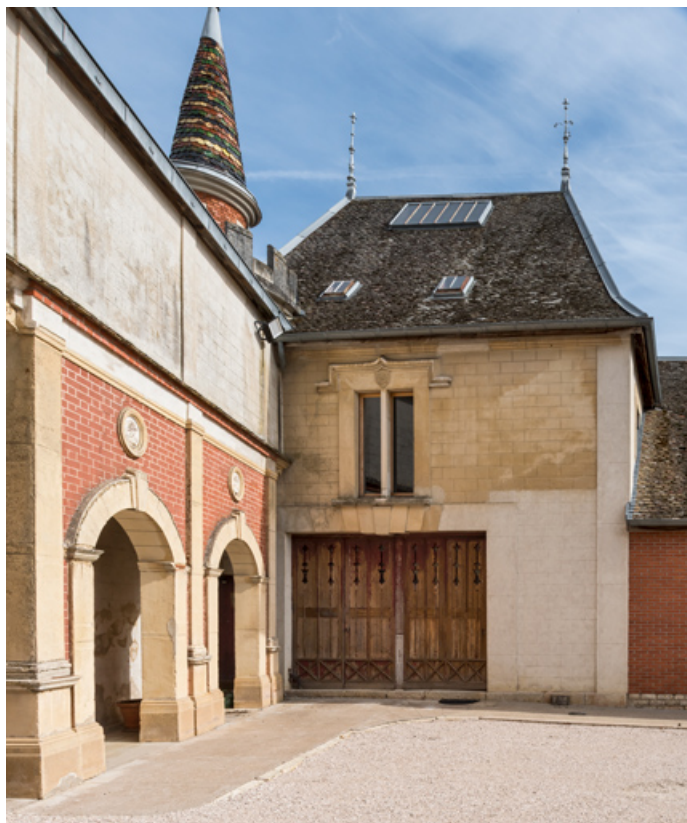
Élévation antérieure (ouest) : corps sud (chai et théâtre).