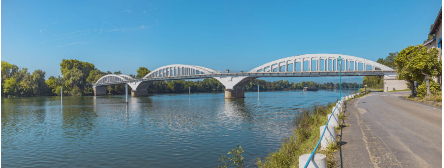
Le pont de Thoissey, vu d'aval, depuis la rive gauche.

01, Thoissey route départementale 7, lieudit : PK 63,37