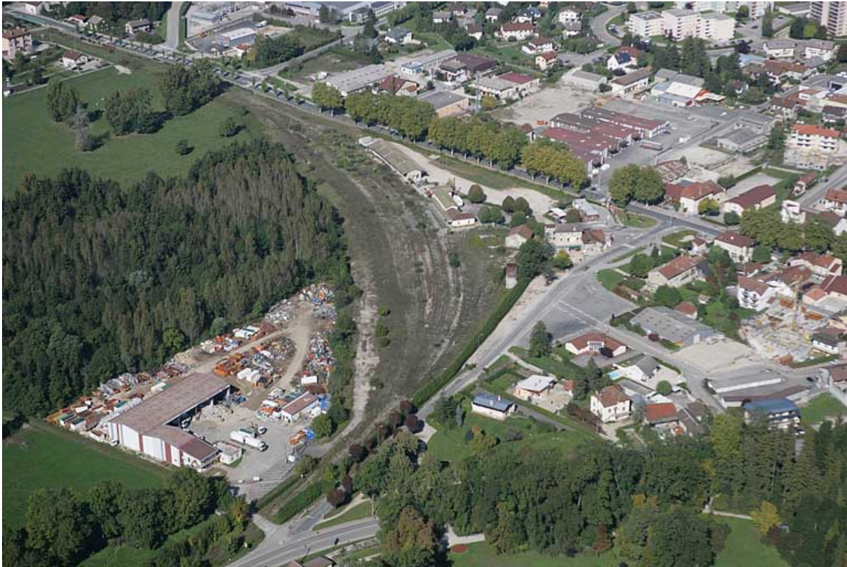
Vue aérienne du site de la gare, depuis le sud-est.