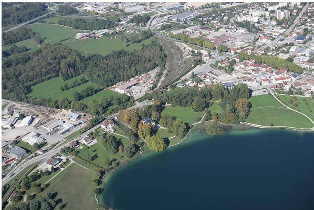
Vue aérienne rapprochée du quartier de la gare, depuis le sud-est.