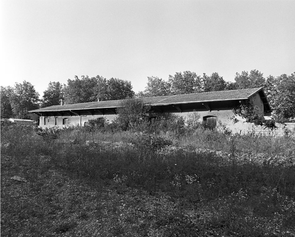
Entrepôt : façade postérieure (côté voies), de trois quarts droite.