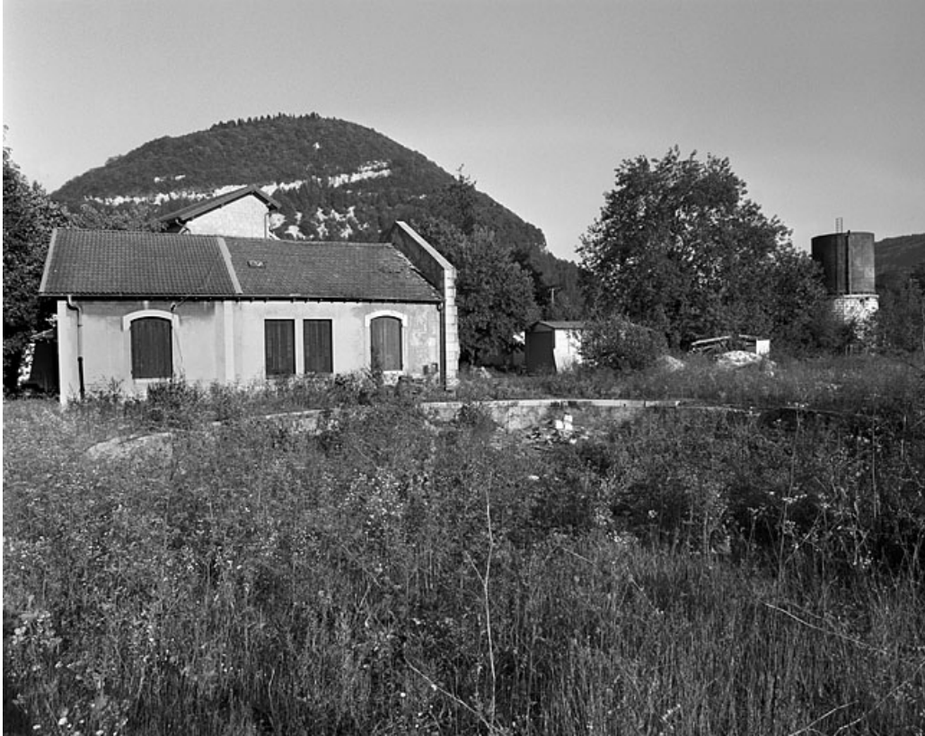
Foyer des roulants (cantine et logement), à l'arrière de la fosse du pont tournant. Bâtiment détruit fin 2005 - début 2006. 01, Montréal-la-Cluse place de la Gare