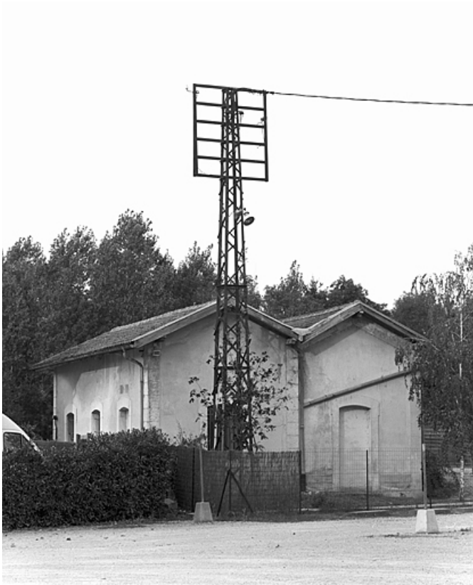
Lampisterie - huilerie (côté cour).