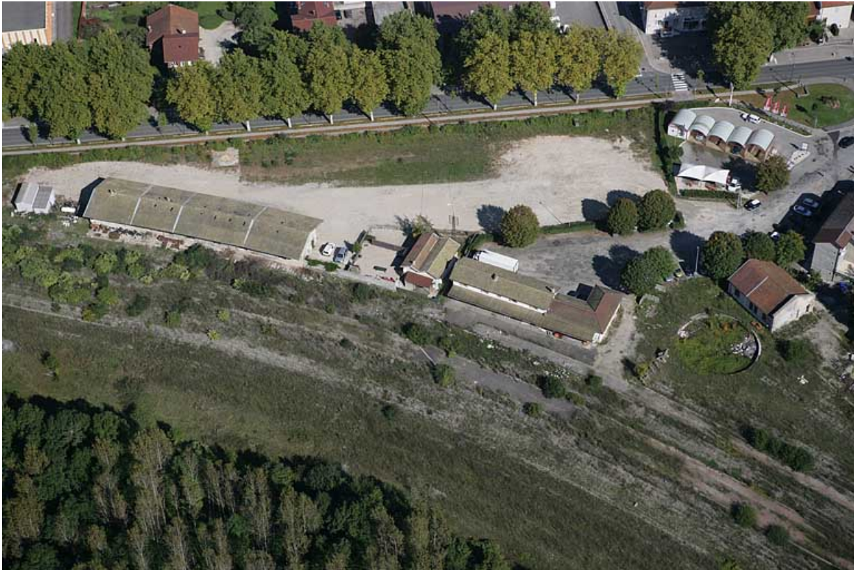
Vue aérienne des bâtiments, depuis le sud-ouest.