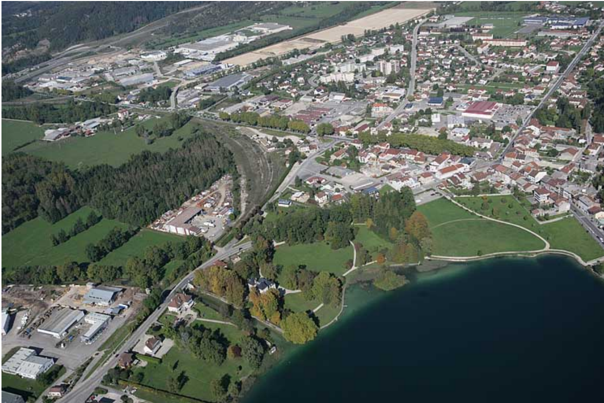
Vue aérienne rapprochée du quartier de la gare, depuis le sud-est.