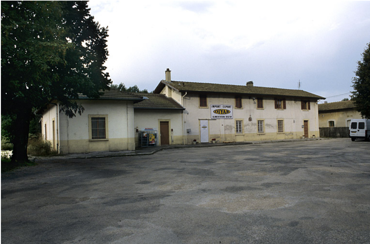
Bâtiment des voyageurs : façade antérieure, de trois quarts gauche.