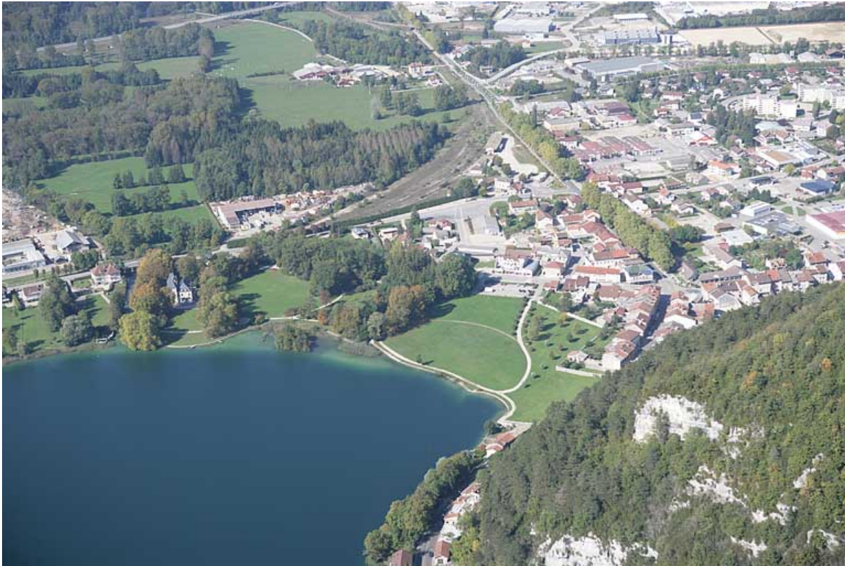
Vue aérienne du quartier de la gare, depuis l'est.