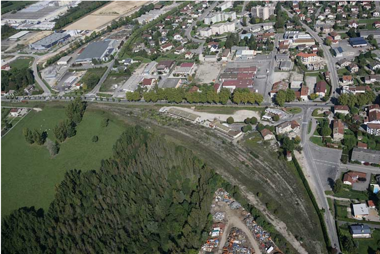
Vue aérienne du site de la gare, depuis le sud.