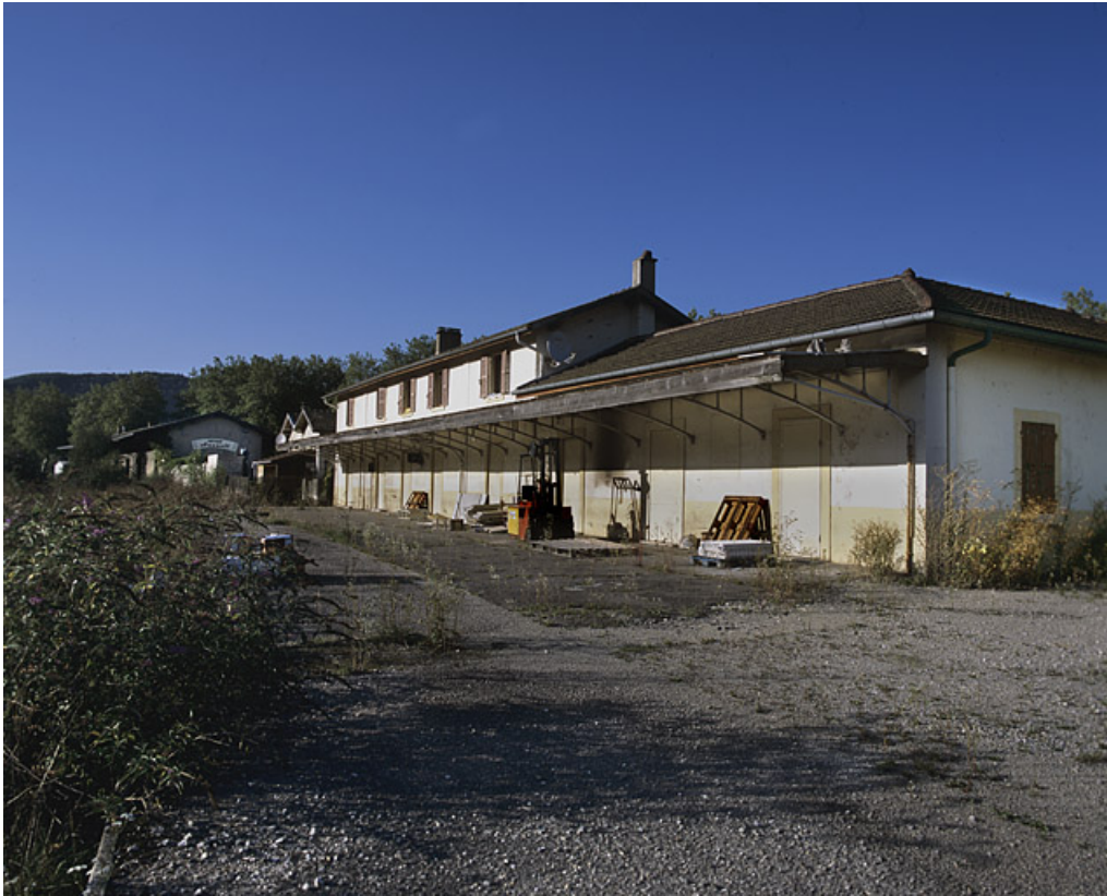
Bâtiment des voyageurs : façade postérieure, de trois quarts droite.