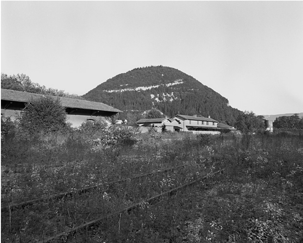
Vue d'ensemble de l'entrepôt et du site, depuis l'ouest.