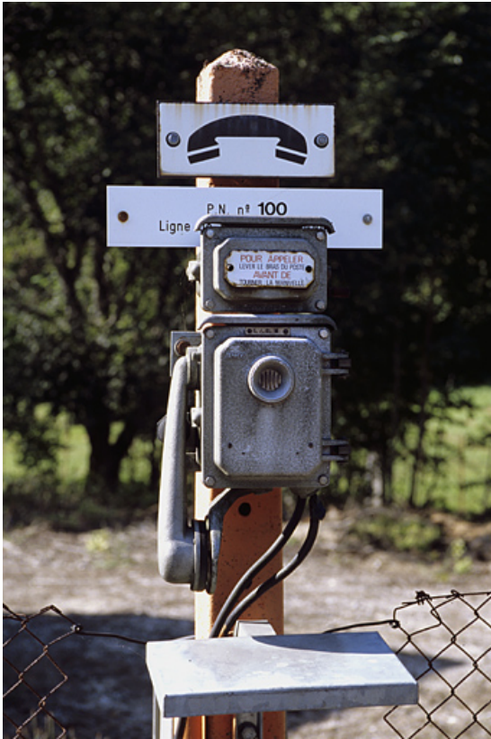
Téléphone de voie du passage à niveau n° 100.

01, Montréal-la-Cluse rue du Martinet, lieudit : le Martinet