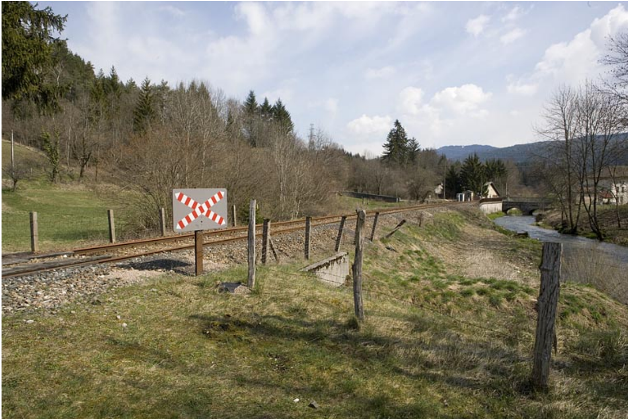
Passage à niveau n° 101, depuis le côté La Cluse.

01, Montréal-la-Cluse rue du Martinet, lieudit : le Martinet