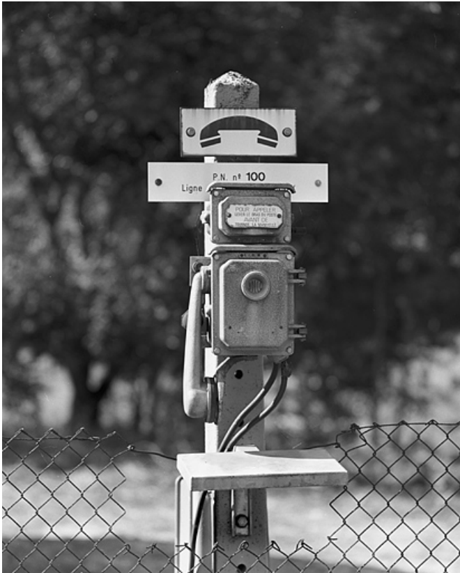
Téléphone de voie du passage à niveau n° 100.

01, Montréal-la-Cluse rue du Martinet, lieudit : le Martinet