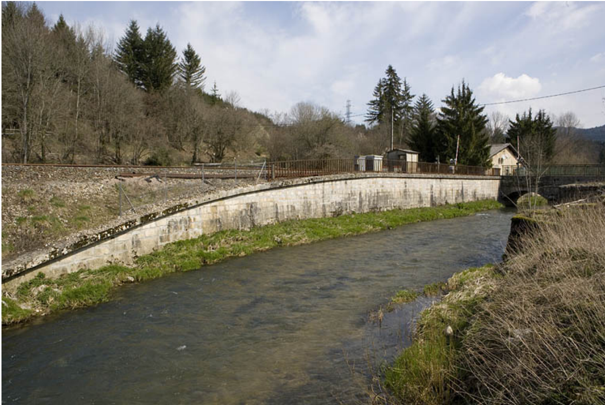
Passage à niveau n° 100 et mur de soutènement, depuis la rive droite de l'Ange à l'ouest.

01, Montréal-la-Cluse rue du Martinet, lieudit : le Martinet