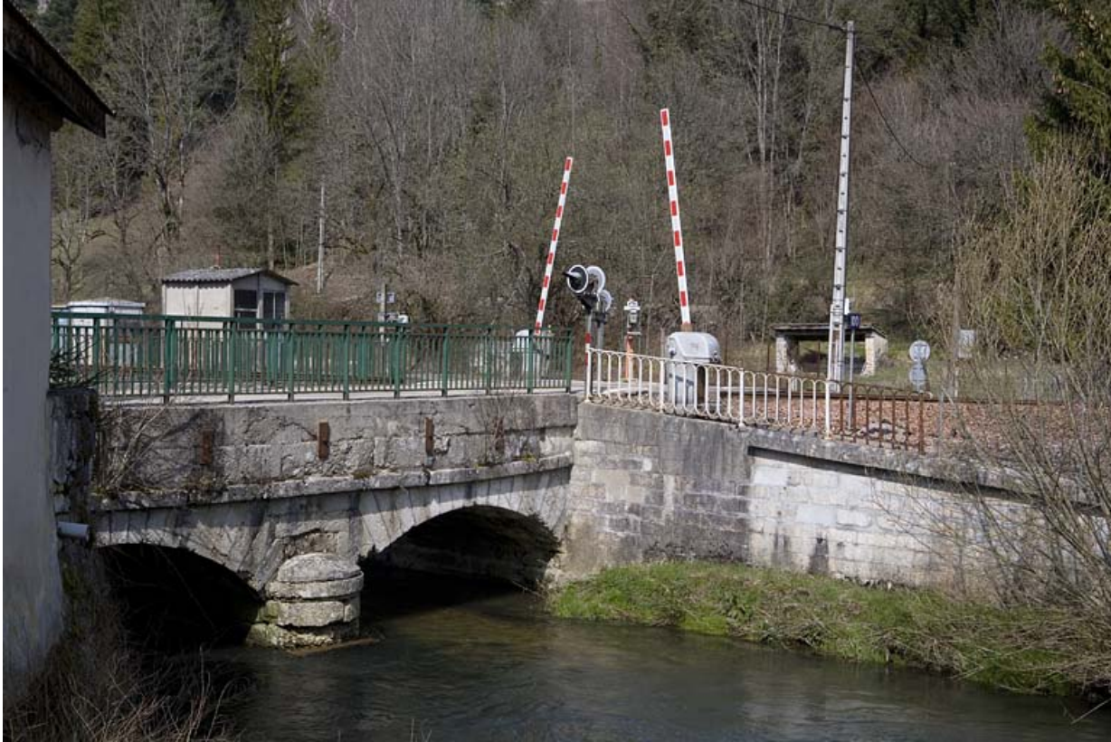
Passage à niveau n° 100, depuis la rive droite de l'Ange à l'est.

01, Montréal-la-Cluse rue du Martinet, lieudit : le Martinet