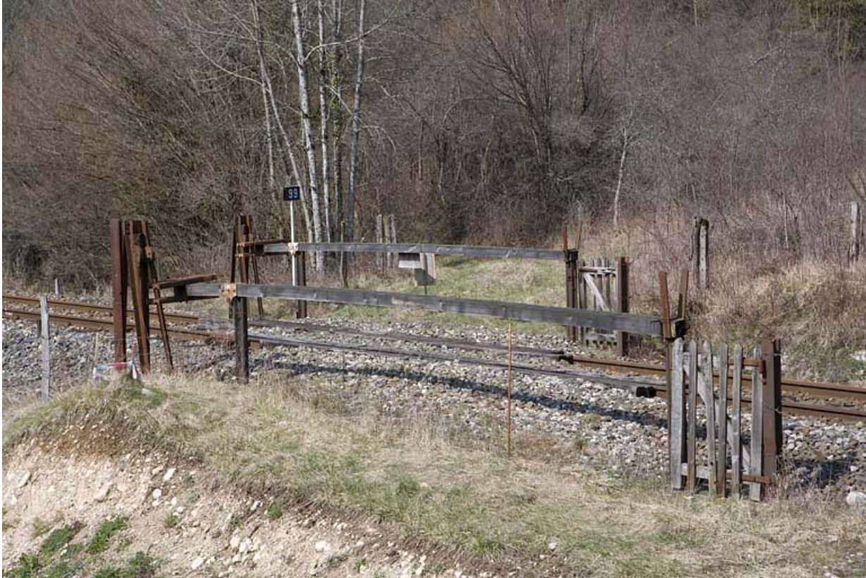
Passage à niveau n° 99, depuis le côté Andelot-en-Montagne.

01, Montréal-la-Cluse rue du Martinet, lieudit : le Martinet