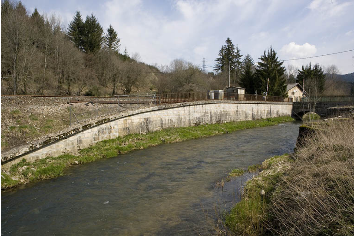
Passage à niveau n° 100 et mur de soutènement, depuis la rive droite de l'Ange à l'ouest.

01, Montréal-la-Cluse rue du Martinet, lieudit : le Martinet