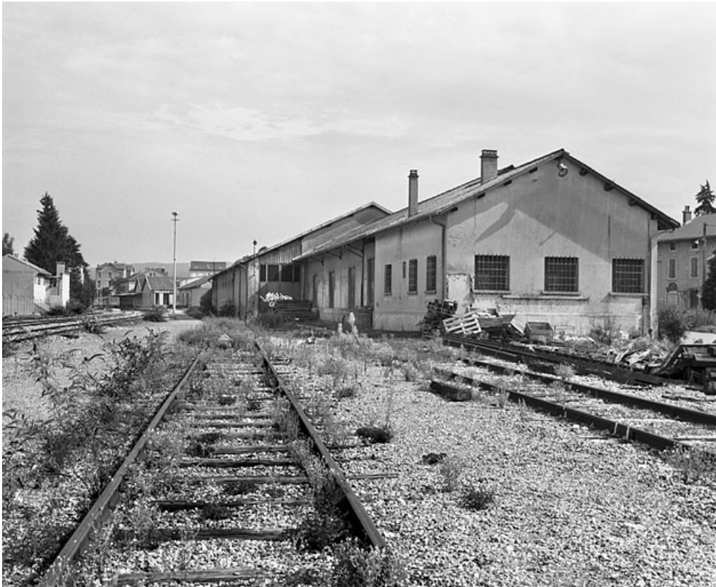
Entrepôts, depuis le sud-ouest (côté La Cluse).