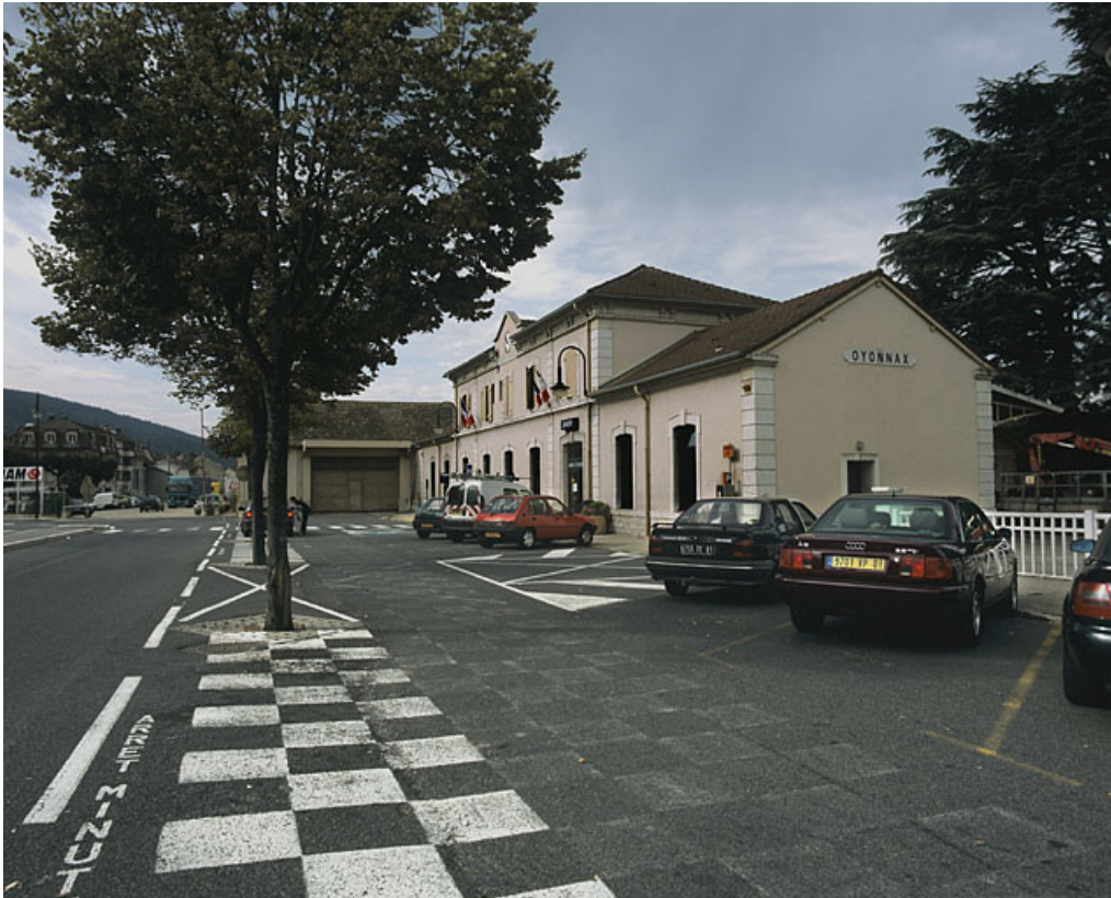
Vue d'ensemble, depuis le nord-est (côté Andelot-en-Montagne).