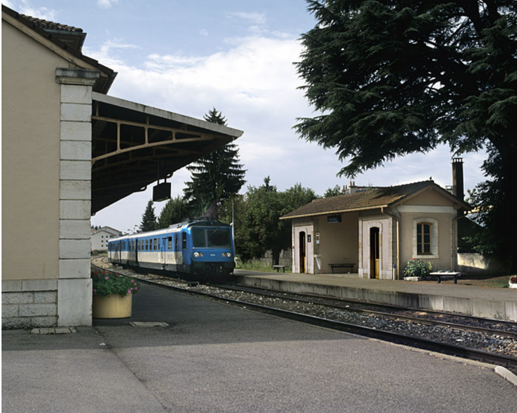
Abri de voyageurs - lampisterie et autorail RGP 1 (X 2733).