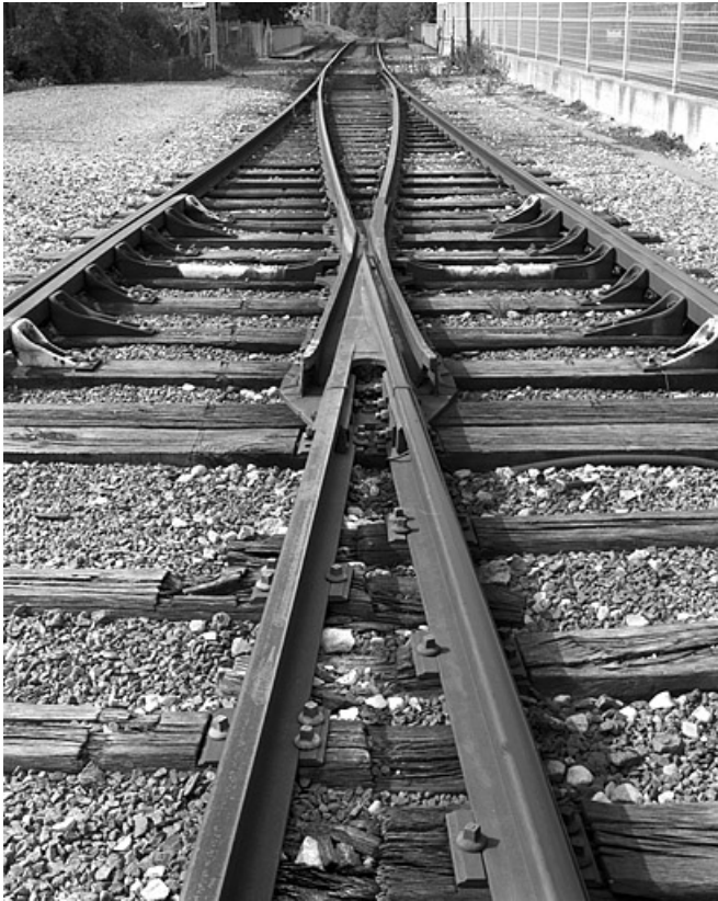
Appareil de voie (" aiguillage ") à l'extrémité de la gare, côté La Cluse (sud-ouest). 01, Oyonnax place Vaillant Couturier