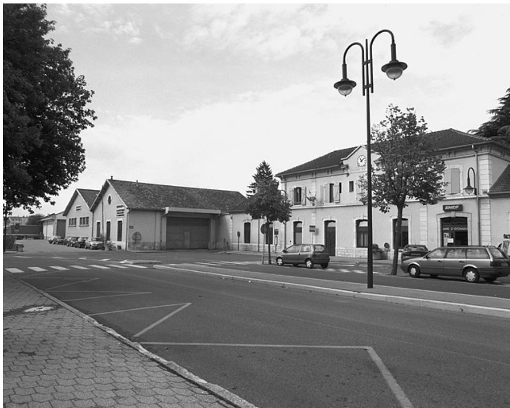
Entrepôts et cour, depuis le nord-est.