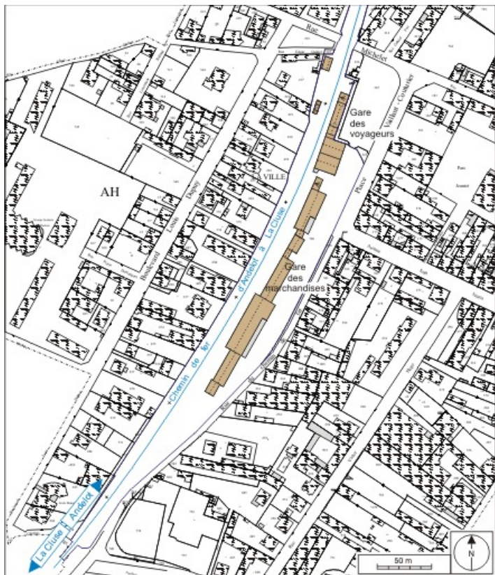
Plan de situation. Extrait du plan cadastral informatisé, 2006, section AH, échelle 1:2500. 01, Oyonnax place Vaillant Couturier