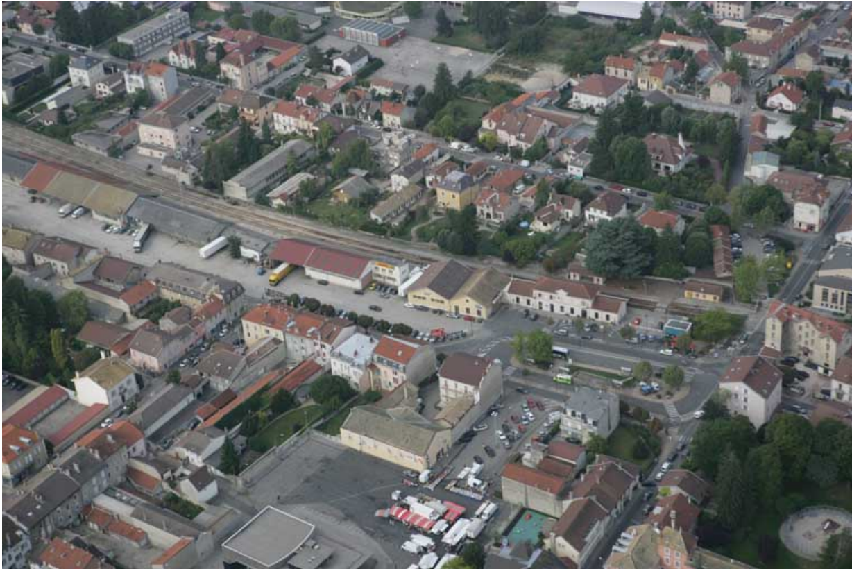
Vue aérienne du bâtiment des voyageurs et des entrepôts, depuis l'est. 01, Oyonnax place Vaillant Couturier