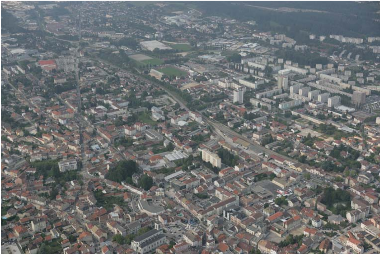
Vue aérienne du quartier de la gare, depuis l'est.