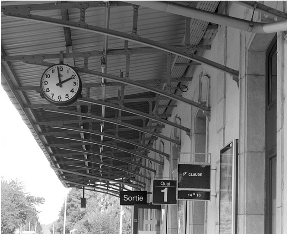
Bâtiment des voyageurs : consoles métalliques de l'auvent et horloge.