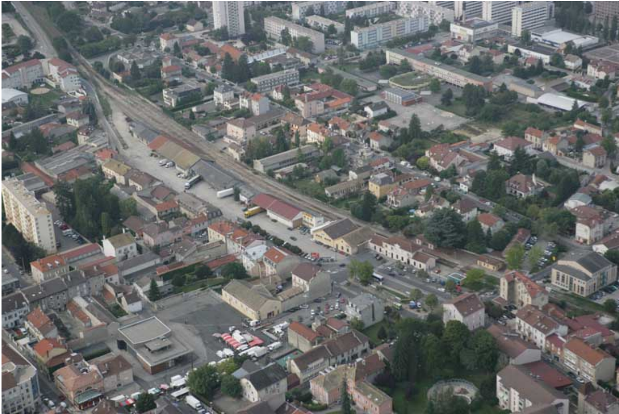
Vue aérienne rapprochée du site, depuis le nord-est.