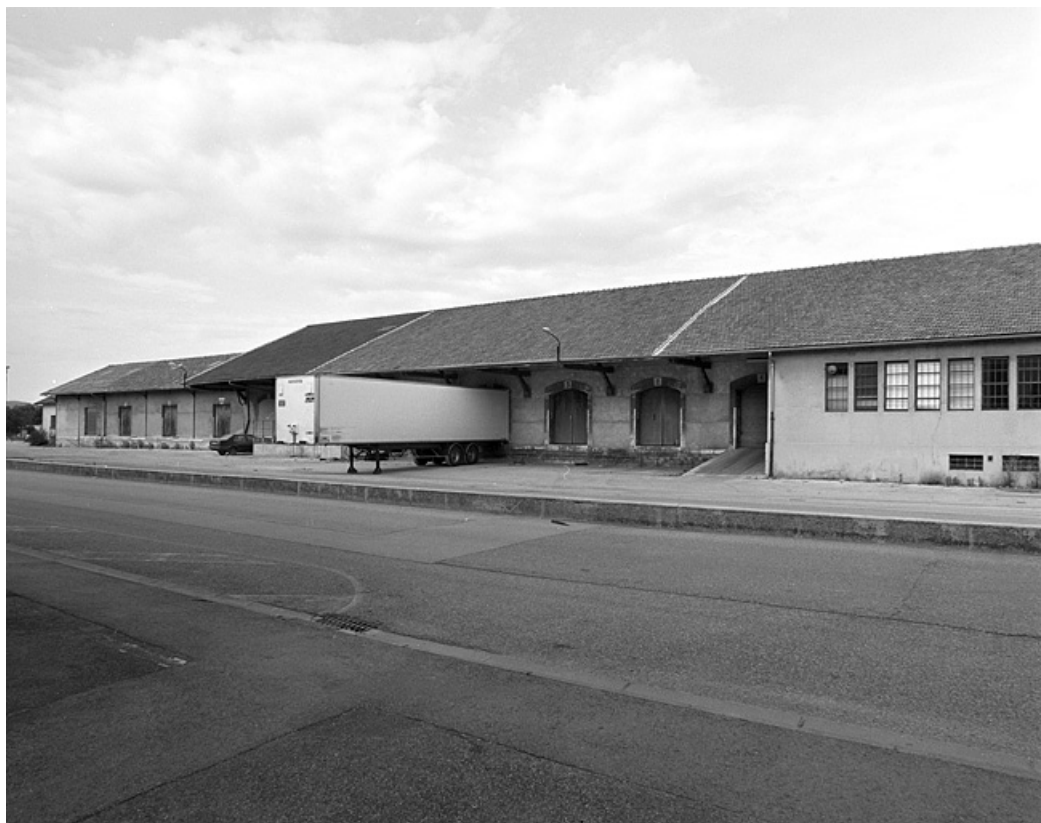
Entrepôts : façade antérieure, de trois quarts droite.