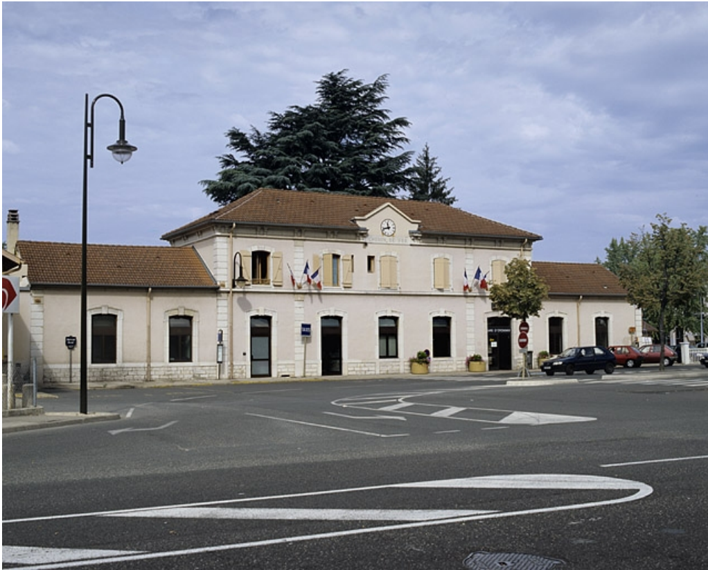
Bâtiment des voyageurs : façade antérieure, de trois quarts gauche.