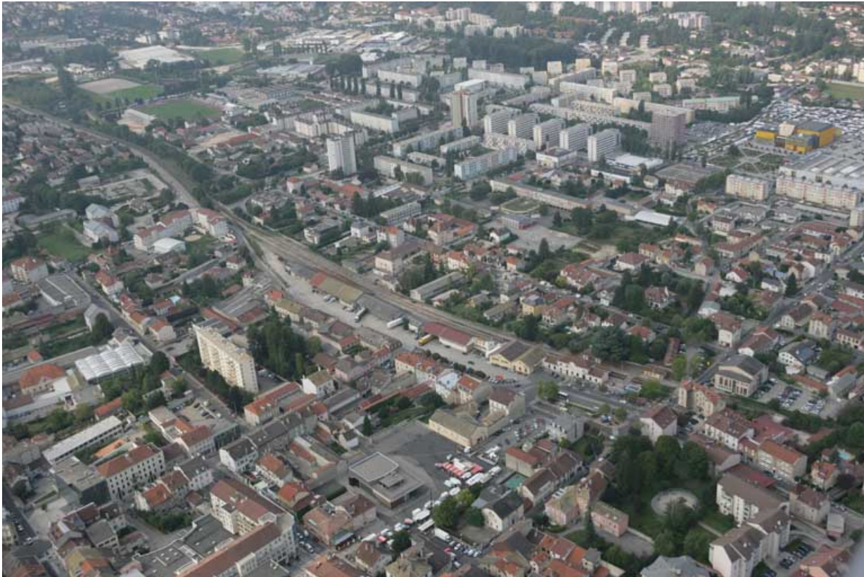
Vue aérienne du site, depuis le nord-est.