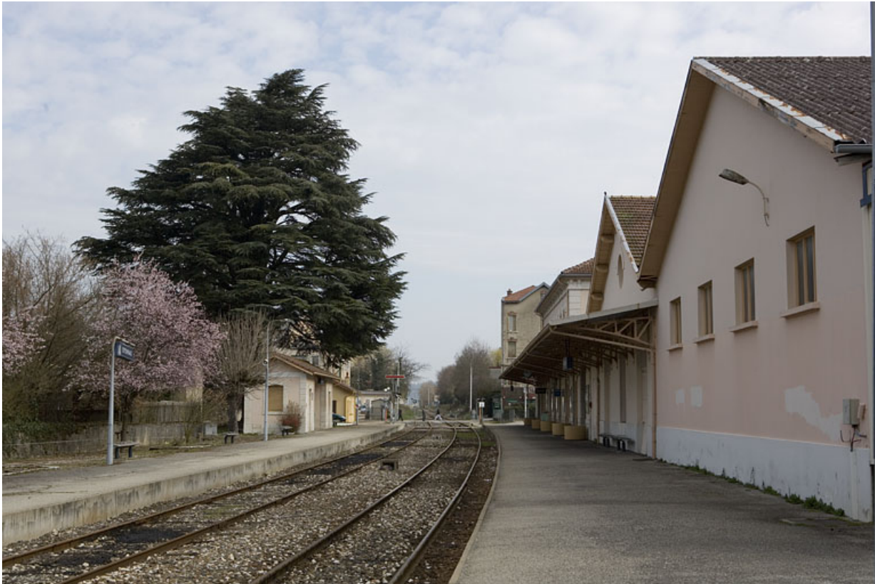
Entrepôts : extrémité côté voies et bâtiment des voyageurs.