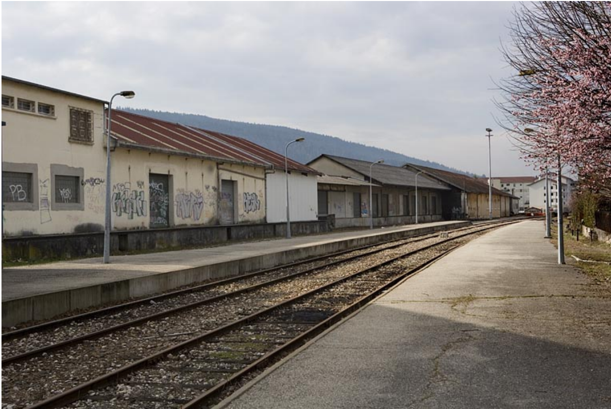
Entrepôts : façade postérieure (sur voies), de trois quarts gauche.