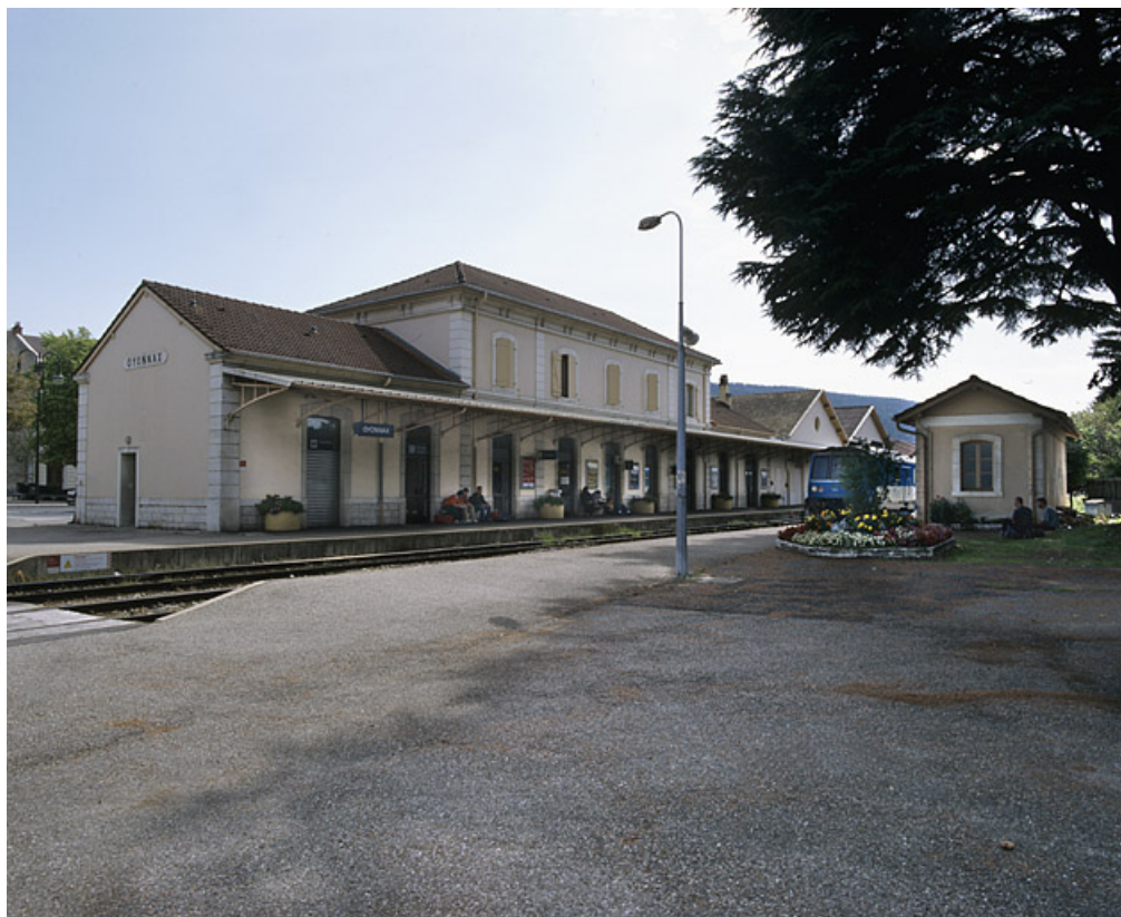
Vue d'ensemble, depuis le nord-ouest (côté Andelot-en-Montagne).