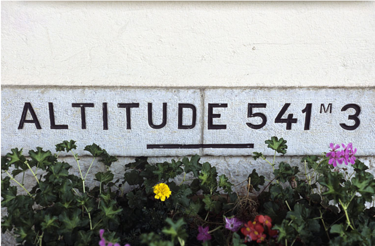
Bâtiment des voyageurs : inscription altimétrique.