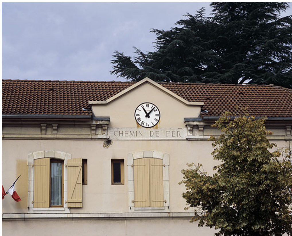
Bâtiment des voyageurs : fronton, avec inscription et horloge.