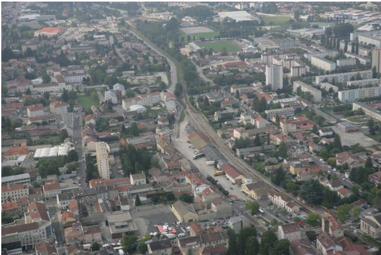
Vue aérienne du site, depuis le nord.