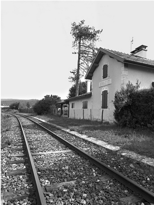
Façade postérieure (côté voie), de trois quarts droite (depuis le côté La Cluse). 01, Arbent, 11 rue de la Gare