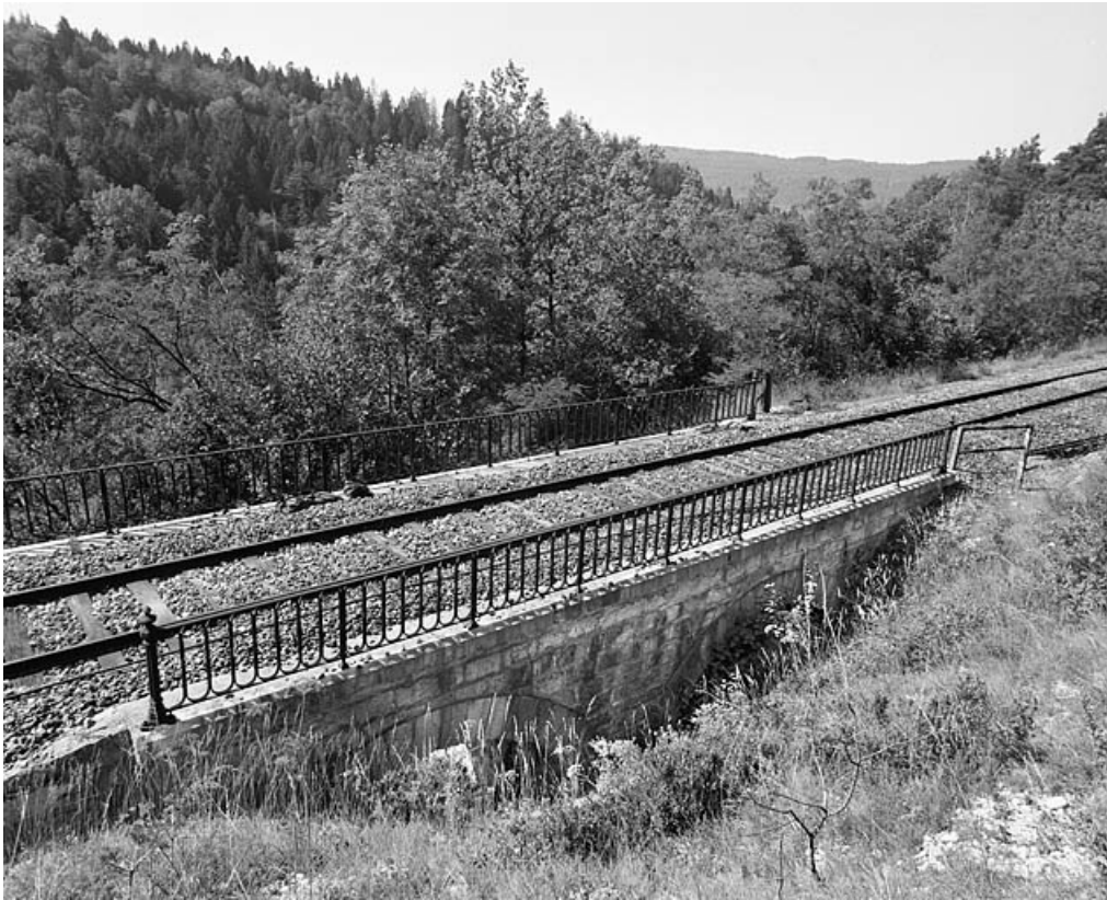
Elévation côté montagne.