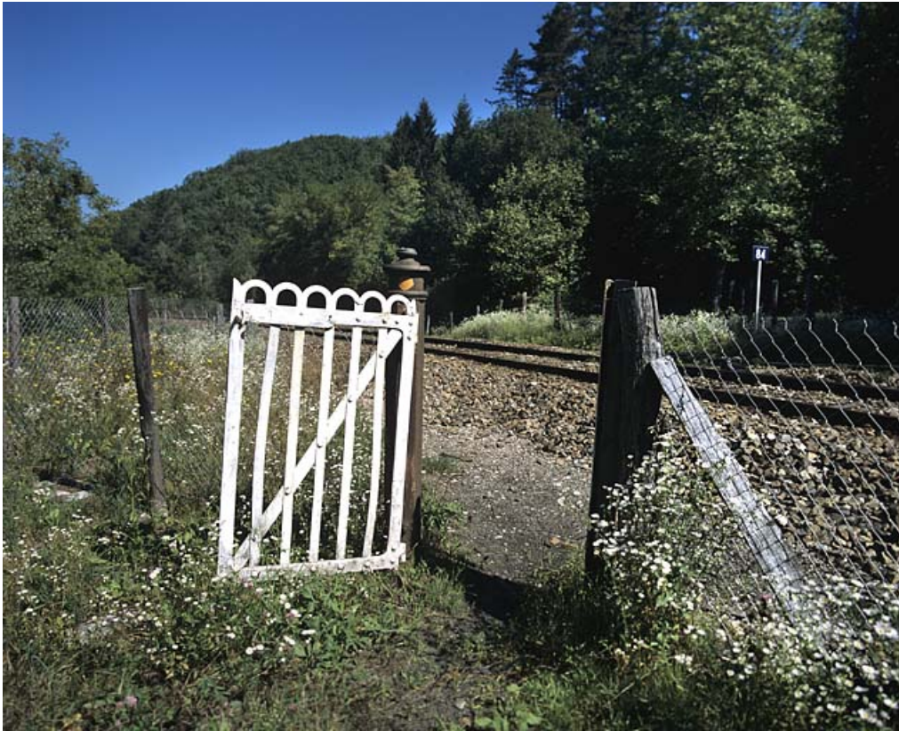
Portillon pour piétons, côté gauche de la voie.