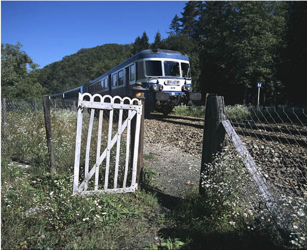
Portillon pour piétons, côté gauche de la voie, avec autorail X 2800.