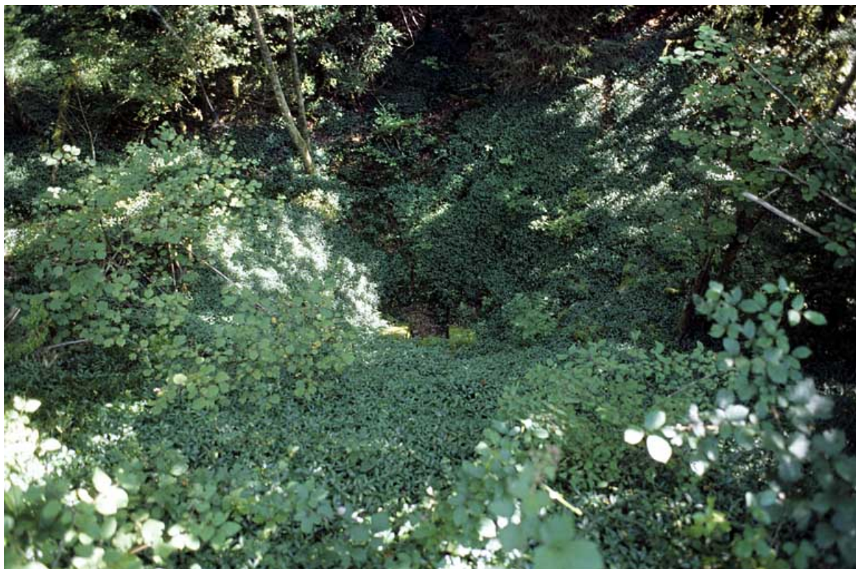
Vue d'ensemble plongeante sur la tête amont (est), depuis la voie.