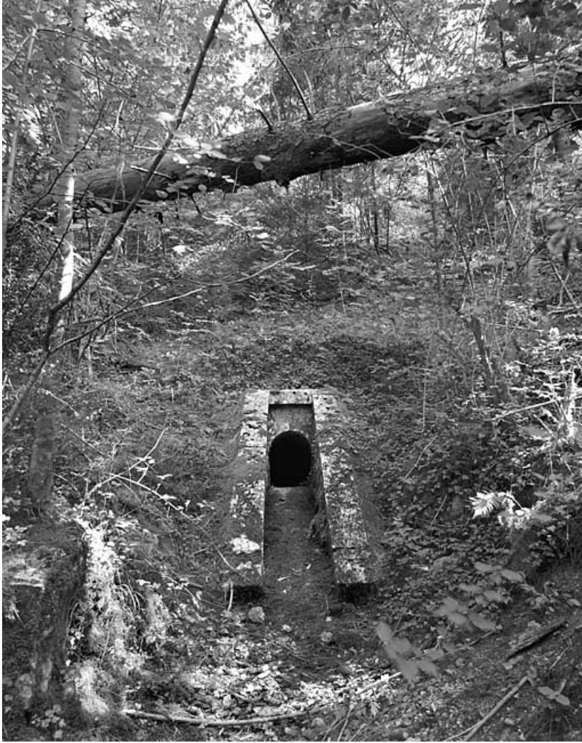
Vue d'ensemble de la tête aval (ouest).