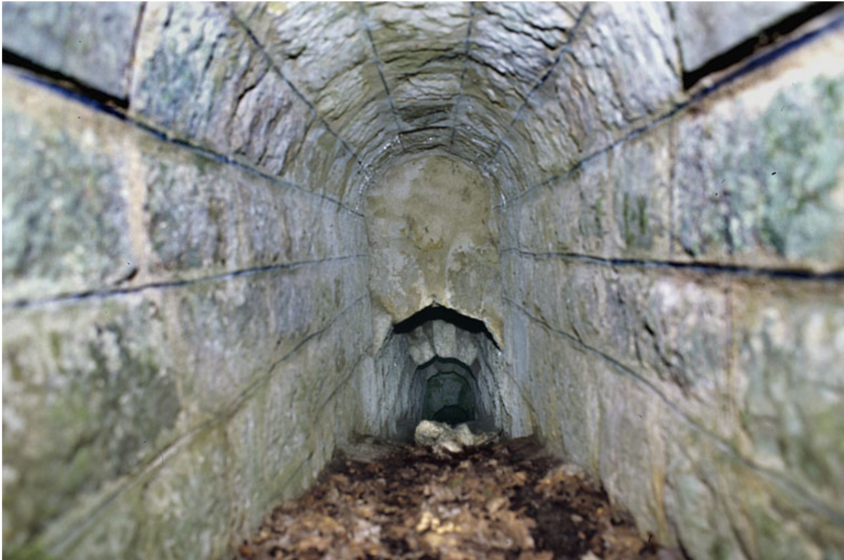
Voûte appareillée en rouleaux à ressauts, depuis l'amont.