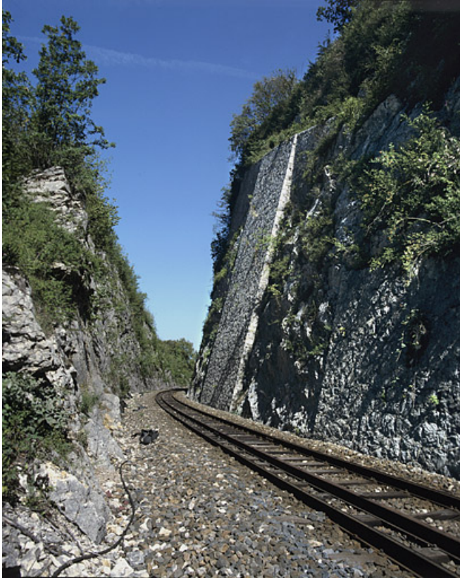
Vue d'ensemble, depuis le côté La Cluse (sud-ouest).