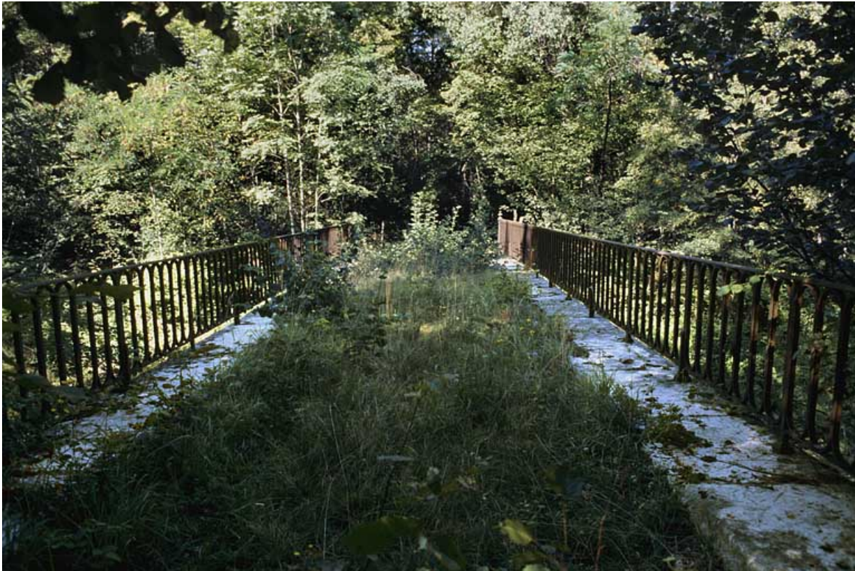
Tablier, depuis l'extrémité ouest.