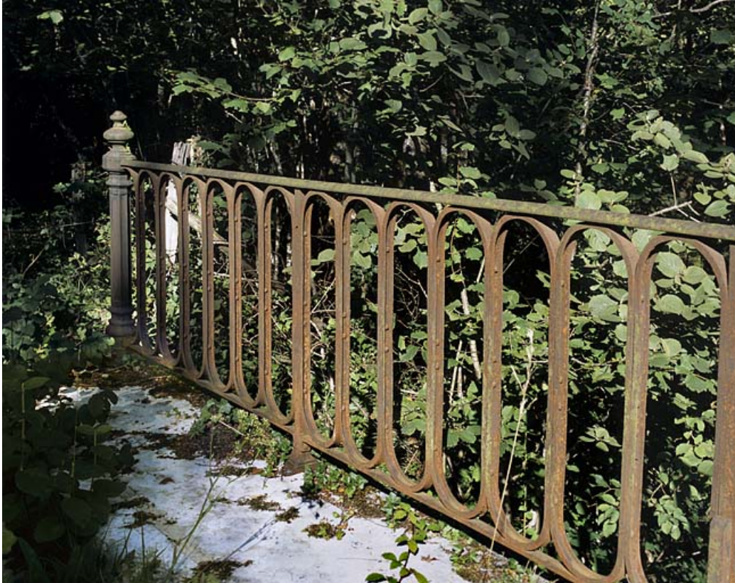
Détail d'un garde-corps.