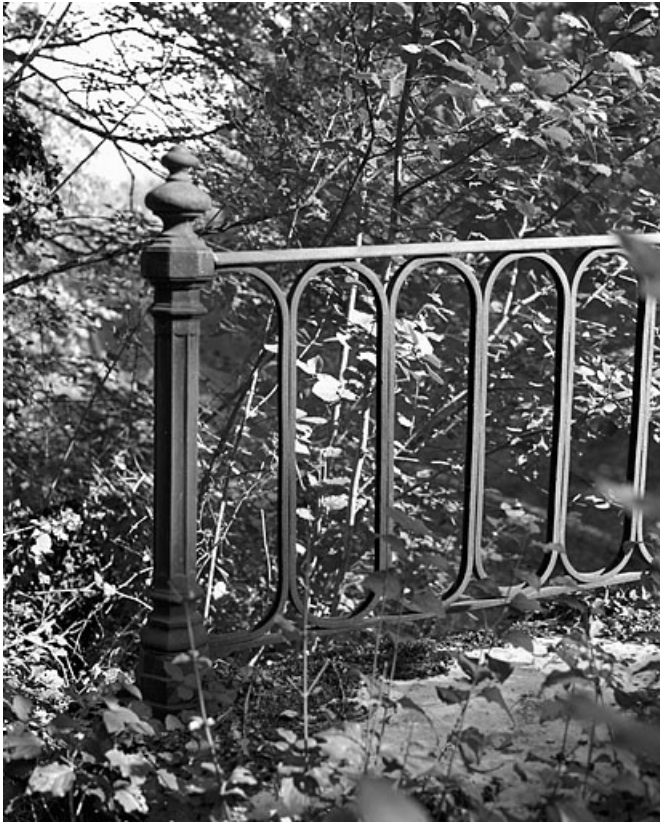
Garde-corps : détail d'un potelet.