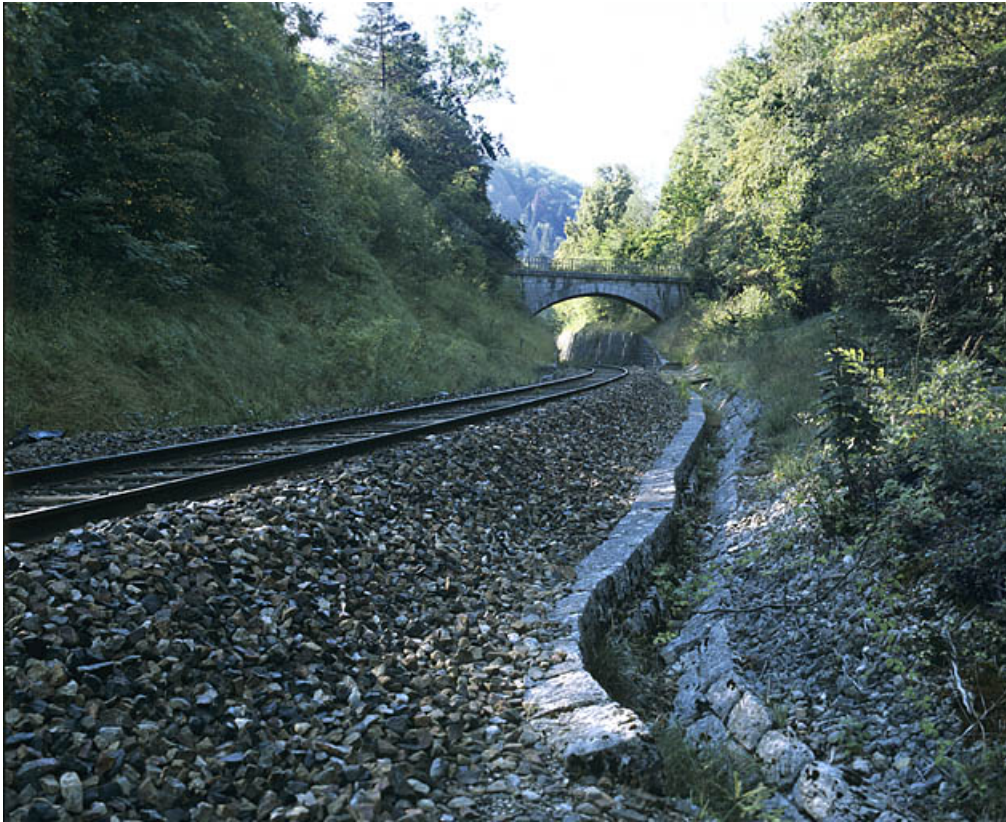
Vue d'ensemble, depuis le côté Andelot-en-Montagne (nord).