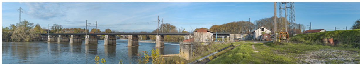
Le pont ferroviaire d'Auxonne (21).