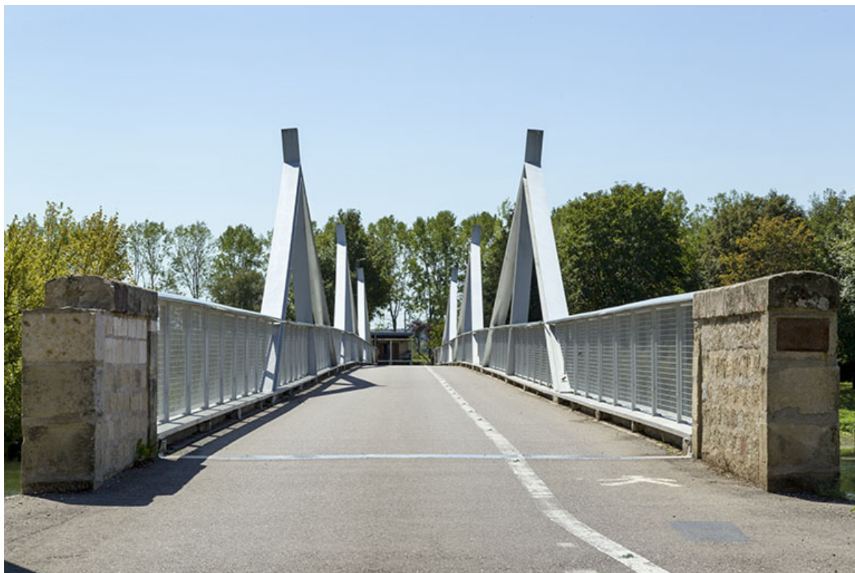
Pont de Rigny.