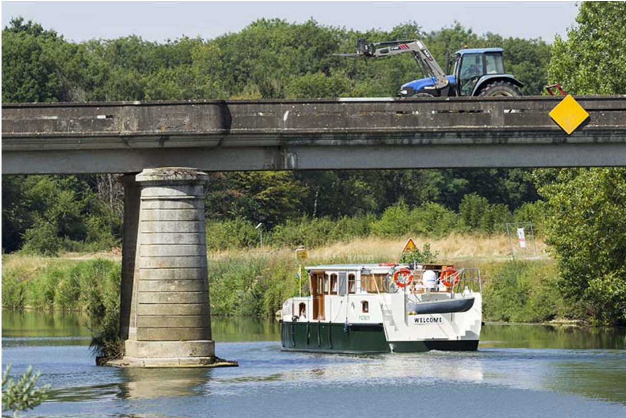
Le pont de Ray-sur-Saône.