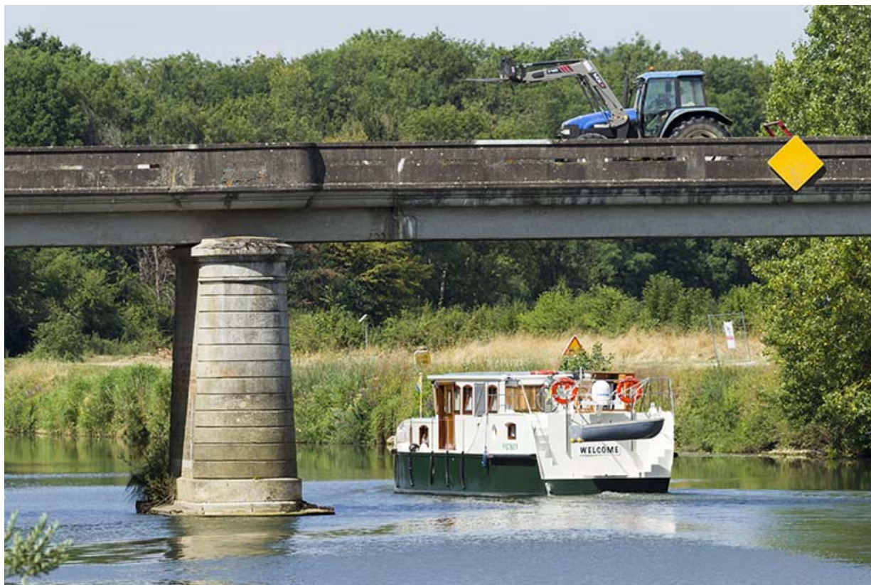
Le pont de Ray-sur-Saône.