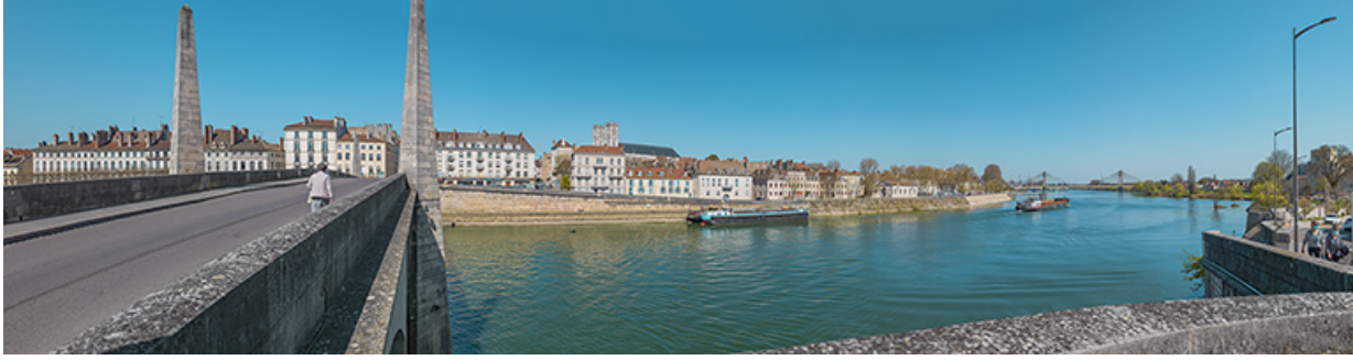
Le pont Saint-Laurent de Chalon-sur-Saône (71).