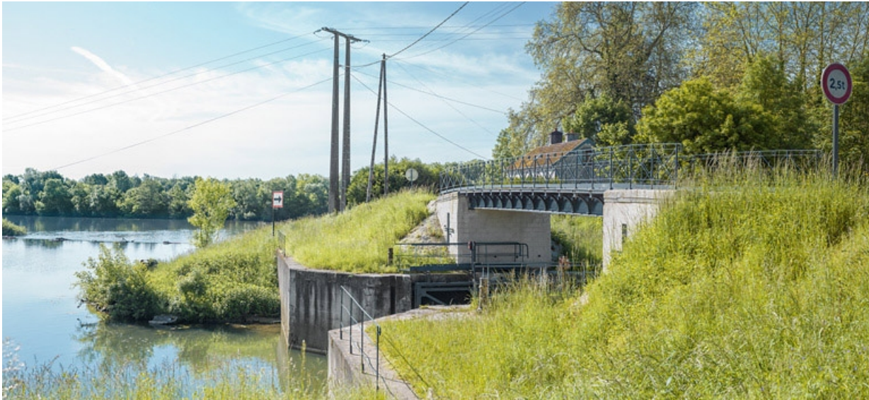
Porte de garde avec son pont. On distingue la maison du barragiste.