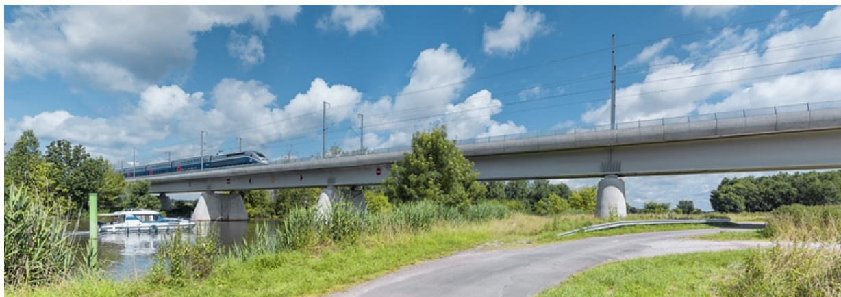
Vue d'ensemble avec TGV franchissant la Saône.