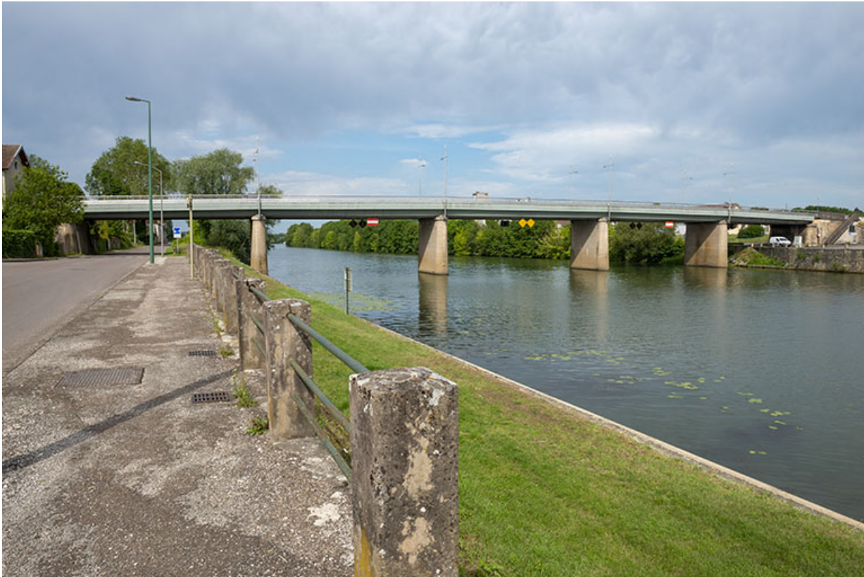
Le second pont de Gray reconstruit à l'emplacement du pont suspendu.