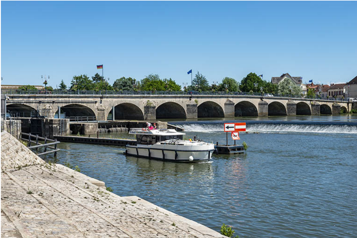
Le pont en pierre avec l'écluse marinière à Gray