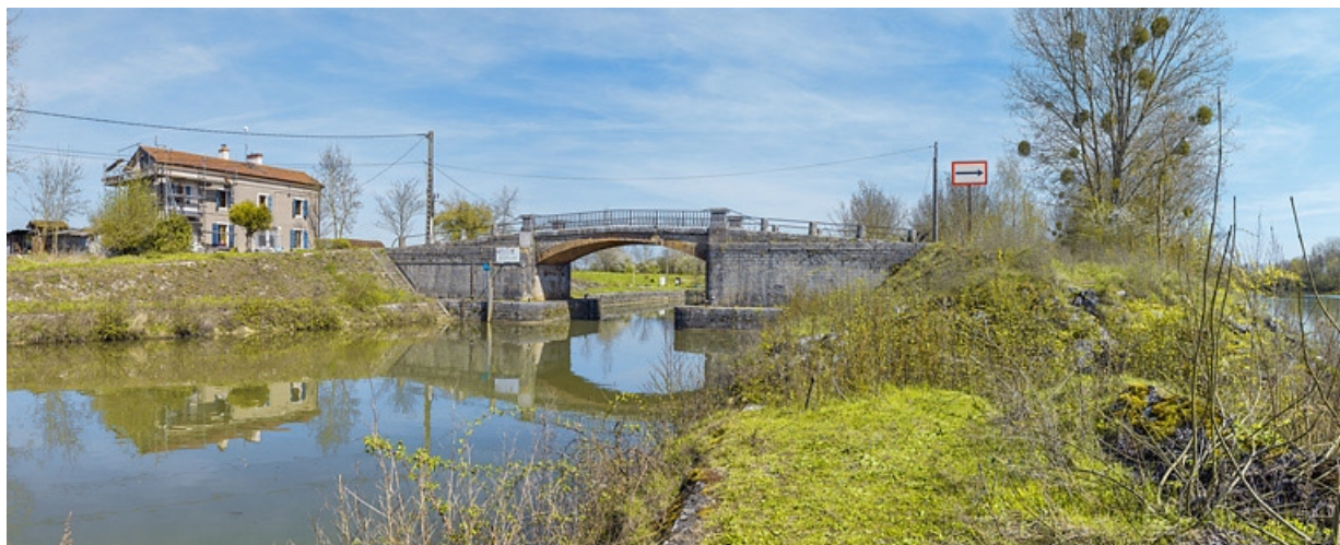
Vue d'ensemble depuis la sortie de la dérivation.