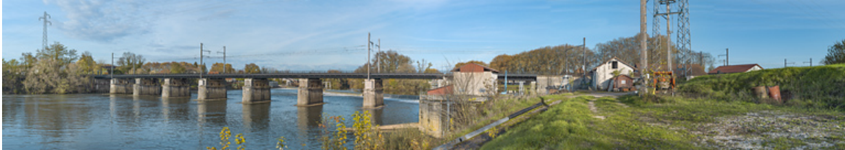
Le pont ferroviaire d'Auxonne (21).