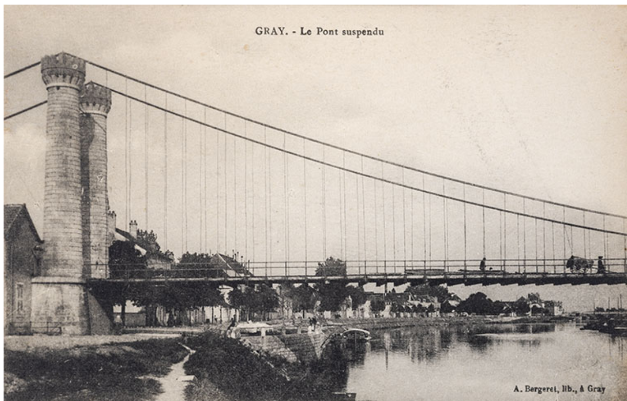
L'ancien pont suspendu de Gray, carte postale.

Gray. - Le Pont suspendu. Carte postale éditée par Lib A.Bergeret à Gray, s.d.