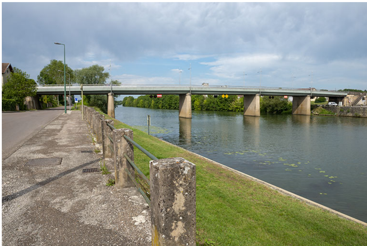
Le second pont de Gray reconstruit à l'emplacement du pont suspendu.