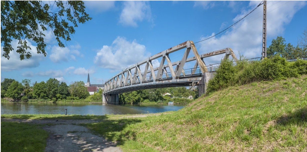
Pont routier de Lamarche-sur-Saône (21).