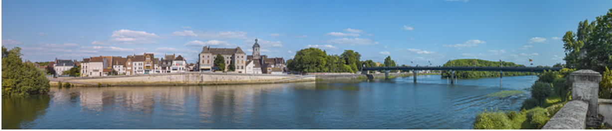
La ville de Seurre et ses quais et le nouveau pont, vus depuis la culée de l'ancien pont.