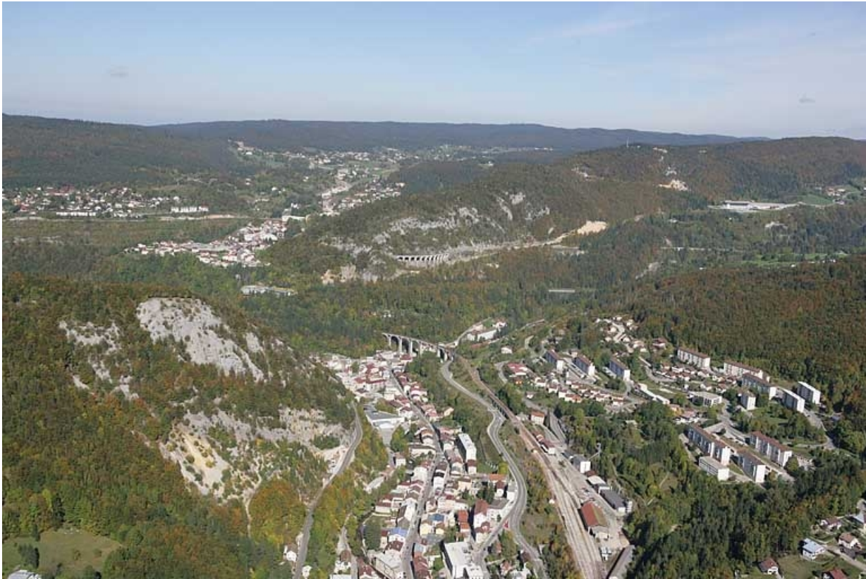
Au premier plan, la ville de Morez ; à l'arrière-plan à gauche, celle de Morbier.