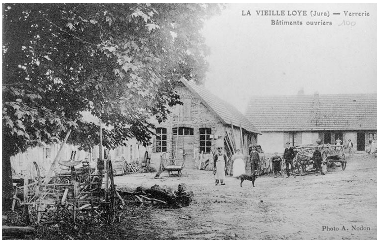
La Vieille-Loye (Jura) - Verrerie. Bâtiments ouvriers. 39, La Vieille-Loye, lieudit : la Verrerie