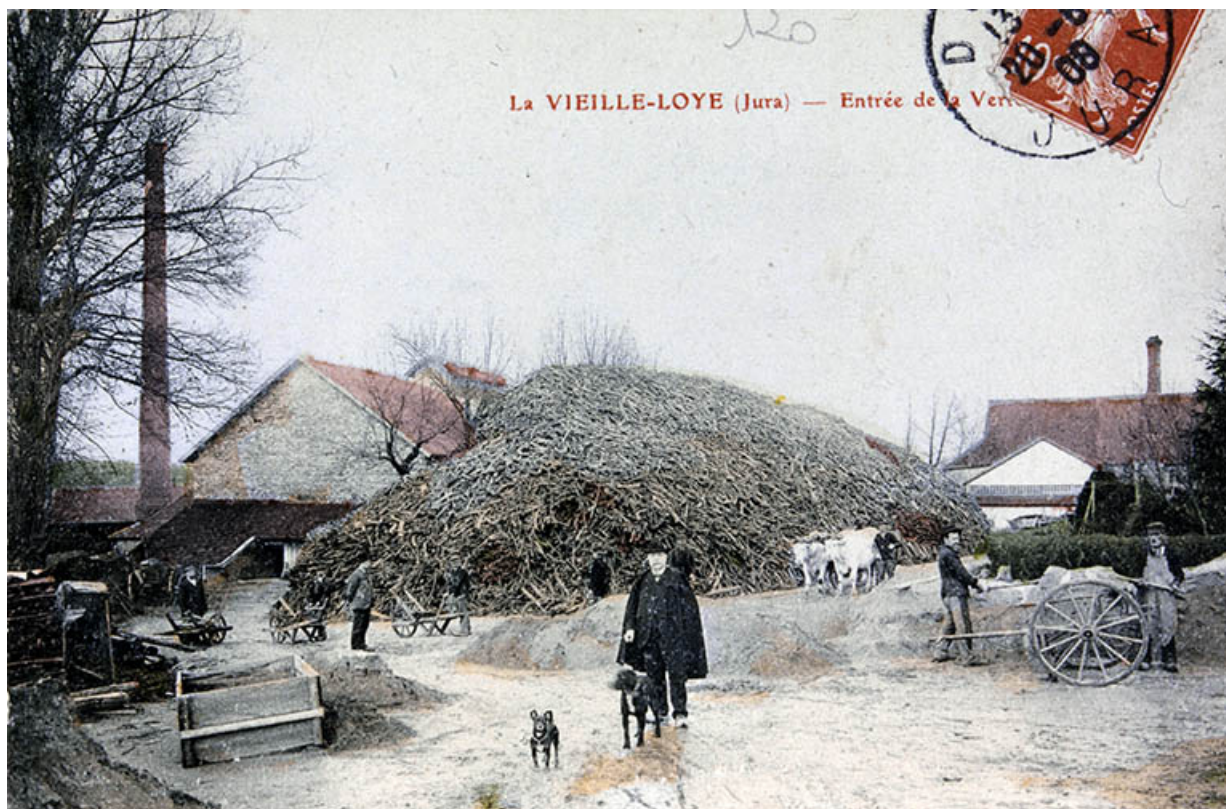
La Vieille-Loye (Jura) - Entrée de la Verrerie.