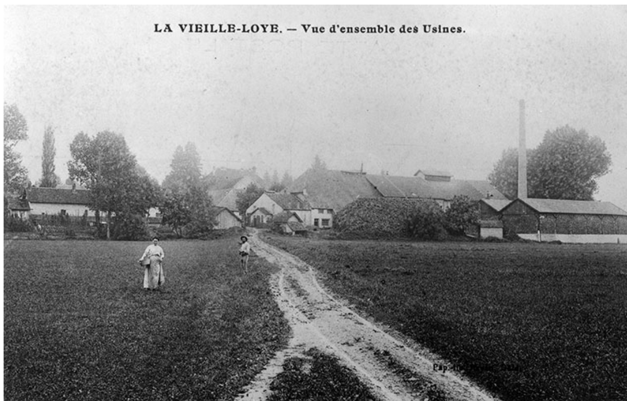
La Vieille-Loye. - Vue d'ensemble des Usines.

39, La Vieille-Loye, lieudit : la Verrerie