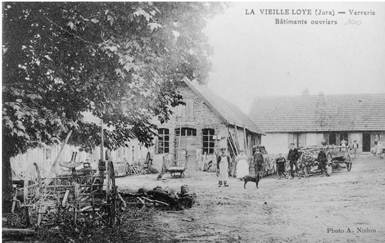
La Vieille-Loye (Jura) - Verrerie. Bâtiments ouvriers. 39, La Vieille-Loye, lieudit : la Verrerie