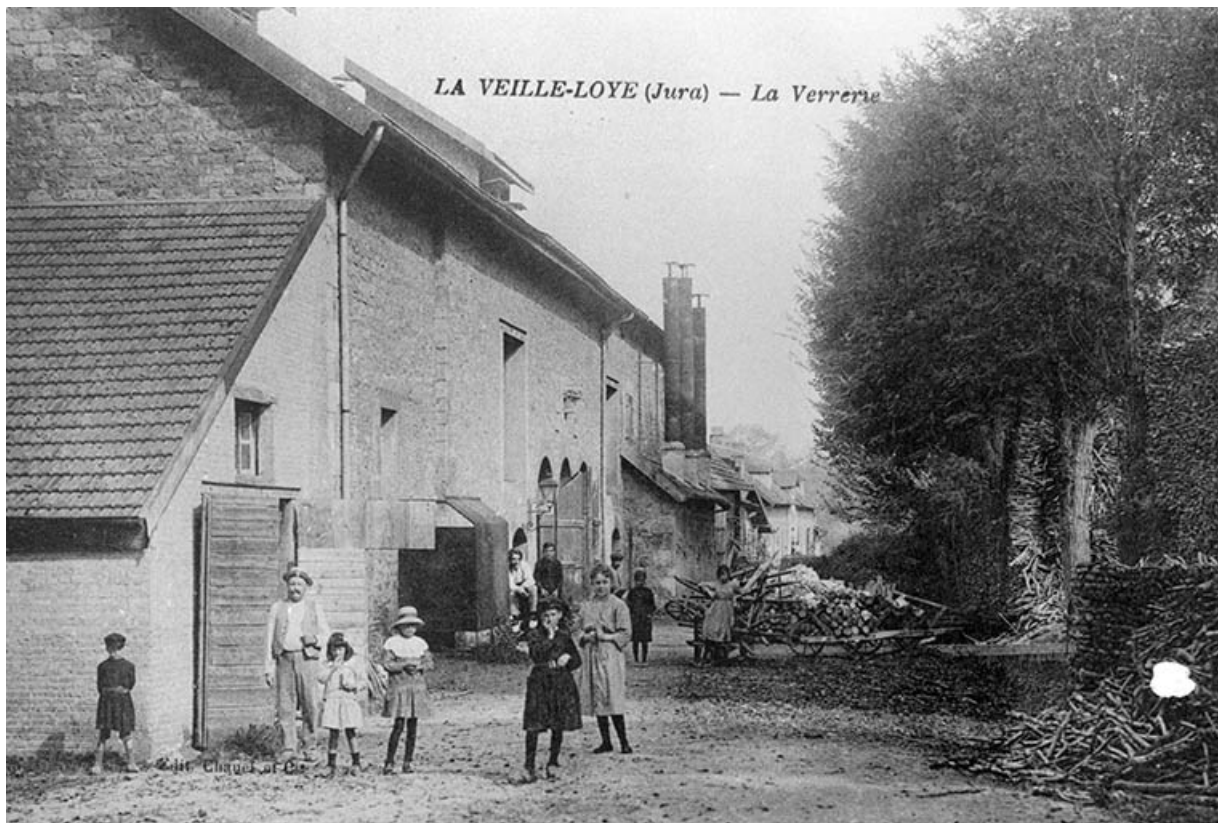
La Vieille-Loye (Jura) - La Verrerie. 39, La Vieille-Loye, lieudit : la Verrerie