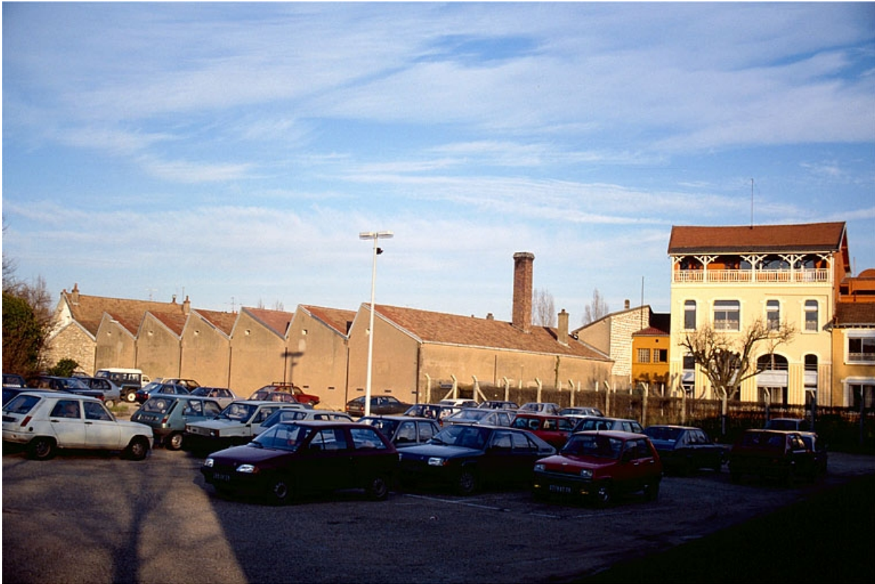
Vue d'ensemble, depuis l'ouest.