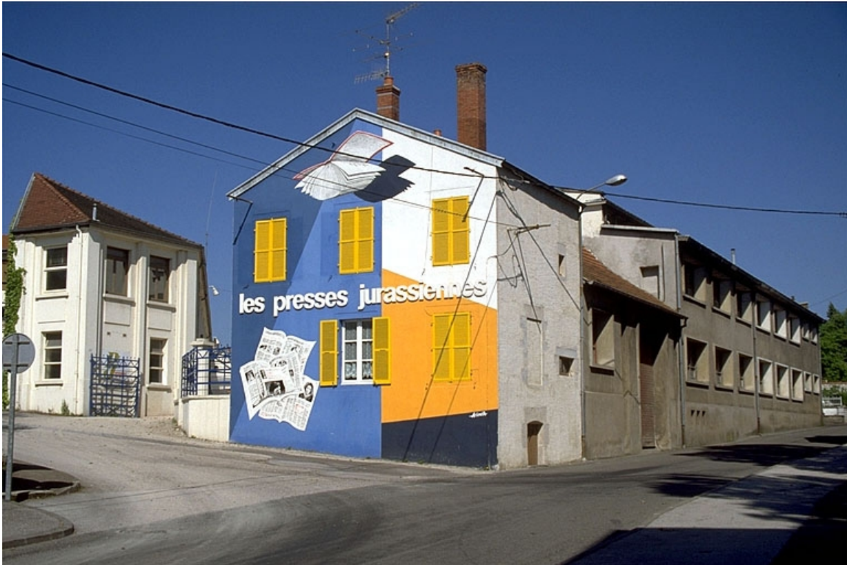
Vue d'ensemble, depuis l'est.