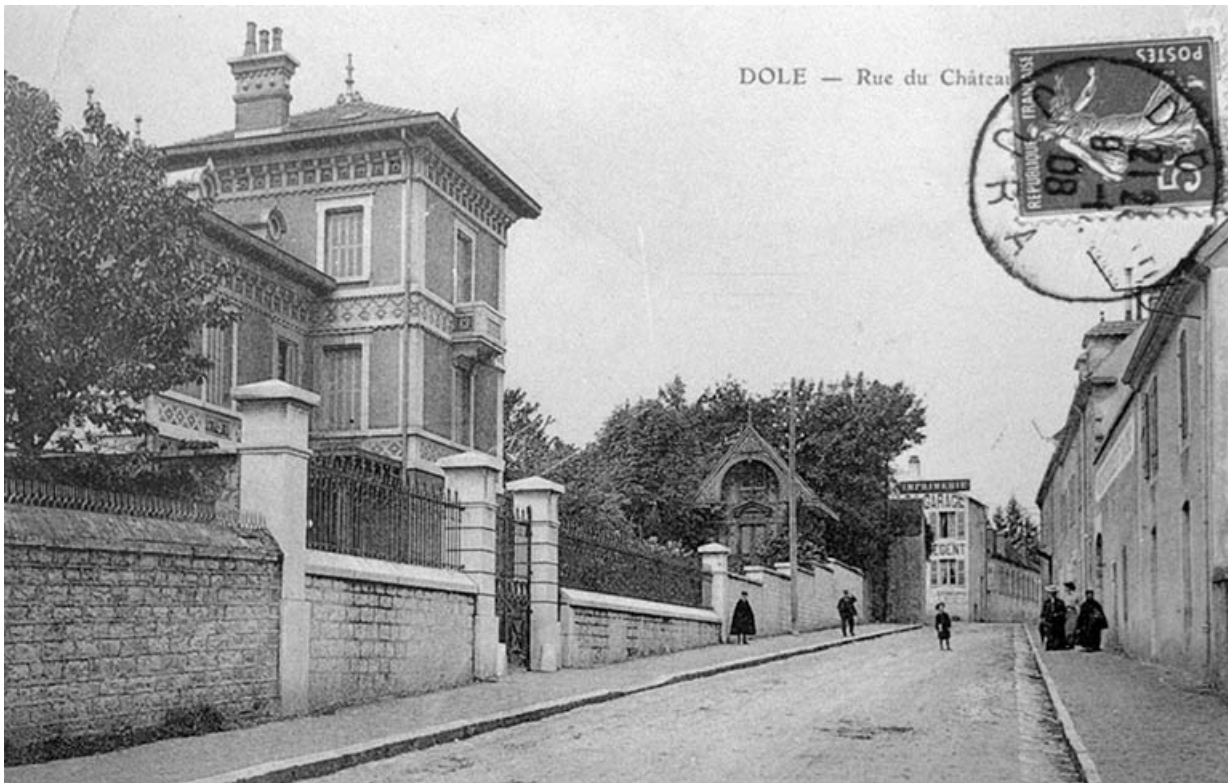
Dole - Rue du Château d'eau. 39, Dole, 80, 82 rue Mont Roland