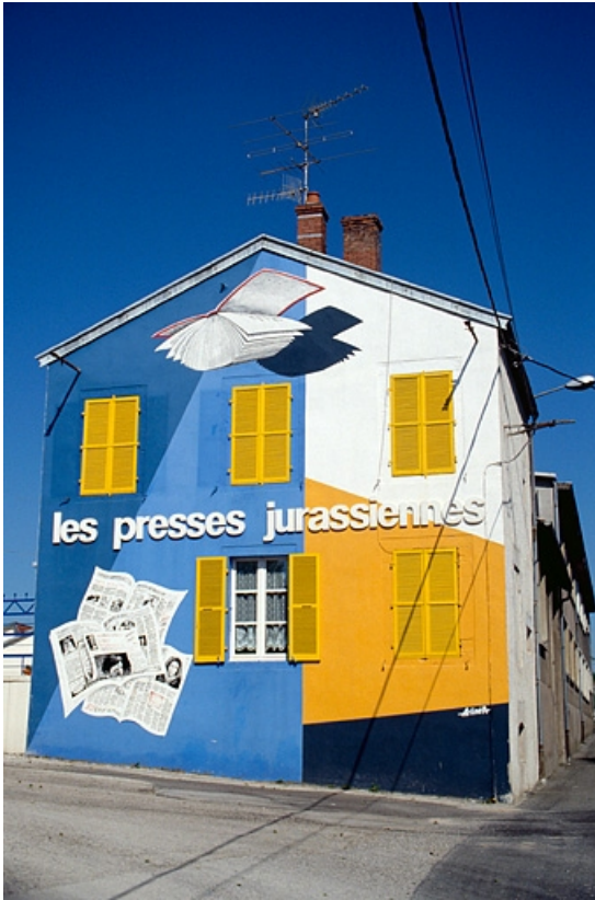
Logement patronal : peinture murale.