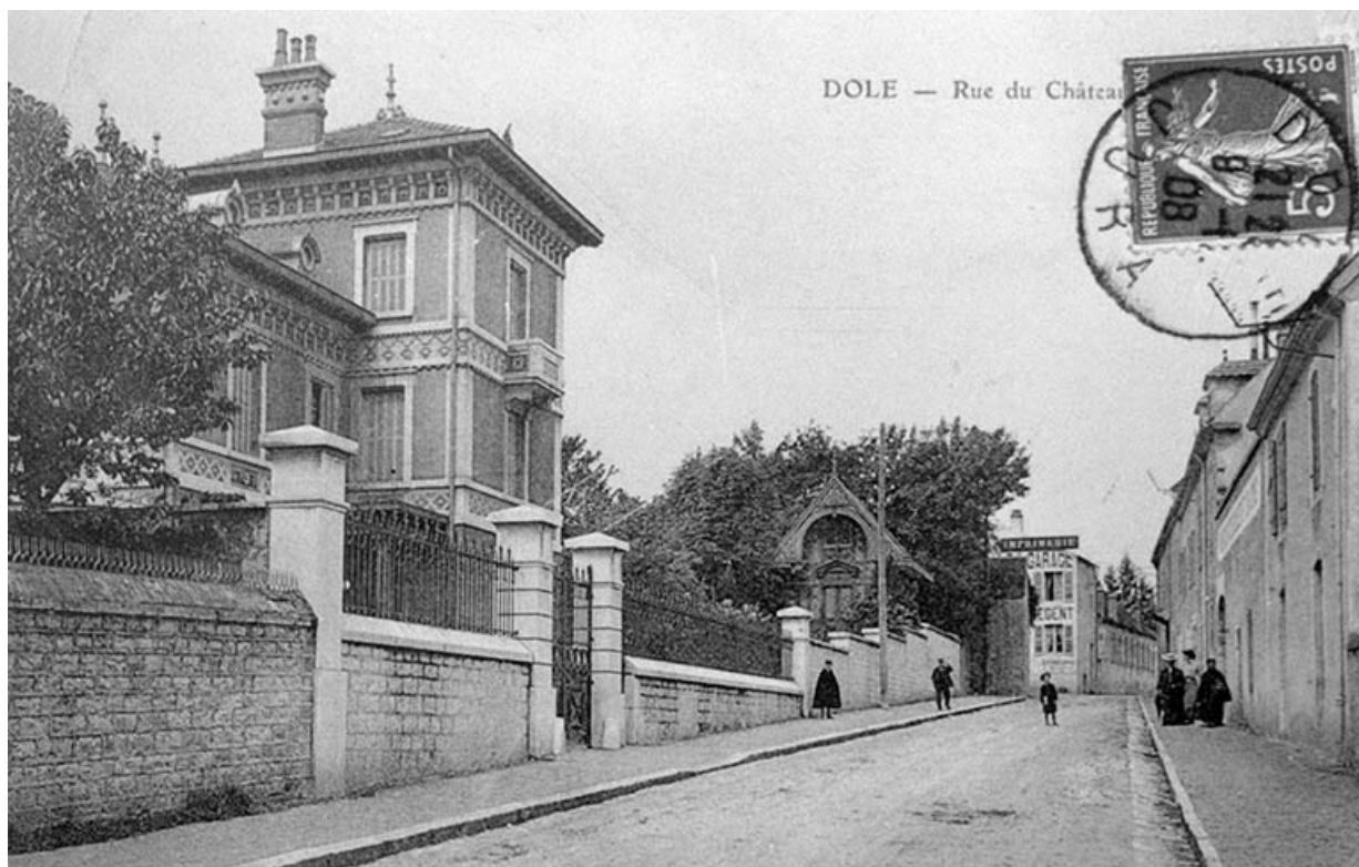
Dole - Rue du Château d'eau. 39, Dole, 80, 82 rue Mont Roland

Carte postale, s.d. [1er quart 20e siècle, entre 1904 et 1908].