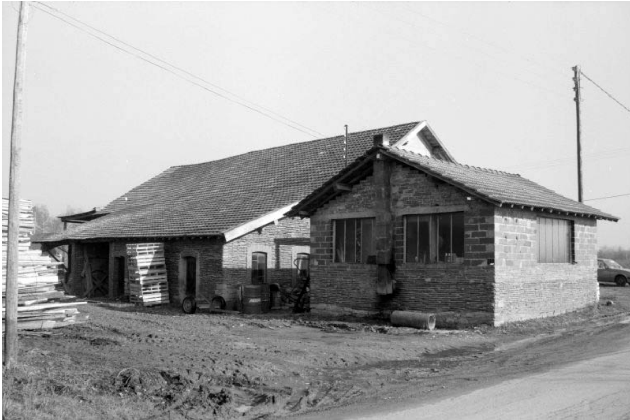
Bureau et atelier de fabrication, vus de l'ouest.