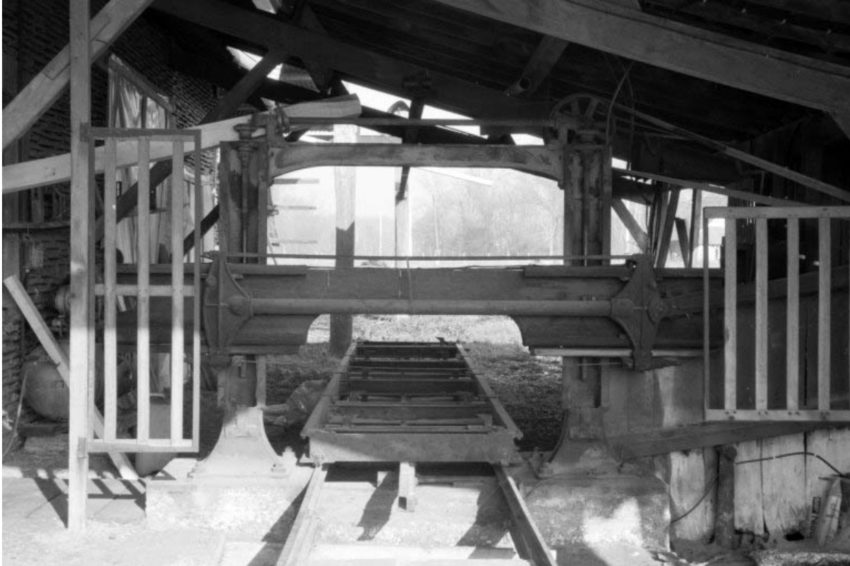
Scie "manchette" : châssis horizontal à lame unique. Le châssis est actionné par la bielle oblique à droite. 39, Commenailles, lieudit : l'Argillois