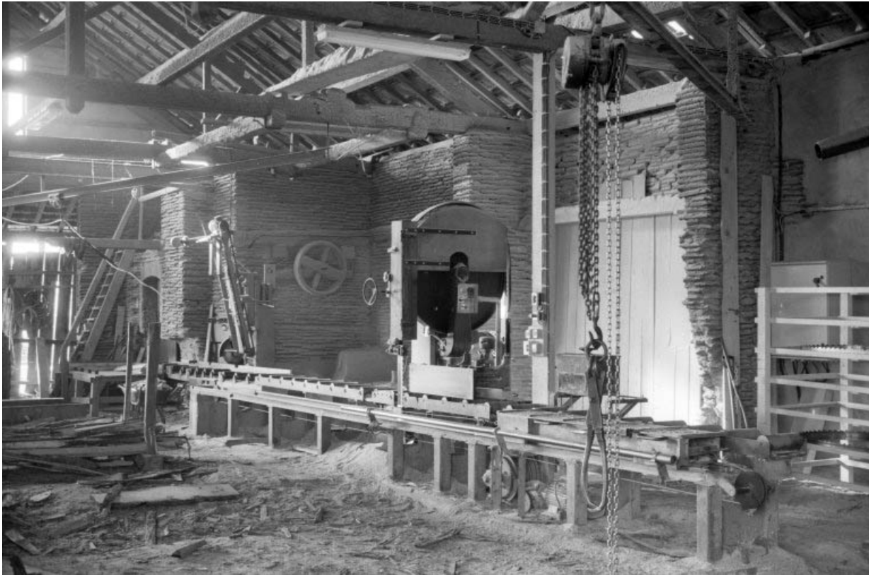
Intérieur de l'atelier de fabrication : scie Marcol.