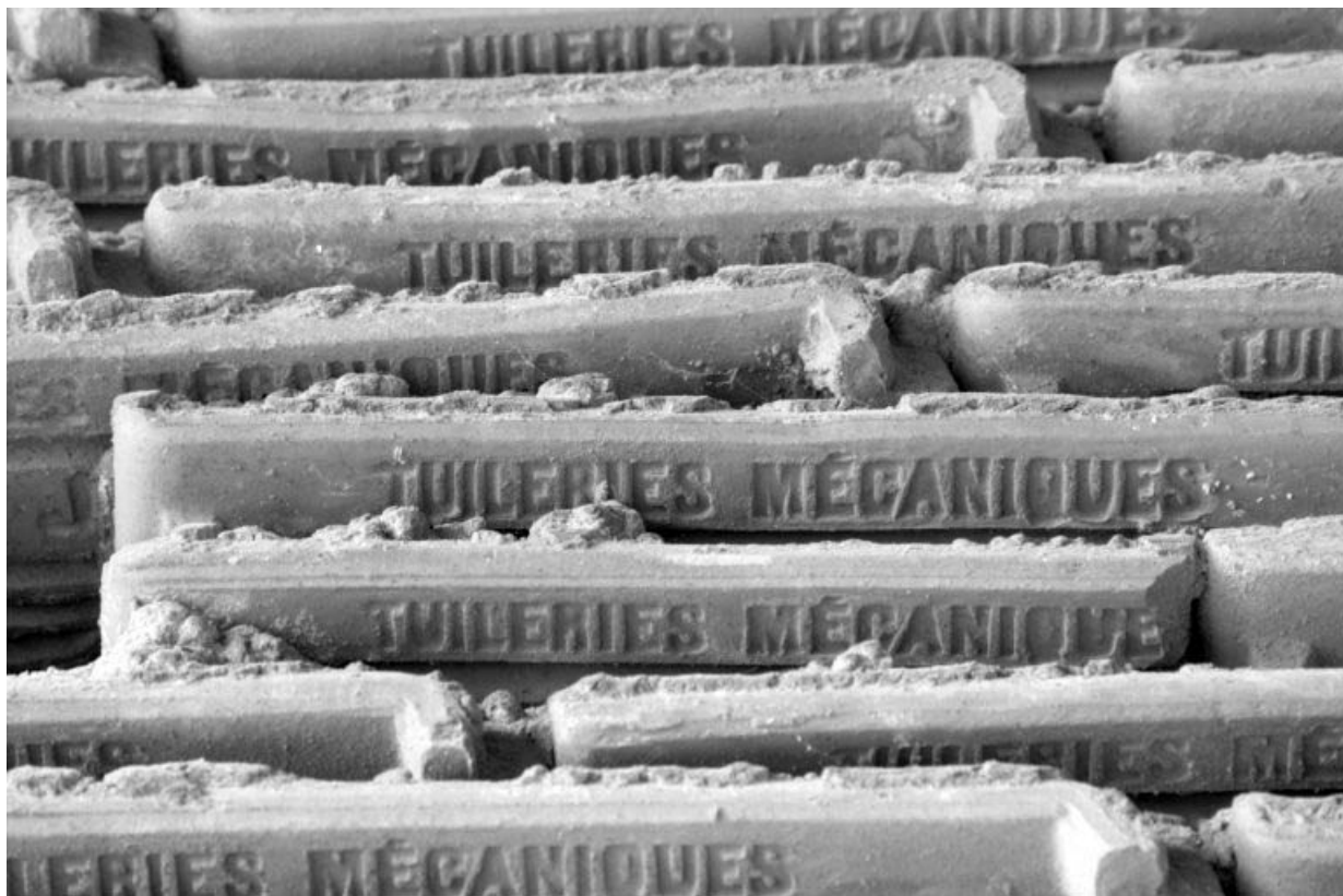
Détail de l'appareil de tuiles en gros-oeuvre.