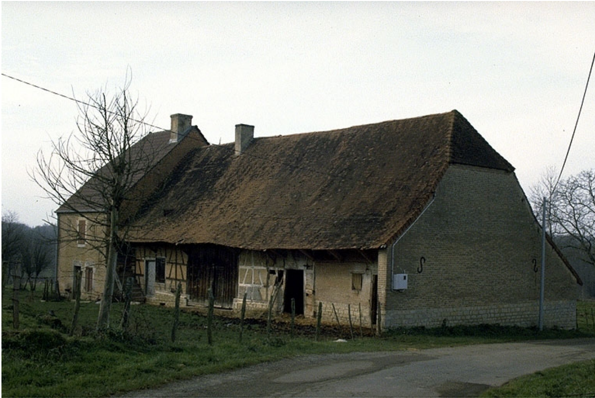
Etable et logement patronal, depuis l'est.