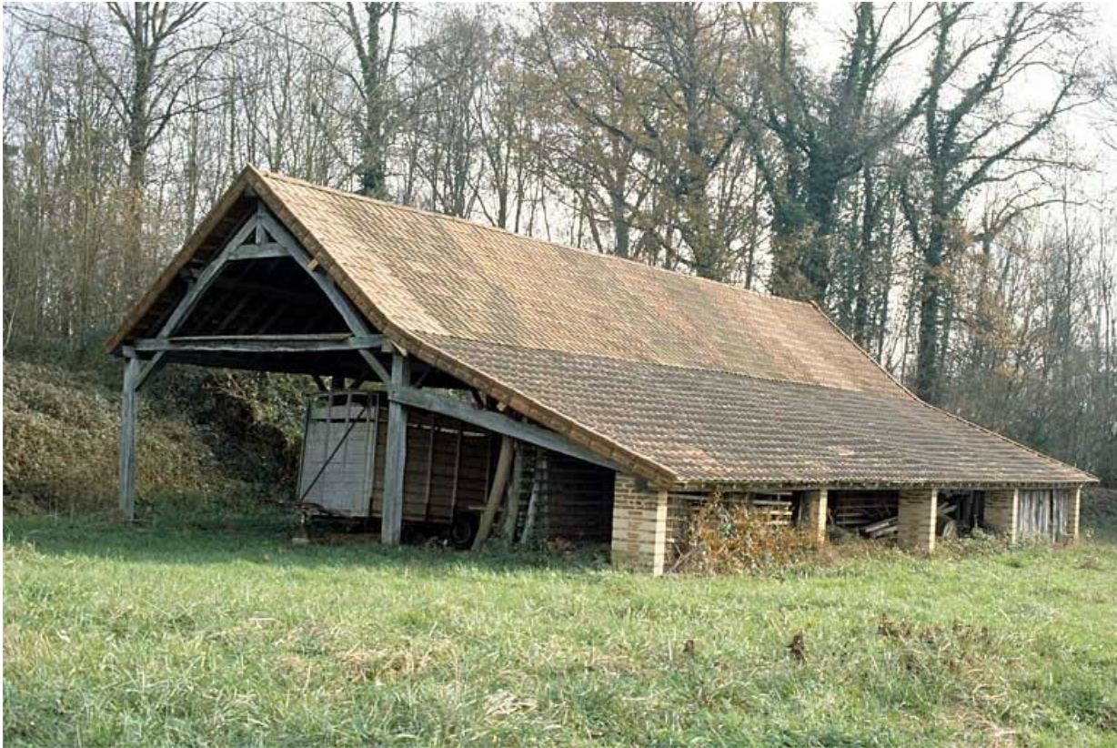
Atelier de fabrication et halle de séchage (E).