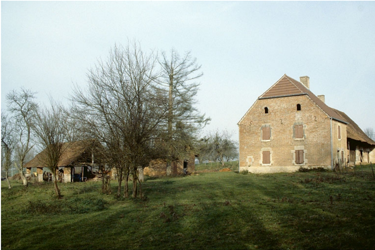
Vue d'ensemble, depuis le sud-est.