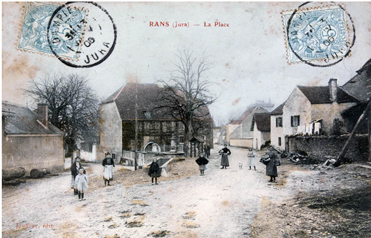
Rans (Jura) - La Place.