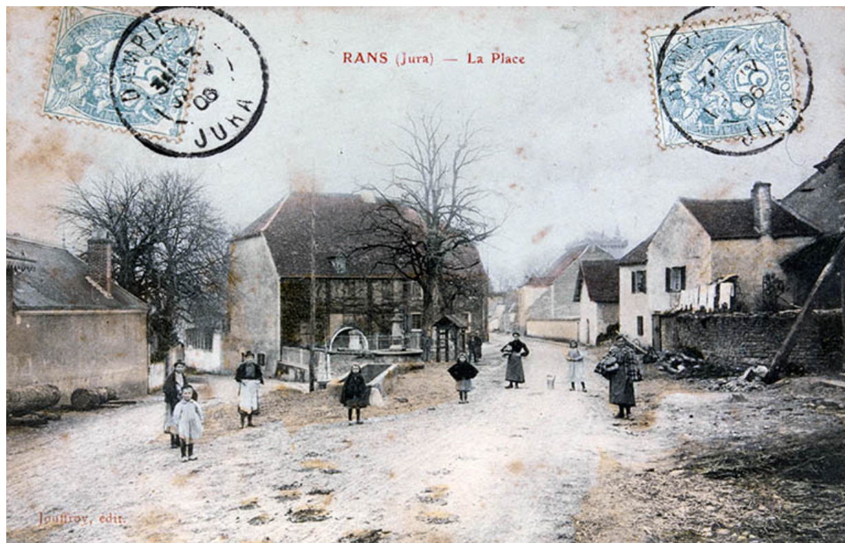
Rans (Jura) - La Place.