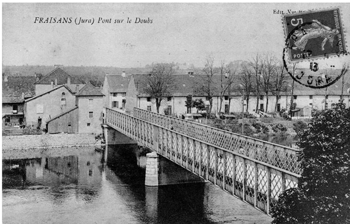
Fraisans (Jura). Pont sur le Doubs.