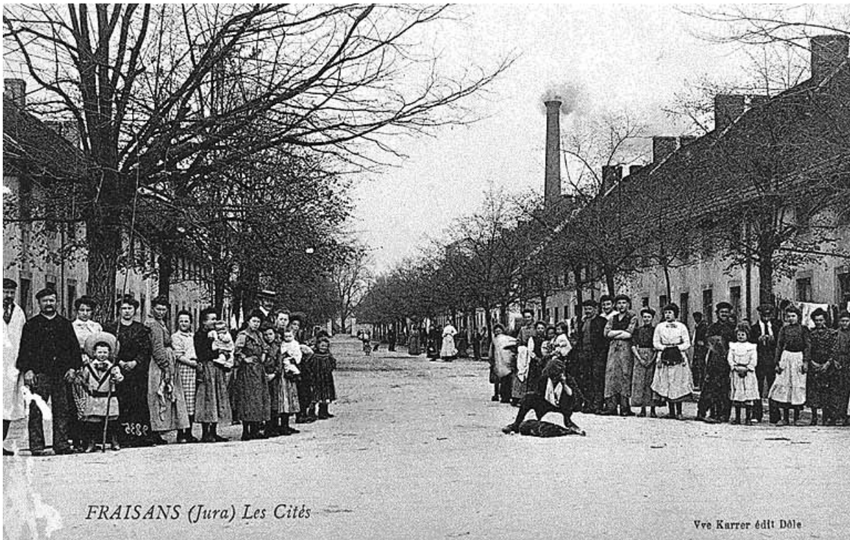
Fraisans (Jura). Les Cités.