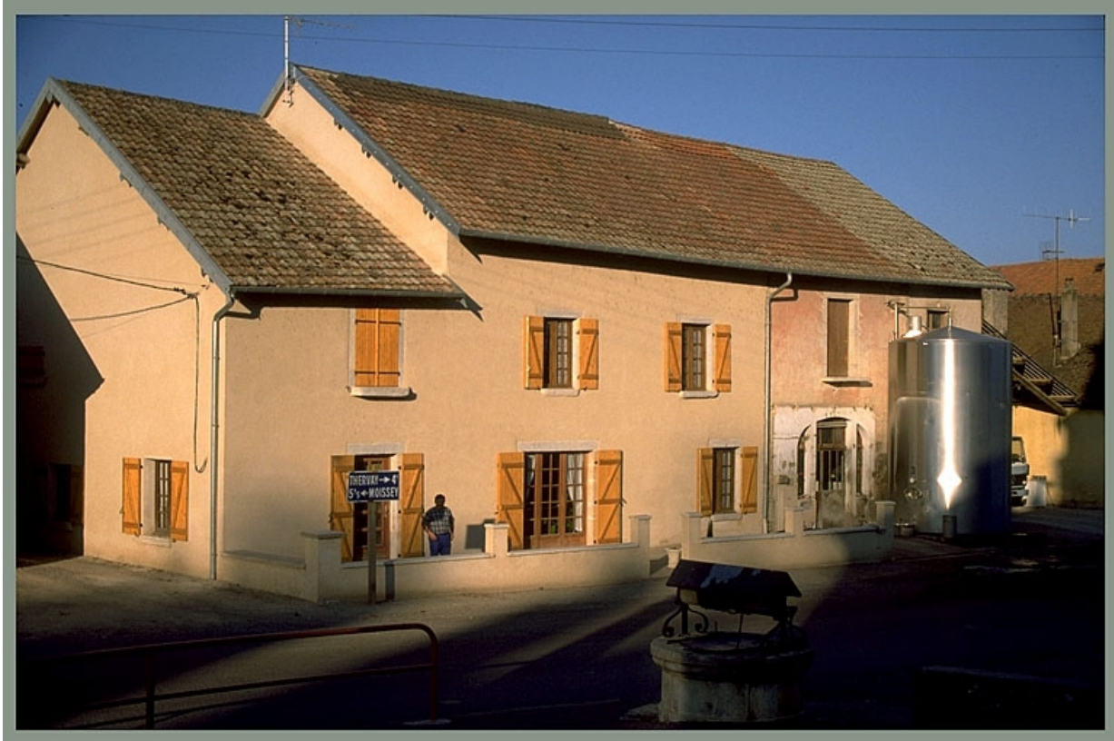
Façade antérieure vue de trois quarts gauche. 39, Brans