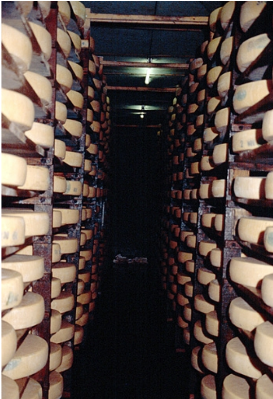
Intérieur d'une pièce d'affinage.