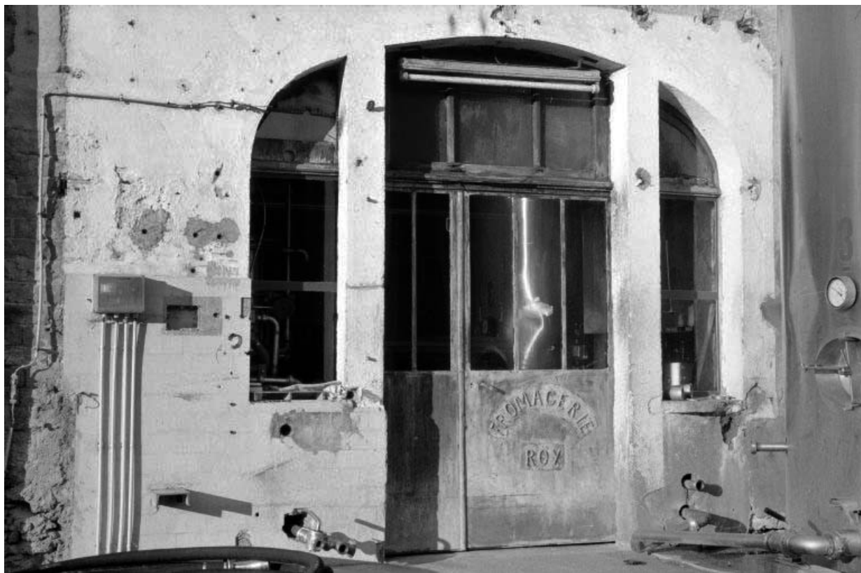
Porte d'entrée de l'atelier de fabrication.