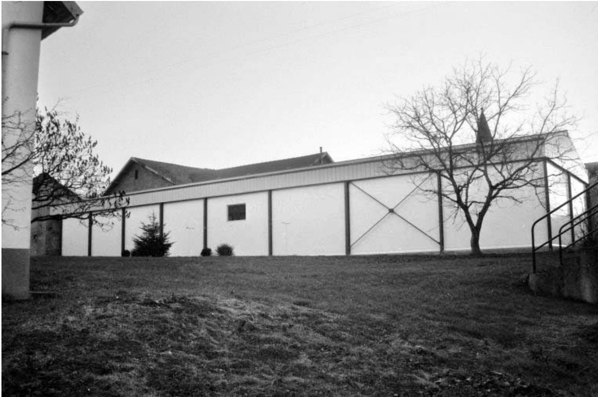
Cave d'affinage (E) vue du nord-est. 39, Brans