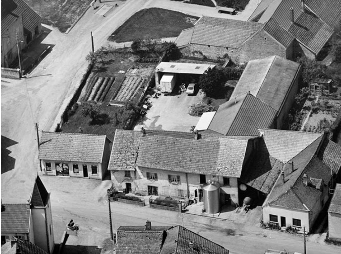
Vue d'ensemble depuis le sud (vue aérienne).