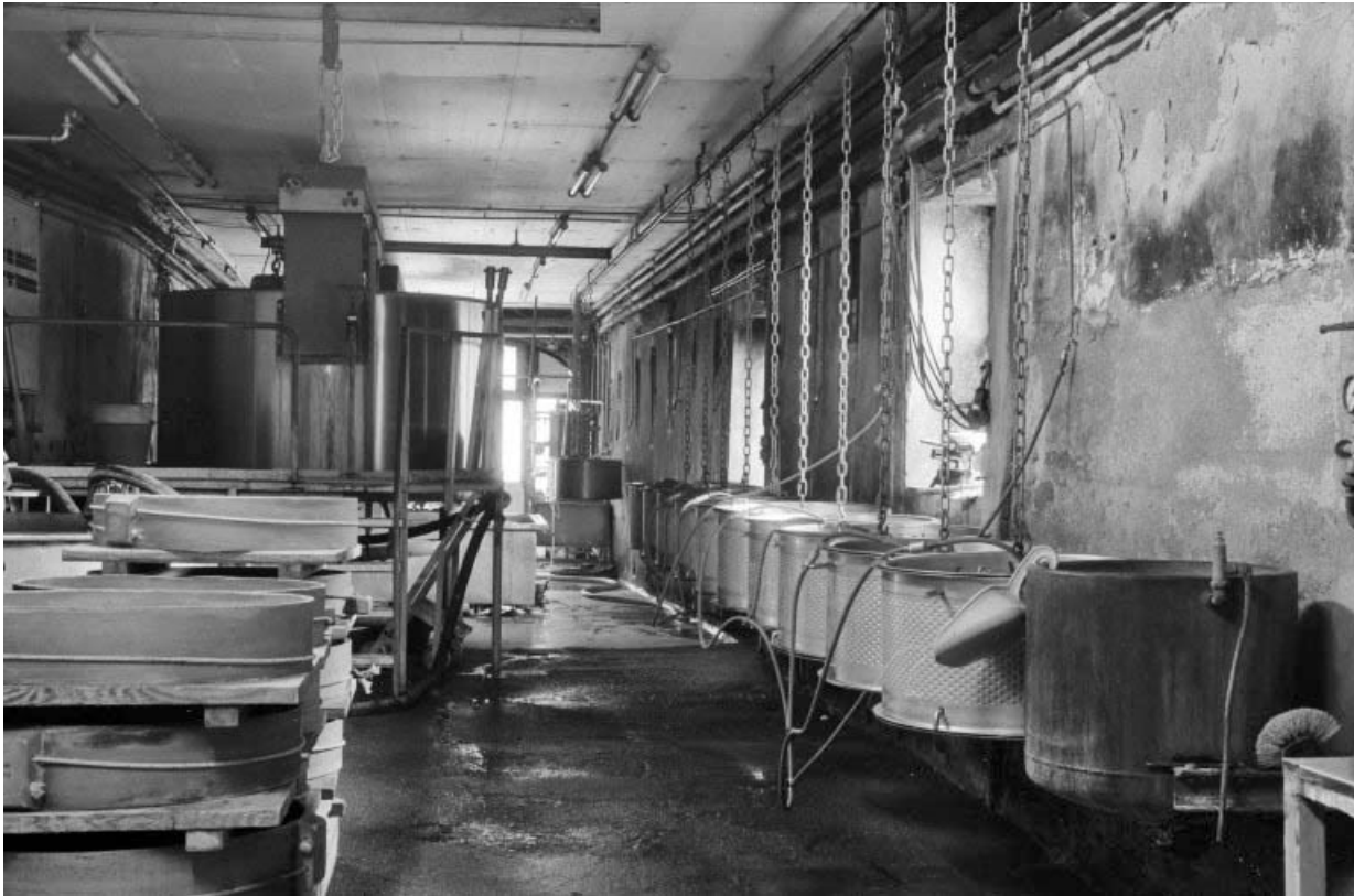
Intérieur de l'atelier de fabrication. A droite les presses hydrauliques, à gauche et au premier plan les cercles, en arrière-plan les 2 cuves multiples.