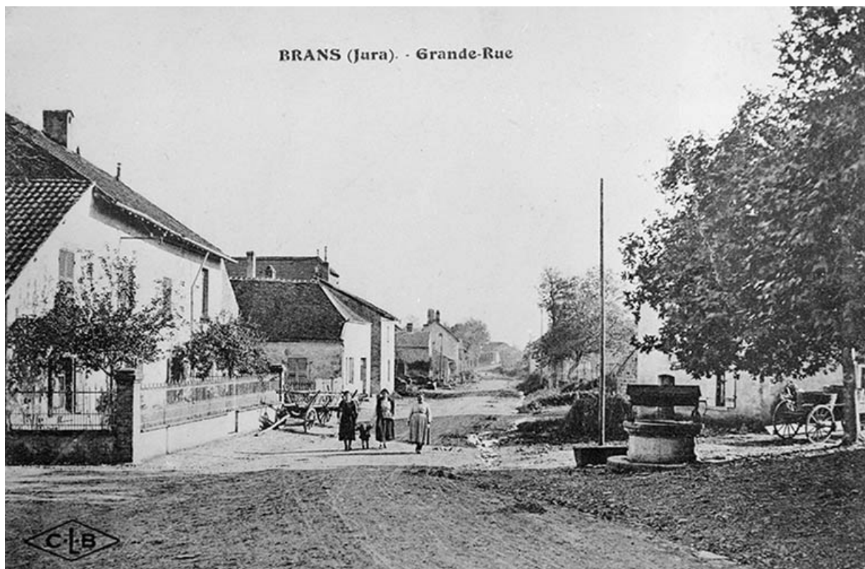
Brans (Jura). - Grande Rue.