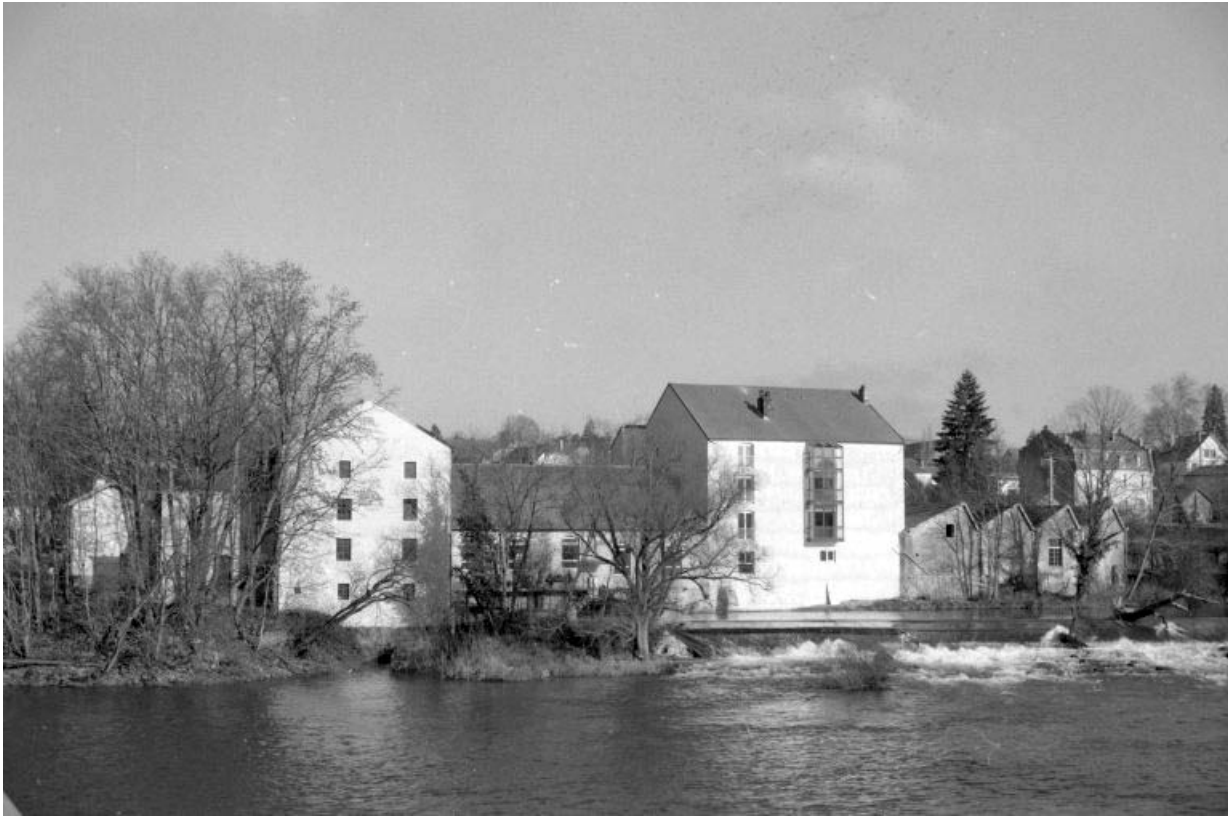
Vue d'ensemble depuis le sud, en 1990.