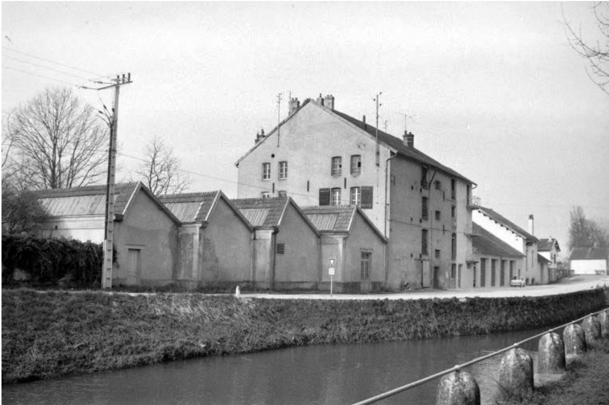
Façade antérieure vue de l'est.