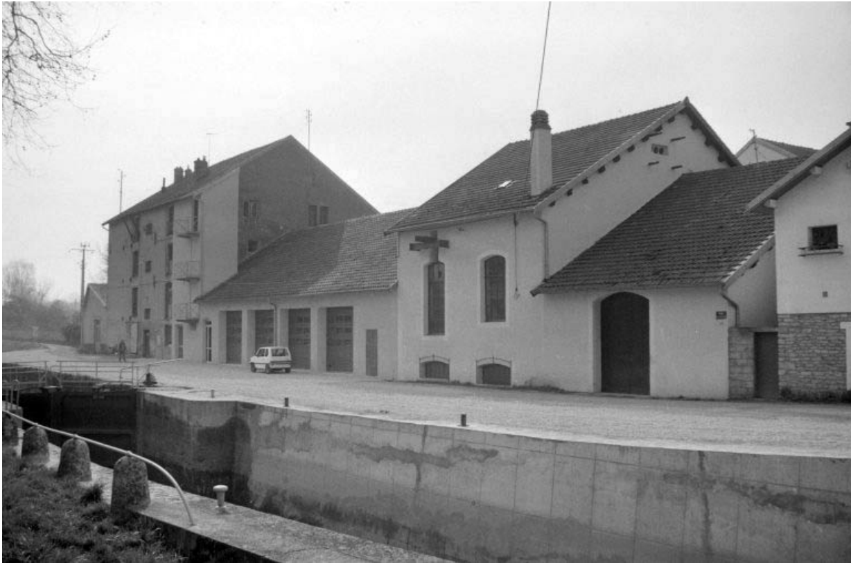
Façade antérieure vue de l'ouest.