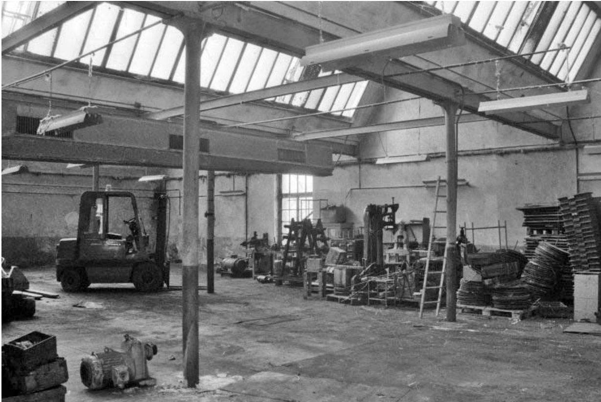
Vue intérieure des ateliers couverts en shed.