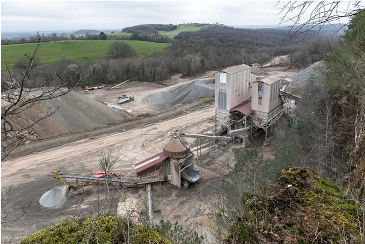
Vue d'ensemble plongeante sur les nouvelles installations de concassage.