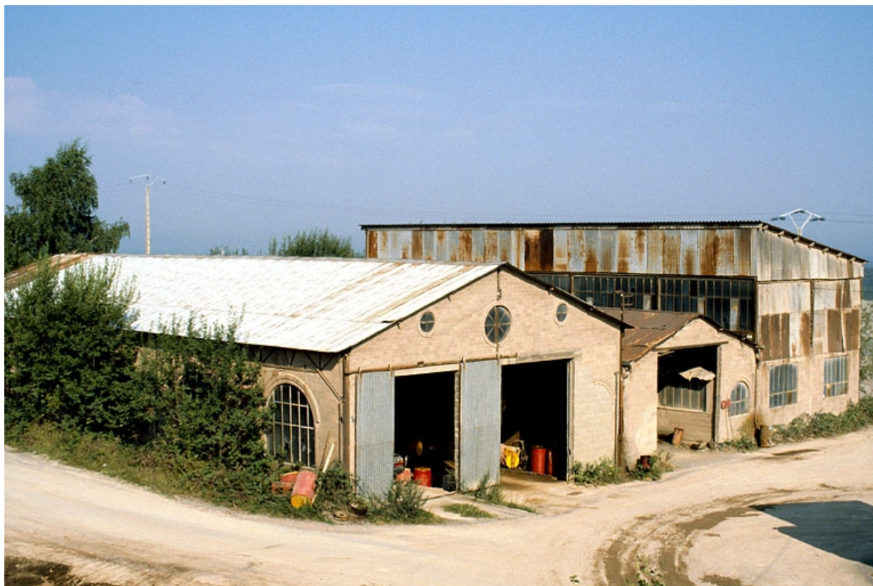
Hangar (G) vu du sud-est.